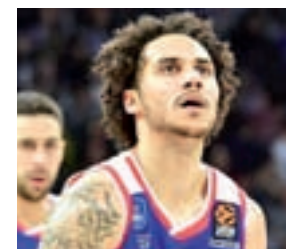
LARKIN - EFES PILSEN

Una obligación: Un presupuesto de infarto hace que el CSKA parta cada año en las quinielas de favoritos. Buscará la revancha con el Madrid.