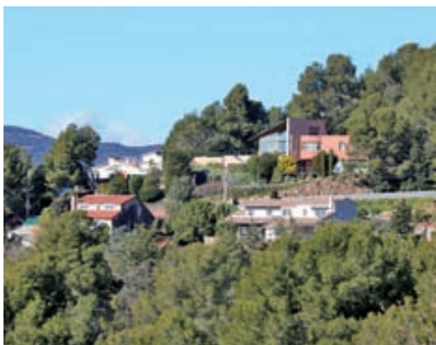
Matadepera s'ha sumat a la vigilància privada.

Els municipis es fixen en la vigilància privada per combatre la proliferació de furts en els habitatges ● Premià de Dalt redueix a la meitat el nombre d'incidents després de recuperar la figura del vigilant