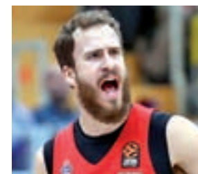
S. RODRÍGUEZ - CSKA MOSCÚ

Míster Euroliga: Su nombre es sinónimo de éxito. En 9 ocasiones, el técnico serbio ha sido campeón de Europa. A sus órdenes están estrellas como Vesely o Luigi Datome.