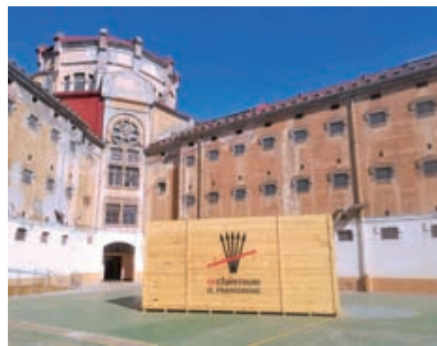
Actual pati de la Model.

Per començar en dos anys El total de l'espai ocupa 17.713 metres quadrats entre dues illes de l'Eixample compreses entre els carrers Entença, Provença, Rosselló i Nicaragua. L'objectiu és començar les obres el 2021.