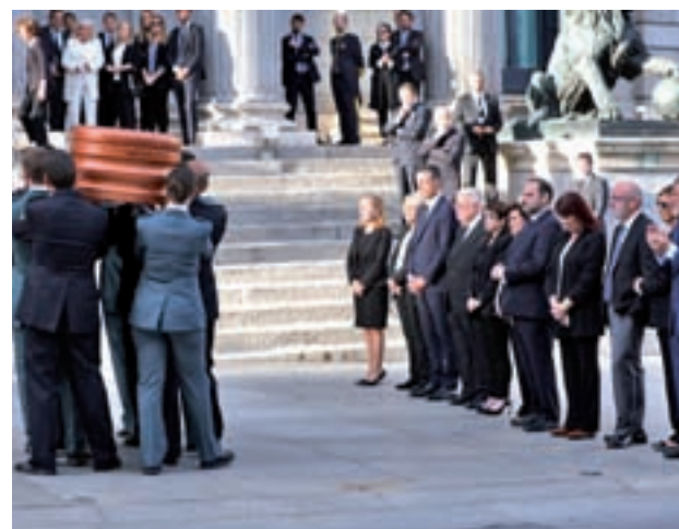
Un momento en la capilla ardiente en el Congreso

La misiva comienza con un agradecimiento directo al Hospital Puerta de Hierro de Majadahonda (Madrid) y a su personal, así como a los