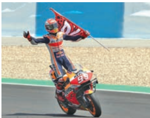
El piloto de Cervera, tras su triunfo en Jerez

Mans. El Gran Premio de Francia servirá para comprobar si el equipo Honda marca la pauta en el campeonato o, por el contrario, continúa la rebelión del galo Fabio Quartaro y el italiano Franco Morbidelli, integrantes del sorprendente Yamaha Petronas.