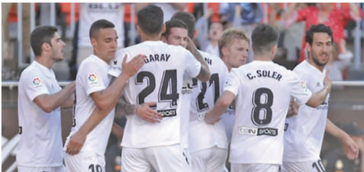
El Valencia aprovechó la derrota del Getafe en el Camp Nou para colocarse en la cuarta posición