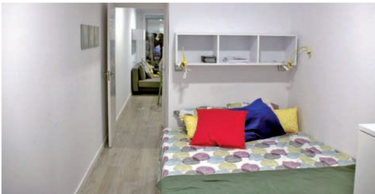
Una habitació dels mòduls prefabricats que l'Ajuntament de Barcelona instal·larà temporalment en solars.