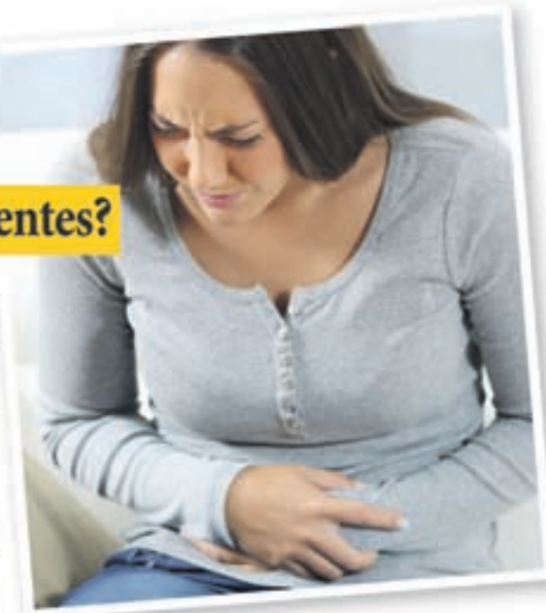
La imagen representa a una afectada

En un ensayo clínico se demostró: con la cepa de