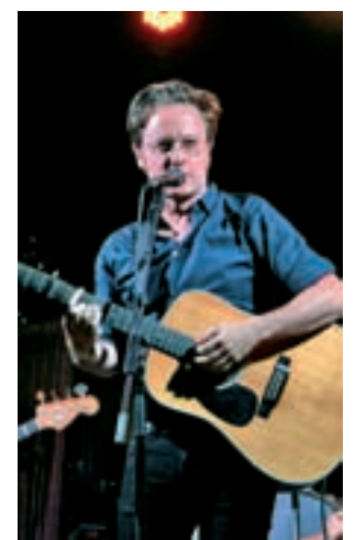
El cantant de Mishima.

que tindrà lloc el 19 de maig al Poble Espanyol. Altres noms d'aquesta edició del dia Minimúsica són Las Auténticas, i Marc Parrot & Eva Armisen. Es programaran en aquesta jornada activitats com un gran 'roller disco', tallers de DJ i altres propostes per a nens fins als 12 anys. El festival arrencarà de les 11h.