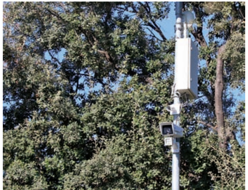
Una de les càmeres de videovigilància que hi ha a Matadepera.

Aquest cos d'agents treballa principalment en horari nocturn i l'objectiu és que puguin cobrir zones disseminades en les que és "difícil tenir vigilància propera i estàtica" a través de la Policia Local, com reclamen els veïns. Pre-