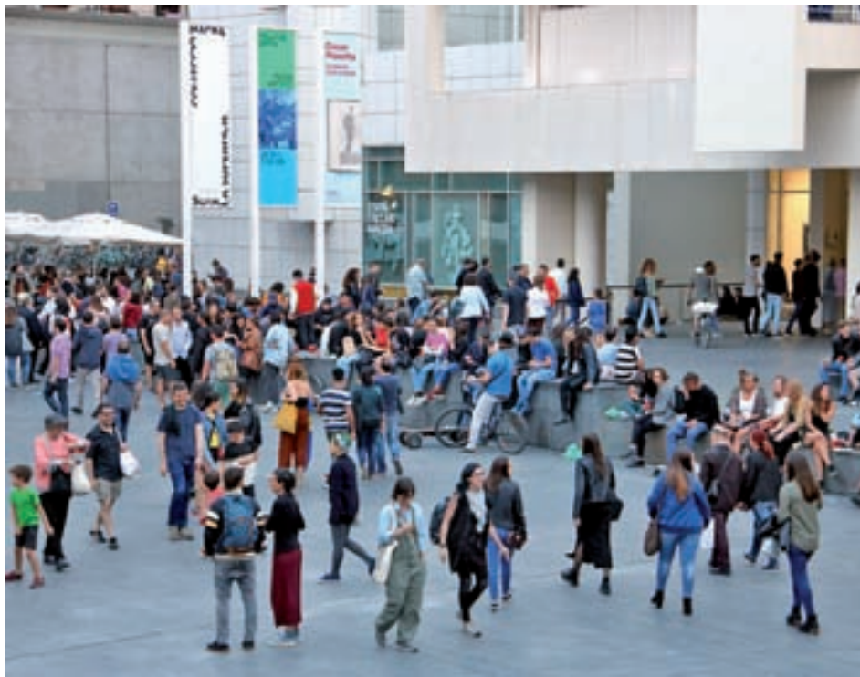
El MACBA al voltant de les nou del vespre a la Nit dels Museus del 2018.

A banda de les exposicions en curs, molts centres celebren l'efemèride amb activitats extra com recitals, 'perfor-