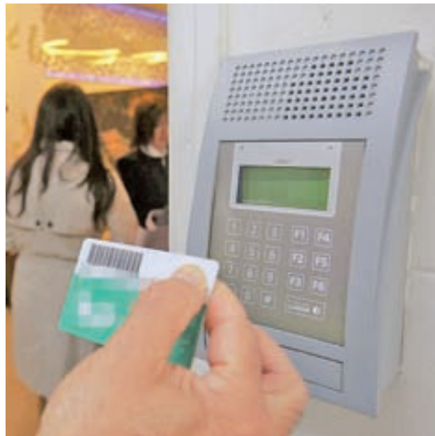
El registro es ya obligatorio

El objetivo de esta medida es medir la duración de las jornadas laborales y, por lo tanto, las horas extraordinarias, y también los descansos, que no pueden ser inferiores a doce horas entre final e inicio de jornada ni a 36 semanales, aunque con peculiaridades sobre su ubicación en el calendario según el sector de que se trate.