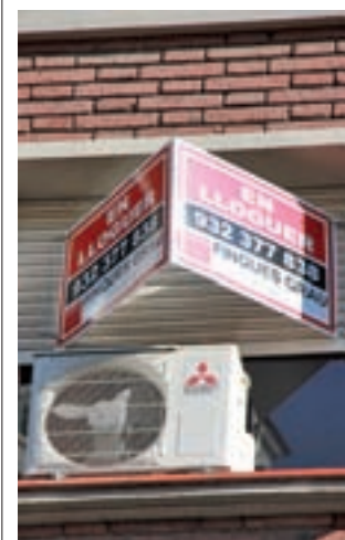
Pis en lloguer. ACN

Aquest tipus de construcció -que ja es pot trobar en ciutats om Londres, Copenhagen o Le Havre, entre d'altres- permet que es pugui canviar de lloc amb facilitat. La primera obra començarà a finals de juny a Ciutat Vella i els habitatges estan enllestits en uns dos mesos. Concretament, seran en total 12 habitatges.