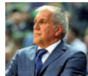
OBRADOVIC - FENERBAHÇE

Míster Euroliga: Su nombre es sinónimo de éxito. En 9 ocasiones, el técnico serbio ha sido campeón de Europa. A sus órdenes están estrellas como Vesely o Luigi Datome.