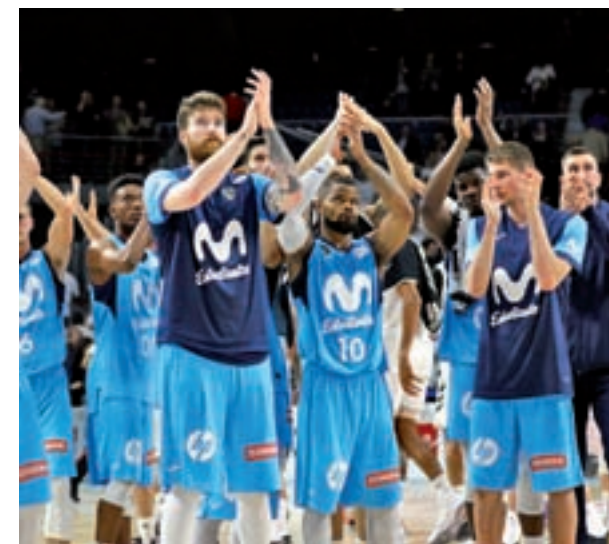
El Estudiantes se la juega con un rival directo

En esa zona noble de la clasificación, los otros dos candidatos han visto aplazados sus compromisos por cuestiones obvias. Así, el Real Madrid recibirá a Valencia Basket el martes 21 (21 horas) en el WiZink Center de la capital, mientras que el Kirolbet Baskonia tendrá que esperar hasta el miércoles 22 (20:30 horas) para medirse con el Divina Seguros Joventut.