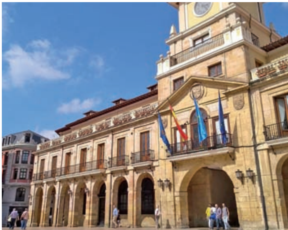
La capital asturiana registra el mejor índice

La situación geográfica y el clima pueden ayudar a la limpieza de las ciudades. Así, las localidades situadas en el noroeste tienen un índice de satisfacción superior. Pese a ello hay sonoras excepciones, como es el caso de La Coruña y Lugo. El mayor número de papeleras o los diferentes medios empleados no tienen tampoco una correlación directa con la satisfacción de sus vecinos. Tampoco el presupuesto empleado, que va desde los 32 euros por habitante de Gijón (68) a los 106 euros de Barcelona (51).