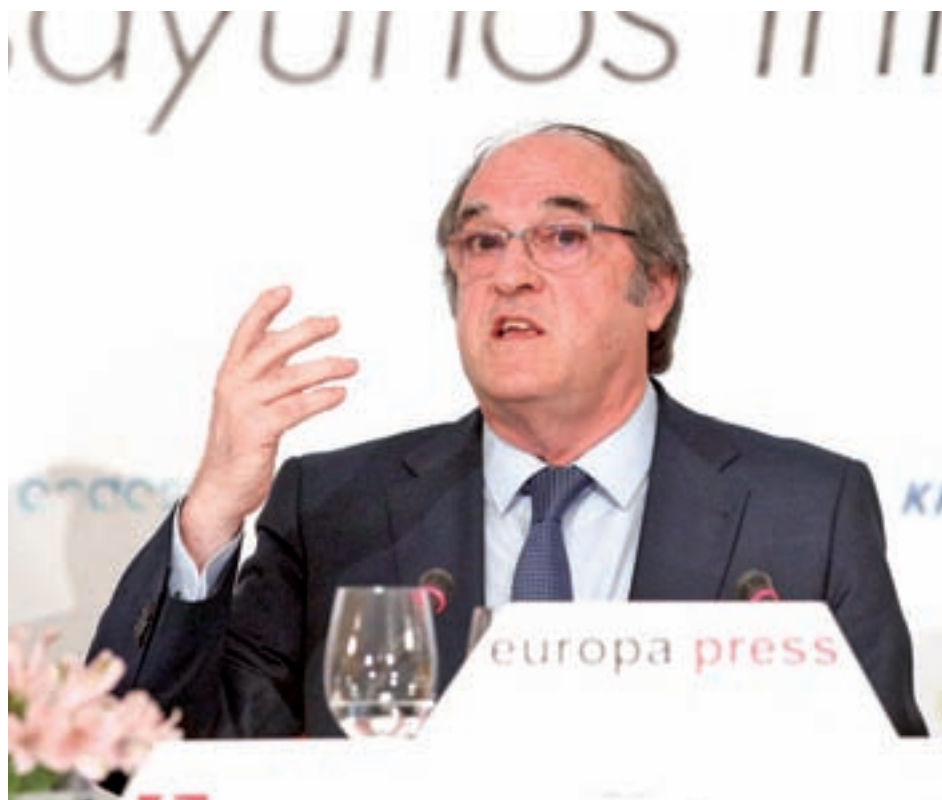
Ángel Gabilondo puede arrebatárselo el Gobierno de la Comunidad de Madrid al PP tras 24 años

El CIS apunta una victoria socialista en la Comunidad de Madrid, donde Ángel Gabilondo (33-38 escaños) podría gobernar con la suma de los votos de Más Madrid (16 y 18) y de Unidas Podemos (17-19), terminando así con 24 años de gobiernos de los populares.