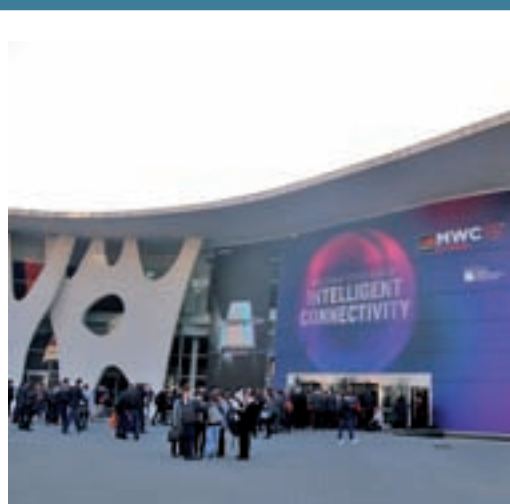
L'entrada al MWC 2019

EL PERIÓDICO GENTE NO SE RESPONSABILIZA NI SE IDENTIFICA CON LAS OPINIONES QUE SUS LECTORES Y COLABORADORES EXPONGAN EN SUS CARTAS Y ARTÍCULOS