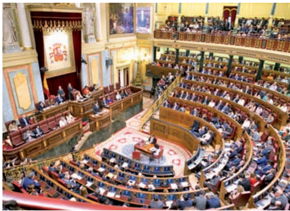
Imagen del hemiciclo en la pasada legislatura

Desde Interior no dieron un plazo concreto para hacer efectiva la sustitución de las concertinas, si bien matizaron que una de las medidas que se llevarán a cabo antes, concretamente el sistema de reconocimiento facial, "estará ejecutada en verano". Así las cosas, la retirada se demorará, al menos, hasta después del verano.