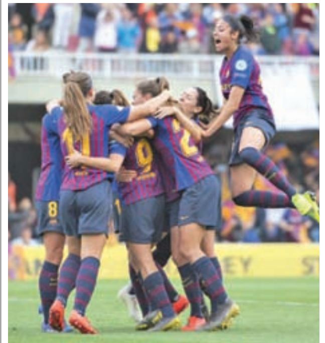
El Barça apeó en semifinales al Bayern

disputa la final del máximo torneo continental y, además, lo hace tras dejar en la cuneta a un conjunto del poderío del Bayern Munich. Sin embargo, la cita de este sábado se presenta como el más difícil todavía para las azulgranas, ya que enfrente estará el vigente campeón y gran dominador histórico de la competición, el Olympique de Lyon, con cinco títulos en su palmarés, de los cuales los tres últimos llegaron en las tres ediciones anteriores.