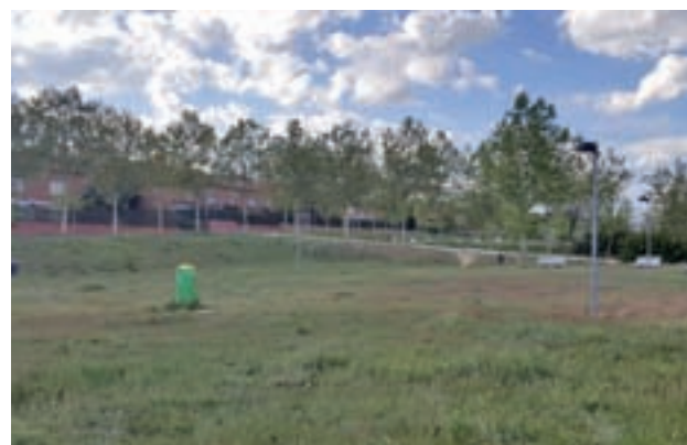
Terreno donde estaba previsto construir las pistas

La propuesta llegó a la sesión plenaria a través de una moción conjunta presentada por PSOE, Ganemos y Ciu-