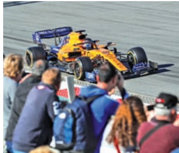
Sainz durante uno de los test de pretemporada en Barcelona

Desde la salida de Valencia del calendario, Barcelona se quedó como la única parada del Mundial de Fórmula 1 en nuestro país. Por eso, miles de aficionados tienen marcada en rojo la fecha del Gran Premio de España, una prueba que se celebra este fin de semana en Montmeló y en la que la colorida grada se quedó huérfana de uno de sus