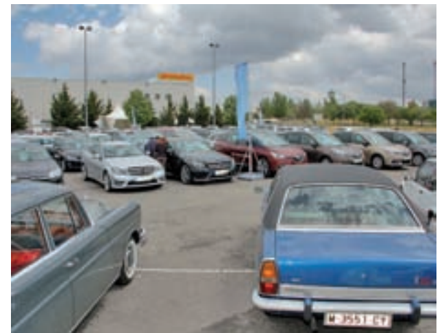
Zona de exhibición de coches

La feria tiene un horario ininterrumpido, de 11 a 20 horas. Entre medias, además de poder ver la exhibición de coches en venta, el público podrá ver vehículos clásicos, participar en clases abiertas y solidarias de zumba y 'body combat', y asistir al concierto de Miriam Fernández.