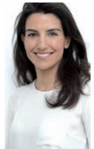
Rocío Monasterio VOX

drid. El partido liderado por Pablo Iglesias ha elegido a Isabel Serra para encabezar una candidatura que tendría que haber liderado Íñigo Errejón, número uno de Más Madrid. La decisión de este último de unirse a Manuela Car-