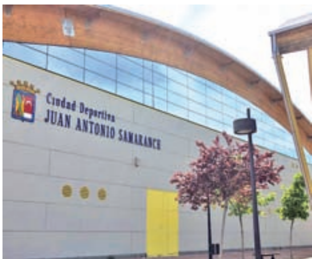
Ciudad Deportiva Juan Antonio Samaranch