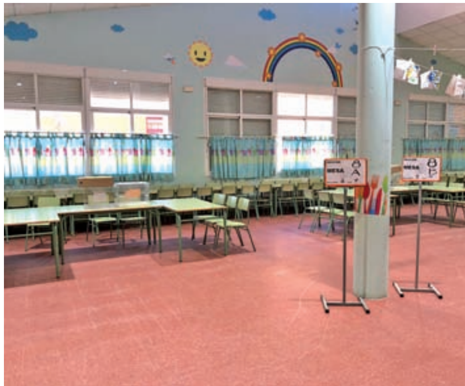
Un colegio electoral de Colmenar Viejo

El mayor desplome es el del PP, que pasa del primer al tercer puesto, con un total del 17,6% de los votos frente al 38,28% que tuvo en 2016. Unidas Podemos es el otro gran perjudicado de las elecciones,