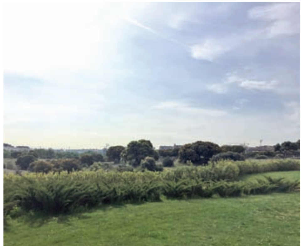
La zona Norte de Tres Cantos

El espacio tendría también con un edificio de 5.500 metros cuadrados para distintos deportes de pelota, con lo que sumaría más de 30.000 metros cuadrados. En ellos también albergará salas multifuncionales, vestuarios, aseos y dependencias para asociaciones deportivas, además de una terraza al aire libre y un aparcamiento sombreado con arbolado, de acuerdo con el proyecto que ha presenta-