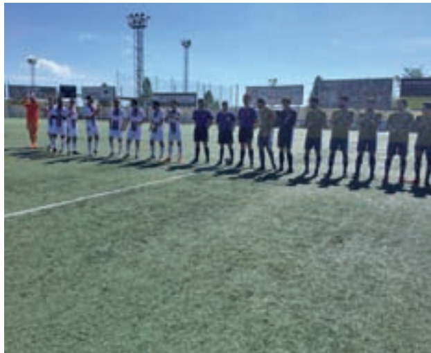
Encuentro frente al San Agustín del Guadalix

El Tres Cantos competirá este domingo 12 de mayo a las 12:30 horas contra el Alcorcón B, en el que será el penúltimo encuentro de la temporada, y en el que los tricantinos jugarán como visitantes. Los del Norte de Madrid saben desde