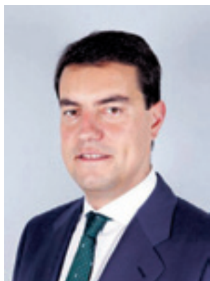
Ángel Ibáñez, presidente de las Cortes de Castilla y León y de la Fundación Villalar Castilla y León.

Con la aprobación del Estatuto de Autonomía, del que hemos celebrado su 36º aniversario, pudimos definir la construcción de nuestro territorio a través de un modelo de convivencia que nos ha permitido tejer la identidad de