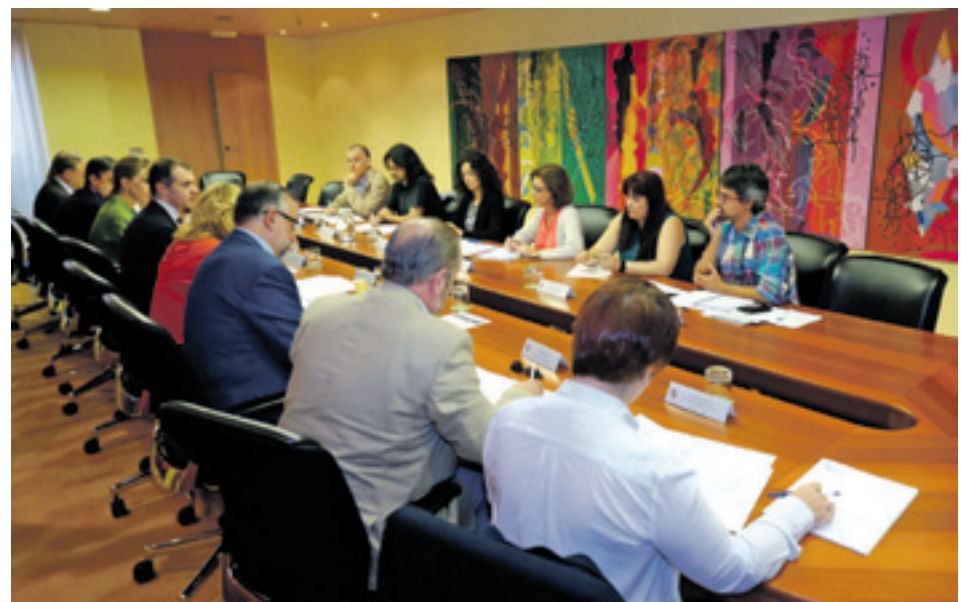
Una comisión de Las Cortes, en concreto la de Cooperación Internacional para el Desarrollo.