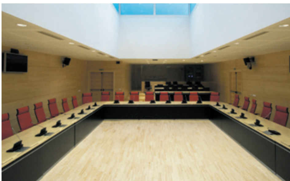
Ermita del siglo XIII de estilo mudéjar, de la Virgen del Puente en Sahagún, provincia de León.