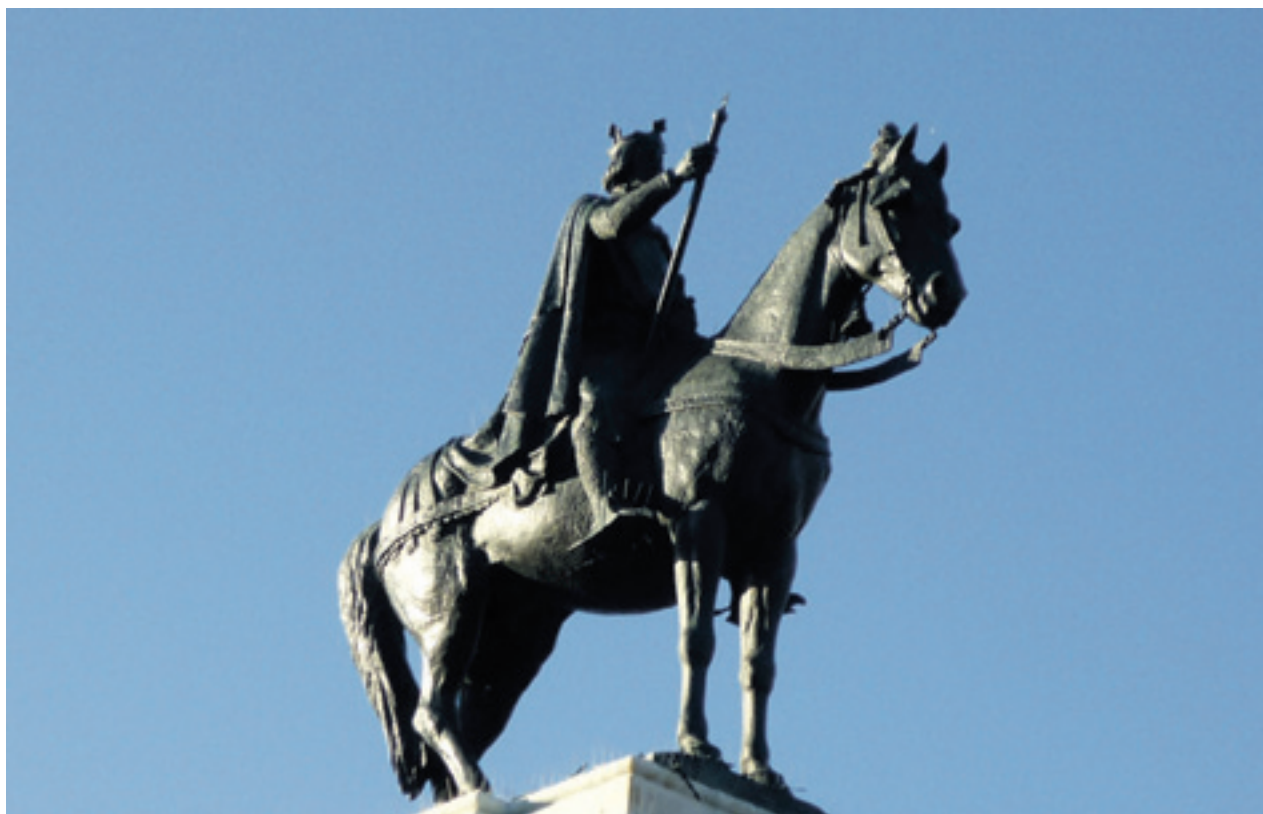
Monumento dedicado a Fernando III de Castilla, conquistador de Sevilla en 1248 y declarado santo por la Iglesia católica.

vistas se encuentra la celebración de un concierto de música tradicional castellana que servirá como colofón a una serie de actividades en las que aún se está trabajando.