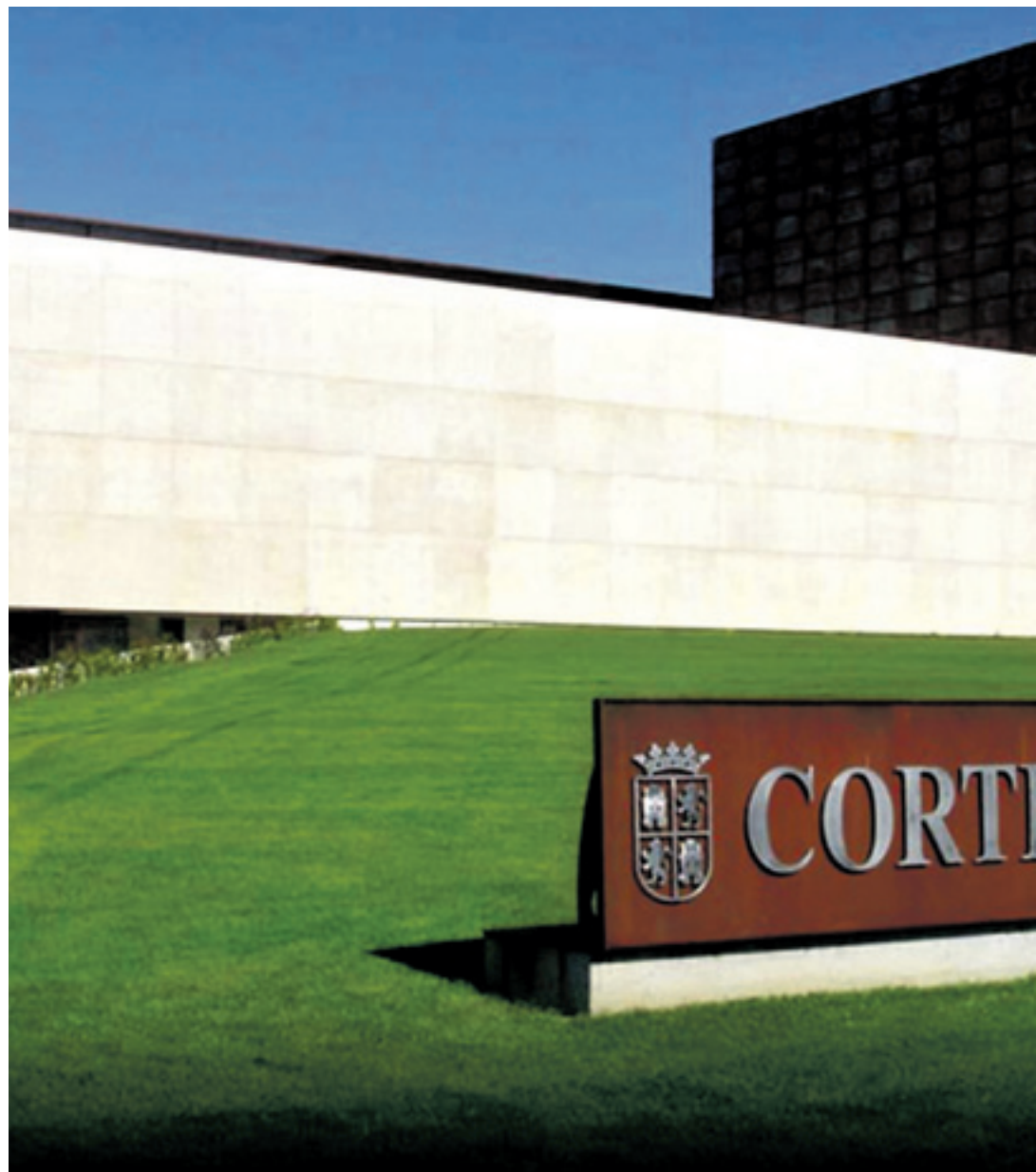
El edificio que acoge las Cortes de Castilla y León en Valladolid está concebido como una caja transparente, singular.

"EL PARLAMENTO REGIONAL ES LA MÁXIMA EXPRESIÓN DE LA PLURALIDAD POLÍTICA"