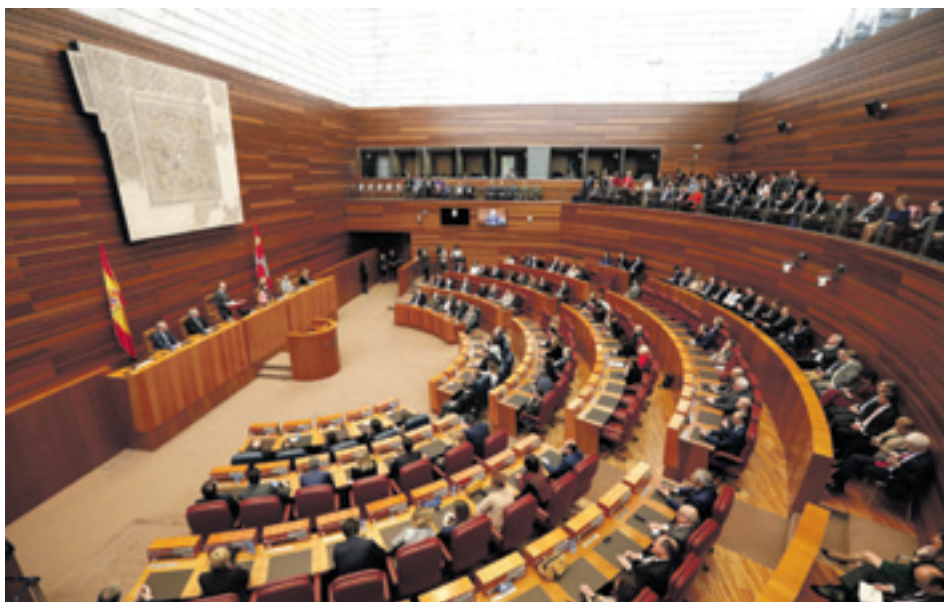
Pleno de las Cortes de Castilla y León.

Están encargados de dirigir e impulsar la vida interna del Parlamento, organizando sus trabajos y gestionando los recursos personales y materiales de la institución.