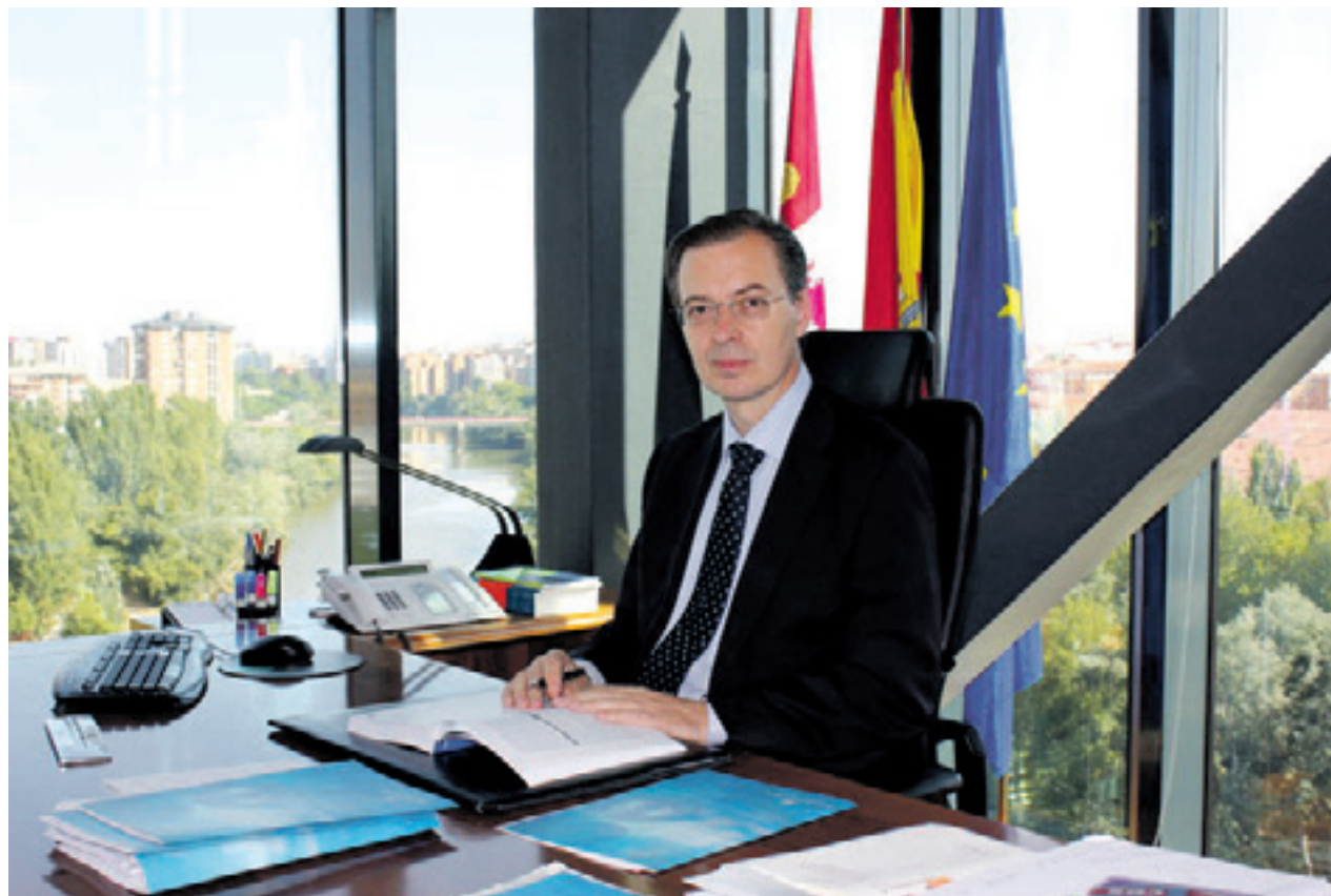
Germán Barrios García es el Presidente del Consejo Económico y Social de Castilla y León.

Asimismo, se encuentra en sus cometidos el de canalizar las demandas y propuestas de lo que se denomina la "sociedad civil organizada", fomentando la participación de organizaciones sociales que no forman parte del Con-