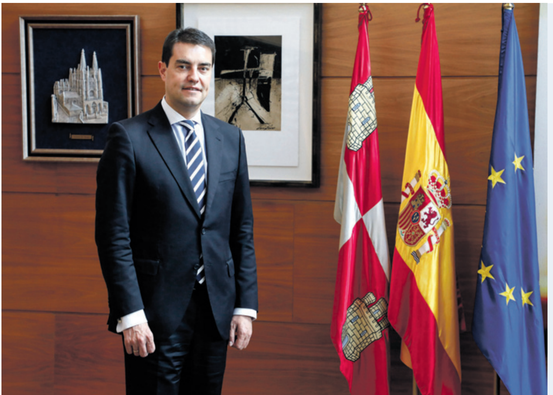
Ángel Ibáñez es el presidente de las Cortes de Castilla y León y de la Fundación Villalar Castilla y León.