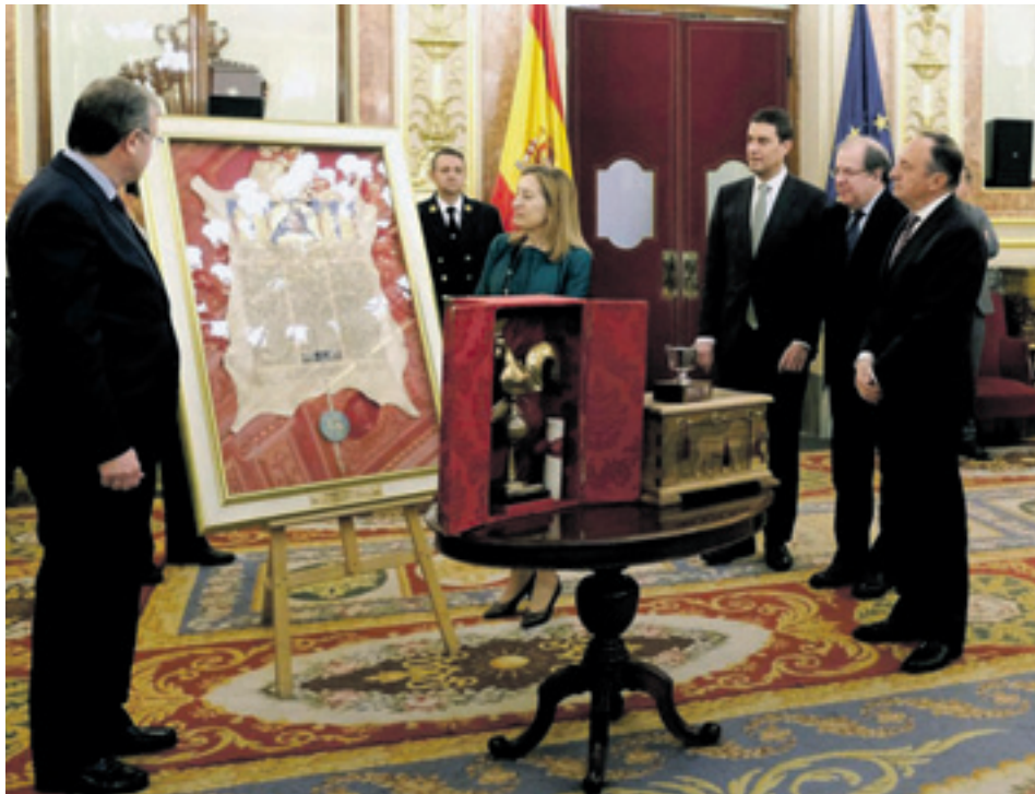
El presidente de las Cortes, Ángel Ibáñez, en un momento del acto homenaje a León, Cuna del Parlamentarismo, en el Congreso de los Diputados.

Ángel Ibáñez, además, tuvo la oportunidad de participar activamente en este reconocimiento a los Decreta, enmarcado dentro de los actos organizados con motivo del 40º aniversario de la Constitución Española, dando lectura al tercer de los Decreta, tras la presidenta del Congreso de los Diputados, Ana Pastor; y el vice-