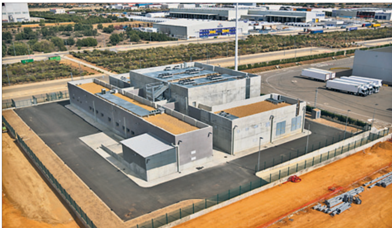
Vista Vista aérea de las instalaciones del Centro de Proceso de Datos en la localidad leonesa de Villadangos del Páramo.

Además, a lo largo del 2018, la compañía ha creado 354 nuevos puestos de trabajo elevando su plantilla en Castilla y León a 3.993 personas, lo que refuerza a Mercadona como uno de los referentes en la creación de empleo estable y de calidad en la comunidad. Esta apuesta se ha visto refrendada con la firma, a finales de 2018, del nuevo Convenio Colectivo de Empresa y Plan de Igualdad 2019-2023, lo que ha contribuido a proporcionar un marco laboral, más igualitario y social y que consolida su apuesta por mejorar el poder adquisitivo de la plantilla con un sueldo mínimo de 1.328 euros al mes brutos, a los que se suman, además de la prima por objetivos, otros complementos propios de la Política Retributiva de la compañía que suponen incrementos de un 11% anual hasta el tramo 5, que se alcanza tras cuatro años en la empresa, y un incremento progresivo del salario base vinculado al IPC y a la productividad.