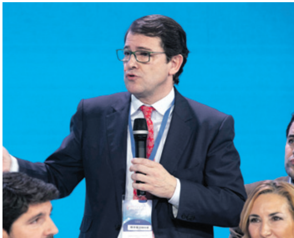
Alfonso Fernández Mañueco es el candidato del PP a la Presidencia de la Junta de Castilla y León.

Asimismo, apuntó que la Junta aporta anualmente 12 millones al Ayuntamiento de Soria y 4,5 a la Diputación para los distintos programas de ayuda a domicilio y teleasistencia. El candidato trasladó el "compromiso del PP" de "mantener e incrementar" todo lo necesario para las per-