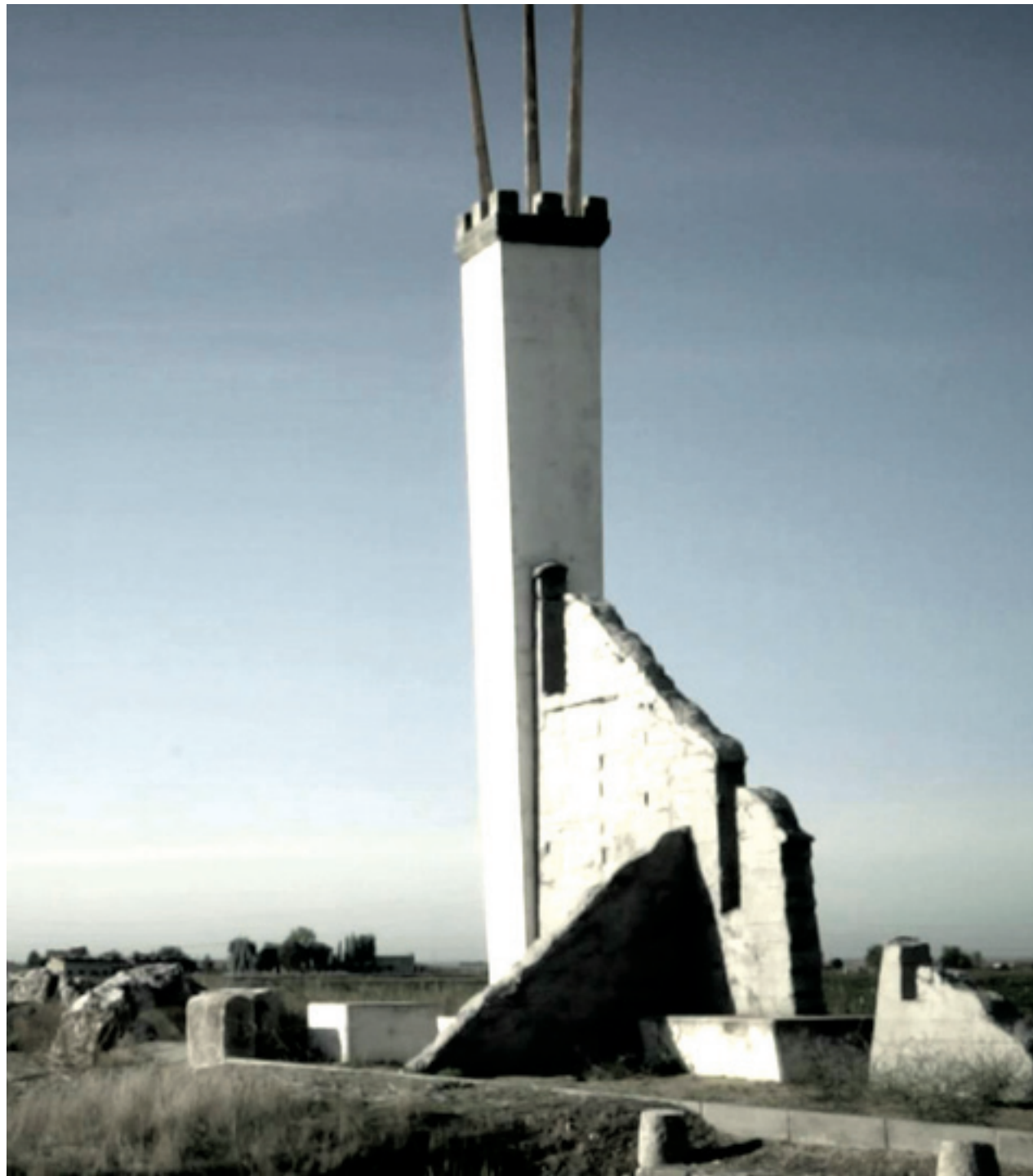
Puente El Fierro, declarado Bien de Interés Cultural con categoría de sitio histórico desde 1996.

A partir de ese momento, el joven rey comenzó a ser objeto de burlas. De hecho, y según se afirma en documentos de la época recogidos por Berzal, de él se decía que tenía «una mandíbula muy pro-