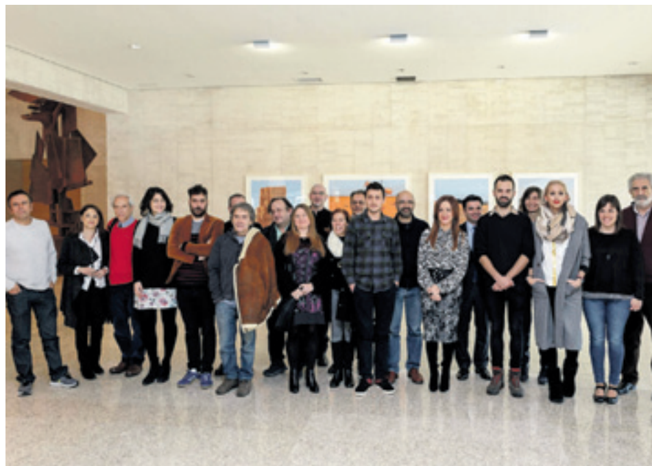
Becas de la Fundación.