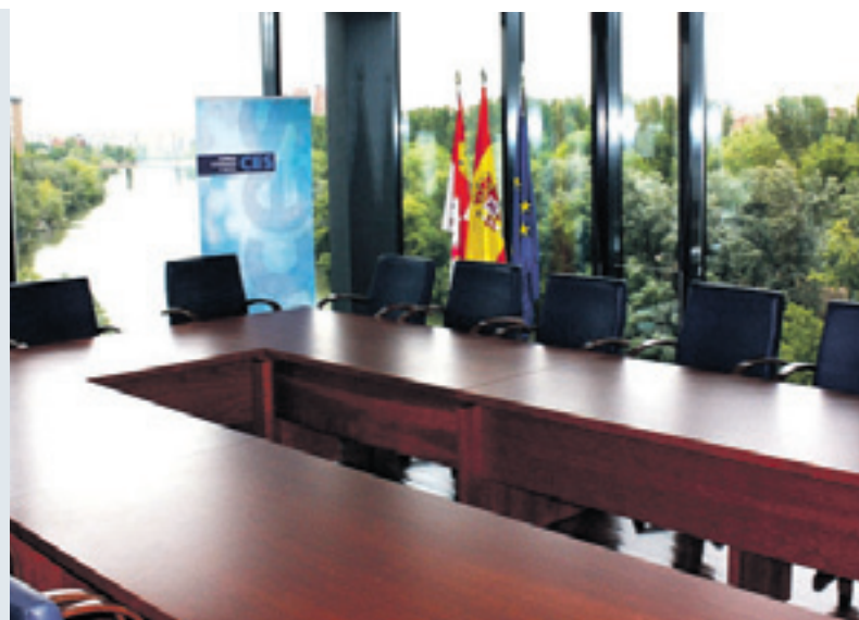
El CES está situado en la Av. de Salamanca, nº 51 de Valladolid.

ELABORAR: dictámenes e informes en cualquier clases de asuntos de carácter socioeconómico por iniciativa propia, a