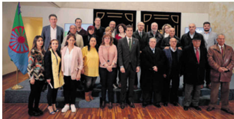
Imagen del Día Internacional del Pueblo Gitano en las Cortes de Castilla y León.

El presidente de las Cortes, Ángel Ibáñez, destacó la función del Parlamento regional como punto de encuentro de las diferentes sensibilidades y realidades sociales para dar voz al Pueblo Gitano