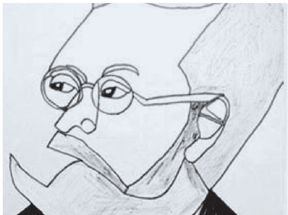
Dibujo de Miguel de Unamuno.