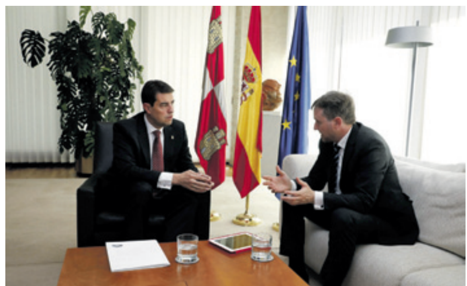
Foto recepción del presidente de las Cortes, Ángel Ibáñez, al alcalde de Burgos, Javier Lacalle.