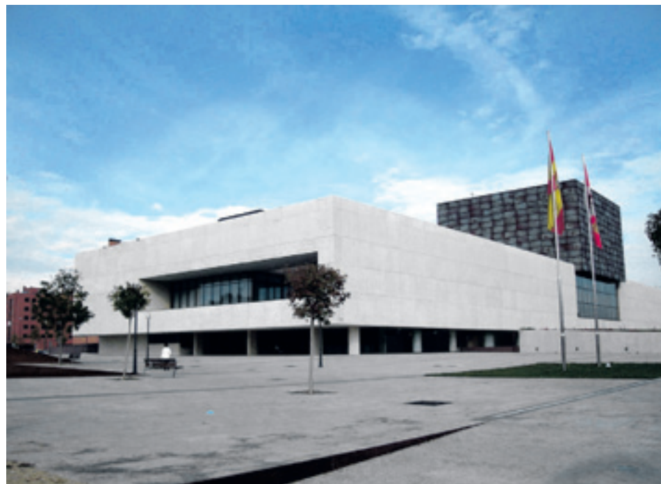
Exterior de la Fundación Villalar Castilla y León en la plaza de Cortes de Castilla y León.