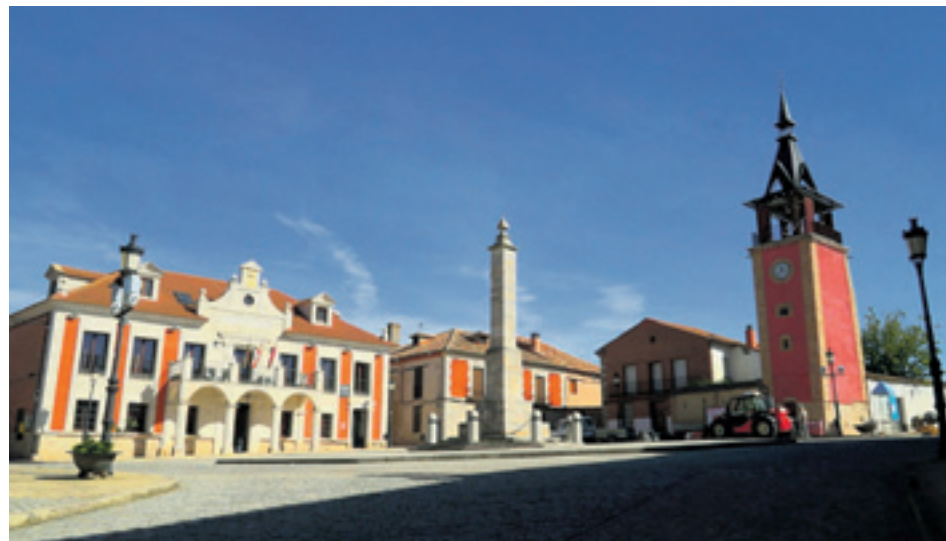
Obelisco construido en 1889 por el Ayuntamiento en el lugar de ajusticiamiento de los comuneros.