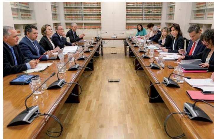
Reunión de la sociedad Logroño Integración del Ferrocarril 2002, el día 29.