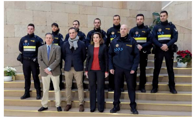
En enero se produjo la última incorporación de agentes en la Policía Local de Logroño.

Asimismo, indicó que se está informando puntualmente a los grupos municipales, la última vez