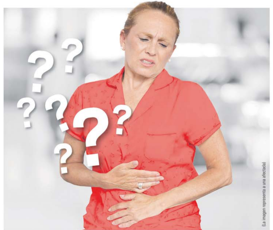
(La imagen representa a una afectada)

Durante la búsqueda de una terapia eficaz para el síndrome del colon irritable, un equipo de investigadores realizó un gran descubrimiento: la cepa de bifidobacterias presente en Kijimea Colon Irritable (B. bifidum MIMBb75), ex-