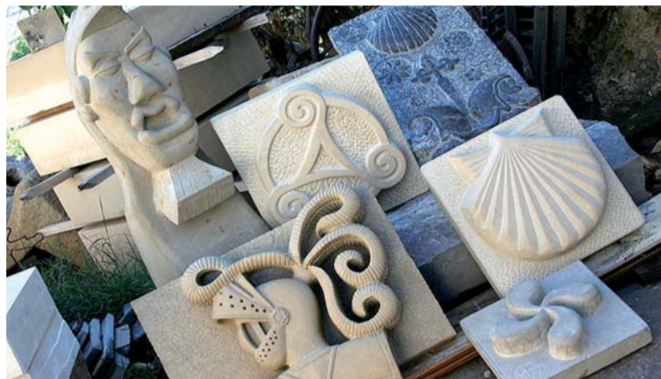
La Rioja es una tierra rica en artesanía.

Organizadas para conmemorar los Días Europeos de la Artesanía, en estas jornadas habrá talleres de artesanía artística y agroalimentaria con participación de nueve ar-