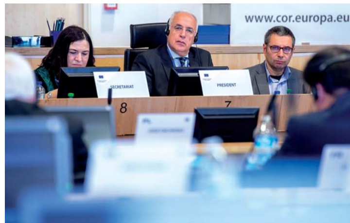
Ceniceros en Bruselas en la última reunión de la SEDEC del día 2.

Andreu realizó estas propuestas en política local el miércoles 3 con motivo de los cuarenta años de las primeras elecciones municipales de la democracia, afirmando que "podemos recordar aquel momento histórico" con la aprobación de un decreto por parte del Gobierno de Pedro Sánchez que permitirá a los ayuntamientos y comunidades autónomas destinar el superávit de 2018 a inversiones sostenibles.