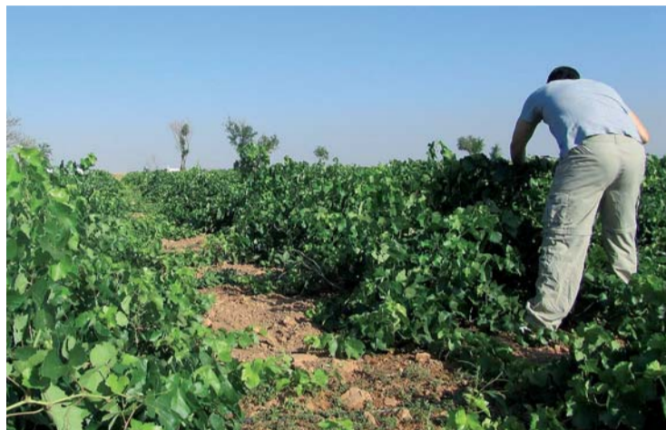
La agricultura fue la principal culpable del aumento del paro en marzo.

Desde el Gobierno regional, se destacó que se registró la menor cifra de desempleo en un mes de marzo de los últimos diez años con un descenso interanual del 4,09%, así como el hecho de que La Rioja sea la quinta comunidad con menor tasa de paro y que se hayan creado 2.817 empleos durante el último año.