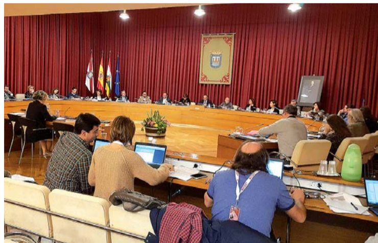
Pleno del mes de abril celebrado el jueves 4 por el Ayuntamiento.

Por el contrario, el PP no pudo sacar adelante los criterios de actuación para los PERIs de reconversión industrial que recibieron el rechazo de PSOE, Cambia Logroño, Ciudadanos y PR+. Pese a ello, Ga-