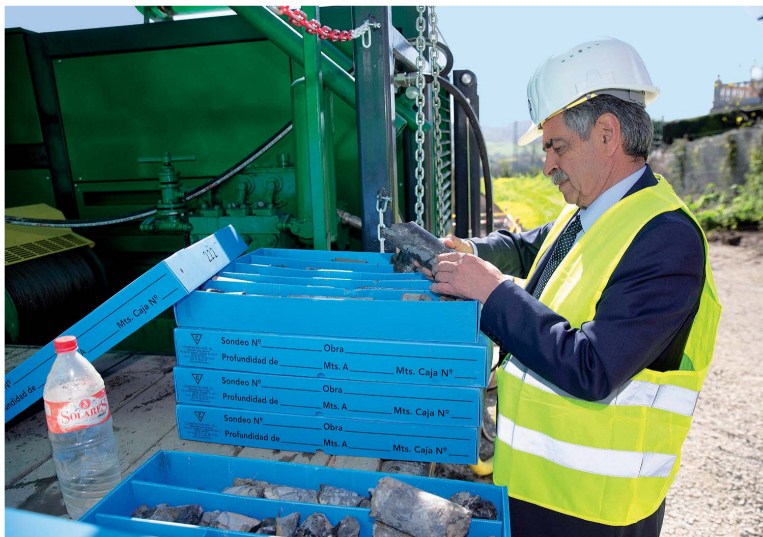
El presidente Miguel Ángel Revilla se desplazó hasta Quevedo a comprobar el material extraído.

"No debiera haber siglas políticas en los grandes proyectos que benefician a Cantabria", manifestó Revilla en alusión a la mina de zinc y a otras grandes infraestructuras como el tren a Bilbao. "Son cosas que no tienen que estar en manos de la discrepancia política, sino del