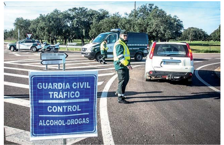
En 2018 se incrementó en un 31% el número de controles realizados.

Por otro lado, se valoró positivamente el incremento en el número de controles para la detección de presencia de drogas durante la conducción. El Sector de Tráfico de la Guardia Civil ha incrementado en un 31% el número de pruebas de detección realizadas, pasando de las 2.167 en 2017 a 2.830 en 2018. Las Policías locales de Laredo y