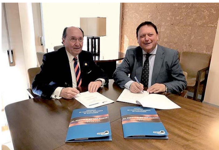
Los presidentes de ambas entidades durante la firma del convenio.

Constituye por tanto una iniciativa de networking que proporciona a las entidades socias foros de reflexión conjunta, servicios de noticias, plataforma web común, documentos de inteligencia para la toma de decisiones y para iniciativas conjuntas, servicios de documentación, redes de intercambio de técnicos y directivos, etc.