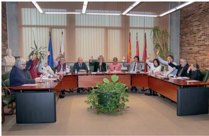
Momento de la votación en el Pleno Municipal.

Respecto a los criterios medioambientales, se rechaza porque la isla de Solvay es una zona "no idó-