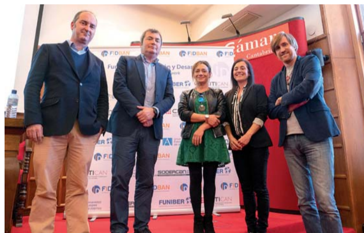
Responsables de las empresas participantes en esta quinta ronda.