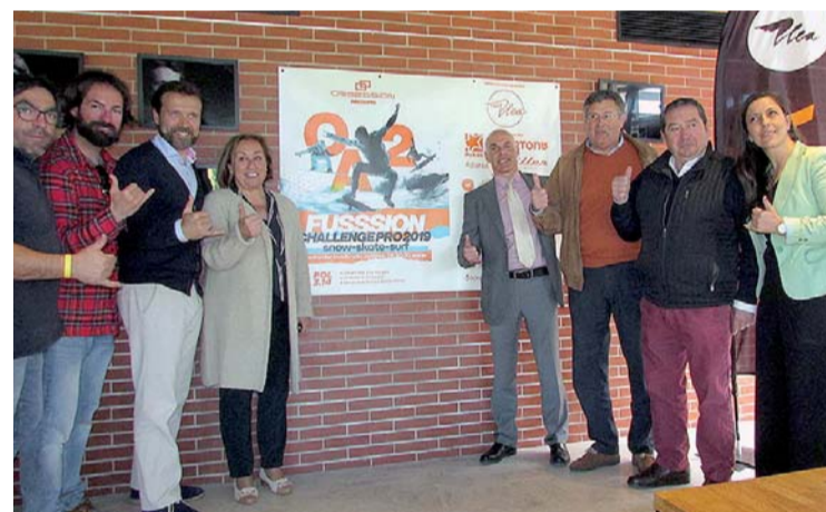
Presentación de la VII edición de 'Fusión'.

La organización ha dispuesto cuatro categorías Open tanto masculino como femenino: Sub 10, Sub 14, Dinosaurios (mas de 42 años)