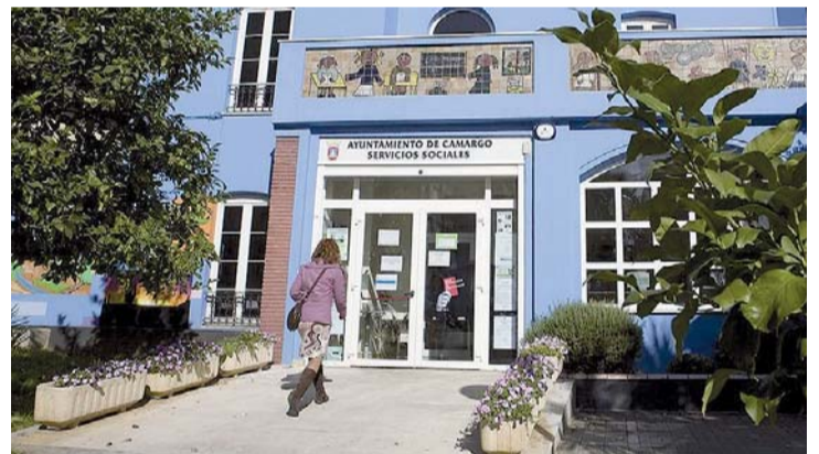
La mayoría de las personas atendidas fueron mujeres.