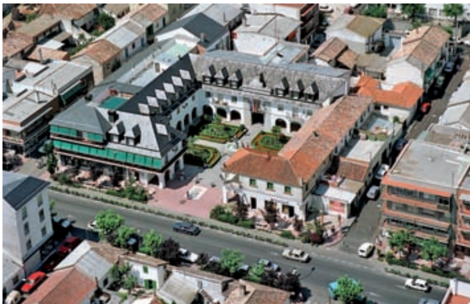
Gran Vía de Majadahonda antes de ser peatonal

Además hay escenas en blanco y negro de la primera Cabalgata de Reyes, celebrada en 1973, que estaba formada por tres Citroën Mehari que llevaban a Sus Majestades de Oriente, o de las becerradas organizadas por quienes fundaron la Peña La Albarda. La muestra estará abierta hasta el 30 de marzo de 10 a 14 horas y de 17 a 21 horas.