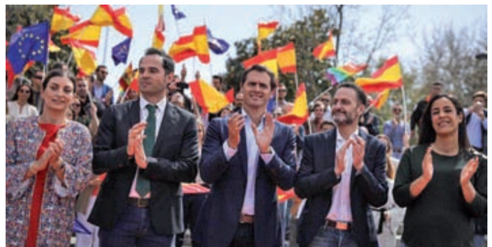
Rivera durante el acto CIUDADANOS

El presidente de Cs criticó a PSOE y PP por mirar al pasado y apostó por construir un futuro nacional de unidad. Asimismo, reclamó a Pedro Sánchez un debate televisado.