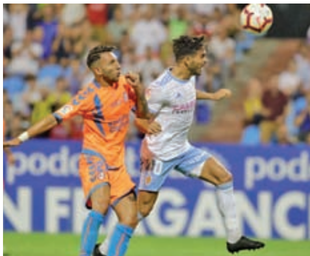
Derrota contra el Osasuna RAYO MAJADAHONDA

El Rayo Majadahonda afronta este domingo 24 de marzo el duelo liguero ante el Numancia en el Cerro del Espino como una nueva posibilidad para sumar los tres puntos y alejarse aún más de los fantasmas del descenso. El