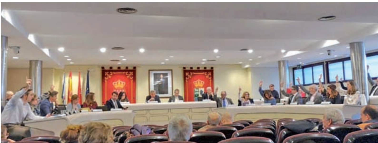
El Pleno Extraordinario