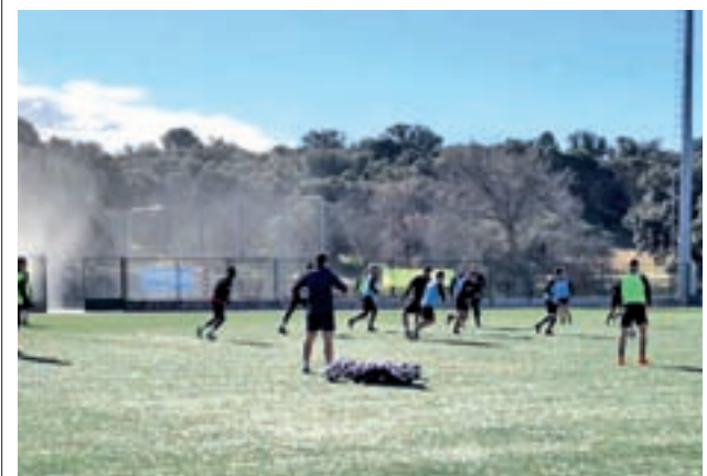
Entrenamiento del Inter

El equipo madrileño tiene una renta de seis puntos sobre el Extremadura, que es el conjunto que delimita los puestos de descenso. Asimismo, está a tres puntos de su rival soriano, lo que provocaría un salto importante en la clasificación en caso de victoria. Además, el combinado de Iriondo se metería de lleno en la zona media, donde una buena racha de resultados pueden certificar la permanencia y no tener que recurrir a nervios de última hora ya que este año hay tres plazas de descenso por el Reus.