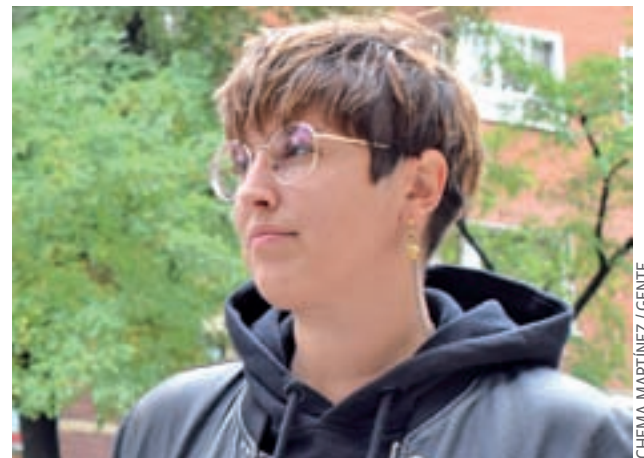
CHEMA MARTINEZ / GENTE

● Actualmente y, hasta el 10 de mayo, se encuentra de gira por toda España para presentarlo entres sus seguidores