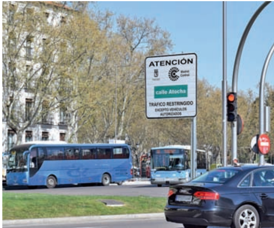
Madrid Central entró en vigor a finales de 2018

Estos datos pueden tener diversas lecturas, desde el simple paso por un trámite que algunos vecinos no hubieran realizado todavía, hasta la consecuencia del mercado ilícito de empadronamientos que denunció la Plataforma de Afectados por Madrid Central el pasado mes de febrero. Entonces, este colectivo hizo pública la venta de