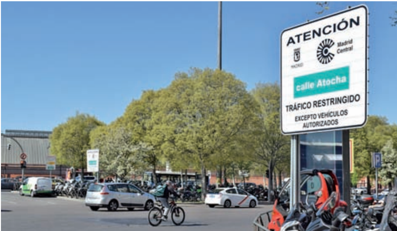
CARLA FLECHA / GENTE

Madrid ha sido la última comunidad en incorporarse al sistema nacional ● Los madrileños ya pueden retirar sus medicamentos fuera de la región