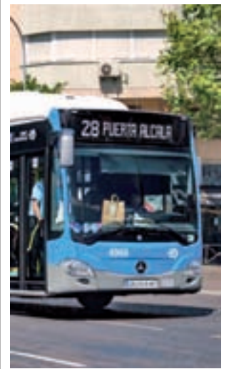
Uno de los autobuses

Por su parte, el portavoz del Grupo Municipal del PP en el Ayuntamiento de Madrid y candidato de la formación a la Alcaldía, José Luis Martínez-Almeida, lo tiene claro: "Se han incrementado casualmente en aproximadamente 4.000 los empadronamientos en Madrid Central, lo cual no parece que sea casual, sino que la gente viene a empadronarse aquí aunque no vivan el centro".