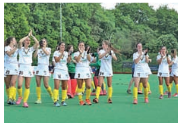
El Club de Campo femenino busca su Copa número 16

Por su parte, el Rayo Vallecano recibirá un poco después (14 horas) al Betis, instalado en la zona templada de la clasificación.