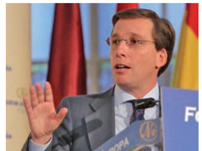
Martínez-Almeida, en el foro Nueva Economía

Por otro lado, el PP pretende crear una Oficina Digital de Madrid con competencias transversales para transformar todos los servicios que ofrece el Consistorio.