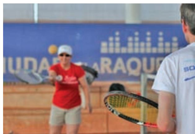
El escenario será la Ciudad de la Raqueta GENTE

Esta será la primera parada de un mes de febrero que marcará irremediabilmente la temporada de los hombres de Solari. Tras este encuentro con el Alavés, visitarán el sábado 9 el Metropolitano para jugar el derbi con el Atlético de Madrid, pocos días antes de regresar al gran objetivo del curso, la Champions League, viajando hasta Amsterdam el miércoles 13 para medirse con el Ajax.