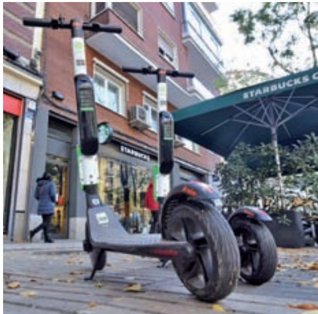
Patinetes en las calles de Madrid

El Ayuntamiento tiene previsto que las unidades regresen a las calles en un plazo de un mes o mes y medio • Han recibido solicitudes para hasta 100.000 dispositivos de 25 empresas