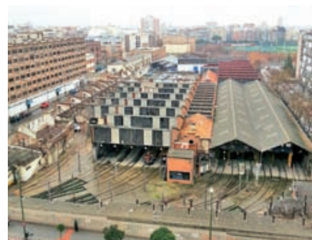
Las antiguas dependencias de Metro

"Esperamos que el PSOE reconsidere su postura a favor de las 400 familias, con su voto favorable a la aprobación definitiva de este plan parcial", concluyen.