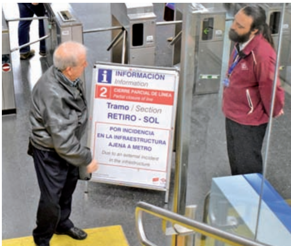
Un empleado de Metro informa a un usuario sobre el cierre

Precisamente los trabajos de acondicionamiento de Canalejas son los causantes del