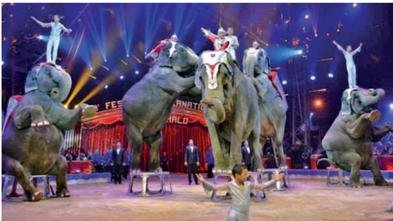
Varios elefantes, en un espectáculo circense