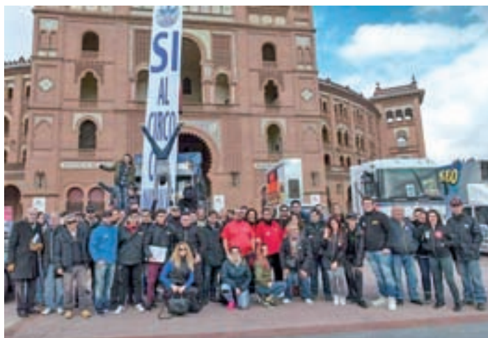
Protestas: Varios miembros de la Asociación Circo Reunidos harán huelga de hambre en las puertas del Ayuntamiento si Carmena sigue con sus planes. "No entendemos por qué quieren prohibir algo que es legal y que cumple todos los controles de bienestar animal", se lamentan.

Más de dos años después, la Junta de Gobierno ha aprobado el proyecto inicial de la modificación de la Ordenan-