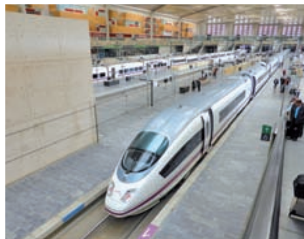
AVE entre Madrid y Barcelona

La otra novedad en lo que se refiere a la conexión mediante el tren de las dos ciudades más grandes del país llegará antes, concretamente en el mes de abril. Esta es la fecha escogida por Renfe para implantar el wifi en el AVE Madrid-Barcelona, un servicio