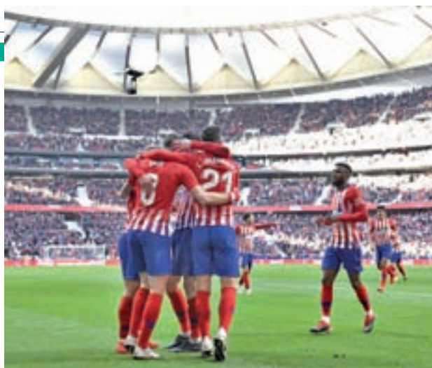
El Atlético sigue la estela del Barça LALIGA.ES

que estos dos equipos de la capital disputarán sus encuentros en la tarde del domingo. Para empezar, el Atlético visitará (16:15 horas) el Benito Villamarín, el campo de un Real Betis al que le está pasando factura el desgaste de compaginar la Liga con las rondas de Copa. A pesar de ello, los verdiblancos siguen en la órbita de los puestos europeos, instalados en la octava plaza con 29 puntos en su casillero. Bastante más arriba, en el segundo puesto, está un Atlético que se ha convertido en la gran alternativa al Barcelona en la lucha por el título, un sueño al