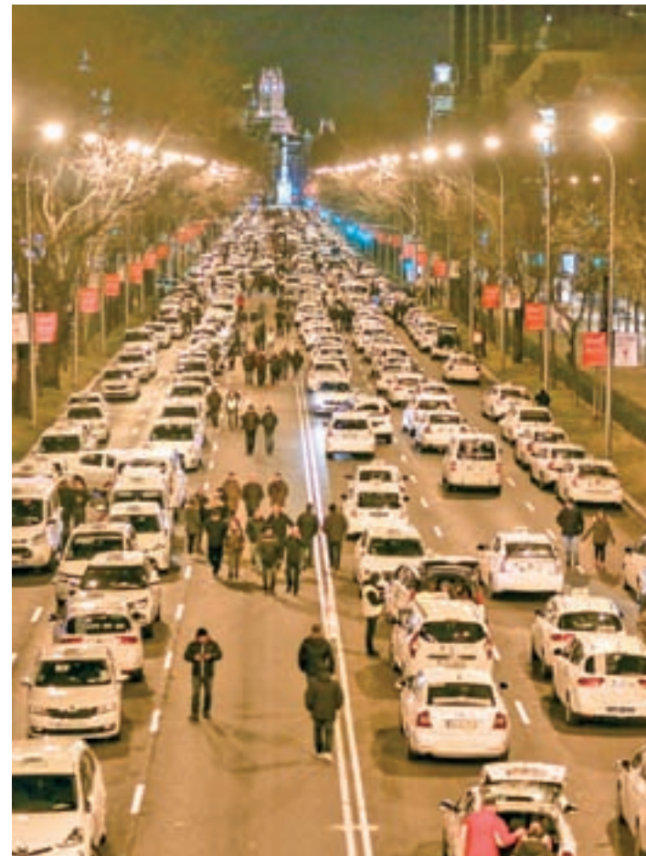
Los taxistas bloquearon el Paseo de la Castellana

En medio de este clima de tensión, la posibilidad de llegar a un acuerdo que acabe con la huelga parece lejana, al menos al cierre de estas líneas. El principal punto de fricción entre las partes está