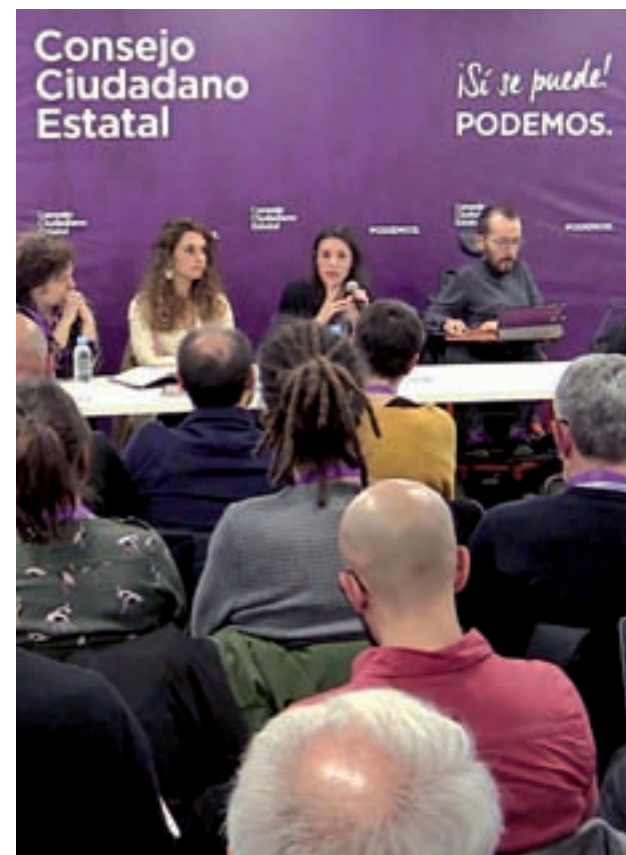
Consejo Estatal de Podemos

El paso decisivo, sin embargo, se vivió en la jornada de este miércoles. Iglesias, de baja paterna, escribió en su perfil de Facebook una serie de "consideraciones" entre las que destacan que "Íñigo no es