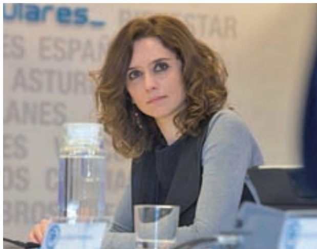
Isabel Díaz Ayuso