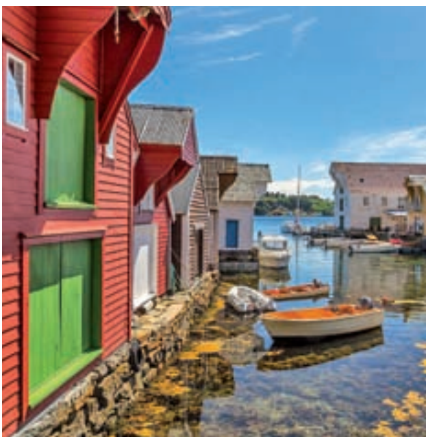
NORUEGA: Situado al norte de Europa, Noruega ofrece una belleza natural, cascadas espectaculares, fiordos de aguas cristalinas, majestuosas montañas e increíbles glaciares que se mantienen intactos gracias al cuidado de los lugareños.