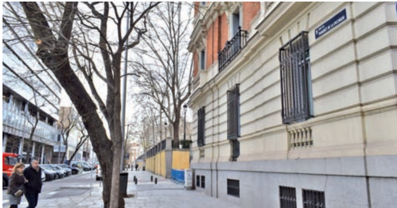
Marqués de la Ensenada es la calle con el metro cuadrado más caro de la capital

Las subidas no se quedan en los distritos más céntricos y también se encuentran incrementos significativos en zonas periféricas como la calle Camarena (Latina), donde el metro cuadrado ha experimentado un encarecimiento del 9,1%; la avenida Pablo Neruda (Puente de Vallecas), con un aumento del 5,5%; y Arturo Soria (Ciudad Lineal), con una subida media del 4,52%.