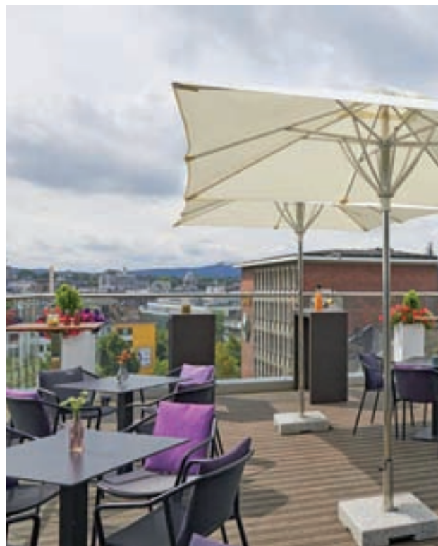
ALEMANIA: Es uno de los países europeos que mayor número de turistas recibe al año. Ahora, el grupo Meliá Hotels International ha adquirido hoteles urbanos y sostenibles bajo el nombre INNSide by Meliá en las principales ciudades de este país.

En este evento, República Dominicana, que en 2018 recibió 6,6 millones de turistas, ha sido seleccionado como país socio gracias a su gran variedad de atractivos turísticos. Desde GENTE, no obstante, hemos elegido otros destinos igualmente relevantes que poder disfrutar este 2019.