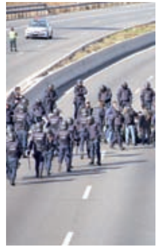
Taxistas cortando la M-40

Las protestas se han ido sucediendo a lo largo de toda la semana, con Ifema como foco principal. Los manifestantes llegaron a rodear el recinto ferial durante la inauguración de Fitur, una medida que mantendrán todo el fin