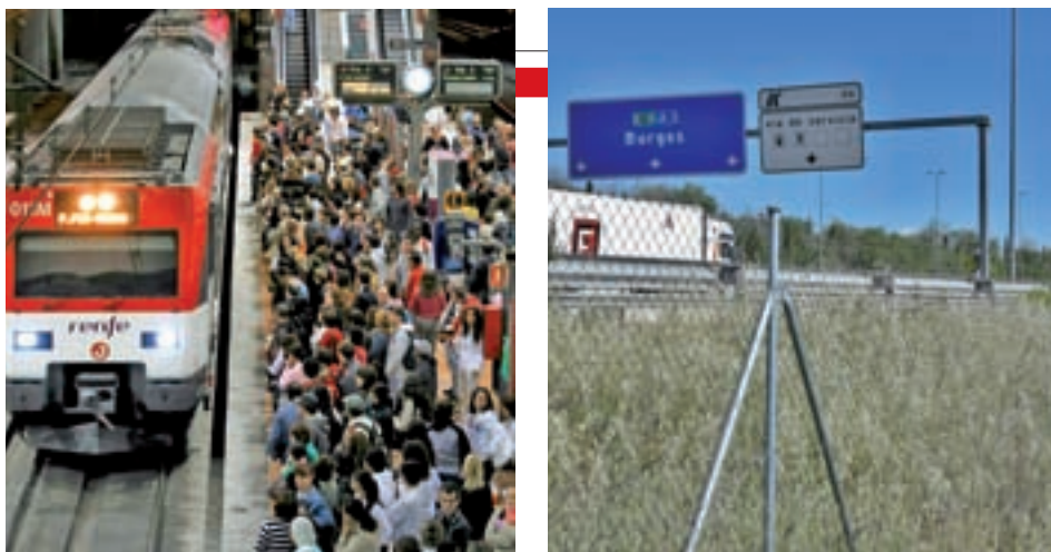
Estación de Cercanías de Atocha y terrenos para la variante de la A-1