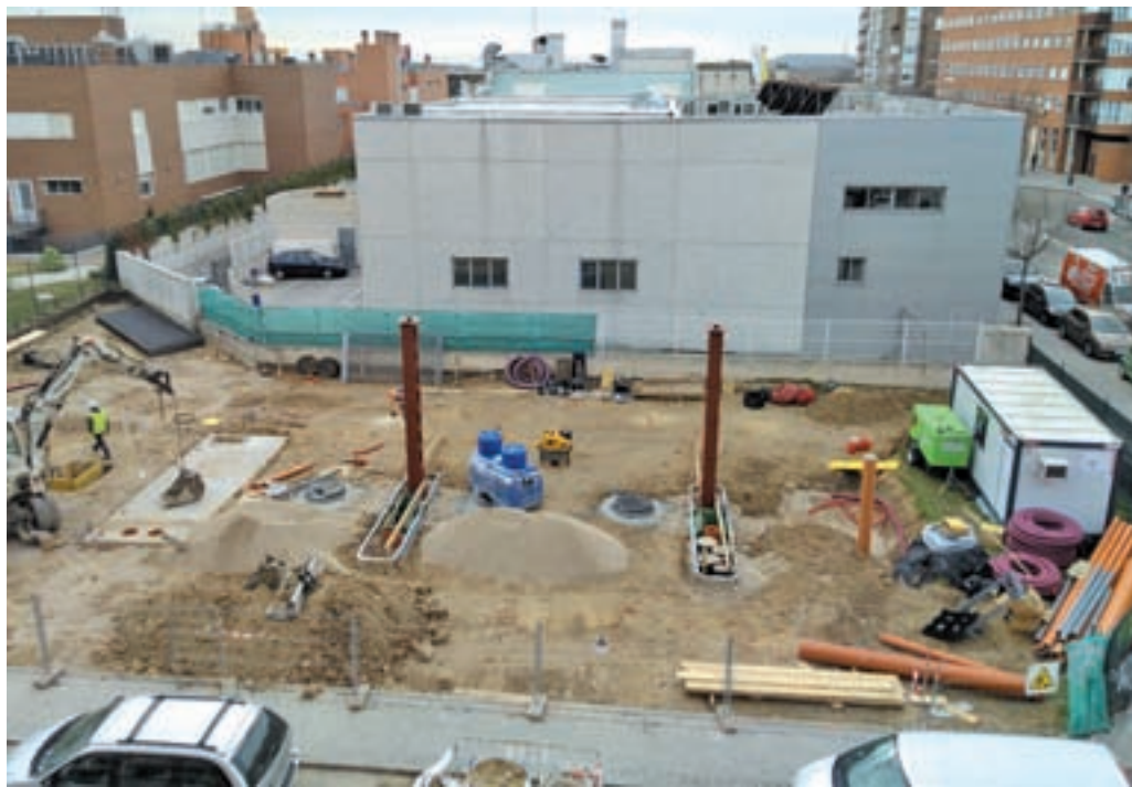
Estado de las obras de construcción, en la calle de Sofía 36

“La gasolinera que envenenará nuestras casas y nues-