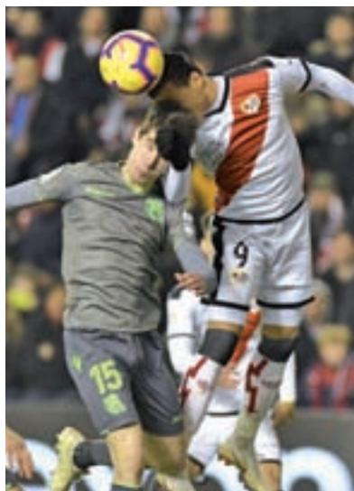
Rayo y Real empataron a dos

Después de cuatro jornadas sin conocer la derrota, el Rayo Vallecano se adentra en la fecha 21 de la Liga Santander con la posibilidad real de abandonar los puestos de