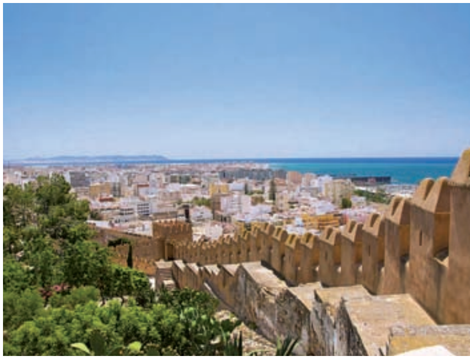
Almería será uno de los destinos de moda en los próximos meses

En lo que se refiere a las escapadas que se realizan dentro de nuestro país, el documento distingue entre las localidades pequeñas y las grandes ciudades. En el primer apartado destacan lugares como Ulldecona (Tarragona), Hervás (Cáceres), Pasajes (Guipúzcoa), Candelario (Salamanca), Bárcena Mayor (Cantabria), Olvera (Cádiz),