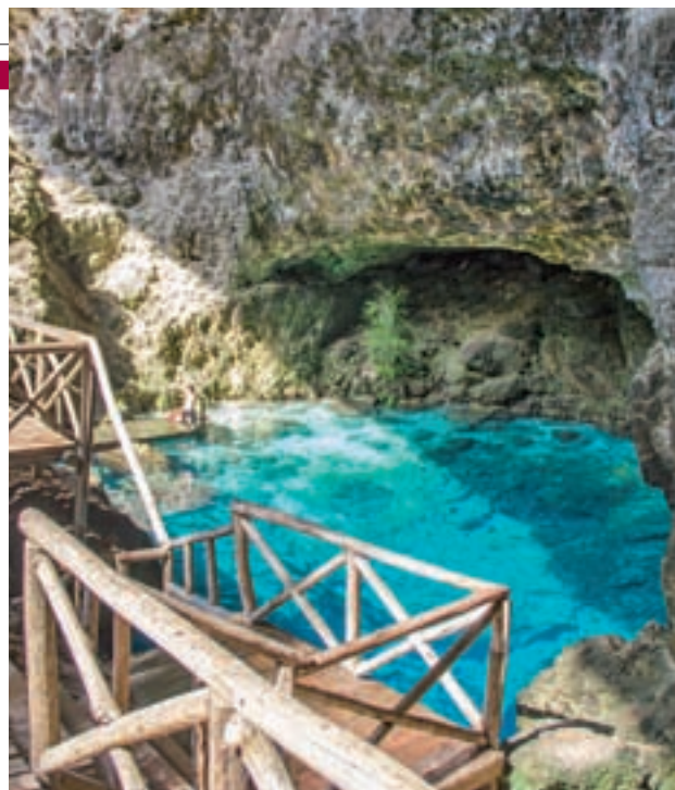
REPÚBLICA DOMINICANA: A pesar de ser conocido por sus playas de ensueño, este país cuenta, además, con otros atractivos como el Pico Duarte, el punto más alto del Caribe, o el Hoyo Azul, una piscina natural oculta en la selva.