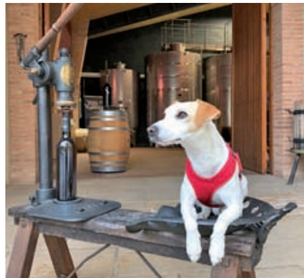
Bodegas Sers: Una de las paradas de su periplo turístico en este año que Pipper lleva viajando por toda España fue las Bodegas Sers en Cofita (Huesca). Situada en el prepirineo aragonés, con doce hectáreas es la bodega más pequeña de la Denominación de Origen Somontano.

le produce es que "sitios que no se habían planteado esta problemática, al llegar Pipper se interesan por ello y lo acaban aceptando", cuenta. Y uno de los ejemplos es la iglesia de San Pedro Cultural, en Palencia, que ha instaurado las visitas 'dogfriendly'.