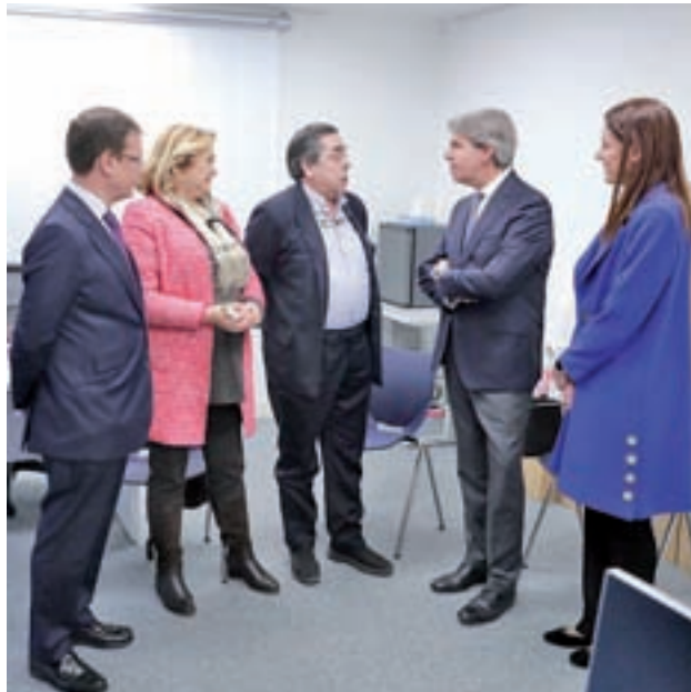
Garrido, con los responsables del servicio

Desde que en abril del año pasado entrase en funcionamiento, el Servicio de Atención en Adicciones Tecnológicas ha ayudado a 1.707 familias con adolescentes de 12 a 17 años que tienen problemas con las redes sociales, los dispositivos móviles o los videojuegos. El centro, que esta semana recibió la visita del presidente regional, Ángel Garrido, se encarga de la evaluación de la conducta de los menores, la interacción que les provoca el uso de las tecnologías en su vida cotidiana y su grado de pérdida de control, analizando si interfiere