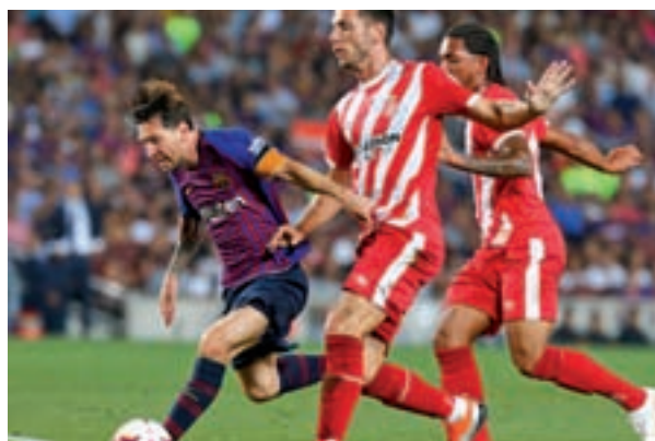
Messi en el partido de la primera vuelta

Lo que en un principio sólo era una hipótesis cobró visos de realidad cuando LaLiga puso sobre la mesa un ofrecimiento firme a los abona-