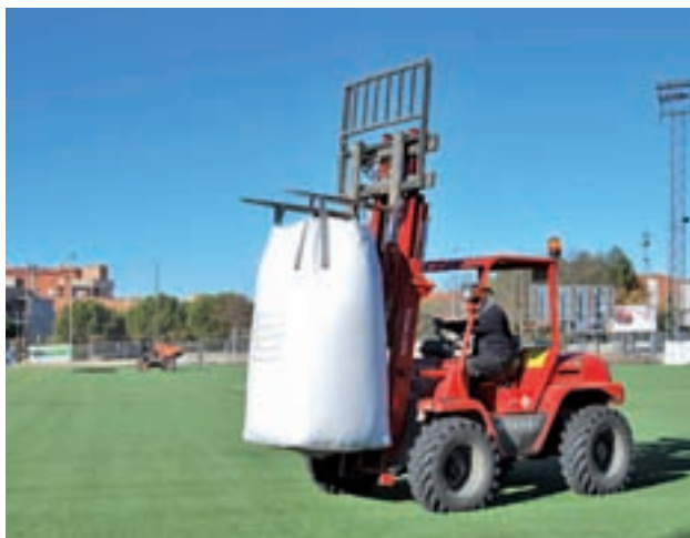
Obras en el campo 3 del Alfredo Di Stéfano

pidiendo la difusión de su caso para que se encuentre un donante compatible (más información en el teléfono 900 102 688). La lucha de Vanesa se ha dirigido también a intentar financiar la lucha contra el cáncer en el Centro de Investigación del Cáncer de Salamanca.