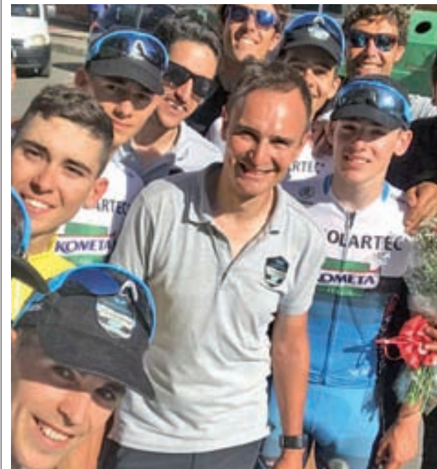
Integrantes del equipo júnior

Por otro lado, la empresa italiana Elmec Informática y la Fundación Alberto Contador han firmado un acuerdo por el que, según ambas partes, se creará "una asociación tecnológica para todo el año 2019 en la que se pondrán en marcha experimentos innovadores en el mundo de la bicicleta". El exciclista Ivan Basso ha jugado un papel clave en este acuerdo, como líder del Kometa Cycling Team.