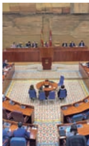
Asamblea de Madrid

Concretamente, el artículo 10.2 establece que la Asamblea estará compuesta por un diputado por cada 50.000 habitantes o fracción superior a 25.000. El último dato del Pa-