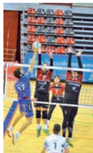
El Voley Pinto es penúltimo