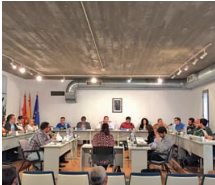
Pleno del Ayuntamiento de Valdemoro

El Impuesto de Bienes Inmuebles (IBI) se reducirá este año en el 77% de los recibos, según el cálculo realizado por el Ayuntamiento de Valdemoro después de rebajar el tipo municipal del 0,579% hasta el 0,558%. Esta medida, que se aprobó de manera definitiva el 27 de diciembre, pretende paliar en parte la subida que ha supuesto la actualización estatal del valor catastral de los inmuebles que se repercute en diez años desde 2012 hasta 2022.