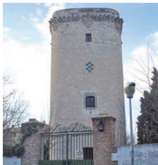
Torre de Éboli de Pinto