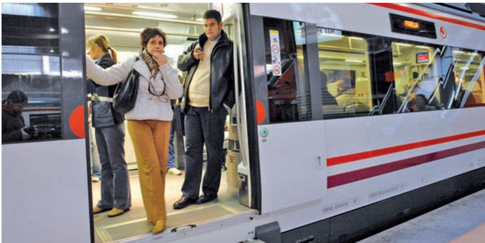
Los problemas del servicio de Cercanías han sido constantes en Parla, Pinto y Valdemoro GENTE