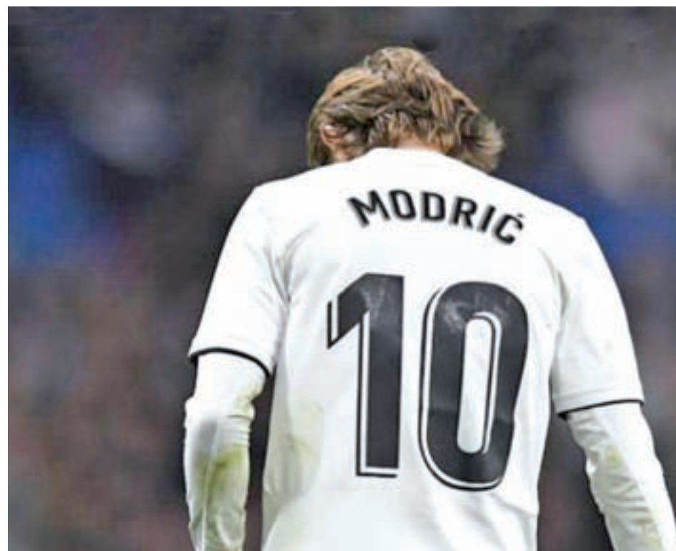
El Real Madrid vive su peor sequía goleadora desde la temporada 1993-1994