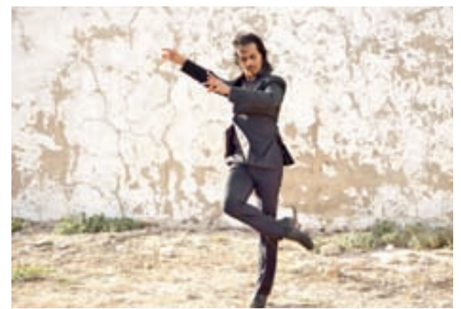
El bailar Farruquito actuará en el Teatro Circo Price

De forma paralela, la sala El Sol, apadrinará Inververso, un ciclo que busca un acercamiento mutuo entre el mundo de la música y las letras, uniendo a poetas y artistas en un mismo plató.