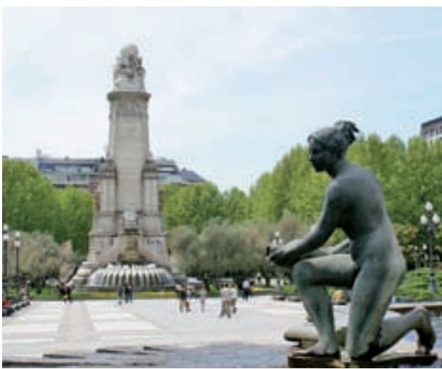
Estado actual de la Plaza de España