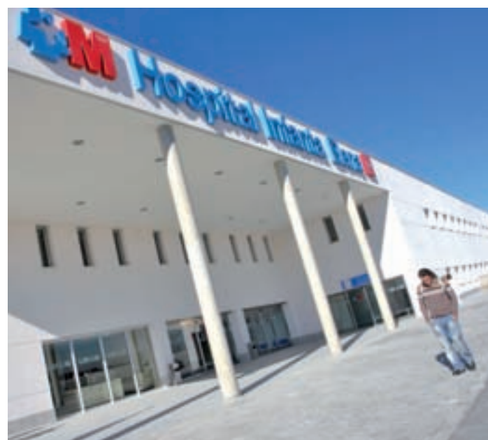
Hospital Infanta Elena de Valdemoro