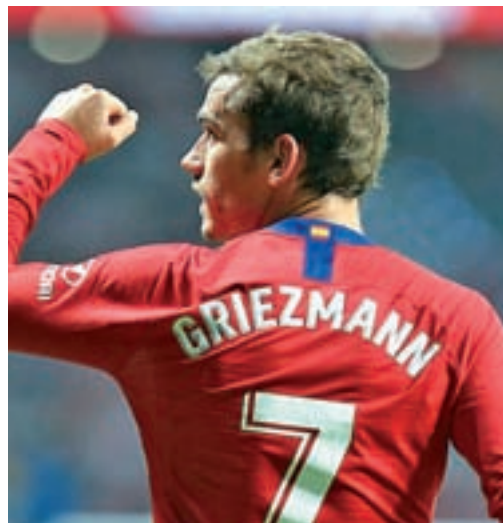
Griezmann ha marcado tres goles en la Liga

FRANCISCO QUIRÓS francisco@gentedigital.es