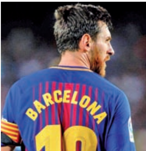
Messi ya está plenamente recuperado

Atlético de Madrid y Barcelona protagonizan el partido estrella de la jornada 13, que podría propiciar un cambio de líder en la clasificación ● Dos estrellas, Griezmann y Messi, frente a frente