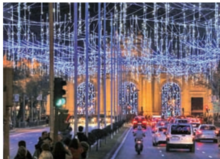
Alumbrado navideño: Funcionará de domingos a miércoles, desde las 18 hasta las 23 horas; y de jueves a sábados, vísperas de festivo y los días 25, 1 y 6, de 18 horas a medianoche.

luminosa, con flechas verdes y aspas rojas, en sus accesos. La medida, que funcionará viernes, sábados, domingos, festivos y vísperas a partir de las 17:30 horas; sólo permitirá la entrada a Preciados desde la Puerta del Sol y a Carmen desde Callao.