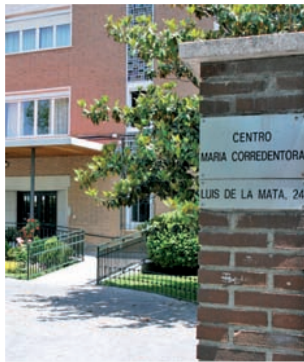
El colegio María Corredentora

La Fundación Garrigou colabora con el proyecto educativo del Centro María Corredentora desde el curso 2012-2013 para apoyarle en su labor de ofrecer una educación de calidad para todos. Este colegio cuenta con más de 300 niños y jóvenes en hora-