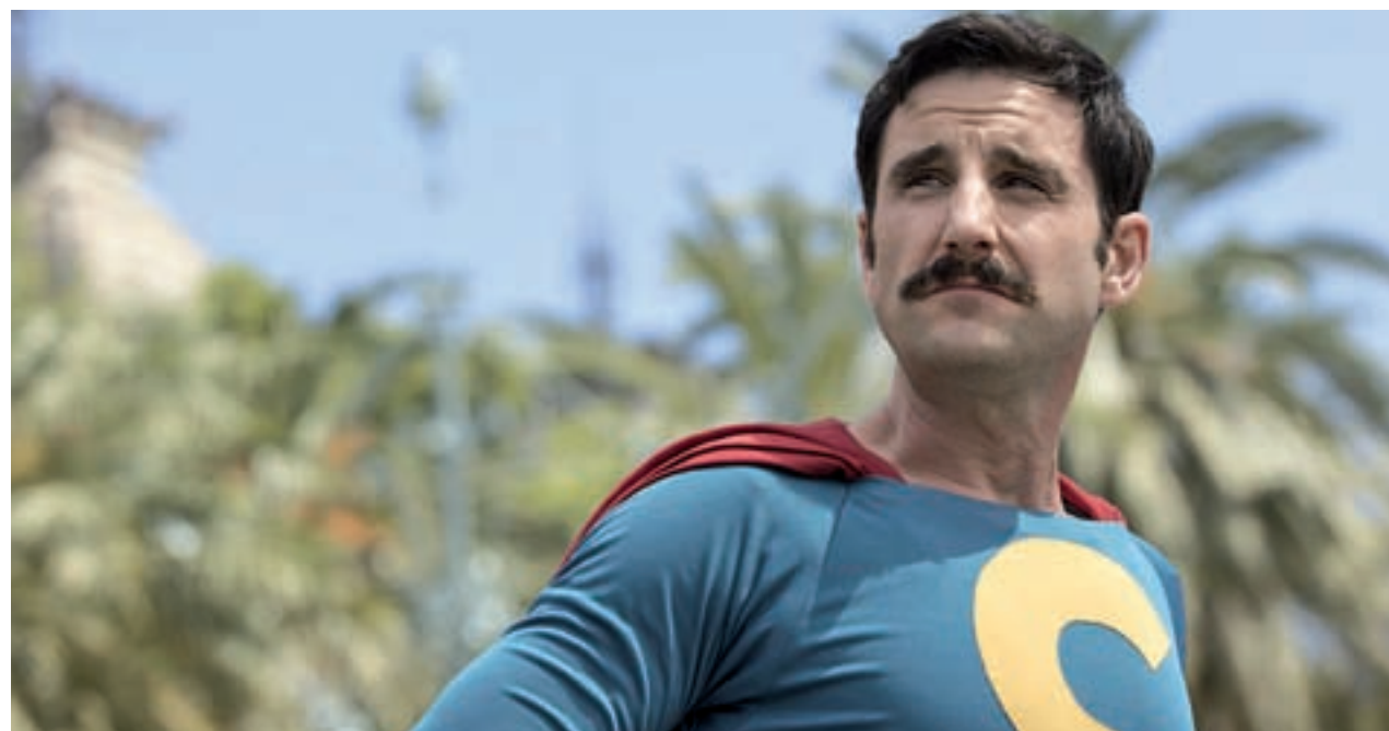
Rovira se viste de superhéroe en esta película

Esa mezcla cosmopolita ha permitido reunir en el reparto a nombres consolidados a un lado y al otro del 'charco', como De la Torre o Soledad Villamil ('El secreto de sus ojos'), junto a jóvenes talentos, caso de Chino Darín. Todos ellos dan consistencia a una historia con gancho, la del cautiverio vivido por el expresidente uruguayo José Mujica.