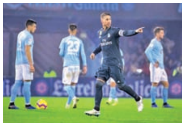
Ramos será duda por unos problemas físicos

El primero en la lista es el Sevilla. El conjunto hispalense es segundo con 23 puntos, sólo uno menos que el Barcelona, a la espera del resultado que se produzca en su encuentro de este domin-