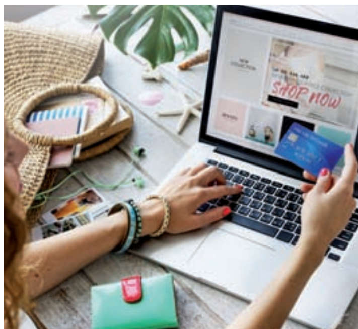
Las mujeres realizaron, en 2017, un 70% de las operaciones

L as compras navideñas vuelven a adelantarse un año más ante la llegada del conocido 'Black Friday' este 23 de noviembre. Una fecha que se caracteriza por las suculentas ofertas y descuentos que ofrecen numerosos comercios y establecimientos. Si bien, en los primeros años, esta cita creció de manera notable en España, en esta edición la subida será algo más moderada,