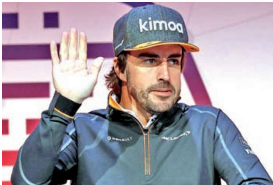
Alonso es décimo en la clasificación general

De este modo, Sainz se convertirá en piloto de McLaren de cara a 2019, formando equipo junto al británico Lando Norris, quien hasta ahora ejercía el rol de probador.