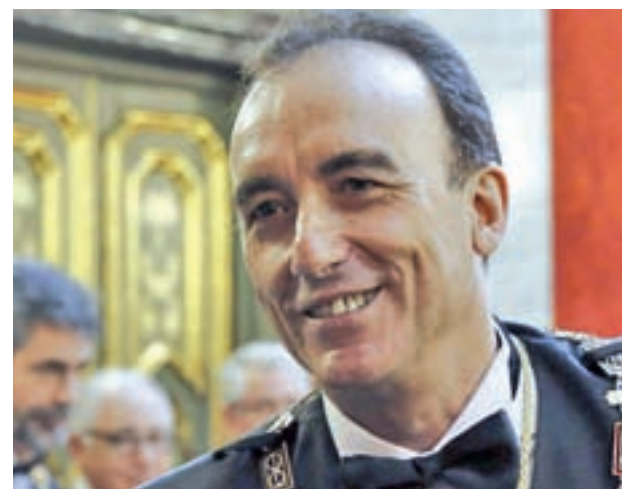
El magistrado Manuel Marchena

"Mi trayectoria como magistrado ha estado siempre presidida por la independencia como presupuesto de legitimidad de cualquier decisión jurisdiccional", resumió.