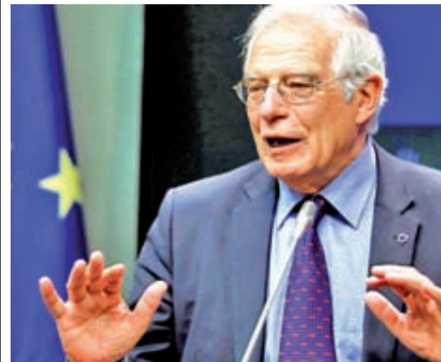
Josep Borrell, ministro de Asuntos Exteriores

La estrategia del Gobierno incluye una inversión de 810 millones de euros para mejorar las infraestructuras y las comunicaciones de la zona con actuaciones en materia de ferrocarril y carreteras. Se pretende modernizar las estructuras que están más afectadas por el paso del tiempo y favorecer el transporte de personas y mercancías.