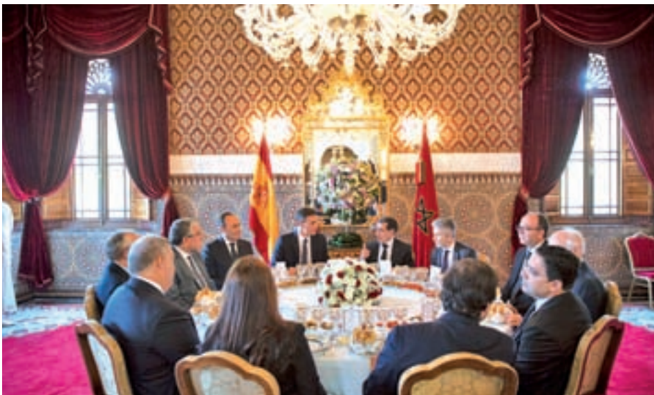
El presidente Pedro Sánchez con su homólogo marroquí Saad Dine