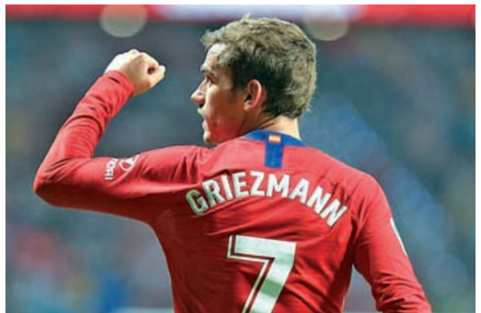
Griezmann ha marcado en tres ocasiones en la presente Liga