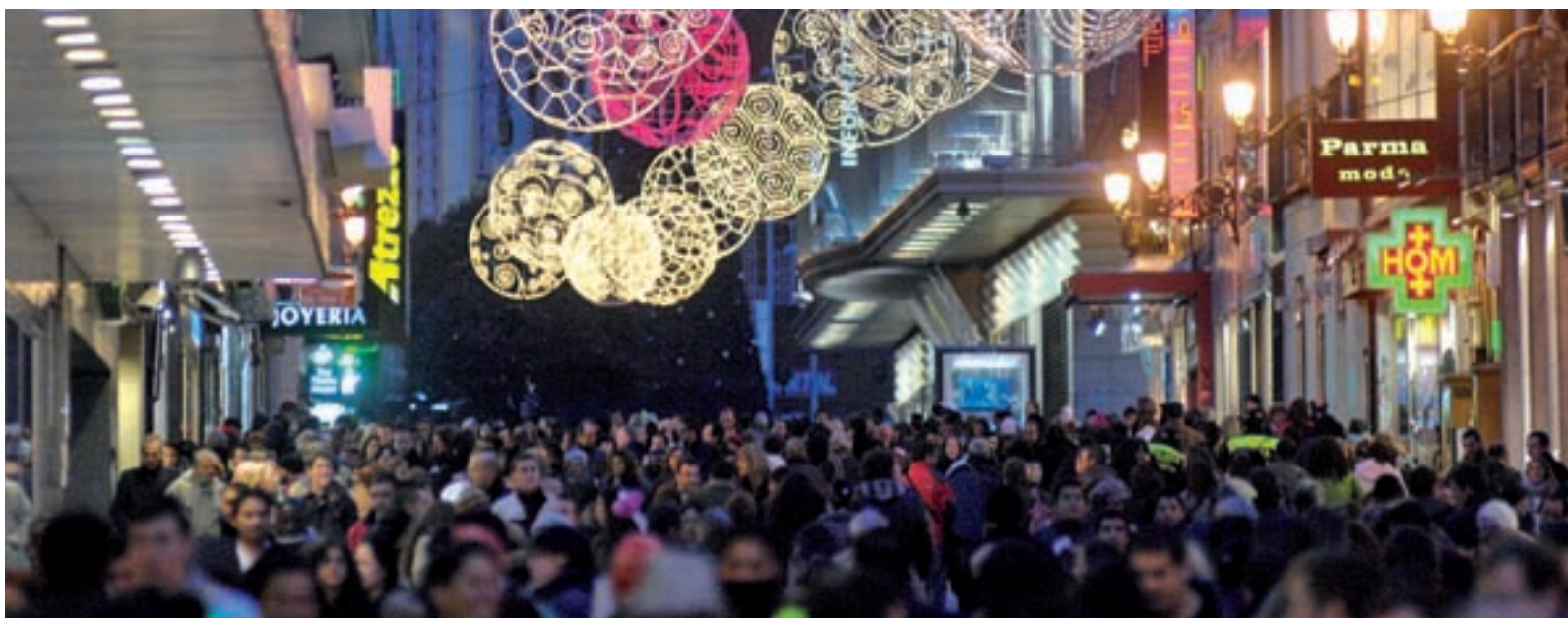
Esta fecha da inicio a las compras navideñas GENTE