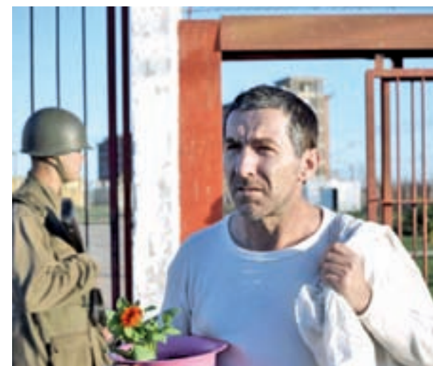
De la Torre se consolida en el registro dramático

En definitiva, un título más propicio para aquellos nostálgicos que quieran recordar al personaje de cómic de Jan, que para los que busquen unos minutos hilarantes.