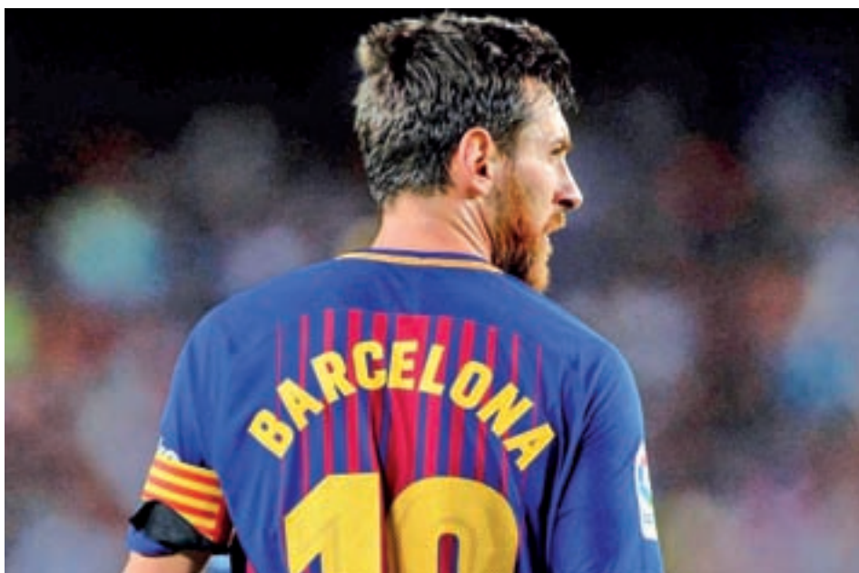
Messi ya está plenamente recuperado de su lesión en el brazo