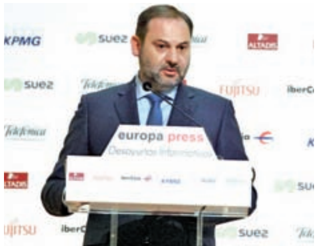
José Luis Ábalos, ministro de Fomento