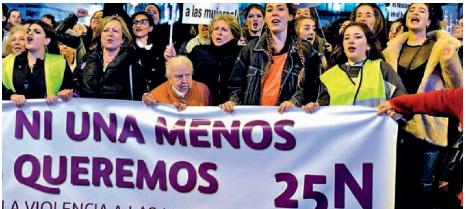
Manifestación del 25N el año pasado

Las comunidades autónomas donde se han registrado mayores aumentos han sido Madrid (25,2%), Murcia (24,4%), Navarra (22,2%) y Aragón (22,1%). Asturias, por el contrario, es la única región española donde estos registros descendieron en 2017 (-1,3%).