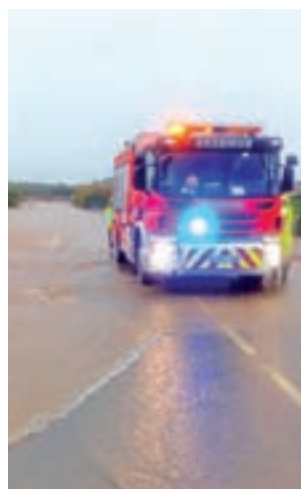
Efectos del temporal

tados de un autobús escolar en Cartagena, vecinos desalojados en diferentes provincias y alertas rojas y amarillas en zonas como Valencia, Murcia, Alicante, Asturias, Baleares, Canarias, Cataluña y Andalucía.