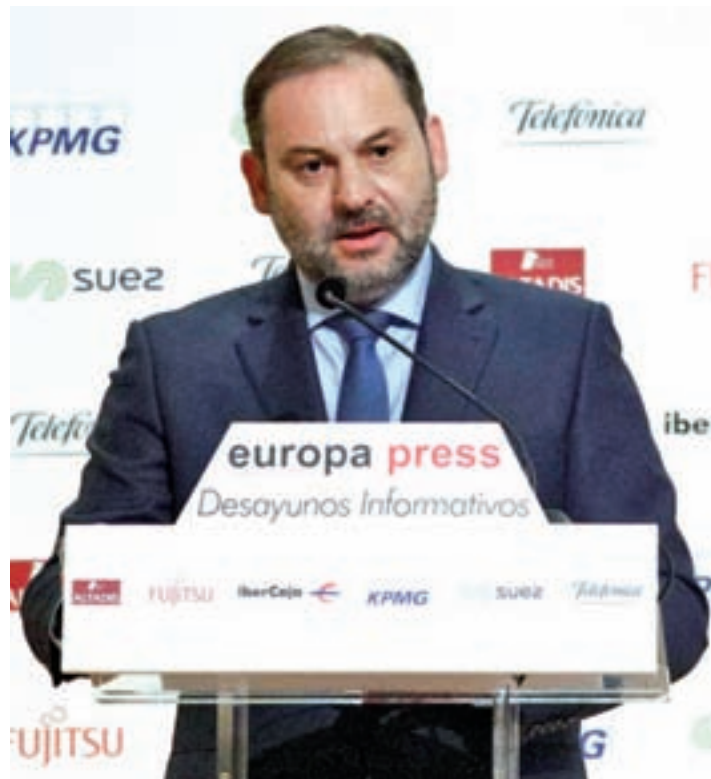
José Luis Ábalos, ministro de Fomento

Al término de la XXVI Cumbre Iberoamericana celebrada en Antigua (Guatemala) la pasada semana, Sánchez calificó de "accesorio" si el Gobierno saca adelante sus medidas través de unos nuevos Presupuestos o de decretos leyes. "No voy a marear a los españoles", matizó, sugiriendo que en el caso de no tener asegurados los votos requeridos en el Congreso para aprobar las cuentas públicas, podría no presentarlas.