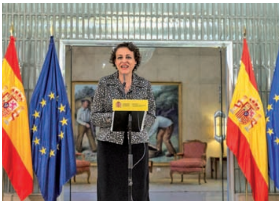
Magdalena Valerio, ministra de Trabajo

El estudio de EAE Business School concluye que el déficit primario ha ido mejorando desde 2012.