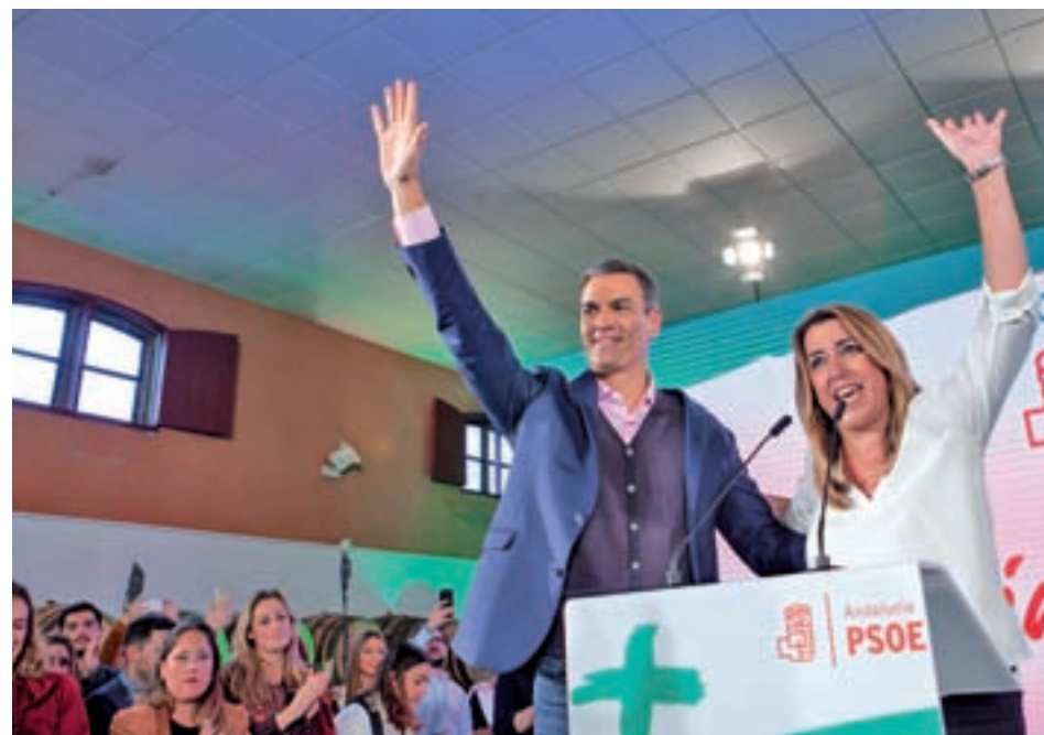
Pedro Sánchez protagoniza un acto junto a Susana Díaz

Pedro Sánchez ya ha protagonizado su primer acto aunque no se prodigarán demasiado • Casado se vuelca e incluso supera en apariciones diarias al candidato del PP, Juanma Moreno