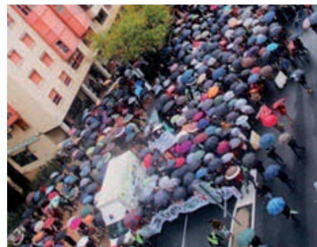
Manifestación multitudinaria por las calles de Cáceres