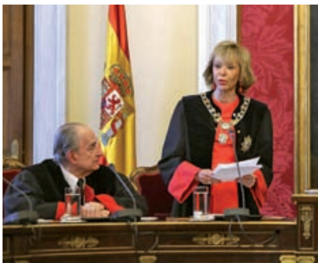
Fernández de la Vega, presidenta del Consejo de Estado