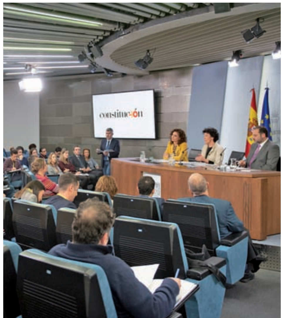
Rueda de prensa tras el Consejo de Ministros

La decisión del Consejo de Ministros ha sido recibida con dos críticas principales: si