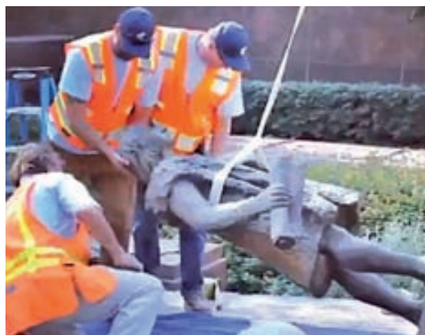
Retirada de una estatua de Colón en Los Ángeles

Así lo ha asegurado el Ejecutivo en la respuesta que ha remitido al portavoz de Ciu-