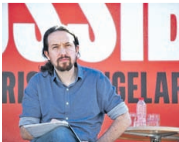
Pablo Iglesias, durante el acto en Barcelona

Refiriéndose a un escenario que contara con la mayoría de PP, Ciudadanos y Vox, el líder de Podemos dijo que la aprobación de las cuentas para el próximo año es necesaria "para mantener una dirección de Estado que siga siendo democrático". Pidió también a Sánchez que negociara con el soberanismo.