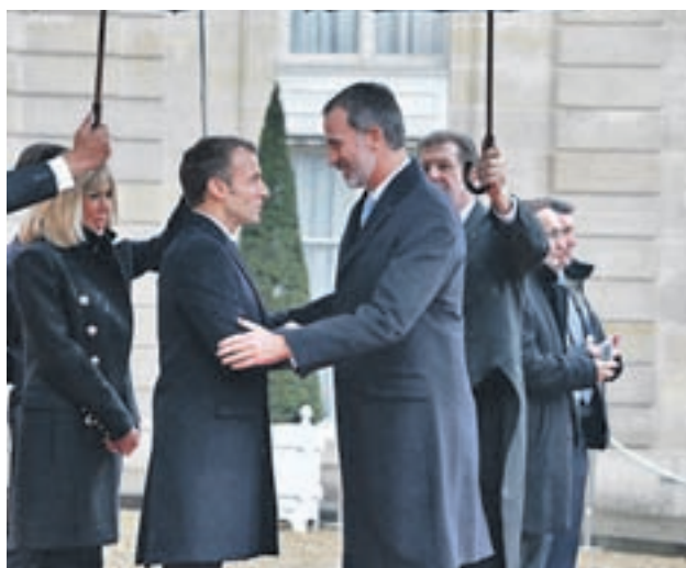
El acto se celebró en el Arco de Triunfo

A pesar de esta valoración, el presidente del Gobierno, Pedro Sánchez, no considera un varapalo a su Ejecutivo las previsiones de la Comisión Europea. "No, para nada", contestó a los medios de comunicación.