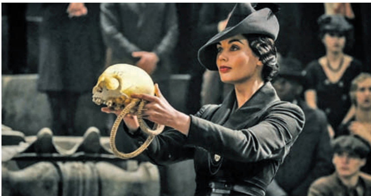
La lucha entre el bien y el mal cuenta con un nuevo arma: la magia

Estas heridas del periodo que marcó a España durante buena parte del siglo XX, aún sigue latente con la manida Memoria Histórica, un asunto en el que, como en casi todo, la vertiente política acaba atropellando al lado humano.