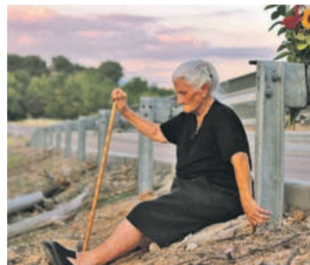
Las fosas comunes, uno de los temas a tratar

El otro punto fuerte de 'Los crímenes de Grindelwald' es el reparto, con Eddie Redmayne (ganador de un Oscar por 'La teoría del todo' y nominado en su día por 'La chica danesa'), Johnny Depp y Jude Law llevando la voz cantante. Especialmente destacable es la incorporación de Depp y Law, quienes a pesar de no aparecer en la primera entrega no desentonan en absoluto. Por lo demás, esta secuela tiene todos los ingredientes para hacer las delicias de los fans del género, con grandes dosis de fantasía, una ambientación extraordinaria y una trama que hace que el metraje (más de dos horas) no se haga pesado. En definitiva, una nueva e interesante lectura sobre la lucha del bien y el mal.