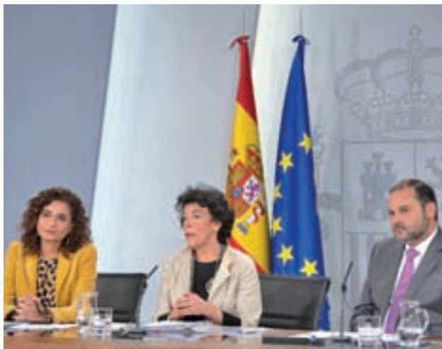
El Consejo de Ministros aprobó la medida

El Gobierno aprueba por decreto esta medida, que no es retroactiva ● El Ejecutivo vigilará que no se repercuta el coste en el cliente ● El Congreso trabaja en una nueva ley de crédito hipotecario