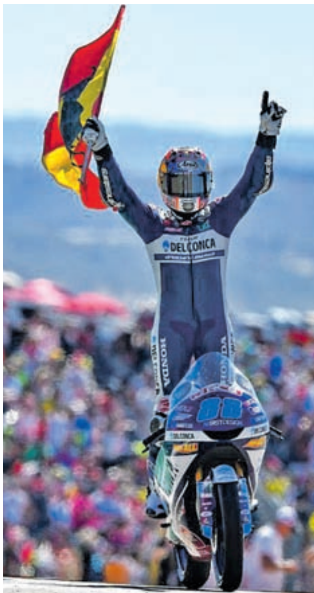
Jorge Martín llega a Cheste con el título asegurado

Lo de la categoría reina, MotoGP, comienza a ser prácticamente una dictadura de los pilotos nacionales. Desde el año 2010, sólo el australiano Casey Stoner logró hacer un paréntesis en el duopolio instaurado por Jorge Lorenzo y Marc Márquez, vencedores de tres y cinco ediciones, respectivamente. En este 2018, el confeti y el champán bañarán una vez más al de Cervera, a quien sólo el accidente sufrido en Australia le ha privado de firmar un repóker de victorias consecutivas. Con todo, su dominio queda reflejado