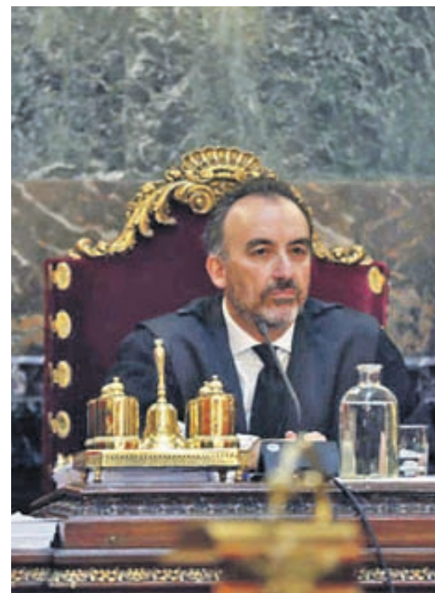
Manuel Marchena será el presidente del CGPJ

Según fuentes gubernamentales, el acuerdo ha priorizado que no se bloquee en