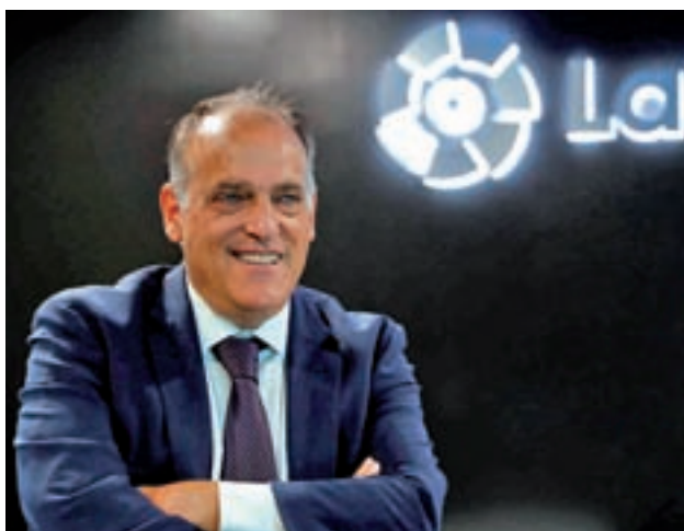
El presidente de LaLiga, Javier Tebas

Sin salir del apartado estadístico, los dos partidos entre ambos protagonistas en el torneo de la regularidad se cerraron con el mismo resultado (1-1), un desempate que se rompió en la final de la Copa de la Reina, cuando el Barcelona impedía el 'doblete' del Atlético al ganar por un 1-0 en el tiempo añadido de la prórroga y cuando todo parecía abocado a la tanda de penaltis, gracias a un tanto in extremis de Mariona Caldentey.