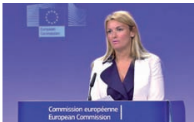
Mina Andreeva, portavoz de la Comisión Europea

“Claro que se puede estar de acuerdo o en desacuerdo con determinadas sentencias,