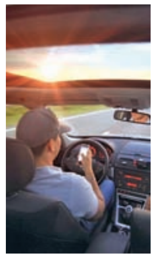
Una persona usando el móvil

LA ASIGNATURA DE VALORES SE CURSARÁ UN AÑO EN PRIMARIA Y OTRO EN LA ESO