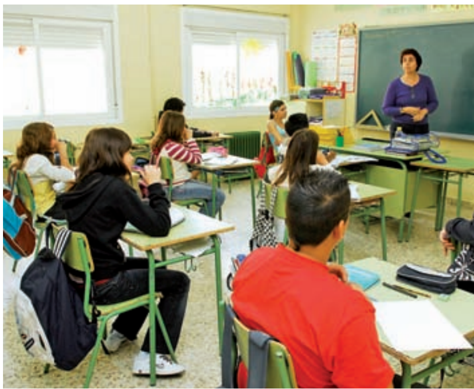
El Gobierno trabaja en una nueva ley educativa

Por otra parte, a finales de 2019, el paro será inferior al 10% en Euskadi, Aragón, Cantabria, Castilla y León, Cataluña, Navarra y La Rioja, mientras que rondará el 20% en Andalucía, Canarias y Extremadura.