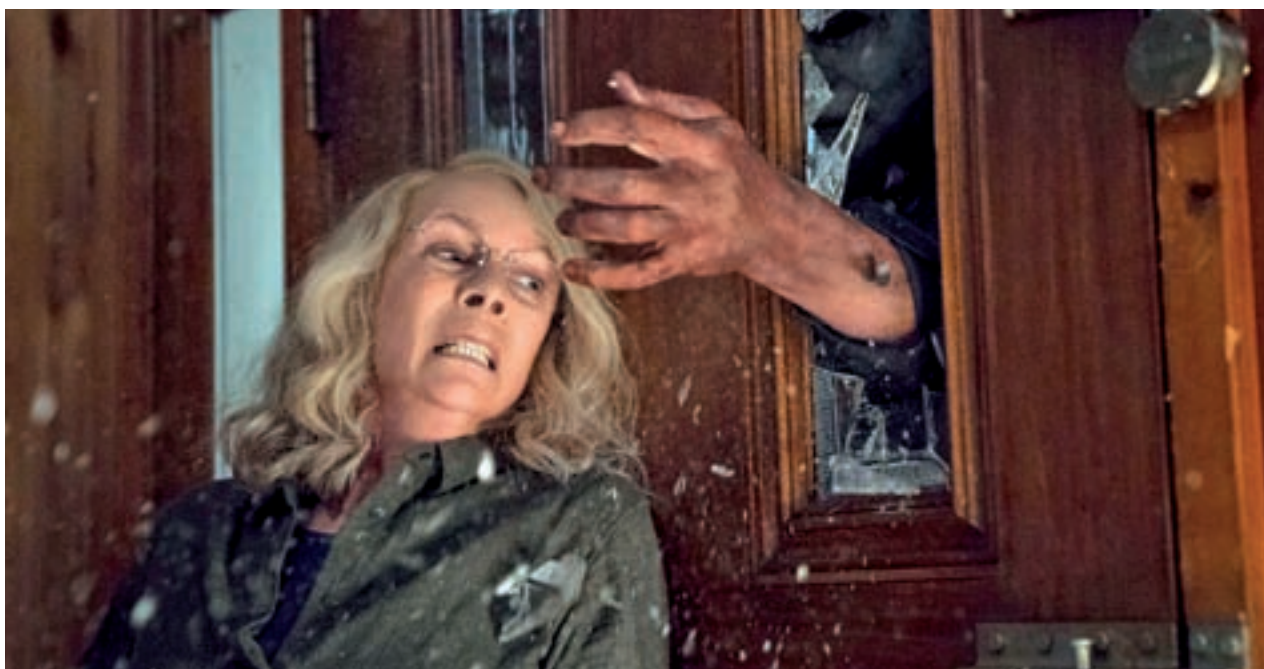
Jamie Lee Curtis se reencuentra con el sanguinario Michael Myers

Najwa Nimri encarna a Lilli Cassen, una diva musical sobre la que planea la sombra del retiro que se aferra a los conocimientos de Violeta, la dueña de un karaoke que es su mayor fan. Entre ellas dos dan aplomo a un film por momentos crítico y por otros realmente emotivo.