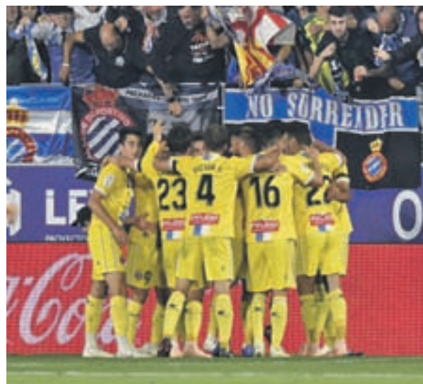
El Espanyol se impuso en su visita a Huesca LALIGA.ES

El primero de ese grupo es el Espanyol, segundo en la tabla, quien ha dado un vuelco radical a