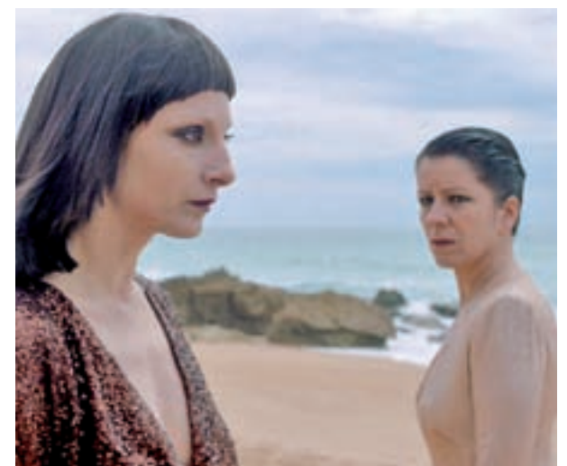
Nimri interpreta a la diva Lilli Cassen

Ahondando en este sentido, los guiños a los amantes de la saga son continuos. Así, Jamie Lee Curtis vuelve a encarnar a Laurie Strode, haciendo gala de la capacidad de supervivencia del único personaje que parece capaz de frenar al sanguinario Michael Myers. A la hora de crear esa atmósfera terrorífica juega un papel notable la ambientación musical, muy en la línea del título original y donde sí ha dejado su sello personal John Carpenter.