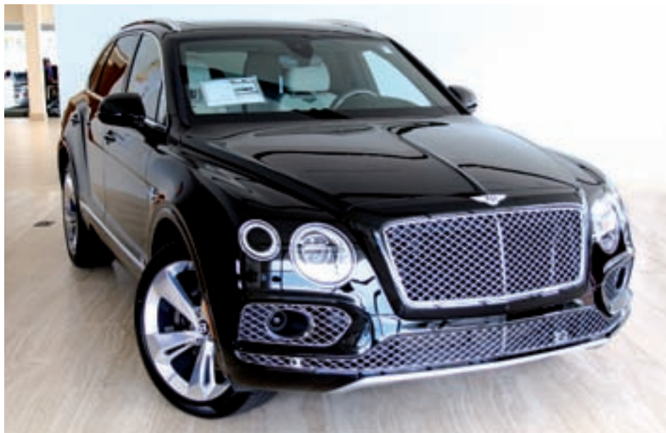
BENTLEY BENTAYGA: La casa británica se lanzó en 2016 a competir de lleno con el Porsche Cayenne y para ello diseñó un 'crossover' de grandes dimensiones (431 litros de maletero y más de 5 metros de longitud) y un motor para grandes desafíos: hasta 608 CV.