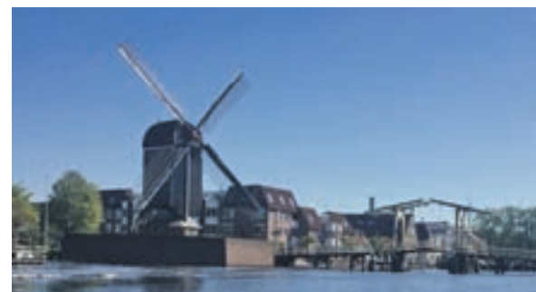
REMBRANDT Y LOS MOLINOS, PROTAGONISTAS: Leiden cobrará protagonismo en 2019 con motivo de la celebración de los 350 años de la muerte del pintor Rembrandt. Arriba, un monumento en su homenaje en la ciudad. Abajo, uno de los molinos que se pueden encontrar navegando por sus canales.