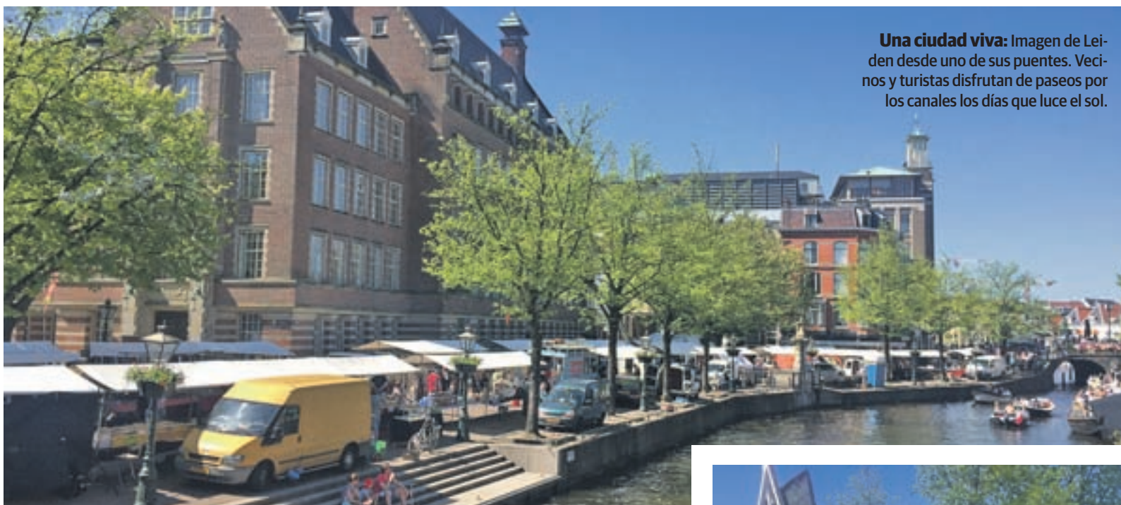
Una ciudad viva: Imagen de Leiden desde uno de sus puentes. Vecinos y turistas disfrutan de paseos por los canales los días que luce el sol.