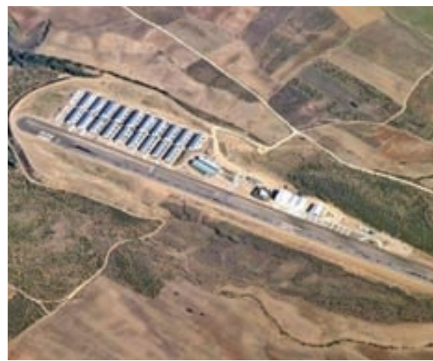
Aeródromo de Barajas

Según detalló la jefa del Ejecutivo andaluz, una vez que se concluya este informe de cuantificación de desperfectos, el Consejo de Ministros aprobará un sistema de ayudas y apoyos para todas las localidades.