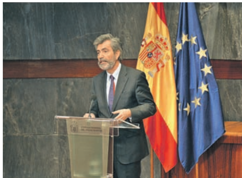
Carlos Lesmes, presidente del Tribunal Supremo

UN TOTAL DE 1,5 MILLONES DE CIUDADANOS PODRÍAN RECLAMARLO