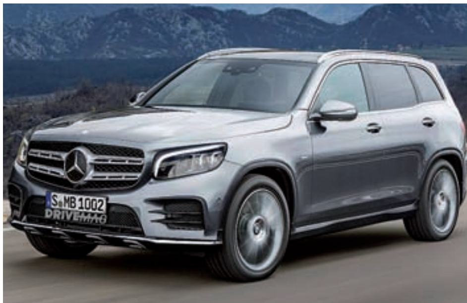
MERCEDES GLB: La oferta de la casa alemana en los modelos SUV se completará en 2019 con un prototipo llamado a situarse entre el Mercedes GLA y el Mercedes GLC. El espacio será la nota predominante en un vehículo que se lanzará al mercado en versiones de 5 y 7 plazas.