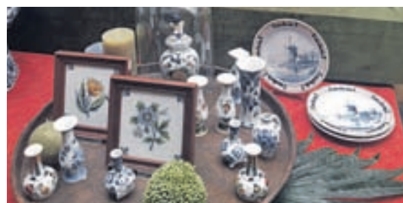
DELFT: Esta ciudad está muy próxima a Leiden en tren. No te la puedes perder. Entre sus atractivos, su Ayuntamiento, sus dos iglesias (la nueva y la vieja) y la Royal Delft, la fábrica de la reconocida mundialmente cerámica azul de Holanda, que se elabora desde el siglo XVI.