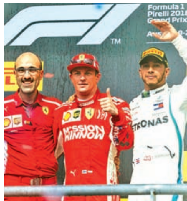
Raikkonen fue el vencedor en Austin

La cruz de la moneda es para Jorge Lorenzo, quien será reemplazado en este GP de Australia por otro español, Álvaro Bautista.