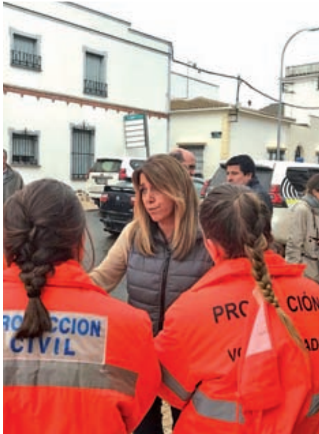
Susana Díaz visitó las zonas afectadas

El pasado lunes se celebraron dos reuniones en Málaga y Sevilla con los alcaldes afectados,