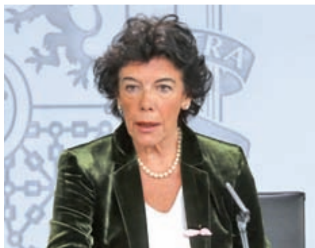
Isabel Celaá en rueda de prensa

"Siempre se referirá a fármacos sujetos a prescripción médica y que se desarrollen con un marcado carácter colaborativo y aparecerán en los protocolos y guías", anunció la portavoz del Gobierno, Isabel Celaá.