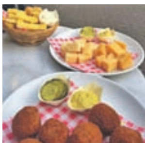
QUÉ COMER: Tres imprescindibles. Los quesos holandeses, los bitterballen, un aperitivo salado cubierto con migas de pan y relleno de carne de vacuno picada, y patatas fritas.