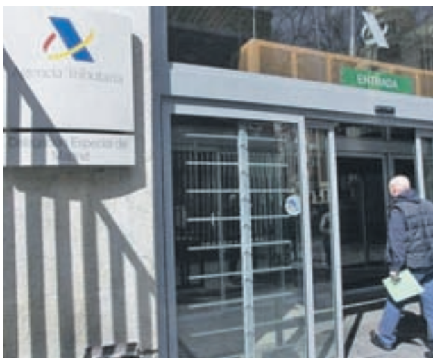
Una sede de la Agencia Tributaria