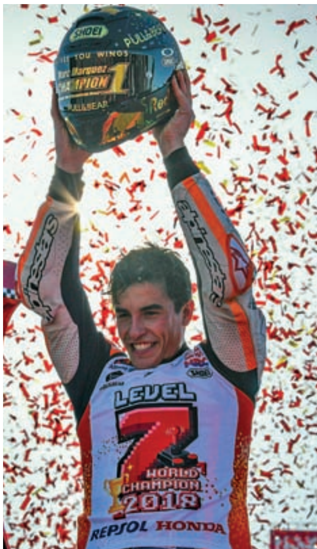
Marc Márquez celebró por todo lo alto su título

Por el momento, ya ha igualado a los británicos John Surtees y Phil Read, aunque ninguno de ellos, tampoco Valentino Rossi, había llegado al pentacampeonato en la categoría reina con los 25