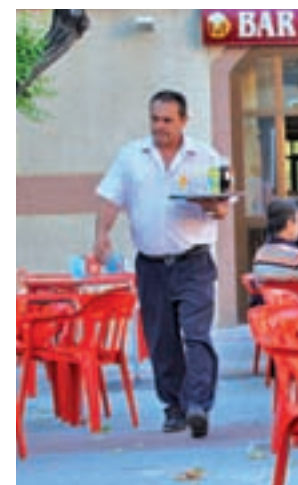
Aumentarán en Hostelería

En concreto, la compañía precisa que en esta campaña se superará por primera vez la barrera de los 400.000 contratos, lo que supone la cifra