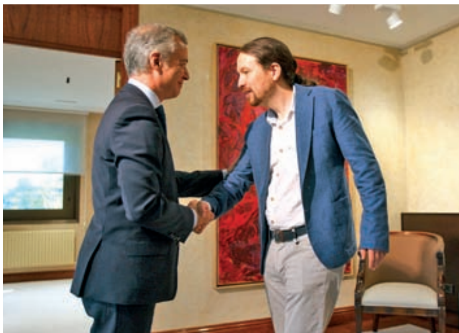
Pablo Iglesias se reunió con el lehendakari vasco

El año 2018, hasta el 14 de octubre, ha sido el segundo ejercicio con menos hectáreas quemadas desde que comenzaron los registros de incendios en España en 1961. En total, desde el 1 de enero, las llamas han arrasado un 80,57% menos de superficie que en el mismo periodo de hace un año, según datos del Ministerio de Agricultura, Alimentación y Pesca.