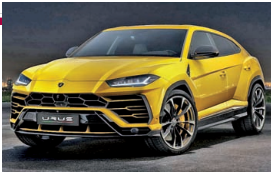
LAMBORGHINI URUS: Espacio, lujo y confort se dan la mano en el modelo con el que el fabricante italiano desembarcaba este 2018 en la feroz competencia comercial de los SUV. Dotado con un motor de 650 CV, el URUS presenta una línea exterior muy deportiva.

EL TIGUAN Y EL XC40 SIGUEN TENIENDO UNA GRAN ACOGIDA EN EL PÚBLICO