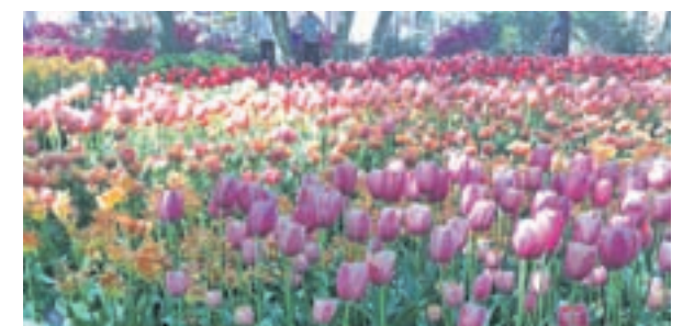
KEUKENHOF: Muy atentos porque solo abre 8 semanas al año, entre finales de marzo y mayo, pero es visita obligada. Se trata de un parque con 7 millones de bulbos de flores cada año. Los tulipanes son los grandes protagonistas de este espacio histórico de 1857.