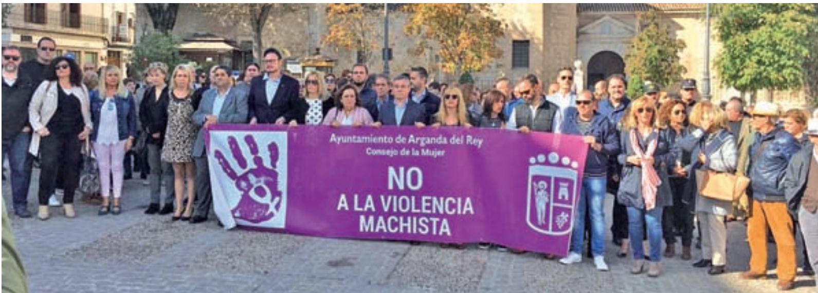
Minuto de silencio en recuerdo a la última víctima de violencia de género en la localidad madrileña de Arganda del Rey