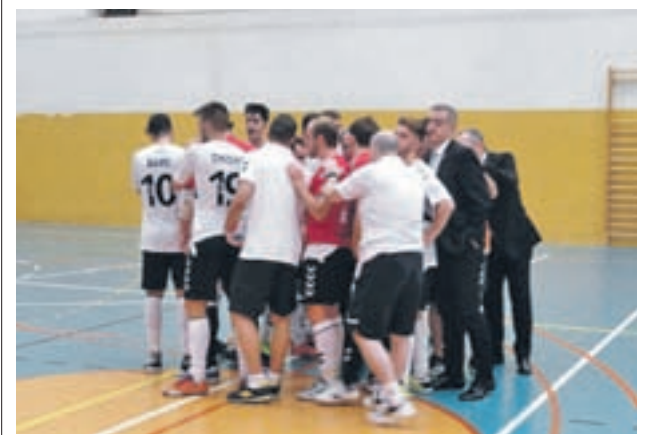
El Rivas encajó su primera derrota del curso