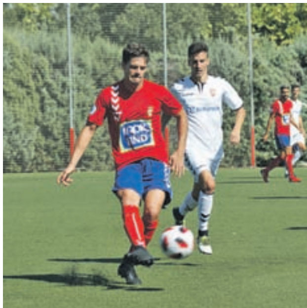
El Alcalá cayó por 1-0 en su visita al Alcobendas Sport

Caer derrotado en el campo del líder, el Alcobendas Sport, no es un resultado del todo inesperado para cualquier competidor del Grupo VII de Tercera División. Sin embargo, más allá del 1-0 en contra, la peor lectura para la Real Sociedad Deportiva Alcalá es que, actualmente, ocupa puestos de descenso a Preferente. Un balance de 5 puntos