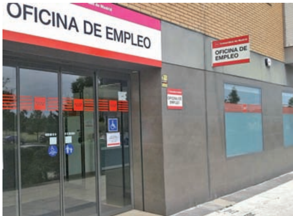
Oficina de Empleo de la Comunidad de Madrid

Destacable es también, si nos atenemos a la diferencia entre ambos sexos, lo que ocurre en Rivas Vaciamadrid, donde el porcentaje es incluso mayor, con un 61% de mujeres en situación de desempleo. El sector Servicios congrega en este caso al 80% de parados de la localidad, la inmensa mayoría.