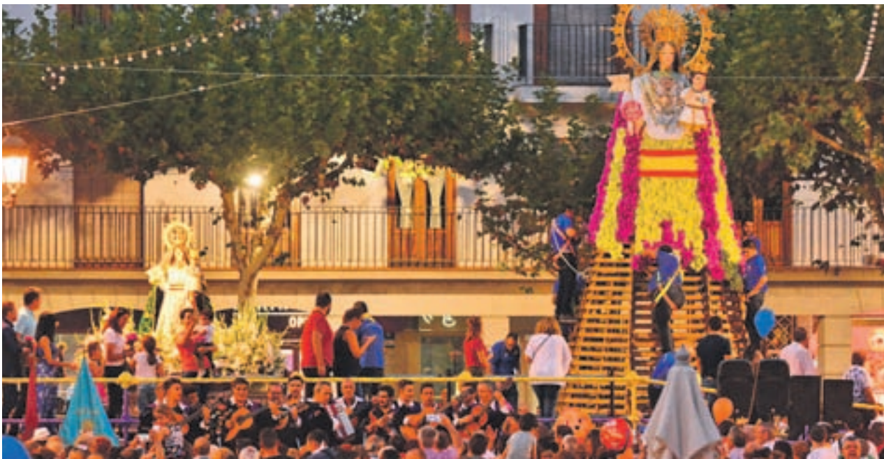
La ofrenda floral reúne a miles de vecinos cada año