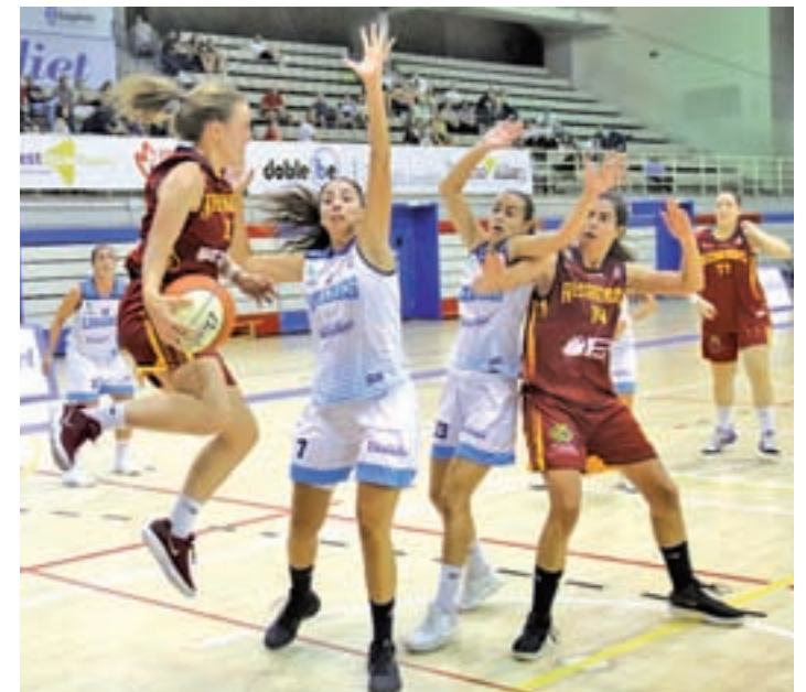
Toma de contacto: El pabellón Europa de Leganés acogió recientemente el Torneo de Liga Femenina 2 de la FBM, desde este año Memorial Juan Martín Caño. El título se lo llevó el equipo local, Laboratorios Ynsadiet.