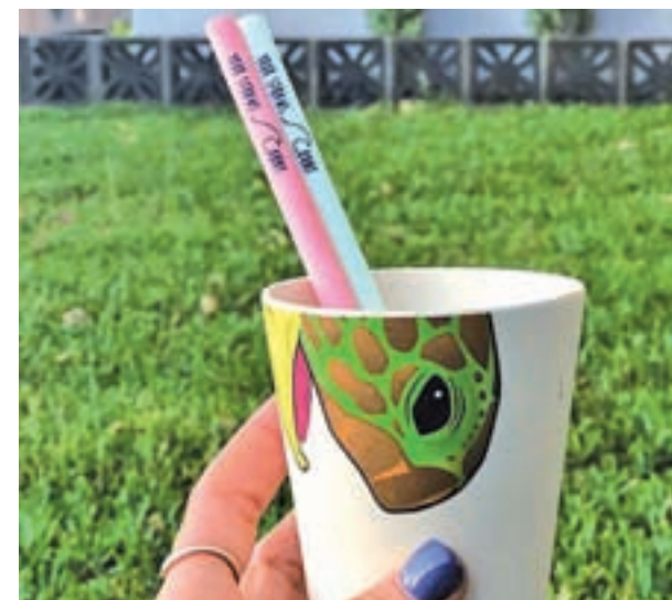
Primera pajita comestible

Toda la información relativa a los establecimientos participantes en la iniciativa, recetas, cócteles, horarios y precios, para que puedas hacer tu propio itinerario, está disponible en la web Hoteltapatour.com .