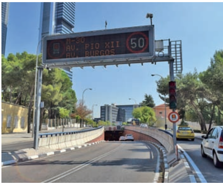
Túnel de Pío XII