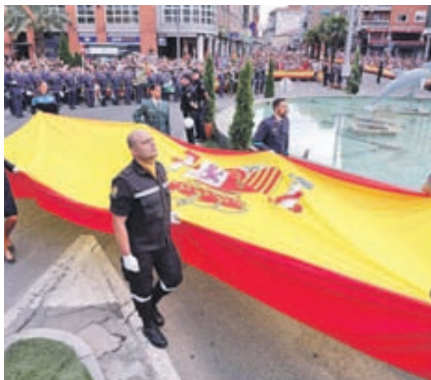
Homenaje a la Bandera: El domingo 7 de octubre será el turno para el Homenaje a la Bandera, donde todos los asistentes podrán además contemplar el desfile tanto aéreo como terrestre que tendrá lugar en la Plaza de España y en la avenida de la Constitución.

No podía faltar el exitoso encuentro de Gigantes y Cabezudos, que este año vivirá su quinta edición. Se trata de la cita más importante de este tipo de cuantas se celebran en la Comunidad de Madrid, donde participarán 14 com-