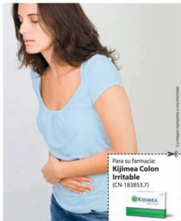
La imagen representa a una afectada

bifidobacterias contenida en Kijimea Colon Irritable se pudieron aliviar significativamente las típicas molestias que sufren los afectados del colon irritable. En algunos casos, estas molestias incluso desaparecieron. Aún más: La calidad de vida de los afectados mejoró significativamente. Kijimea Colon Irritable no necesita receta médica y puede adquirirse en farmacias. Además, no se conocen efectos secundarios.