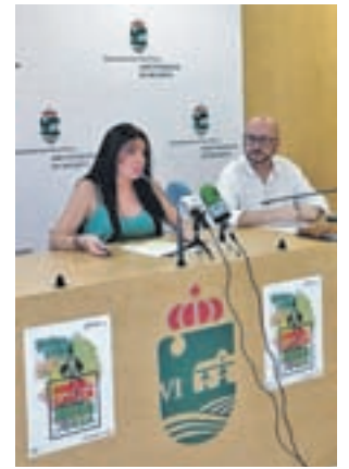
Presentación de la iniciativa

GENTE El Ayuntamiento de San Fernando de Henares lanza #JuegaenCasaCompraenSanfer, una campaña bajo el paraguas de #SienteSanfer, que busca promover entre los vecinos el hábito del consumo local. La iniciativa se desarrollará durante el último trimestre del año, por ser un periodo de gran dinamización comercial, y los objetivos de son promover y desmitificar el comercio local, además de concienciar sobre la obligación de cobro de bolsas de plástico por parte de los comerciantes y su impacto medioambiental dentro del municipio.