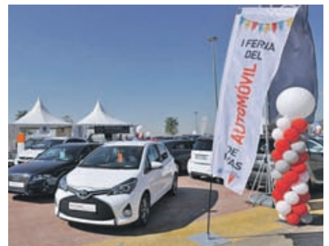
Una de las ferias anteriores

En su segunda edición, celebrada en 2017, acudieron a la feria 12.000 visitantes (3.000 más que en 2016), se vendieron 137 coches (15% de incremento) y se reunieron 15 concesionarios y unos 600 vehículos.