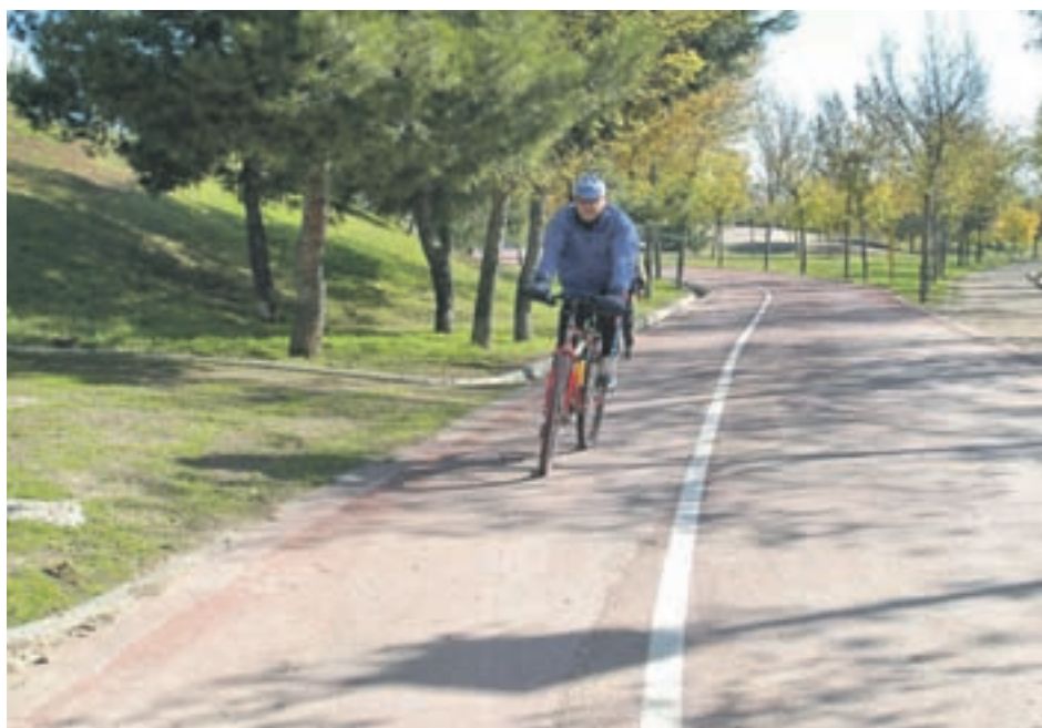
Un tramo del Anillo Verde Ciclista de Madrid

“La zona tiene una gran tradición ciclista de montaña y carretera, pero la ejecución del nudo de conexión entre la M-30, M-40 y M-605 ha dificultado mucho la presencia de bicis en este itinerario. La