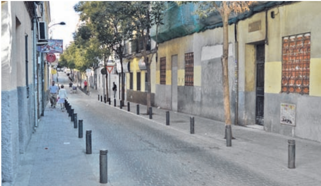
ANA CID / GENTE

Las obras continuarán por la noche durante las próximas semanas ● El Ayuntamiento ha realizado estos trabajos para evitar las humedades