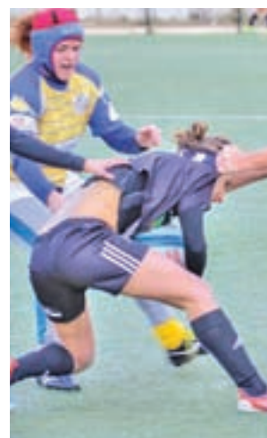
Otro partido como local

Esa mejoría intentarán plasmarla en una victoria este domingo 7 (12 horas) en su propio campo. En esta ocasión, su rival será otro de los representantes madrileños en la máxima categoría, el CR Majadahonda, colíder de la Liga Iberdrola, junto al Cisneros, con 9 puntos.