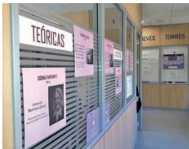
El interior del nuevo recurso

municipales, en la construcción de una igualdad de género real y efectiva. Se trata del nuevo Espacio de Igualdad Nieves Torres, situado en el Centro Socio Comunitario Colonias Históricas (calle de Enrique Jardiel Poncela, 9).