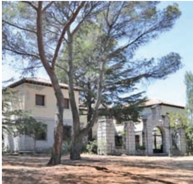
El Palacio Valdés de Tres Cantos

Así lo han confirmado fuentes del Gobierno regional a GENTE, que aseguran que están esperando únicamente a que les llegue el documento del Consistorio de la capital que recoge el uso de este