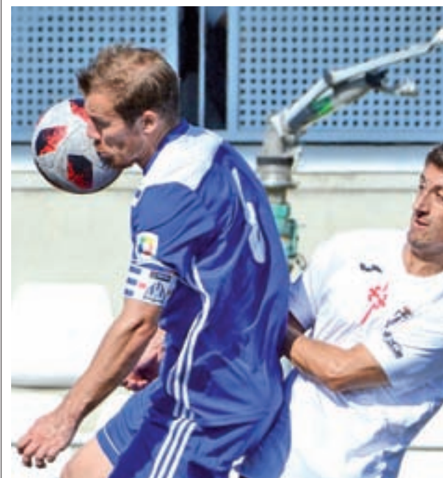
El Canillas sacó un punto de La Mina REAL CARABANCHEL

Por su parte, el Adarve tratará de sumar la segunda victoria del curso, después de la derrota encajada el pasado fin de semana en el campo del Guijuelo. Los madrileños tienen sólo un punto de ventaja respecto al descenso.