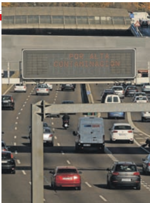
El nuevo protocolo entra en vigor el día 8

Además, el Ayuntamiento de Madrid incluye un nuevo escenario, el cuarto, y prohíbe en el quinto aparcar en la zona SER (Servicio de