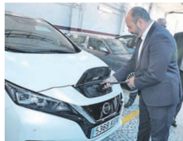
El vicepresidente regional, Pedro Rollán, recarga un coche

En cualquier caso, el consejero aseguró que la Comunidad de Madrid es "realista" en este asunto, ya que la penetración actual de este tipo de coches y motocicletas en la región es "de apenas el 2%". En este sentido, apuntó que es clave "tener visión de futuro" e "ir de la mano" de la tecnología a la hora de reducir las emisiones de CO 2 .