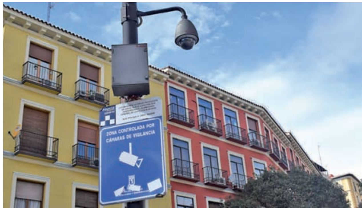
Una de las cámaras de vigilancia que funciona en el distrito Centro

EL CONSISTORIO DIJO EN AGOSTO QUE EL PROCESO SIGUE SU CURSO LEGAL