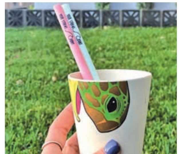
Primera pajita comestible

Toda la información relativa a los establecimientos participantes en la iniciativa, recetas, cócteles, horarios y precios, para que puedas hacer tu propio itinerario, está disponible en la web Hoteltapatur.com .