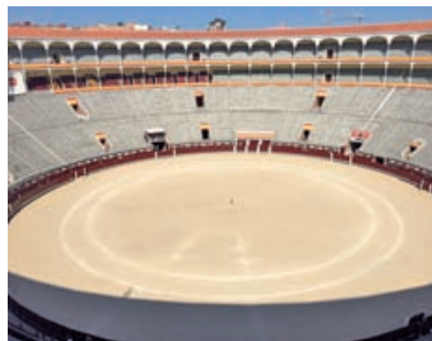
Plaza de toros de Las Ventas

Las siguientes intervenciones que se llevarán a cabo consistirán en la ampliación de asientos, pasillos y escaleras de gradas, lo que mejorará tanto la comodidad de los espectadores como las condiciones de seguridad, utilización de las instalaciones y de evacuación.