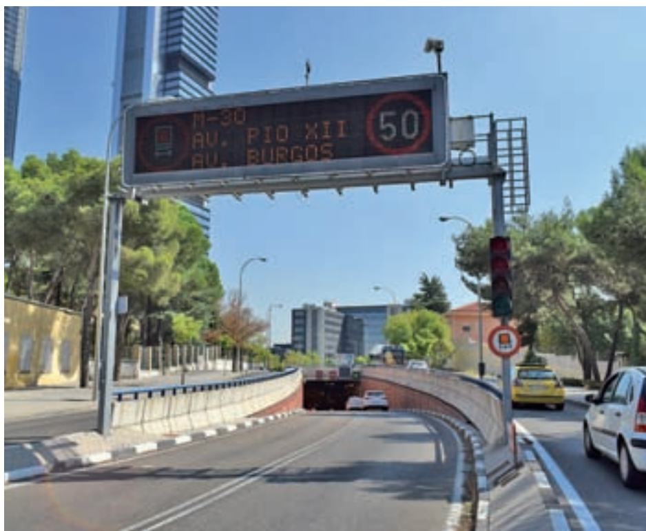
Túnel de Pío XII