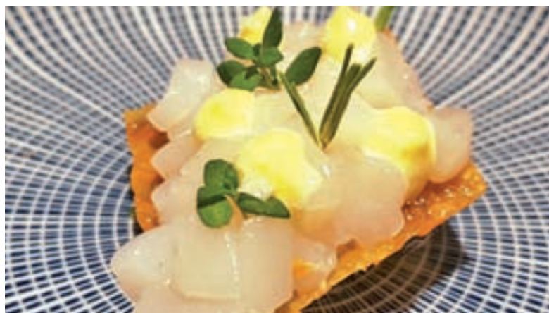
Las mejores tapas en los mejores hoteles