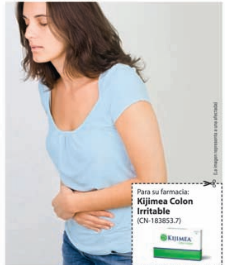
La imagen representa a una afectada

bifidobacterias contenida en Kijimea Colon Irritable se pudieron aliviar significativamente las típicas molestias que sufren los afectados del colon irritable. En algunos casos, estas molestias incluso desaparecieron. Aún más: La calidad de vida de los afectados mejoró significativamente. Kijimea Colon Irritable no necesita receta médica y puede adquirirse en farmacias. Además, no se conocen efectos secundarios.