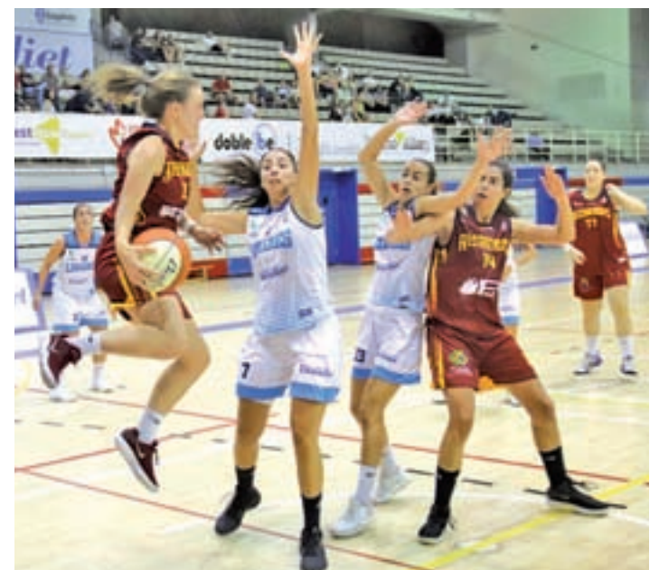
Toma de contacto: El pabellón Europa de Leganés acogió recientemente el Torneo de Liga Femenina 2 de la FBM, desde este año Memorial Juan Martín Caño. El título se lo llevó el equipo local, Laboratorios Ynsadiet.