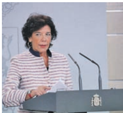
La ministra d'Educació Isabel Celaá.

EL PERIÓDICO GENTE NO SE RESPONSABILIZA NI SE IDENTIFICA CON LAS OPINIONES QUE SUS LECTORES Y COLABORADORES EXPONGAN EN SUS CARTAS Y ARTÍCULOS