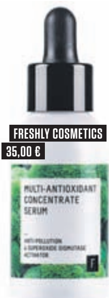
FRESHLY COSMETICS 35,00 €