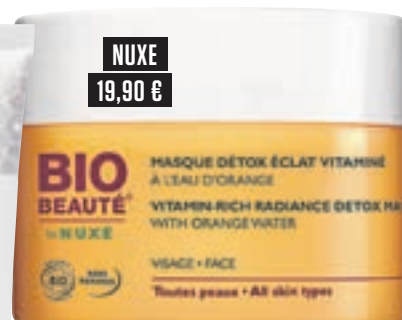
NUXE 19,90 €