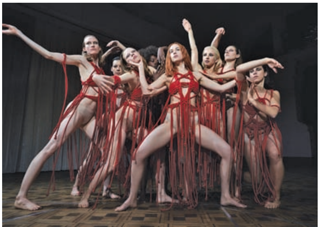
'Suspiria', dirigit per Luca Guadagnino, ha inaugurat el Festival de Sitges 2018. ACN

de terror, que repassarà les bandes sonores de les seves pel·lícules, entre les que destaca 'La noche de Halloween', que celebrarà el seu 40è aniversari al certamen. Aquest serà l'únic espectacle del director i compositor a Espanya.