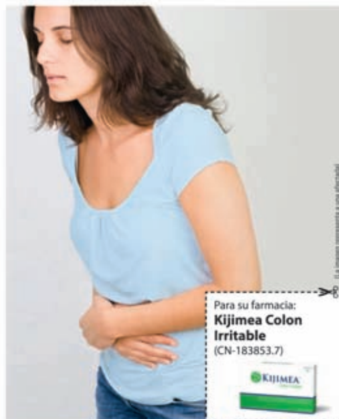
La imagen representa a una afectada

bifidobacterias contenida en Kijimea Colon Irritable se pudieron aliviar significativamente las típicas molestias que sufren los afectados del colon irritable. En algunos casos, estas molestias incluso desaparecieron. Aún más: La calidad de vida de los afectados mejoró significativamente. Kijimea Colon Irritable no necesita receta médica y puede adquirirse en farmacias. Además, no se conocen efectos secundarios.