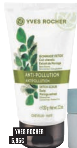
YVES ROCHER 5,95 €