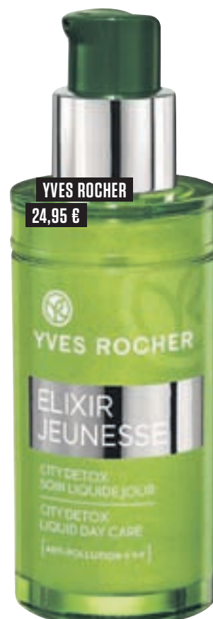
YVES ROCHER 24,95 €