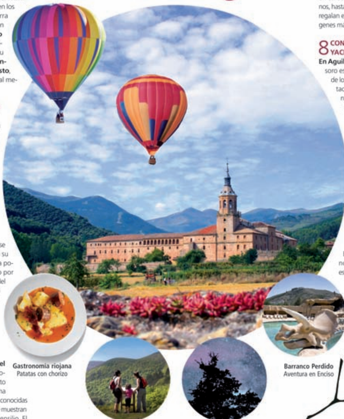
Gastronomía riojana Patatas con chorizo

En los Cameros, la villa de Ortigosa nos permite asomarnos a un enclave espectacular, el macizo del Encinedo desde el que se divisa un monte poblado de encinas formadas en el período jurásico . En sus entrañas guarda un maravilloso espectáculo obra de la naturaleza: una cantera que dejó de explotarse hace casi cincuenta años. En su interior, y gracias al efecto del agua, se ha formado un conjunto de columnas y estalactitas que las han convertido en unas cuevas de visita obligada.