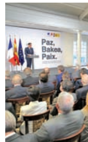
Acto en La Moncloa

Durante el acto celebrado en el Palacio de la Moncloa, el presidente del Gobierno recibió de manos de Philippe más de 8.000 efectos y documentos incautados a la banda terrorista en operaciones a cargo de los Cuerpos y Fuerzas de Seguridad francesas. "Resistimos primero y al final ganamos desde el Estado de Derecho y con el compromiso de la sociedad vasca y española", dijo Sánchez.