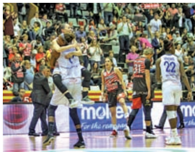
El Perfumerías Avenida logró el 'doblete'

El choque se jugará en Torrejón de Ardoz (Madrid), en el pabellón que lleva el nombre del actual presidente de la Federación Española de Baloncesto, Jorge Garbajosa, y en él se verán las caras el Perfumerías Avenida, ganador