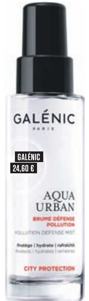
GALÉNIC 24,60 €