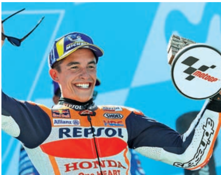
Márquez se subió a lo más alto del podio en el GP de Aragón

Uno de los integrantes de esa marca, Jorge Lorenzo, ha pasado los últimos días apu-