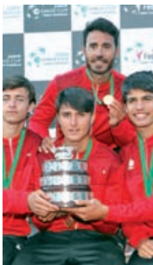
Entrega de trofeos