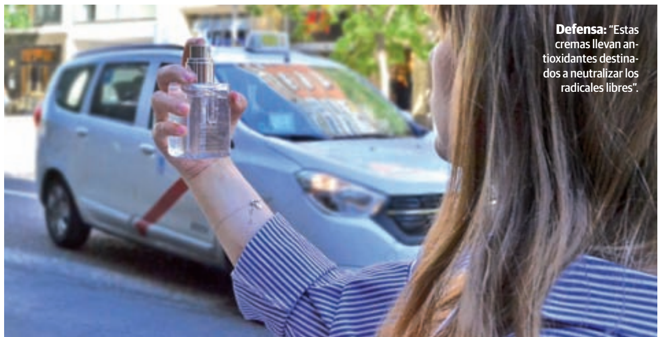
Defensa: "Estas cremas llevan antioxidantes destinados a neutralizar los radicales libres".