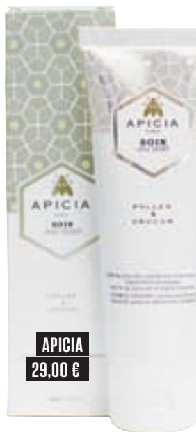
APICIA 29,00 €