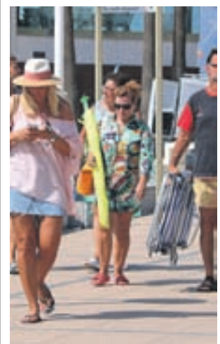
Turistes a Cambrils.

Els botiguers esperen incrementar les seves vendes amb l'ús de la moneda, però pels usuaris utilitzar el rec "és una mena d'autoobligació" o "autocompromís" per tal de comprometre's amb "un canvi del model econòmic i financer".