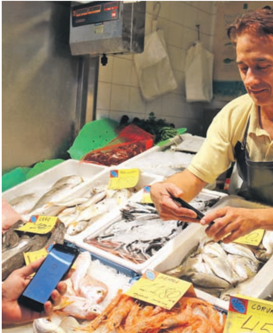
Un comerciant del Mercat del Besòs mostra l'aplicació per pagar amb la nova moneda.

El rec s'utilitza a través d'una aplicació mòbil que es pot descarregar des de Google Play. És una moneda digital basada en la tecnologia blockchain, que s'utilitza a través d'una aplicació mòbil per fer pagaments de forma instantània i sense costos. Els