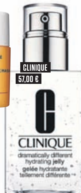
CLINIQUE 57,00 €