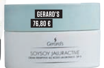
GERARD'S 76,80 €