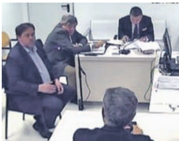
L'exvicepresident Oriol Junqueras declarant a l'Audiència.

"Els fins del procés i, de manera especial, les mesures cautelars que tendeixen a assegurar aquests fins, no es desdibuixen pels patiments que en l'ordre familiar pugui ocasionar la privació de llibertat", argumenta el tribunal.