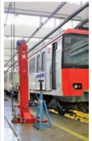
Un convoi en un taller.

l'obertura dels coneguts com a 'pisos rusc' i ha instat la Generalitat a modificar la llei per tal d'evitar que aquests habitatges proliferin. A través d'una moció presentada pel grup municipal de CiU, el Ple també ha estès la mà al Govern per establir un conveni o protocol d'actuació entre les dues administracions que permeti detectar "infrahabitatges, habitatges 'rusc'".