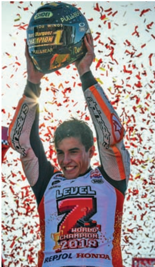
Marc Márquez celebró por todo lo alto su título

Por el momento, ya ha igualado a los británicos John Surtees y Phil Read, aunque ninguno de ellos, tampoco Valentino Rossi, había llegado al pentacampeonato en la categoría reina con los 25