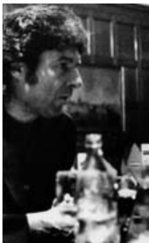
Un dels documentals.

alguns dels seus títols més significatius. Paral·lelament, també es commemorarà el 50 aniversari de la revista de manga Shonen Jump, una publicació que va presentar sèries com Naruto, One Piece o Bola de Drac.