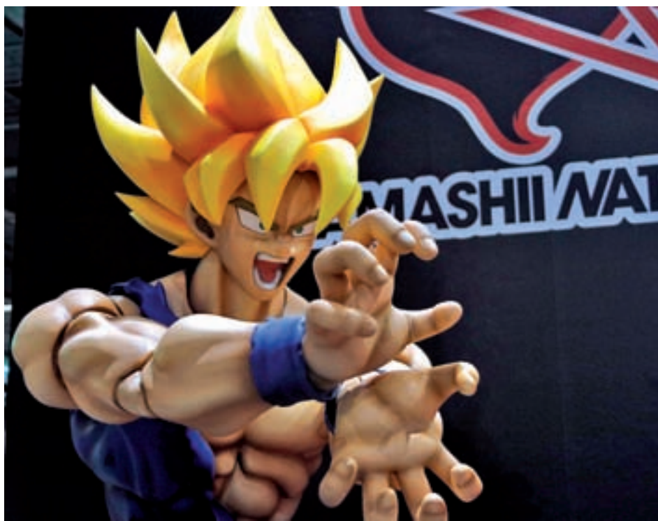
Una figura de Goku, al XXIII Saló del Manga de Barcelona del 2017.

De fet, enguany l'organització vol donar molt més protagonisme al públic i per aquesta raó s'han programat més activitats participatives que mai. A més, destaca l'espai infantil Manga Kids, on els més petits es podran introduir en la lectura de manga.