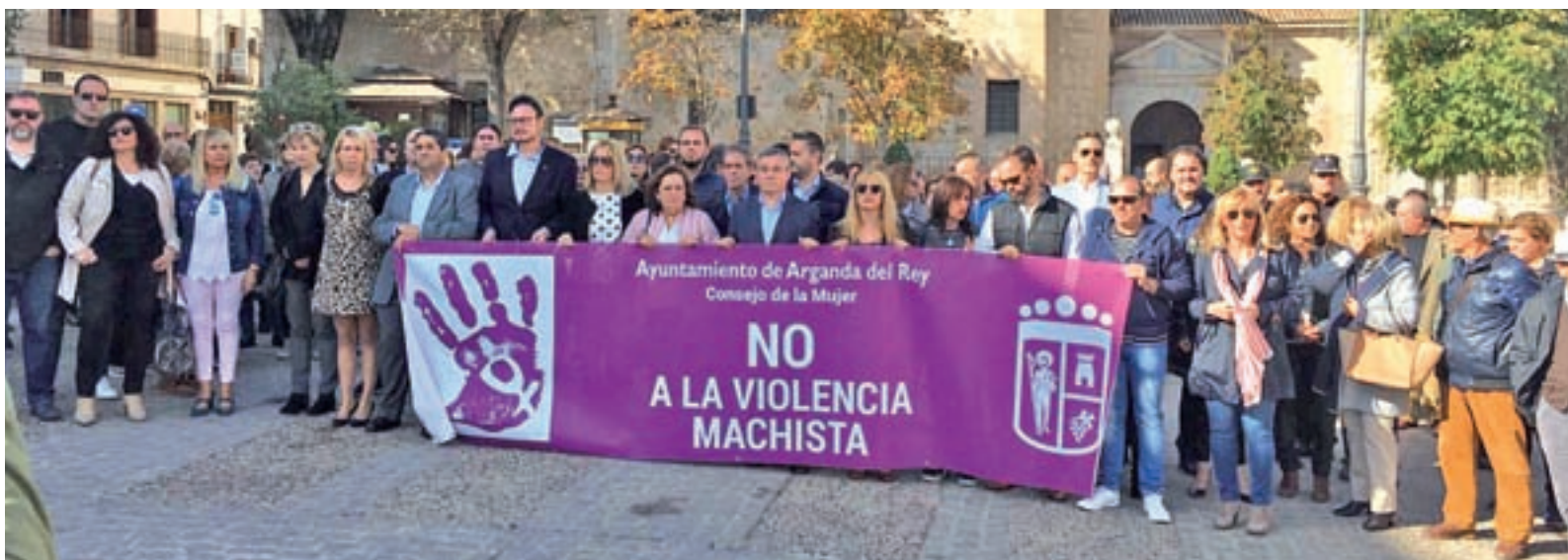
Minuto de silencio en recuerdo a la última víctima de violencia de género en la localidad madrileña de Arganda del Rey