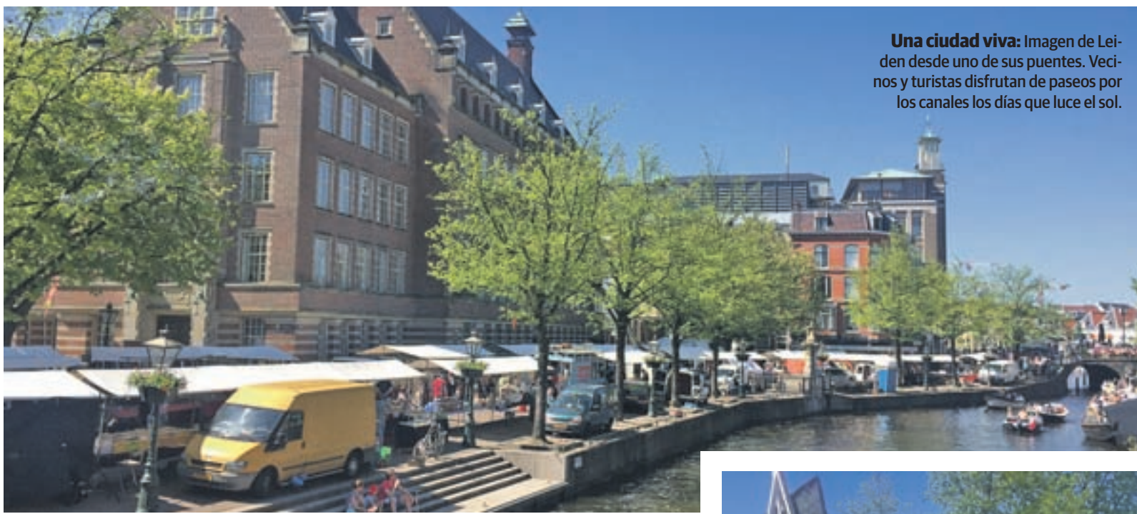
Una ciudad viva: Imagen de Leiden desde uno de sus puentes. Vecinos y turistas disfrutan de paseos por los canales los días que luce el sol.