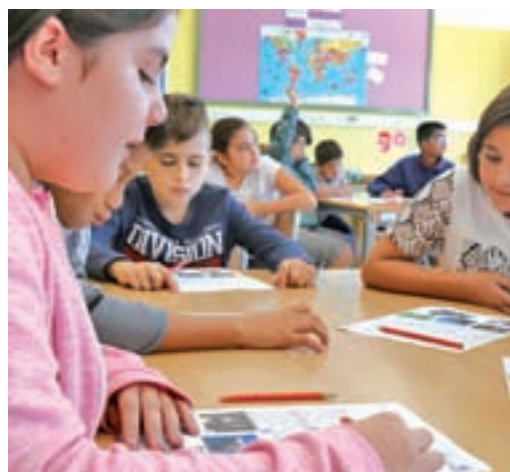
Una alumna de l'escola Llibertat.

EL PERIÓDICO GENTE NO SE RESPONSABILIZA NI SE IDENTIFICA CON LAS OPINIONES QUE SUS LECTORES Y COLABORADORES EXPONGAN EN SUS CARTAS Y ARTÍCULOS