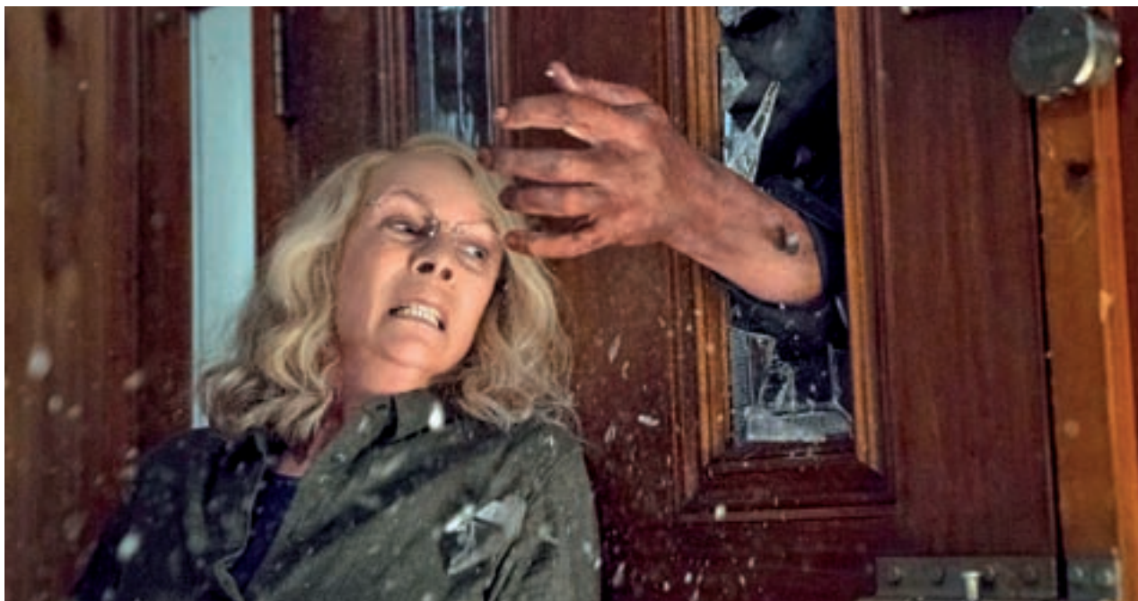
Jamie Lee Curtis se reencuentra con el sanguinario Michael Myers

Najwa Nimri encarna a Lilli Cassen, una diva musical sobre la que planea la sombra del retiro que se aferra a los conocimientos de Violeta, la dueña de un karaoke que es su mayor fan. Entre ellas dos dan aplomo a un film por momentos crítico y por otros realmente emotivo.