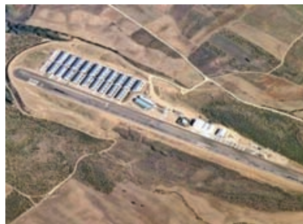
Aeródromo de Barajas

El pasado lunes se celebraron dos reuniones en Málaga y Sevilla con los alcaldes afectados, la subdelegación del Gobierno, la Delegación de la Junta y las diputaciones provinciales para hacer evaluación de daños, tal y como explicó la presidenta de la Junta de Andalucía, Susana Díaz, desde Osuna (Sevilla), una de las localidades víctima del temporal.