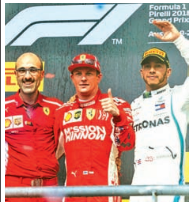
Raikkonen fue el vencedor en Austin

La cruz de la moneda es para Jorge Lorenzo, quien será reemplazado en este GP de Australia por otro español, Álvaro Bautista.