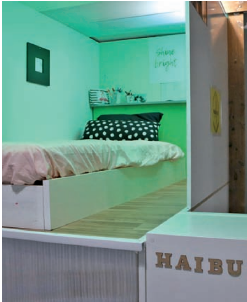
Pla d'una habitació d'un 'pisos rusc' a l'espai expositiu de Haibu 4.0.

Segons el gerent de l'empresa promotora dels 'pisos rusc' a la capital catalana, a mida que les tinguin acabades aniran "allotjant a les persones". Actualment tenen tres locals "pràcticament acabats" i un edifici de set plantes que