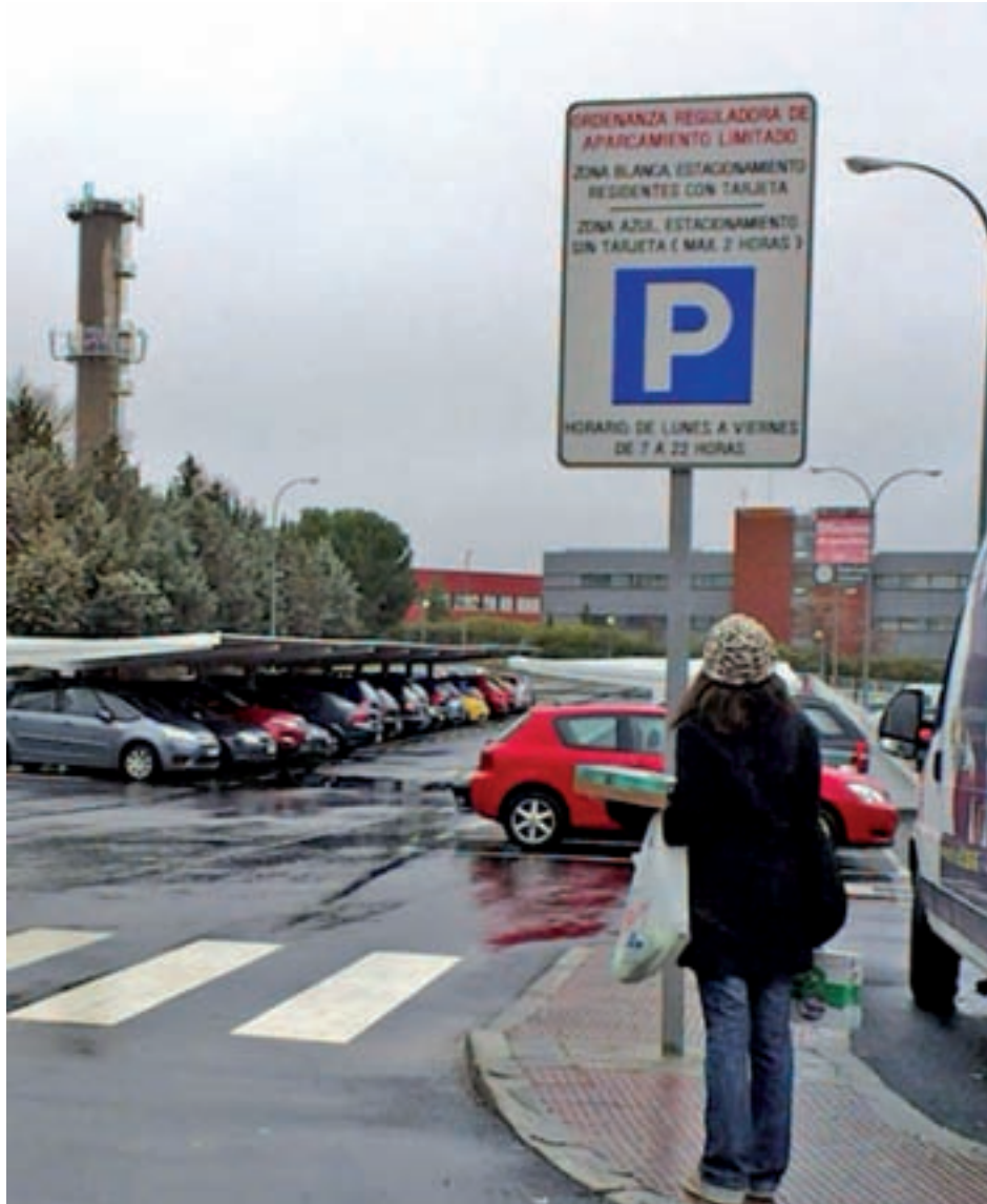
El aparcamiento de la estación

Estas mismas condiciones se aplicarán, como ya se acordó anteriormente, en la avenida de Colmenar Viejo, en la zona centro de la ciudad y en la avenida de Viñuelas, extendiéndose esta nueva nor-