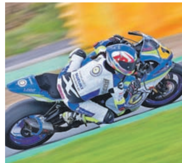
Juarranz, durante una de las pruebas

siones previas de entrenamiento”. Hablando de la preparación, la soriana hace especial hincapié en la necesidad de educar al cuerpo para manejar una moto que, en su caso, es de 1.000 centímetros cúbicos, y al mismo tiempo prepararse psicológicamente; “hay que estar al cien por cien en ambas facetas”, todo pensando en su gran sueño y objetivo como piloto: codearse con los mejores, independientemente del sexo.