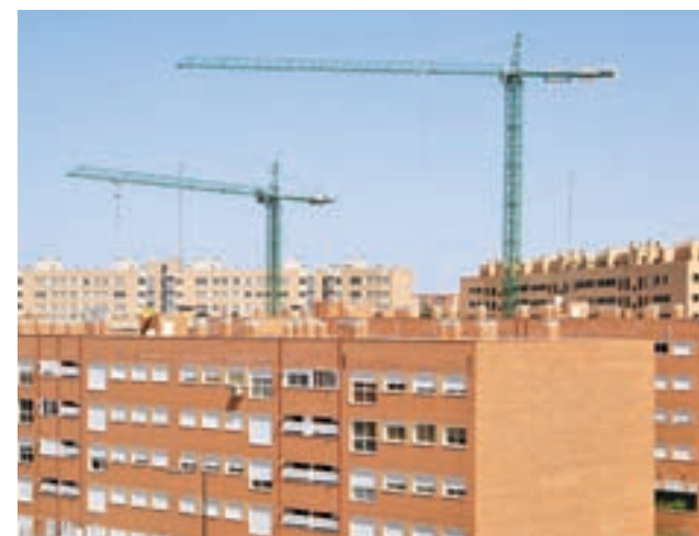
El 'stock' de vivienda nueva podría agotarse GENTE

No obstante, detecta una "diversidad muy notable de plazos" con casos "verdaderamente significativos por la enorme demora que sufra la tramitación de licencias" y que llevan a un "verdadero bloqueo" en la promoción.