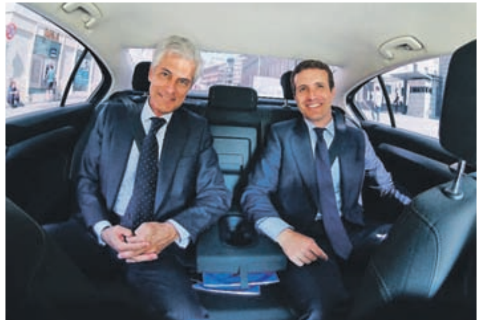
Pablo Casado junto a Adolfo Suárez Illana tras un acto celebrado el pasado lunes

El sábado se despejarán todas las incógnitas que están sobre la mesa.