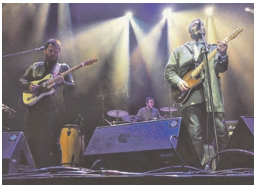
La habitación Roja