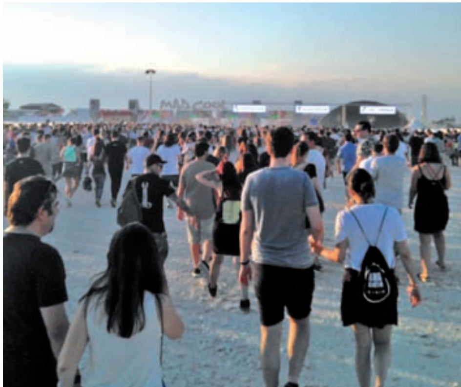
Acceso peatonal al recinto desde Campo de las Naciones GENTE

Echando la vista atrás, en los días previos a su celebración el festival ya había sembrado algunas dudas. Para empezar, uno de los quebraderos de cabeza iniciales estaba en el transporte, un obstáculo que se salvó por el refuerzo del servicio de determinadas líneas de la EMT y la apertura 24 horas de la Línea 8 de Metro de Madrid. Eso sí, incluso en este aspecto hubo algún déficit. Los usuarios se encontraron, al llegar al andén de la estación de Feria de Madrid, con que los trenes sólo circulaban hasta Nuevos Ministerios, siendo informados por operarios de Metro de que la confusión se había creado por la información facilitada por los organizadores del festival. Ante esta situación se disparó el uso de otro tipo de transporte, como el