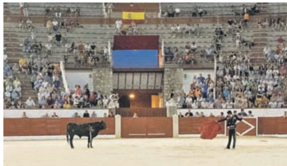
También torearán algunas de las figuras emergentes

Los eventos taurinos tendrán lugar entre los días