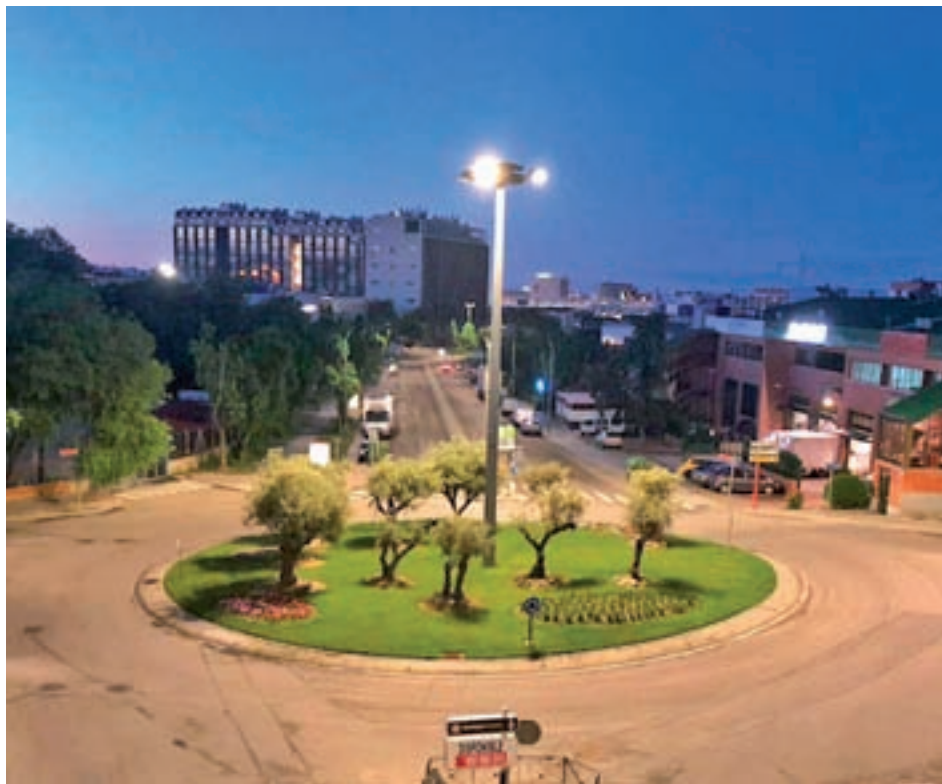
Una de las rotondas con iluminación LED

Hay que recordar que el Ayuntamiento de San Sebastián de los Reyes acometió durante el año 2016 un plan de renovación de los recursos