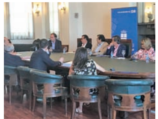
El jurado ha elegido al ganador por unanimidad

El I Premio de Narrativa Alcobendas Juan Goytisolo, que convoca el Ayuntamiento de Alcobendas con la colaboración de Galaxia Gutenberg, promueve la creación literaria como una forma artística que puede ayudar a las personas a entender el mundo con toda su complejidad.