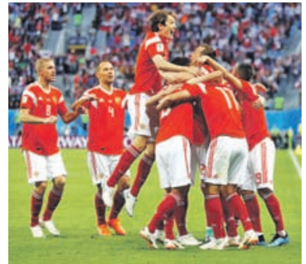
Los anfitriones han logrado seis puntos en su grupo

pulento delantero Artem Dzyuba. Ellos han puesto buena parte de los goles en un equipo que llevaba sin pasar una fase de grupos en una gran competición desde la Eurocopa de 2008. En ese torneo los hombres que dirigía Guus Hiddink llegaron hasta semifinales, donde se toparon con España. De aquella generación han desaparecido casi todos los jugadores, como Arhavin, pero aún quedan tres nombres: el guardameta Akinfeev y los defensas Ignashevich y Yuri Zhirkov.