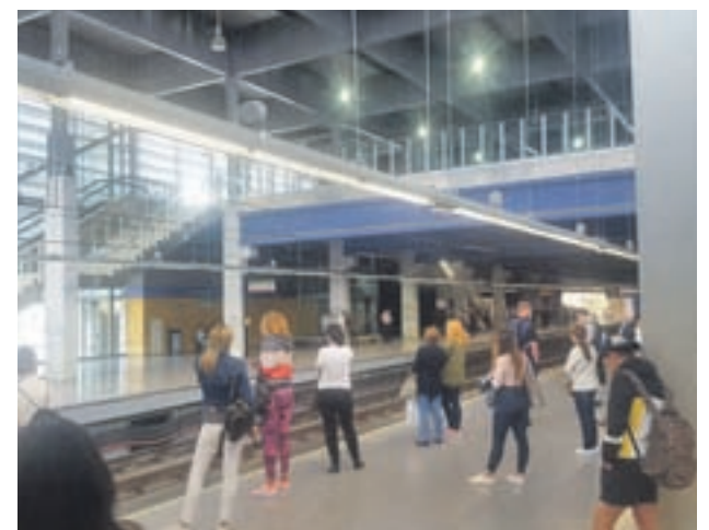
Estación de Rivas Futura GENTE

Las obras se desarrollarán en dos fases: la primera será del 30 de junio al 4 de agosto, durante la cual se cerrará el tramo entre Arganda del Rey y Rivas Vaciamadrid. La segunda, desde el 4 de agosto hasta principios de septiembre, que incluirá el cierre de las estaciones de Rivas Futura y Rivas Urbanizaciones.