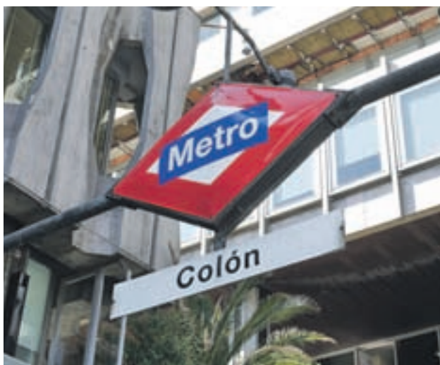
Cartel en la estación de Metro de Colón