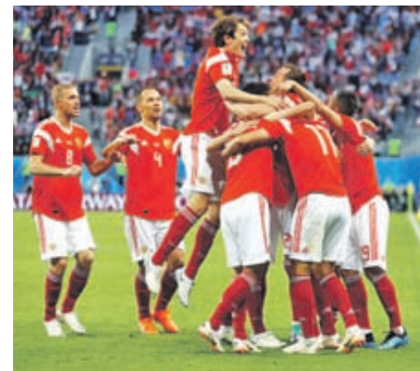
Los anfitriones han logrado seis puntos en su grupo

pulento delantero Artem Dzyuba. Ellos han puesto buena parte de los goles en un equipo que llevaba sin pasar una fase de grupos en una gran competición desde la Eurocopa de 2008. En ese torneo los hombres que dirigía Guus Hiddink llegaron hasta semifinales, donde se toparon con España. De aquella generación han desaparecido casi todos los jugadores, como Arhavin, pero aún quedan tres nombres: el guardameta Akinfeev y los defensas Ignashevich y Yuri Zhirkov.