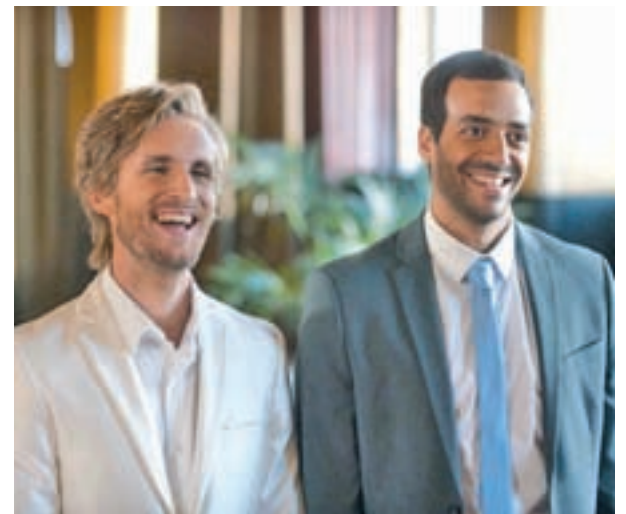
Philippe Lacheau y Tarek Boudali

que ha sido tomada como rehén por el Gobierno norteamericano en la guerra contra los cárteles mexicanos. Ese contraste entre la inocencia de Moner y la fiera de Del Toro le dan solidez a una película que invita a ser visionada en una sala de cine, especialmente por unas secuencias en las que los tiros y la acción agitan al espectador en su butaca.