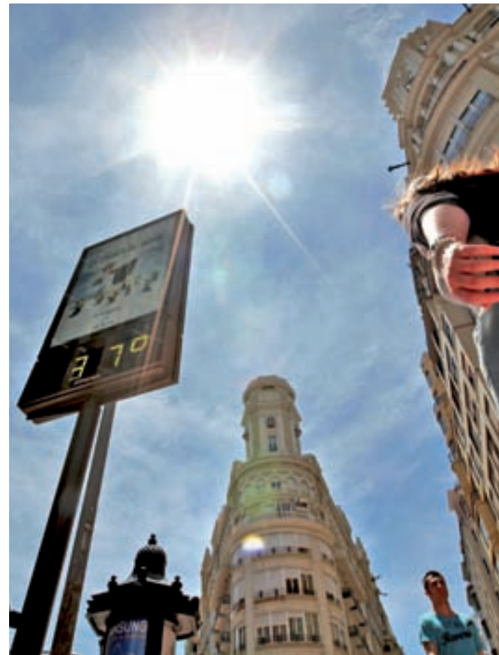
Los termómetros no subirán tanto como en otros años

La predicción de Torres llegó después de un repaso a una