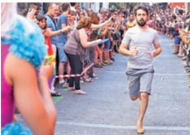
La carrera de tacones tiene muchos adeptos MADRID ORGULLO

El 25 de junio de 1978 Madrid acogió la que sería la primera manifestación del Orgullo. Unas 7.000 personas marcharon por la zona de Retiro para deman-