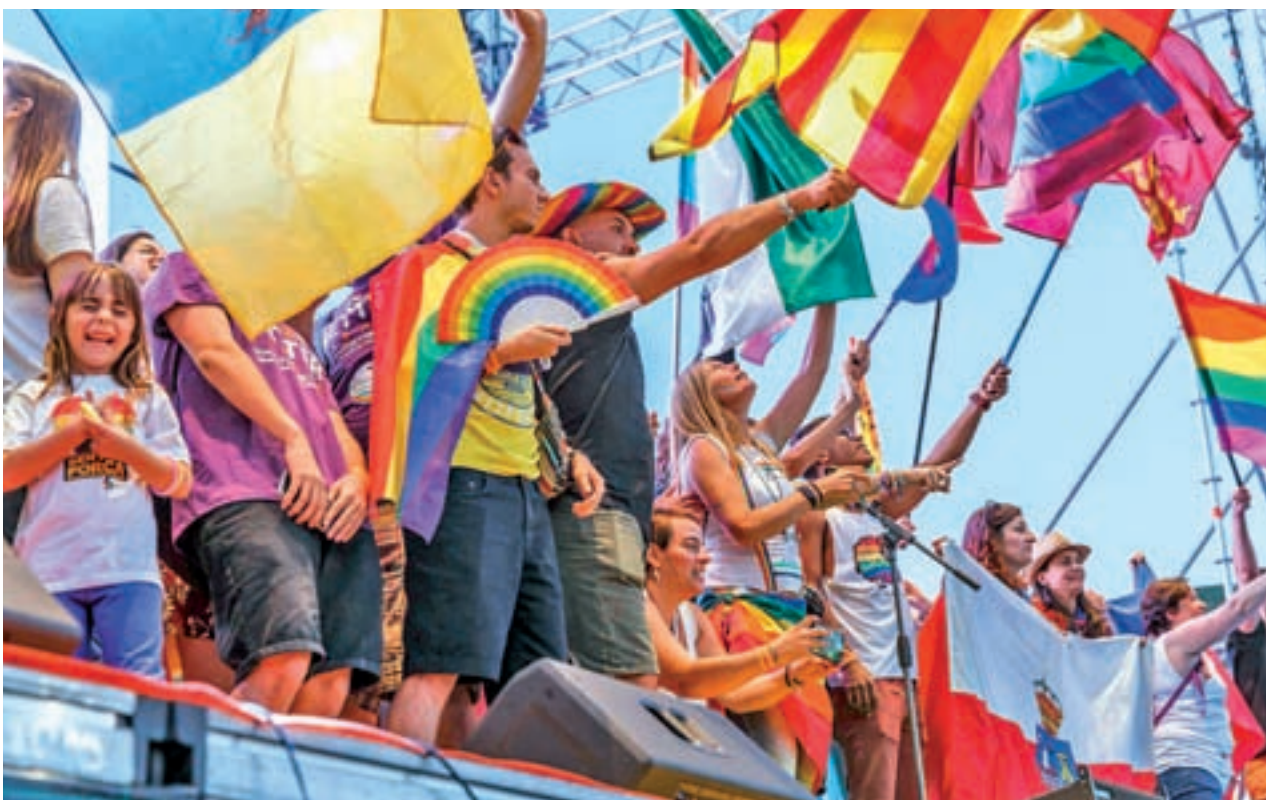
Manifestación por los derechos de las personas trans