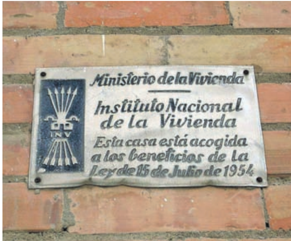
Placa que aún se puede ver en muchas calles, pueblos y ciudades de España

A partir de la aprobación en pleno de este catálogo, se procederá, previo acuerdo de la Comisión creada al efecto, al renombramiento de las calles afectadas, que son un total de siete en todo el municipio. Por lo que respecta al título de alcalde honorífico de Franco, su revocación es inmediata, mientras que para la eliminación de las placas con simbología falangista, la Administración municipal enviará un requerimiento a las