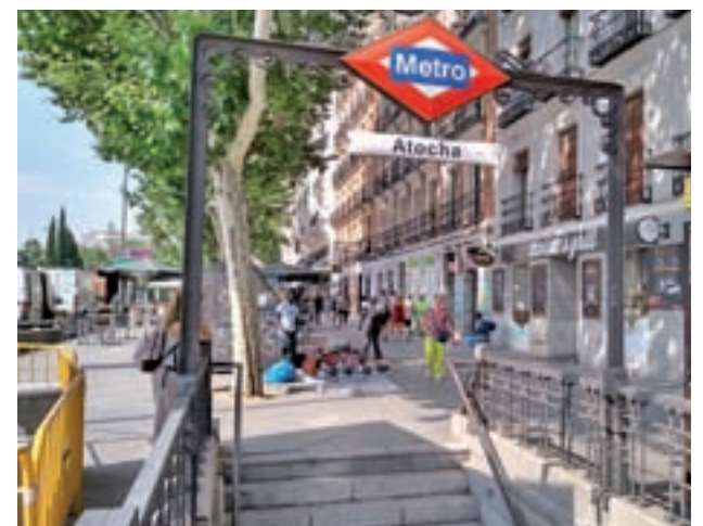
Estación de Metro de Atocha

Los cambios de nombre se harán de forma simultánea y todavía no hay fecha.