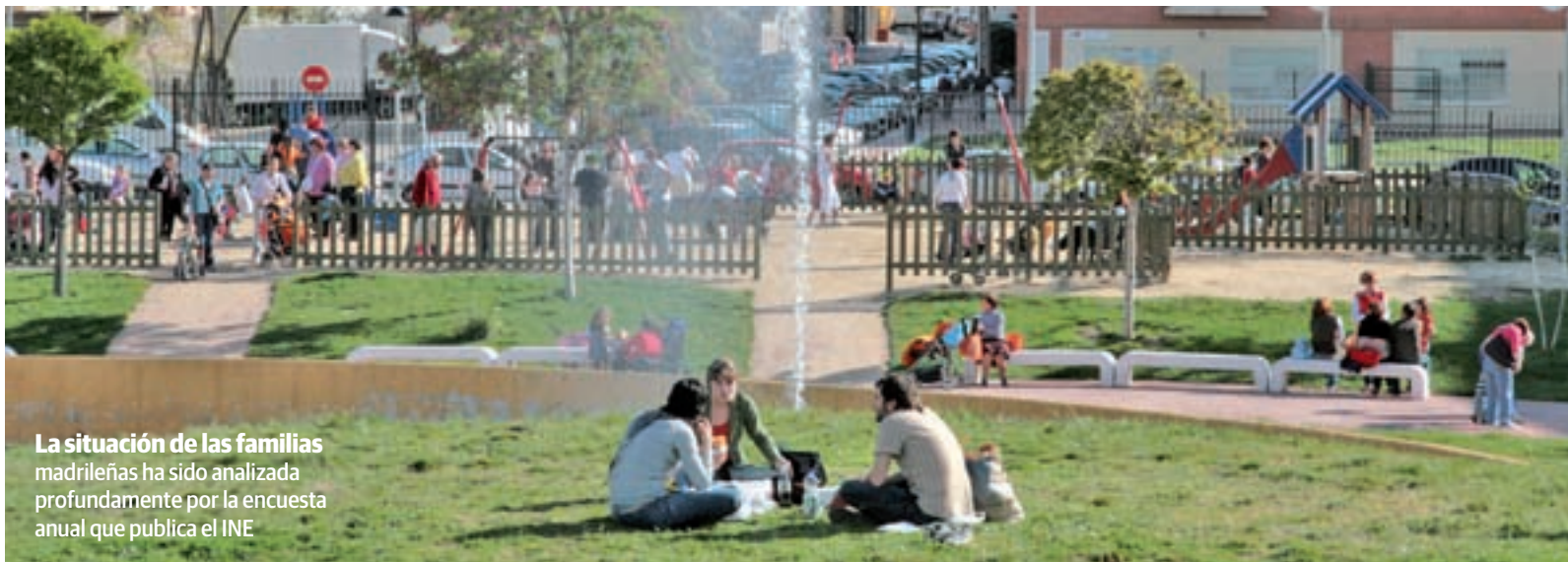
La situación de las familias madrileñas ha sido analizada profundamente por la encuesta anual que publica el INE