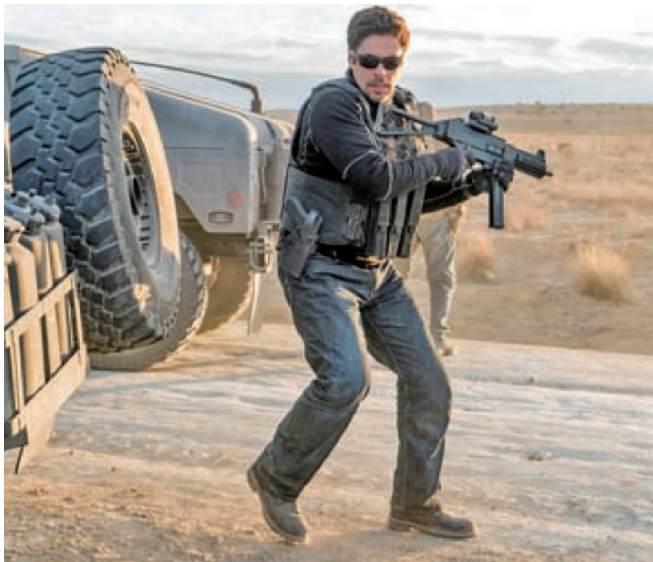
Benicio del Toro encarna a Alejandro, un sicario contratado por Estados Unidos

Pero al margen del buen hacer de Sollima, si hay algo destacado en 'Sicario: El día del soldado' es la interpretación de Benicio del Toro. El puertorriqueño se desenvuelve como pez como en el agua