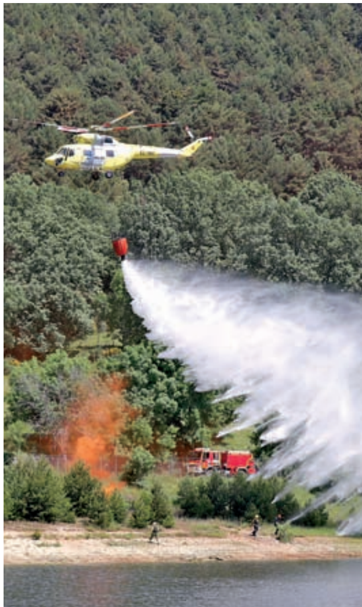
Exhibición en el embalse de Navalmedio

La flota está compuesta por 507 vehículos, incluidos un centenar de autobombas y nueve helicópteros, de los cuales cuatro están al servicio de las brigadas helitransportadas, otros cuatro se destinan a la extinción por medio de