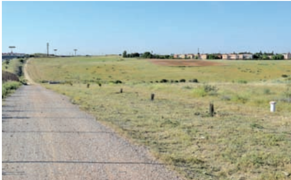
Zona donde se situará el barrio

Alcorcón arrancaba el año con la noticia de que el desarrollo del nuevo barrio de Retamar de la Huerta comenzaría a andar durante 2018. Ahora, la Junta de Gobierno local ha dado un paso más en esa dirección con la aprobación inicial del proyecto reparcelación de una superficie de algo más de 1,1 millones de metros cuadrados situados en la zona noreste de la ciudad, junto al barrio residencial de Cam-