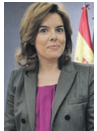
Soraya Sáenz de Santamaría