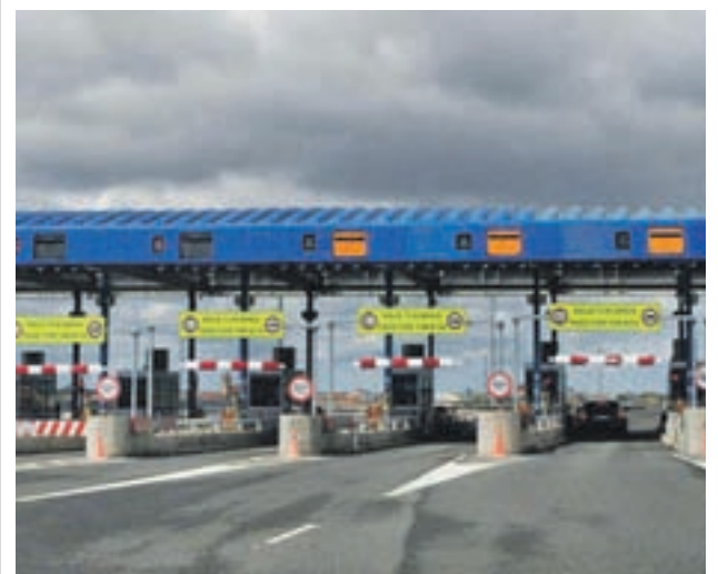
Autopista de peaje

De momento, mientras deshoja la margarita de su futuro, disfrutará de unas merecidas semanas de descanso. No obstante, no aparcará del todo los libros. Acaba de solicitar una beca para participar en uno de los cursos de verano que la Universidad Menéndez Pelayo imparte en agosto en Santander.