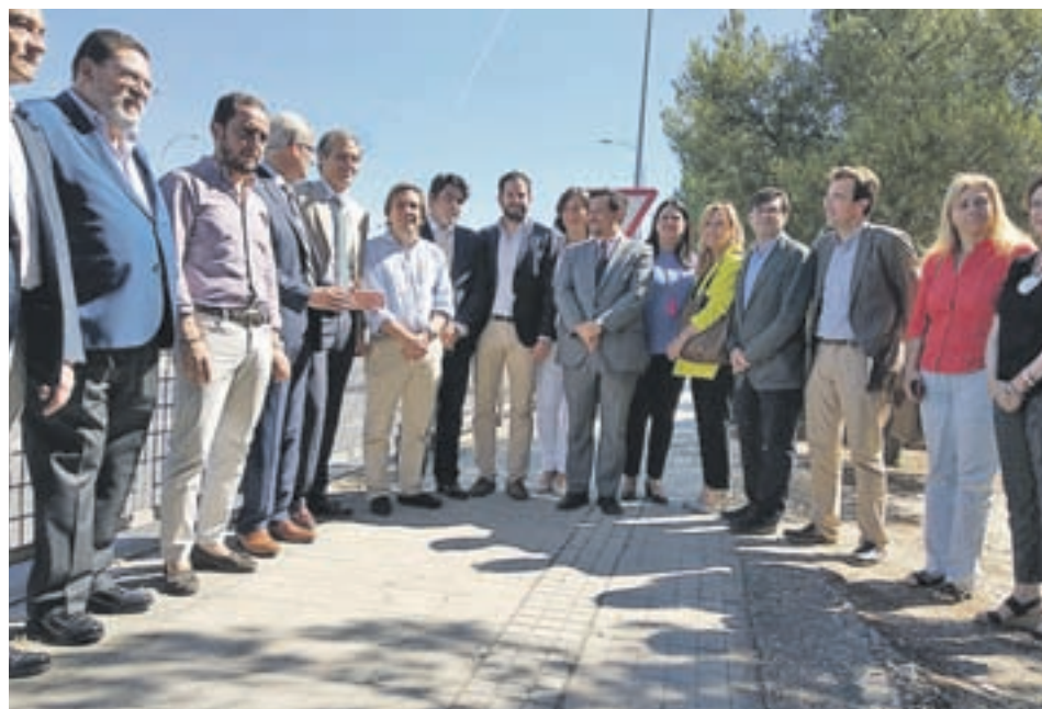
Todos los representantes populares, antes de la reunión

Por su parte, fuentes municipales recalcaron a GENTE que no es cierto que vaya a haber problemas de seguridad en ningún evento. "De hecho, para las celebraciones en honor a Nuestra señora de los Remedios se ha previsto un efectivo de seguridad de unos 160 policías locales para todos los festejos, 20 ellos de refuerzo, repartidos en turnos de mañana, tarde y noche", aclararon. Igualmente, subrayaron que lo que se aprobó "de acuerdo al reordenamiento jurídico" cierra el proceso y otorga una cobertura financiera de 94.290 euros. "Un dinero que precisamente va para las jornadas de refuerzo de Policía Municipal", añadieron.