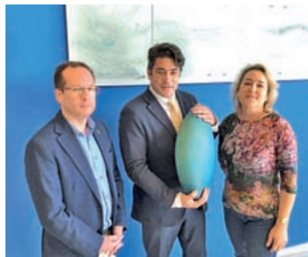
El alcalde, David Pérez, durante una de las visitas a la sala

El primer edil de Alcorcón, David Pérez, aprovechó para recordar que precisamente hace dos años su Consistorio interpuso una demanda contra algunas de las medidas del Ejecutivo de Carmena por entender que vulneraban los derechos de los vecinos y que están a la espera del fallo.