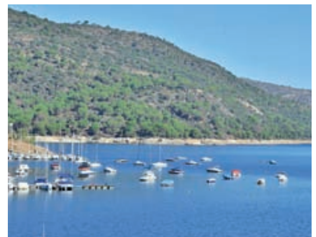
Pantano de San Juan GENTE

Al pantano de San Juan, único de la región en el que están permitidos el baño, la navegación y de actividades acuáticas a motor, acuden 3.000 personas al día.