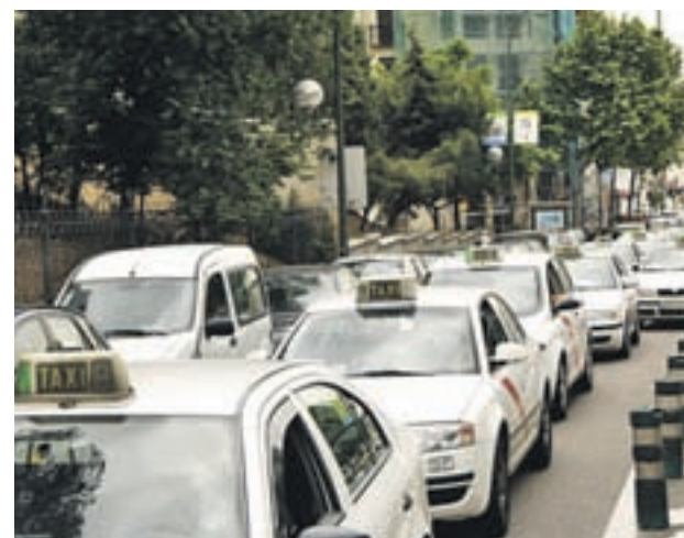
Taxis en Madrid