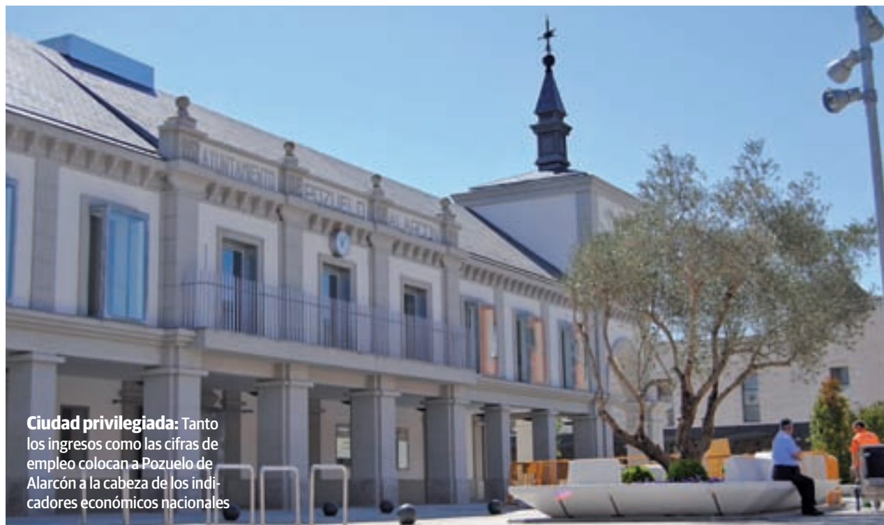
Ciudad privilegiada: Tanto los ingresos como las cifras de empleo colocan a Pozuelo de Alarcón a la cabeza de los indicadores económicos nacionales