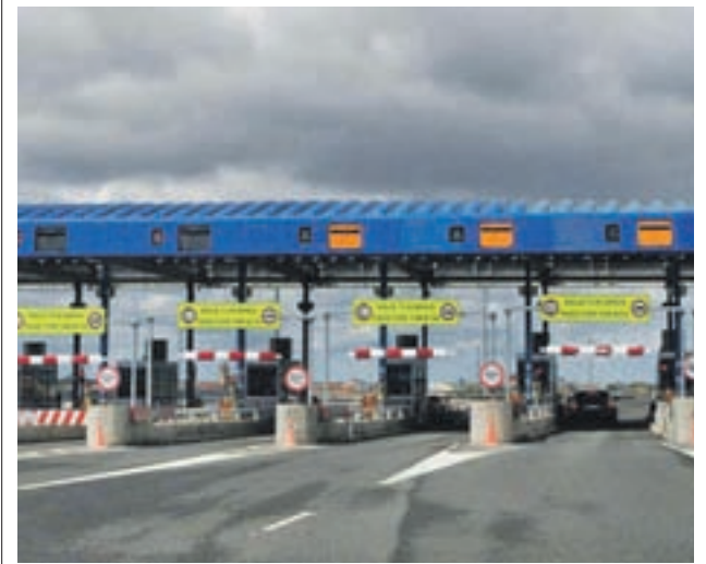
Autopista de peaje

De momento, mientras deshoja la margarita de su futuro, disfrutará de unas merecidas semanas de descanso. No obstante, no aparcará del todo los libros. Acaba de solicitar una beca para participar en uno de los cursos de verano que la Universidad Menéndez Pelayo imparte en agosto en Santander.