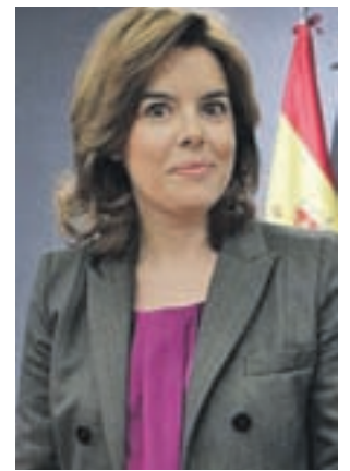
Soraya Sáenz de Santamaría