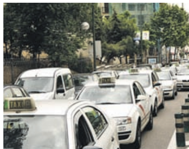
Taxis en Madrid GENTE

Sanz explicó que no se trata de un uniforme sino de unos requerimientos básicos que "deben entenderse como un