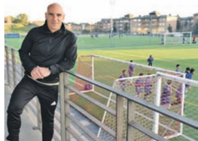
Movilla ya no está vinculado al club

Por otro lado, el equipo juvenil A del Rayo cerró la temporada el pasado fin de semana disputando la final de la Copa RFFM Juvenil Nacional, donde no pudo derrotar al Rayo Vallecano (1-0).