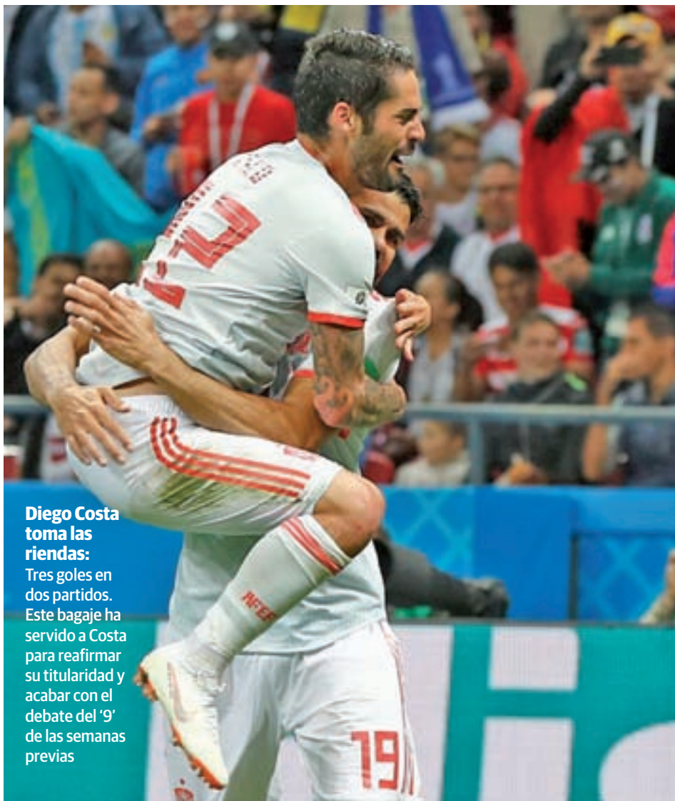
Diego Costa toma las riendas: Tres goles en dos partidos. Este bagaje ha servido a Costa para reafirmar su titularidad y acabar con el debate del '9' de las semanas previas

La selección española llega a la última jornada del Grupo B dependiendo de sí misma para acceder a octavos de final • Un punto ante la eliminada Marruecos basta a los hombres de Hierro • Los partidos de la 'Roja' se han movido por el mismo terreno que el resto del campeonato: igualdad y resultados ajustados