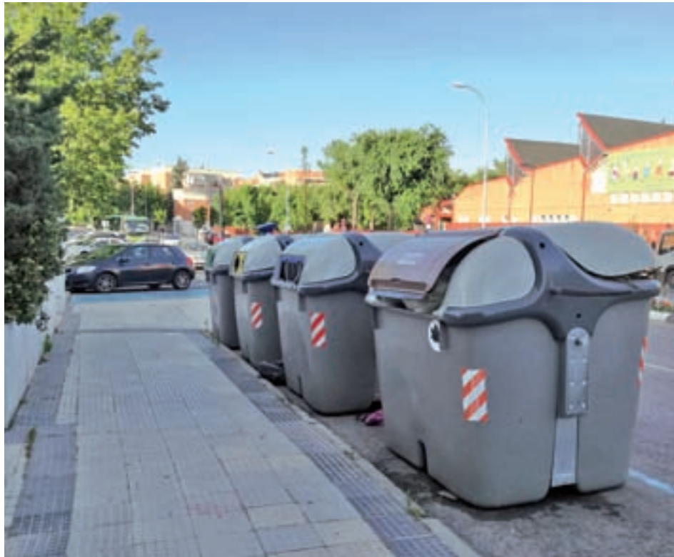
Contenedores en Majadahonda B.M. / GENTE

“Los motivos que nos han llevado a tomar esta medida son muy variados”, e incluyen “reivindicaciones ya históricas” de unos empleados que “llevan ya muchos años trabajando en la contrata y para los cuales parece que nunca llega el momento de consolidar una merecida estabilidad laboral”, añade el colectivo. Entre sus peticiones están la inclusión de las funciones de conductor; que el personal de fines de semana pase a diario con un contra-