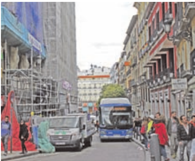
La calle es una de las mayores fuentes de ruido I. C. / GENTE

Entre las principales conclusiones, se destaca que un 21% de estos ruidos procede del tráfico y otros ruidos de la calle. Y es que las sirenas de las ambulancias, el trasiego de motos y coches, las carcajadas, las conversaciones o la música de los bares traspasan paredes y ventanas. Además, es real el dicho de que 'las paredes hablan' porque las conversaciones de los vecinos suponen también la segunda causa más molesta en las viviendas, ya que representan un 20% de los ruidos.