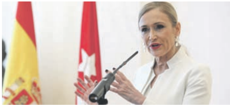
Cristina Cifuentes, en su última comparecencia de prensa

Francisco Granados después de que éste declarara en la Audiencia Nacional que la primera era conocedora de la supuesta financiación ilegal del partido. La magistrada rechaza que la conducta de Granados se pueda encuadrar en un delito de "trato degradante, calumnias e injurias" hacia Cifuentes.