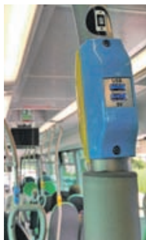
Un autobús de Alcorcón

pañías de transporte por carretera que operan en la región, con el objetivo de ratificar en nuevo preacuerdo que acabe con la huelga de autobuses interurbanos, urbanos y de larga distancia que inició el pasado 3 de mayo. Desde