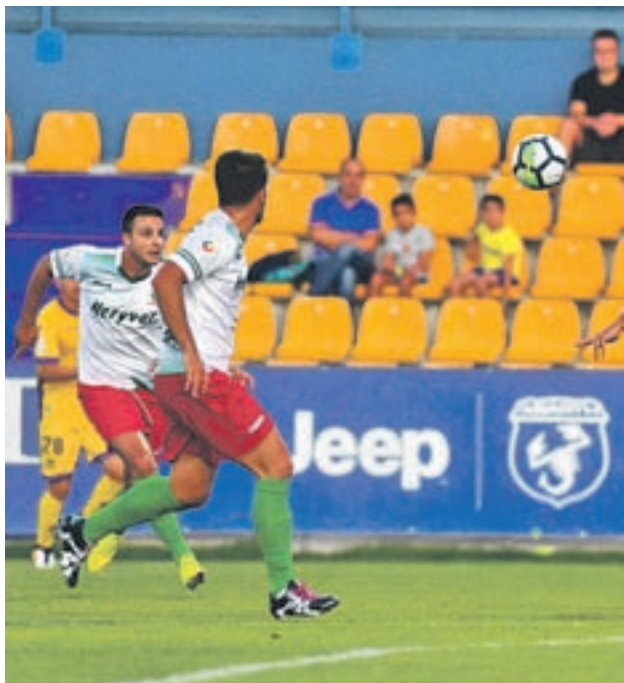
El Trival, en uno de sus últimos partidos

En el partido de ida entre ambos conjuntos el pasado 14 de enero acabaron con empate a cero.