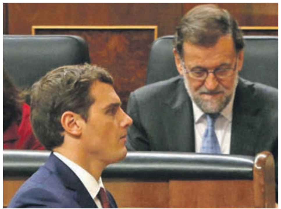
Albert Rivera pasa frente a Mariano Rajoy en el Congreso de los Diputados

Por su parte, el PSOE se ve en "un triple empate" con