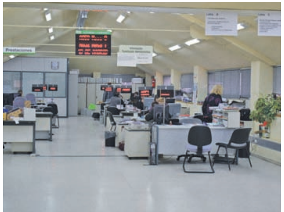
Una oficina del paro

Esto supone un 4,15% menos de desempleados en abril, según el informe registrado por municipios y publicado por Hacienda • El total del desempleo se queda en 9.735 parados