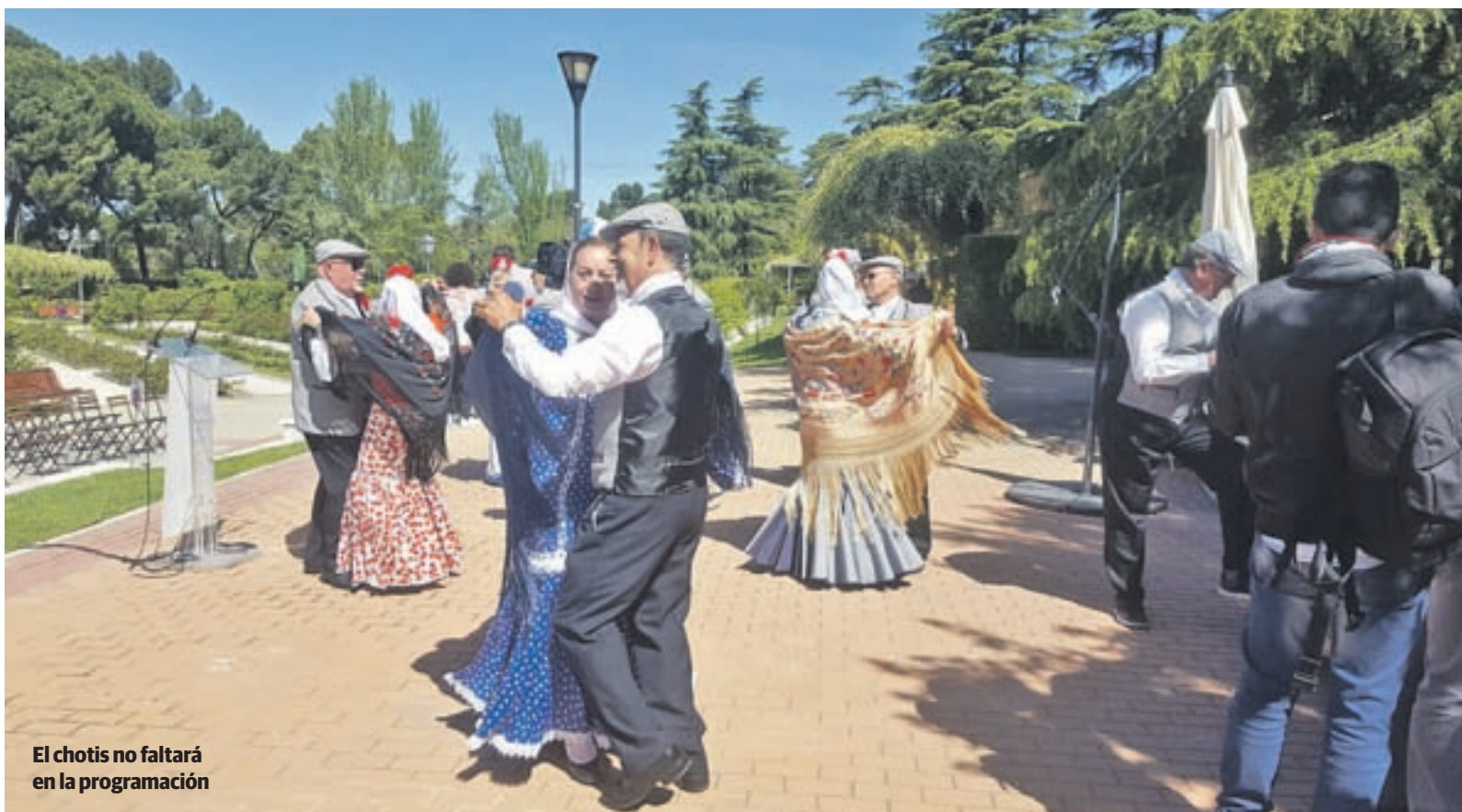
El chotis no faltará en la programación