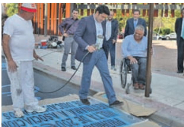
Plazas reservadas para las personas con movilidad reducida

hubiera entendido como una fiesta light, donde no se pueden tener expuestas bebidas espirituosas, y no como un evento. Para él y su familia “está siendo un mazazo”. “Llevamos más de 13 años con el negocio y somos padres de niños pequeños, sabemos lo que es preocuparse por ellos y no se nos ocurriría nunca hacer algo que perjudicara a menores”, insistió.