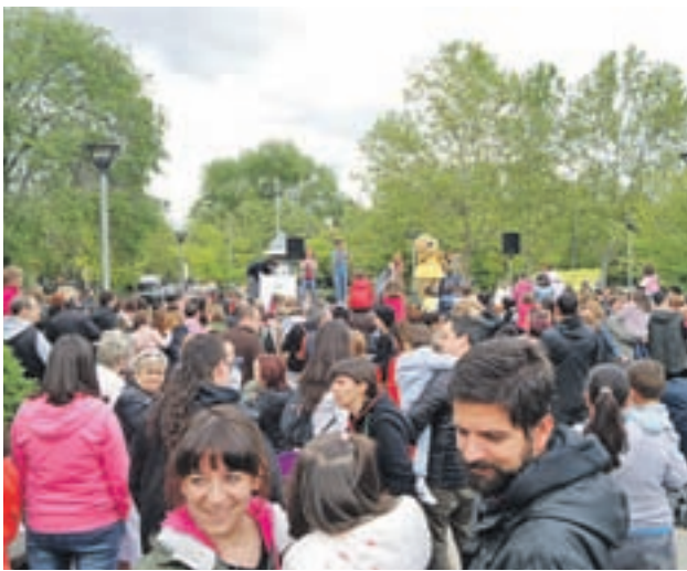
El evento en ediciones anteriores