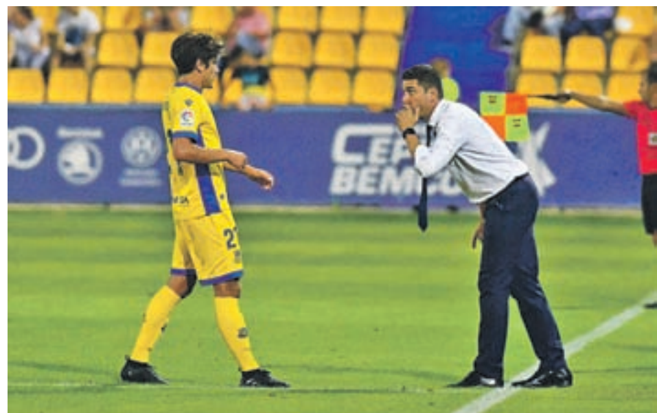
El Alcorcón, en uno de sus partidos

El Polideportivo Santo Domingo acogerá los próximos 2 y 3 de junio el II Trofeo de Natación Ciudad Alcorcón. Será en la piscina de 50 metros y el arbitraje de la Federación.