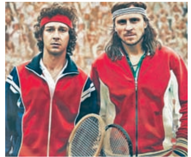
Shia LaBeouf y Sverrir Gudnason, los protagonistas

'Media hora y un epílogo' es el primer largometraje de Epigmenio Rodríguez, un director y novelista leonés que narra en menos de 90 minutos cómo en muy poco tiempo se puede construir un mundo, pero también acabar con él. El salto temporal es solo uno de los recursos que sumergen al espectador en esta gran historia.