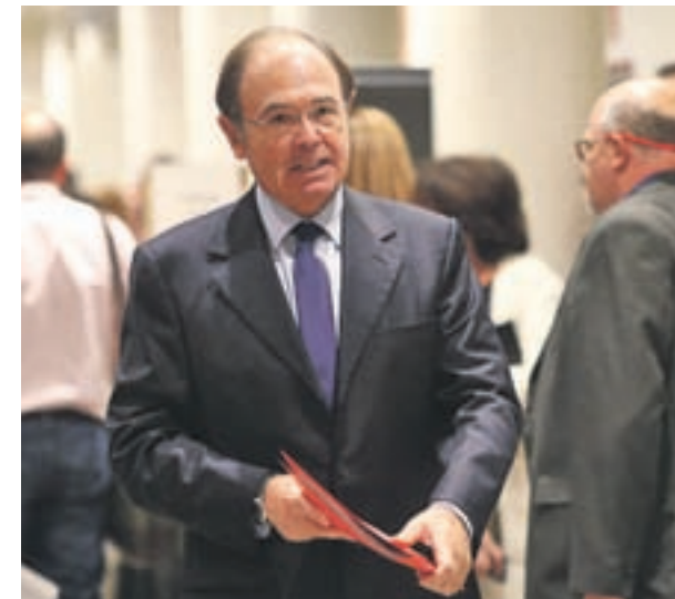
Pío García-Escudero

Una opinión en la que coincide el presidente de la Comunidad de Madrid en funciones, Ángel Garrido, que expresó que la elección de Génova "no puede ser más acertada. Es perfecto para esta nueva etapa".