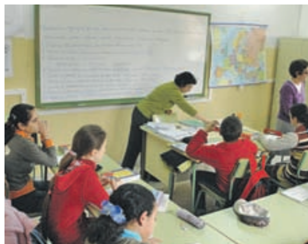
Instituto de la Comunidad GENTE

Respecto a las 576 plazas aprobadas recientemente, 460 serán para profesores de Secundaria, 81 para Formación