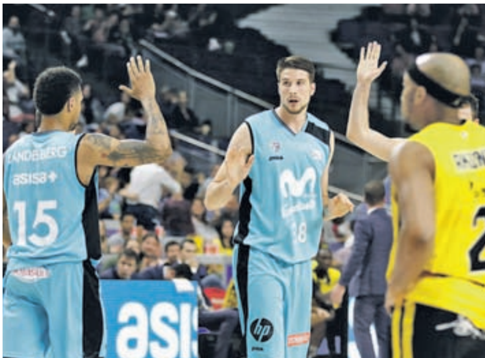
Los colegiales siguen agotando sus opciones

EL EQUIPO DE LASO TIENE LA 'FINAL FOUR' A LA VUELTA DE LA ESQUINA