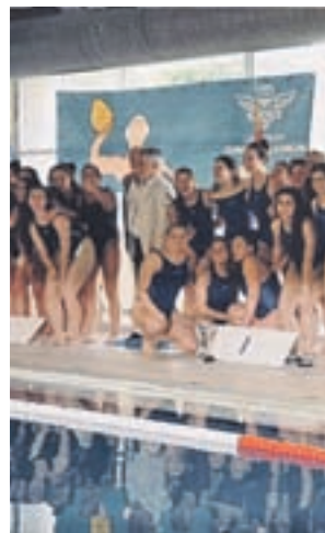
Jugadoras del CN Alcorcón

Ese pleno de victorias les permitió jugar las semifinales, donde el CN Minorisa se mostró superior, especialmente en el segundo tramo del partido para cerrar el marcador con un 11-8 que dejaba a las alfareras en la final de consolación. Finalmente, el tercer puesto se quedó en casa tras derrotar otra vez al Leioa por 11-2.