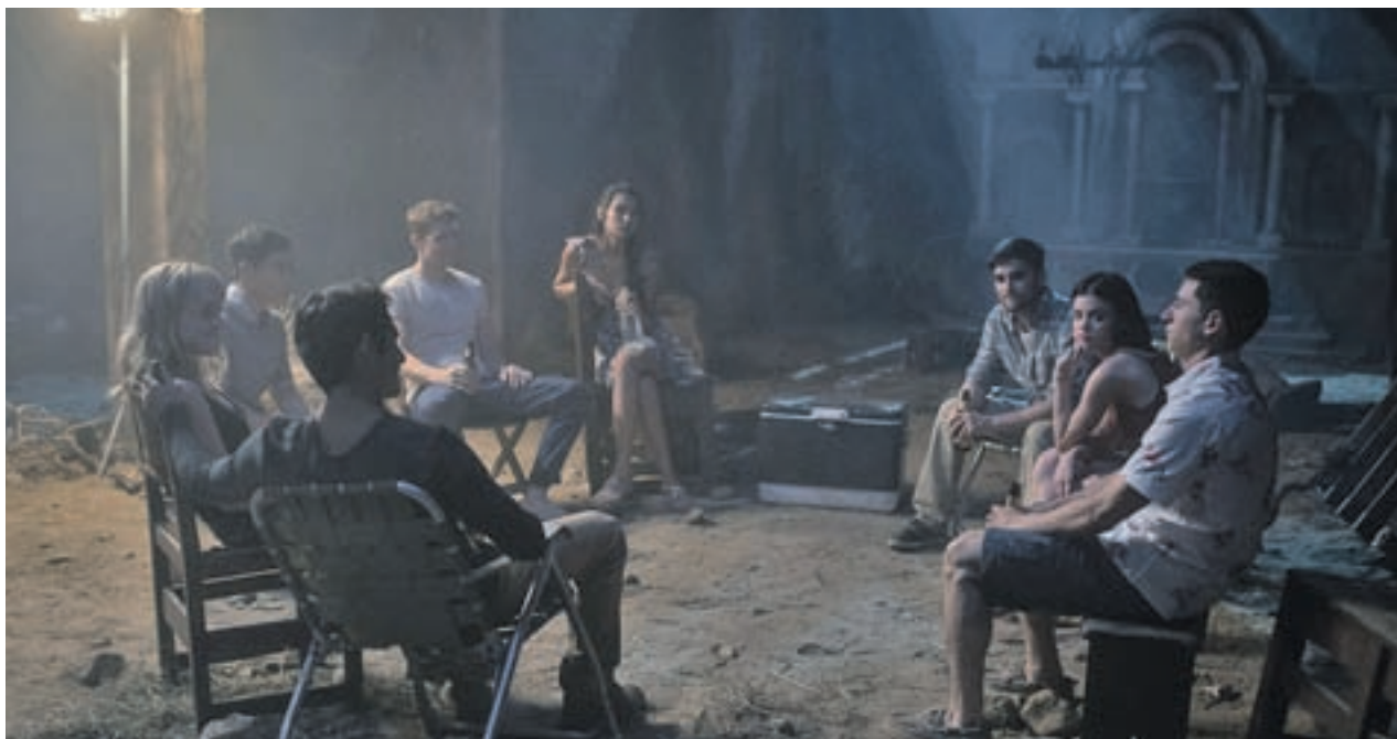
Fotograma de 'Verdad o reto'

El uso de los primeros planos o una fotografía sublime son algunos de los aciertos de una película que le debe buena parte de su éxito a las interpretaciones y caracterización de Shia LaBeouf y Sverrir Gudnason, quienes encarnan a McEnroe y Borg, respectivamente. Ellos son los encargados de personificar los conflictos y vicisitudes que tiene una estrella del deporte, sobre todo fuera de las pistas.