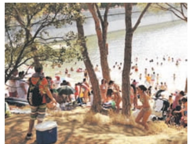
Embalse de San Juan

La Asociación de Educación Ambiental y del Consumidor (Adeac), la sección española de la Federación Europea de Educación Ambiental, dió a conocer estos datos el pasado martes día 8 de mayo en Madrid.