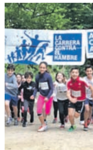
Carrera contra el Hambre

De manera que será esta figura la que aporte el dinero que donará el corredor a razón del número de vueltas que consiga dar.