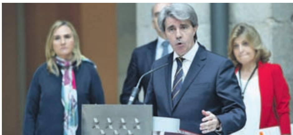
Ángel Garrido, durante su primera comparecencia como presidente regional

En la misma línea se mostró Garrido, que apostó por "respetar el programa electoral por el que los madrileños nos eligieron como primera fuerza política hace tres