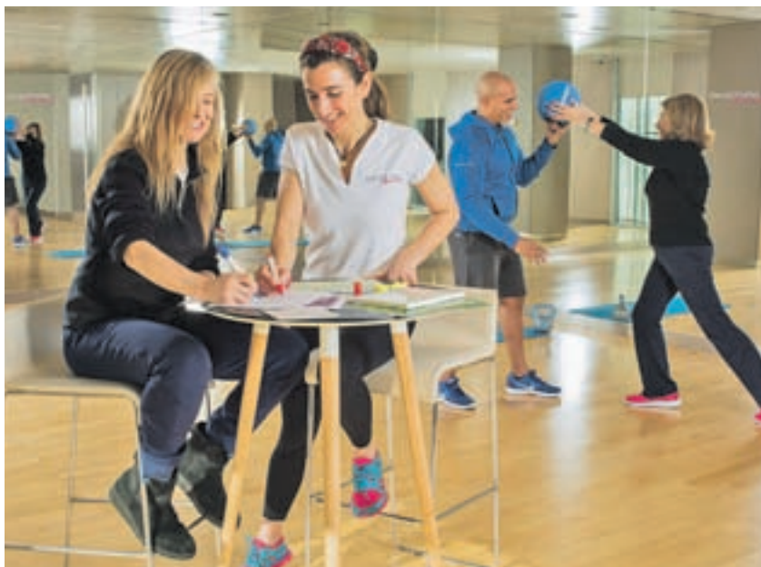
Todo para ellas: Arriba, la clase de Fitness Mental del club deportivo Arsenal Femenino, enfocada a las mayores del centro. A la derecha, una socia en la sala de máquinas, bajo la atenta mirada del entrenador. Abajo a la izquierda, la Miss Mundo 2015 Mireia Lalaguna, que se entrena en Arsenal Femenino Barcelona. Abajo a la derecha, la piscina de la azotea de Madrid