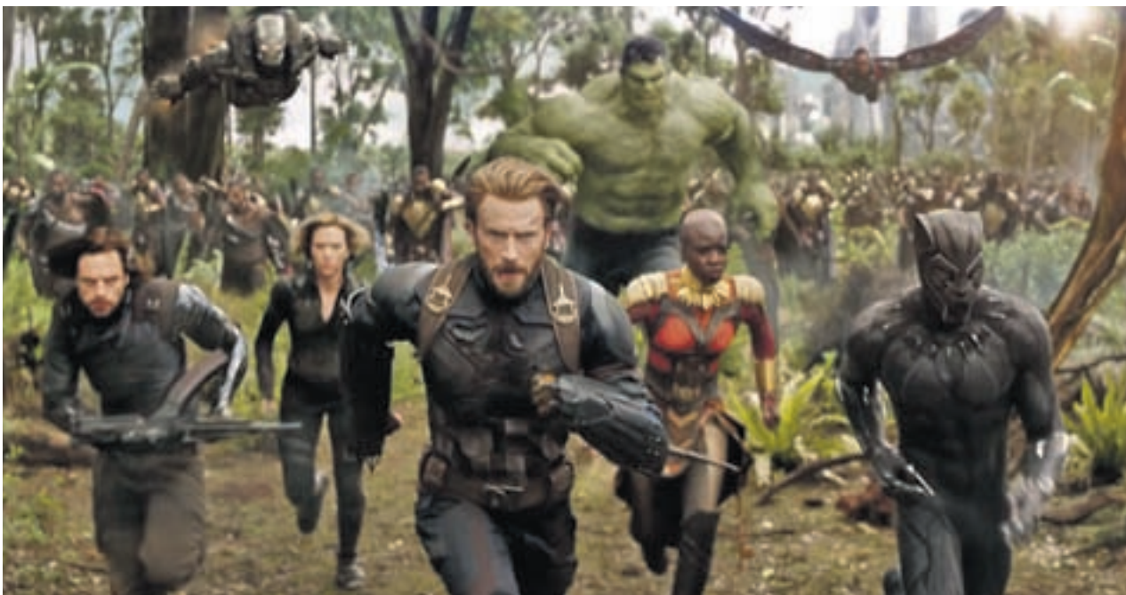
Fotograma de uno de los estrenos más esperados de este 2018

Otra fórmula recurrente, la de las situaciones hilarantes que genera una jugada nocturna, es la apuesta de 'Noche de juegos', un título protagonizado por Jason Bateman, Kyle Chandler y Rachel McAdams en el que un grupo de amigos se reúne para afrontar unas pruebas en las que aparecerá un elemento inesperado: el misterio.