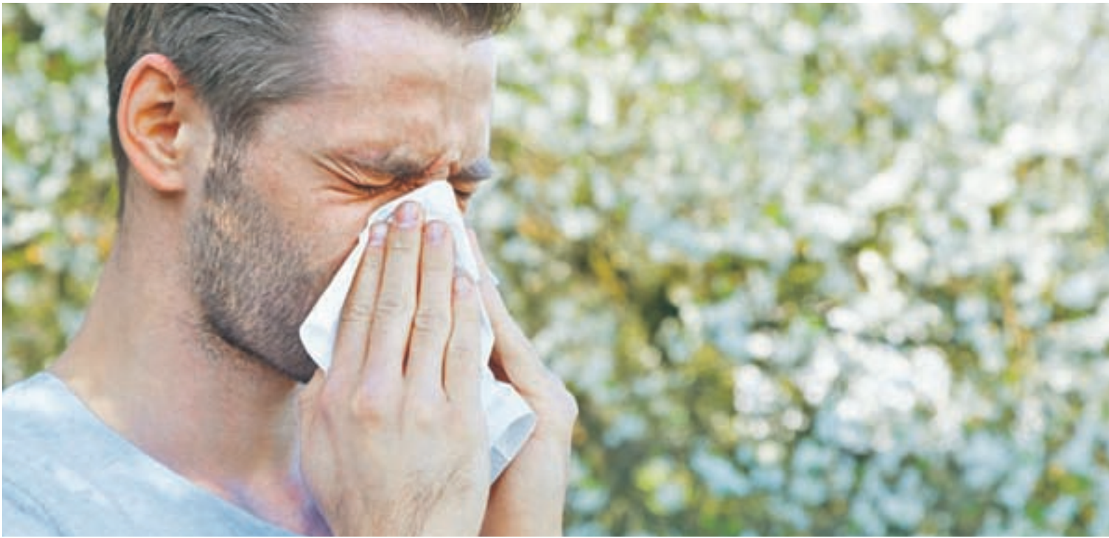
La contaminación y el cambio climático afectan a los alérgicos