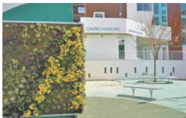
El espacio se situará en el Centro Adolfo Suárez

amueblar, preparar sus instalaciones y dotarlas de proyecto. El plan, que fue presentado en marzo del 2017 y que conllevaba una inversión de 158.000 euros, incluía la adecuación previa de las tres últimas plantas del Centro Municipal Adolfo Suárez, donde estará ubicado, ocu-