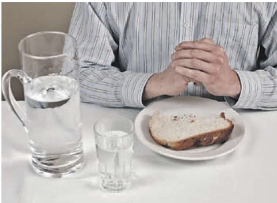
Puede ser un aliado contra la obesidad

mentos, encargados de inyectar en el organismo los aportes necesarios para cada jornada. Por ello, muchas personas escogen esta opción como método para adelgazar, una alternativa que tiene consecuencias. ●