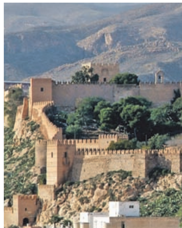
LA ALCAZABA (ALMERÍA): La capital de Dorne en la serie es una localización excepcional para cualquier producción con tintes medievales. La Alcazaba y Murallas del Cerro de San Cristóbal son testimonios de la cultura musulmana en la Península.

Y para quienes quieran tener una experiencia completa, con el puente del 1 de mayo a la vuelta de la esquina,