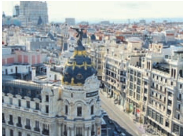
CÍRCULO DE BELLAS ARTES: Al lado del edificio Metrópolis, en la calle Alcalá, se alza esta terraza, una de las preferidas de los madrileños, donde disfrutar de una de las puestas de sol más bonitas. La entrada cuesta 4 euros, pero merece la pena el precio.

Deleitarse con el 'skyline' de nuestra metrópolis nunca fue tan maravilloso, y más