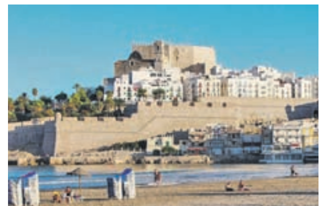
PEÑÍSCOLA (CASTELLÓN): La Puerta de Felipe II, la Plaza de Santa María, el Parque de la Artillería y la Plaza de Armas de la ciudad castellanense, uno de los 'Pueblos más bonitos de España', han servido como calles, jardines y graneros de Meereen.