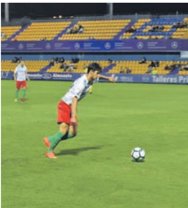
El Trival, en uno de sus últimos partidos