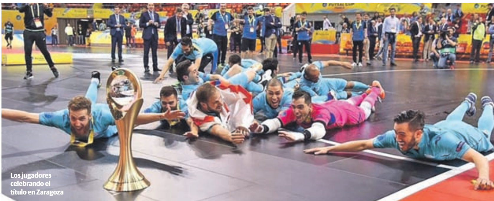
Los jugadores celebrando el título en Zaragoza