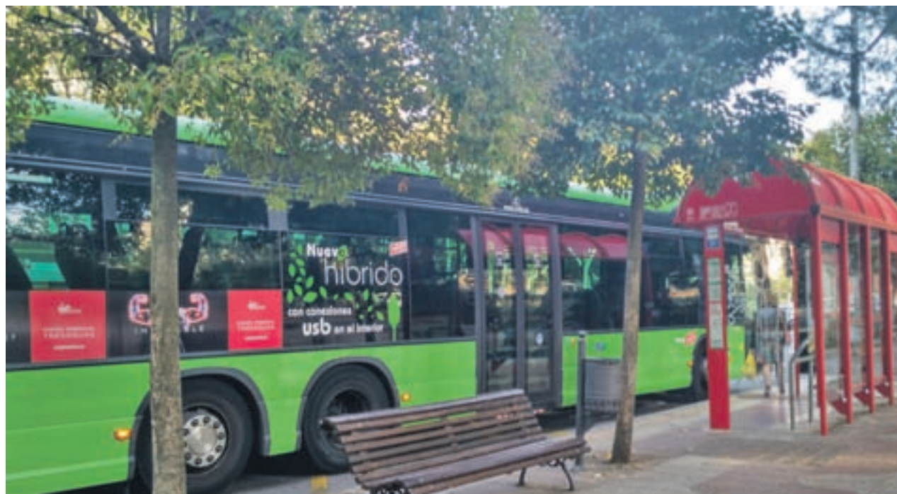
Una de las líneas afectadas en el Sur de Madrid

El Sur de Madrid vivió recientemente una huelga que duró cuatro meses. Al menos 12 ciudades del Sur se vieron afectadas por los paros, mientras se negociaba el acuerdo de empresa con Avanza Interurbana. La huelga fue desconvocada al conseguir el compromiso en varios puntos, como la puesta en marcha de un plan de mantenimiento.