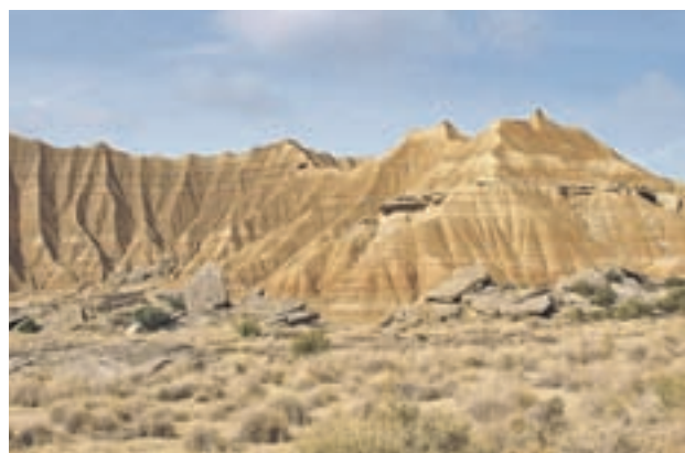
BARDENAS REALES (NAVARRA): Es un entorno de arcilla y arenisca, semidesértico y declarado parque natural en casi todo el territorio que ocupa, en la famosa serie forma parte del Mar Dothraki.