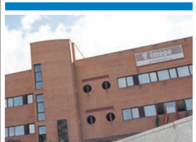
Instituto Municipal de Empleo y Promoción Económica K.E.

La parcela situada en el Sector PP-3 Los Palomares, cuenta con una superficie de 14.002 metros cuadrados y está ubicada entre las calles Ocho de marzo, Ciudadanía, Democracia.