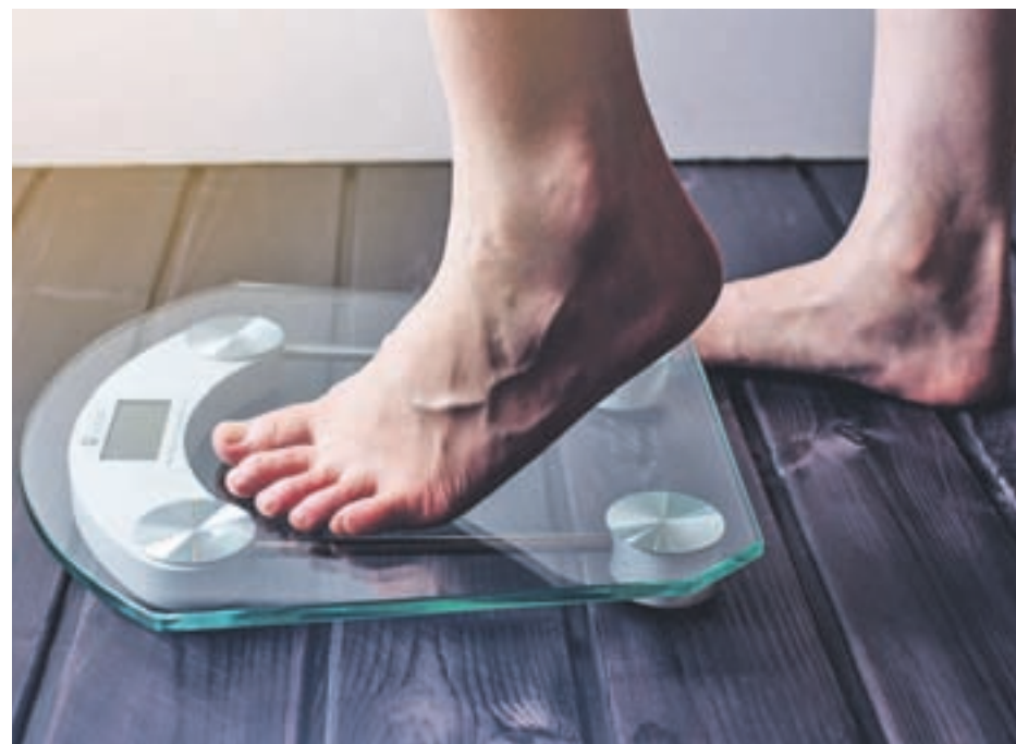
Conviene tener en cuenta ciertas consecuencias

En esta línea, los defensores del ayuno como Wilhelmi de Toledo hacen especial hincapié en la desintoxicación que se lleva a cabo en el organismo. Si se realiza de forma correcta puede conllevar la eliminación de las toxinas que introducimos en nuestro cuerpo a través de prácticas rutinarias basadas en una mala alimentación. Además de deshacerse de estas partículas, el ayuno también puede contribuir a un mejor descanso.