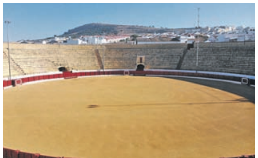
OSUNA (SEVILLA): El dragón discolor de Daenerys Targaryen aparece en el Foso de Daznak para salvar a su madre de una muerte casi segura a manos de cientos de Hijos de la Arpía. Todo ocurre en un escenario que parece, como efectivamente así es, una plaza de toros. En concreto, la de Osuna, recuperada para la ocasión.