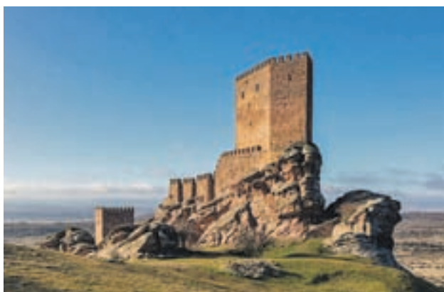
CAMPILLO DE DUEÑAS (GUADALAJARA): El Castillo de Zafra, del siglo XII, es un paisaje perfecto que sirvió para recrear la Torre de la Alegría de Dorne. Este fue el escenario donde Ned Stark vio morir a su hermana, Lyanna.