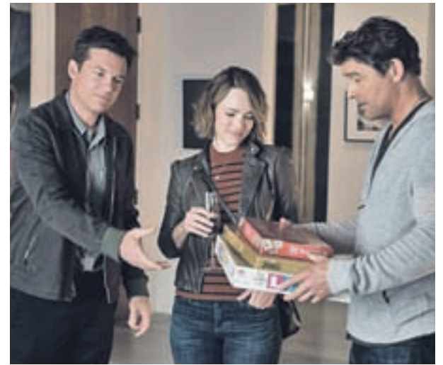
Imagen de 'Noche de juegos'

Todo el elenco asegura que no conoce nada respecto al epílogo de la saga, un cuarto título cuyo estreno está previsto para 2019.