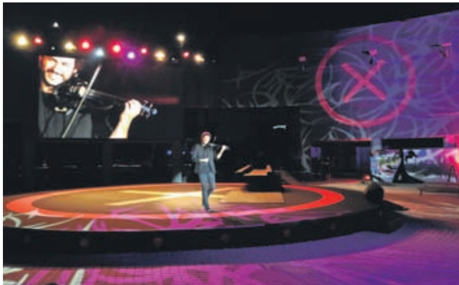
Un momento de la presentación del proyecto X-Madrid

El Ayuntamiento de Alcorcón ha anunciado la futura apertura de "tres grandes espacios de hostelería", dos de ellos con inversión privada y uno en régimen de concesión, que generarán unos 150 empleos en la ciudad. "Las obras se encuentran muy avanzadas, alguna terminada, y están tan sólo a la espera de las correspondientes licencias de apertura", ha detallado, insistiendo en que esto "viene a aumentar la potente oferta hostelera