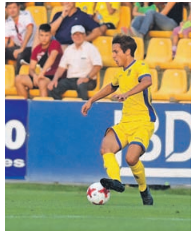
El Alcorcón, en uno de sus partidos

Tanto le va en el envite al Alcorcón que la afición se desplazará en masa hasta tierras andaluzas para dar su apoyo. Así, tres autobuses repletos de seguidores alfareros se trasladarán hasta la capital hispalense, gracias a una iniciativa del club, consistente en fletar los mencionados