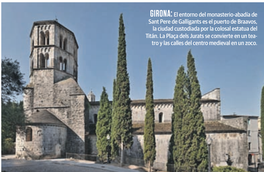
GIRONA: El entorno del monasterio-abadía de Sant Pere de Galligants es el puerto de Braavos, la ciudad custodiada por la colosal estatua del Titán. La Plaça dels Jurats se convierte en un teatro y las calles del centro medieval en un zoco.