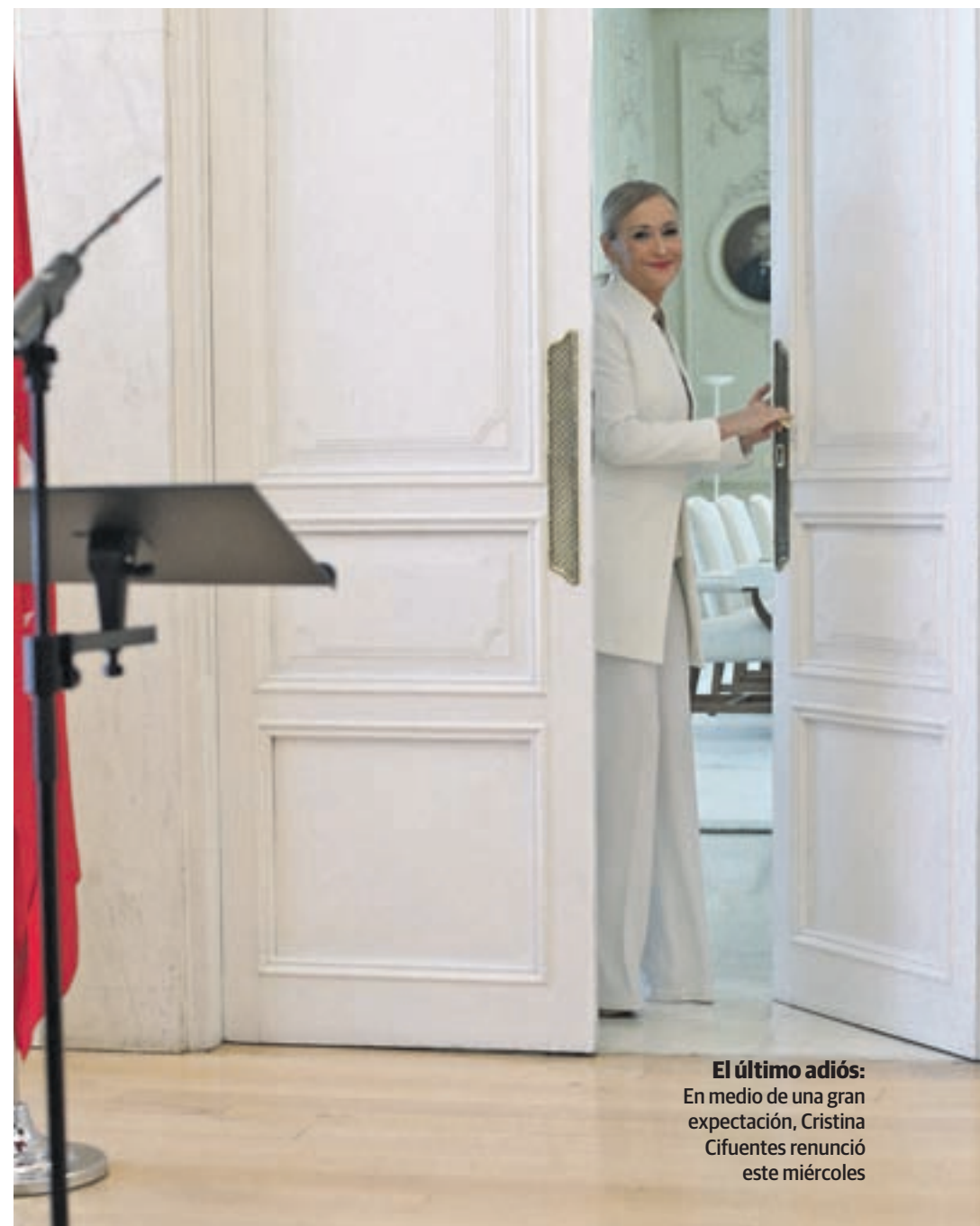
El último adiós: En medio de una gran expectación, Cristina Cifuentes renunció este miércoles

Su salida, sin embargo, deja una gran incógnita todavía sin resolver: su futuro en la política. Cifuentes comunicó a la Asamblea su intención de continuar como diputada regional, un puesto por el que