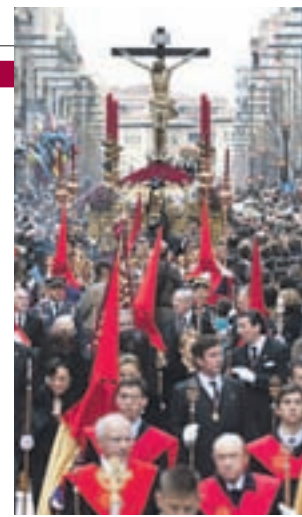
La procesión de los Gitanos: Se celebra por las colinas del Sacromonte de Granada del Miércoles al Jueves Santo.

Zamora, Cuenca, Valladolid, Granada, Toledo... las ciudades del interior del país se llevan la palma en unos días en los que el fervor religioso copará titulares, especialmente el Jueves y Viernes Santo, las jornadas donde más se dejará notar. Pero, además de las procesiones, hay muchas otras citas propias de la Sema-