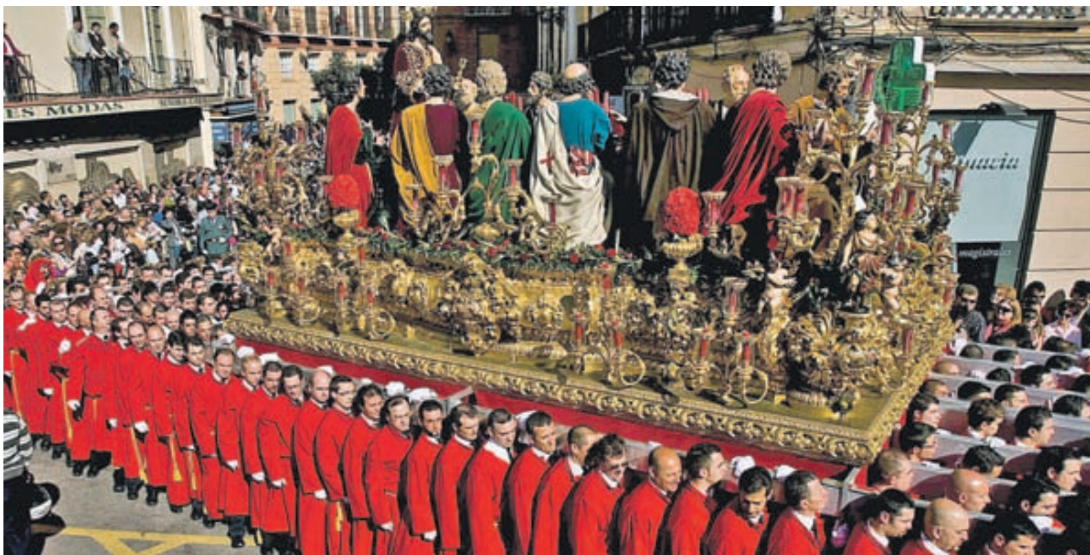
Málaga es una de las ciudades que más intensamente vive la Semana Santa

Los destinos nacionales son los más solicitados, con Madrid, Sevilla y Tenerife a la cabeza