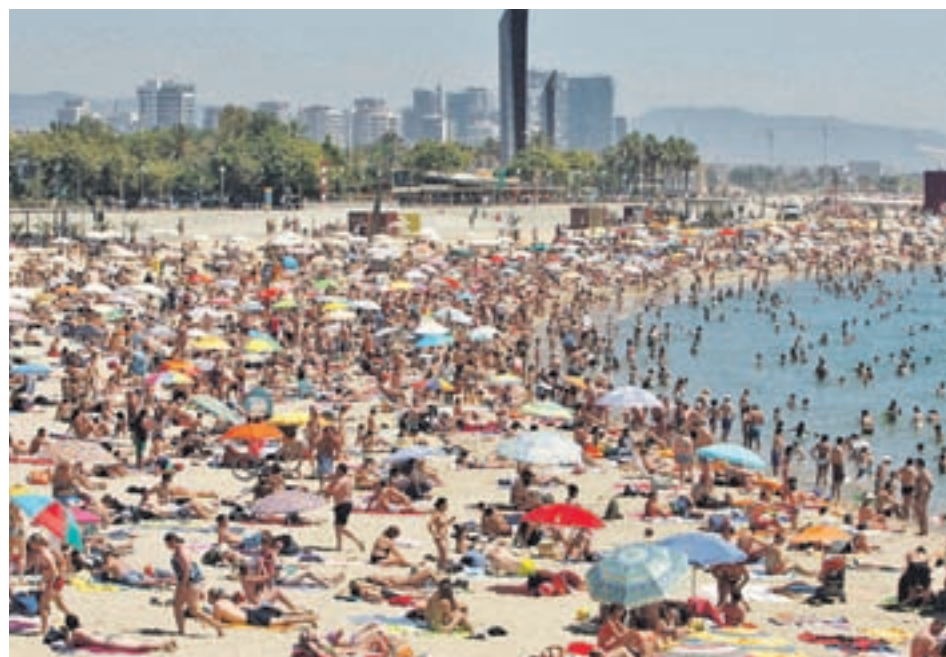
Las procesiones (a la izquierda) y las playas (derecha) son los dos principales atractivos de los próximos días