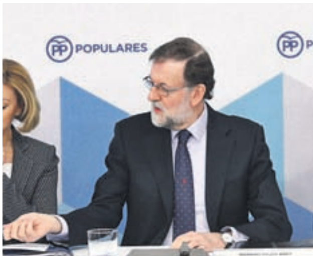
Mariano Rajoy, presidente del Gobierno

Otro de los puntos que estará encima de la mesa del PP en las próximas semanas será la financiación autonómica y el pacto del agua, dos asuntos sobre los que el partido está elaborando sendos documentos internos que prevé presentar en la Convención Nacional que se celebrará en Sevilla entre el 6 y el 8 de abril.