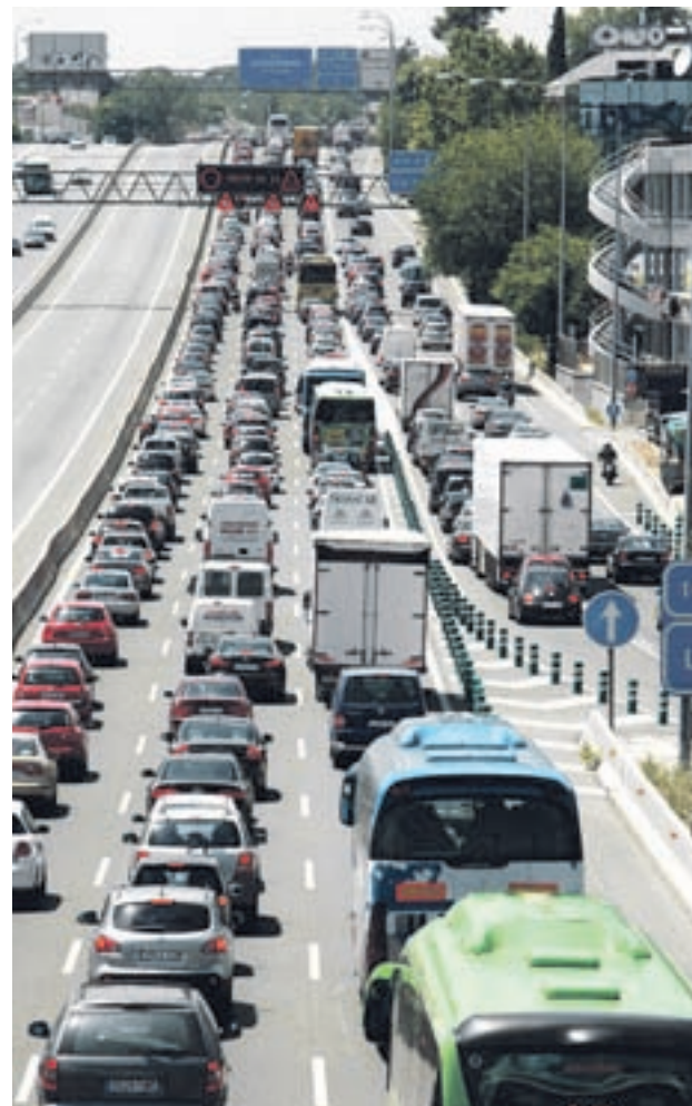
La Semana Santa es una de las épocas de más tráfico

Según señaló el ministro, se espera una "mayor densidad de vehículos" del viernes al sábado, desde el centro de la Península al Levante, al coincidir con los desplazamientos cortos del fin de semana. La segunda fase abarcará del 28 de marzo, miércoles Santo, al mediodía, y continuará el jueves 29 y viernes 30 de marzo. Esta fase concluirá a las 24:00 horas del lunes 2 de abril con la operación retorno que se desarrollará principalmente durante