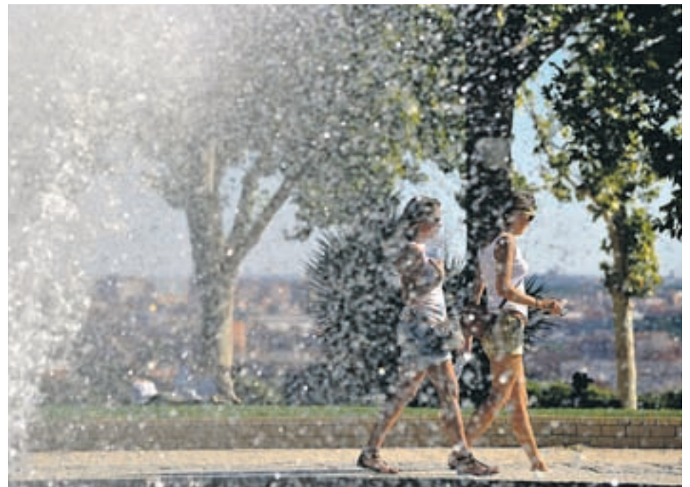
La lluvia podría respetar los días más señalados de la Semana Santa

Las cosas podrían mejorar de cara al resto de la Semana Santa, algo que supondría todo un alivio para los que