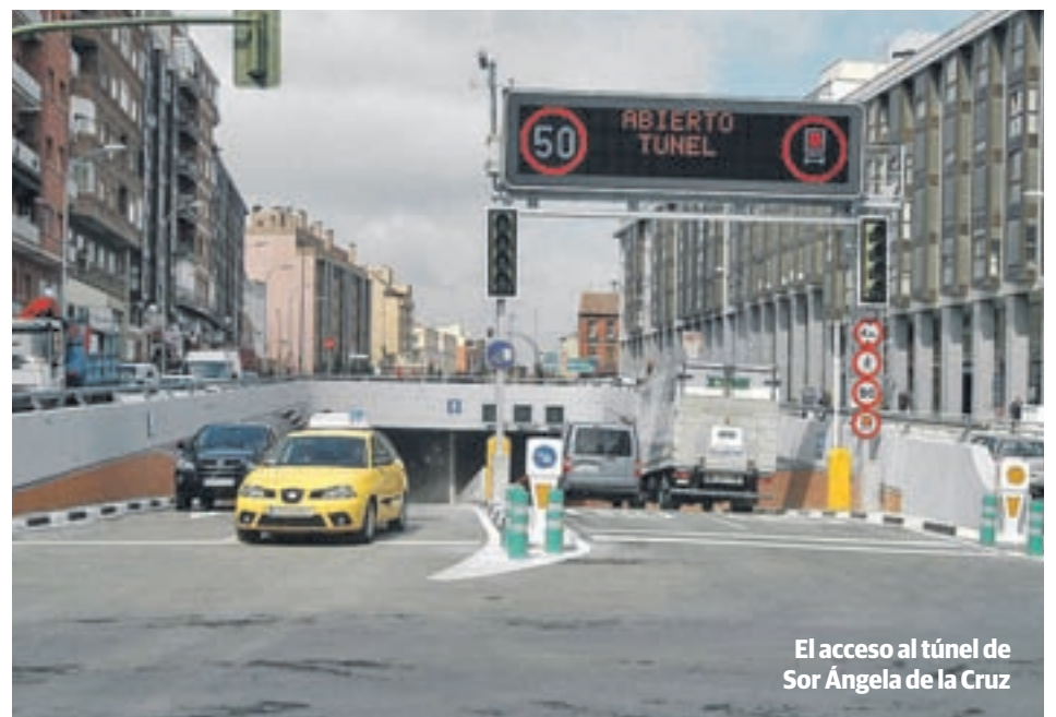
El acceso al túnel de Sor Ángela de la Cruz

Más complicada será la resolución de los problemas en el tubo norte de Pío XII (sentido Monforte de Lemos y Si-