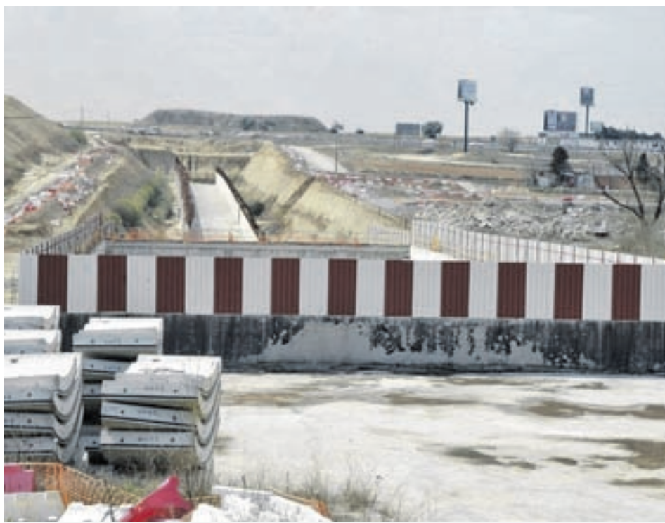
Una zona de las obras del tren Móstoles-Navalcarnero