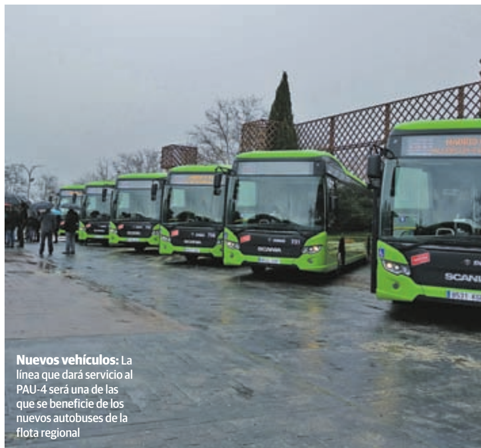
Nuevos vehículos: La línea que dará servicio al PAU-4 será una de las que se beneficie de los nuevos autobuses de la flota regional

La consejera de Transportes, Vivienda e Infraestructuras de la Comunidad de Madrid, Rosalía Gonzalo, fue la encargada de avanzar la noticia el pasado 9 de marzo, puntualizando que estará en marcha "antes de este verano". En principio, los autobuses saldrán desde el intercambiador de Príncipe Pío y darán servicio al PAU-4 utilizando la salida del municipio por su tramo Oeste, con el objetivo de mejorar la accesibilidad