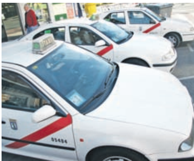
Taxis en Madrid