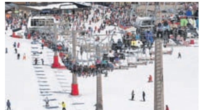
FIN DE SEMANA EN LA NIEVE: Los próximos días son un buen momento para disfrutar de las estaciones de esquí, que este año están viviendo una gran temporada. Baqueira Beret o Sierra Nevada son algunas de las que más pistas esquiabiles tienen.