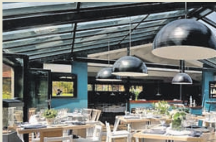
Cabaña Marconi en El Encinar de La Moraleja (Alcobendas)

Precio medio: Alrededor de 25 eu- ros por persona sin vino