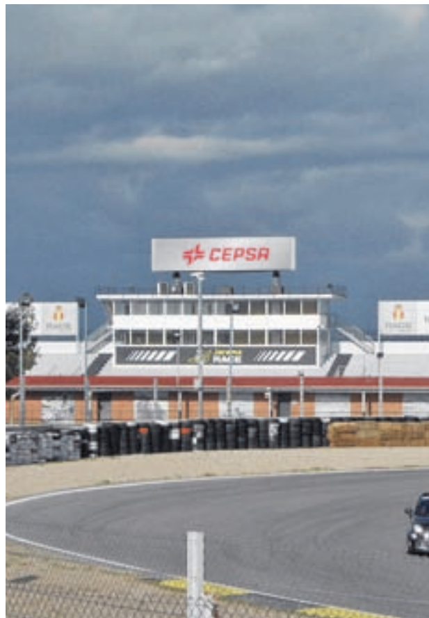
CIRCUITO DEL JARAMA: Puedes regalarle una experiencia para mejorar su conducción, probar un Lamborghini, un Porsche, un Formula 3, GT, karts, simuladores, e incluso experiencias de copiloteaje. Pasa un Día del Padre lleno de emociones.

Un día de esquí en alguna de las estaciones de la Península que aún están abiertas, que son la mayoría; una carrera en el mítico circuito del Jarama; o una experiencia en Matadero de Madrid para los amantes del café.