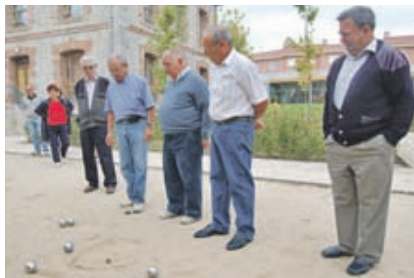
Los madrileños son los españoles que más viven GENTE

Lejos de corregirse, el problema va en aumento,