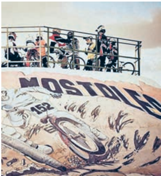
Miembros del club mostoleño CLUB ACTIVO BMX MÓSTOLES

Para constituir una categoría tanto en hombres como en mujeres, se establece una participación mínima de tres corredores. Para informarse de los detalles se puede hacer a través del mail clubactivobmx@gmail.com.