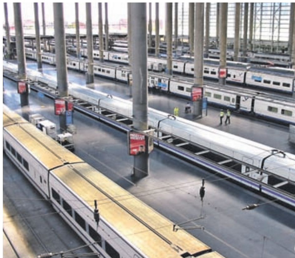
Estación de Atocha GENTE

El objetivo de Fomento es mejorar el tránsito con Chamartín para unificar los recorridos de alta velocidad • Los trabajos requerirán una inversión global de 660 millones de euros