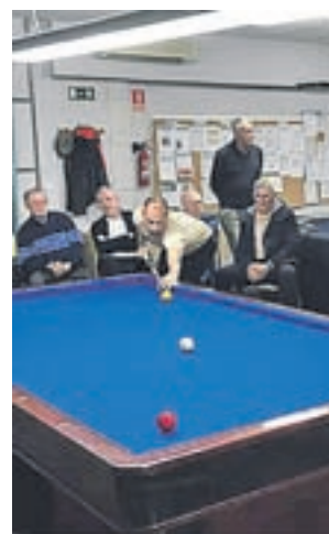
Jugadores en la competición

sificación europea que, en gran parte, se decidirá en el siguiente partido de este sábado 17 de marzo frente al Csn de Cartagena, al que acude