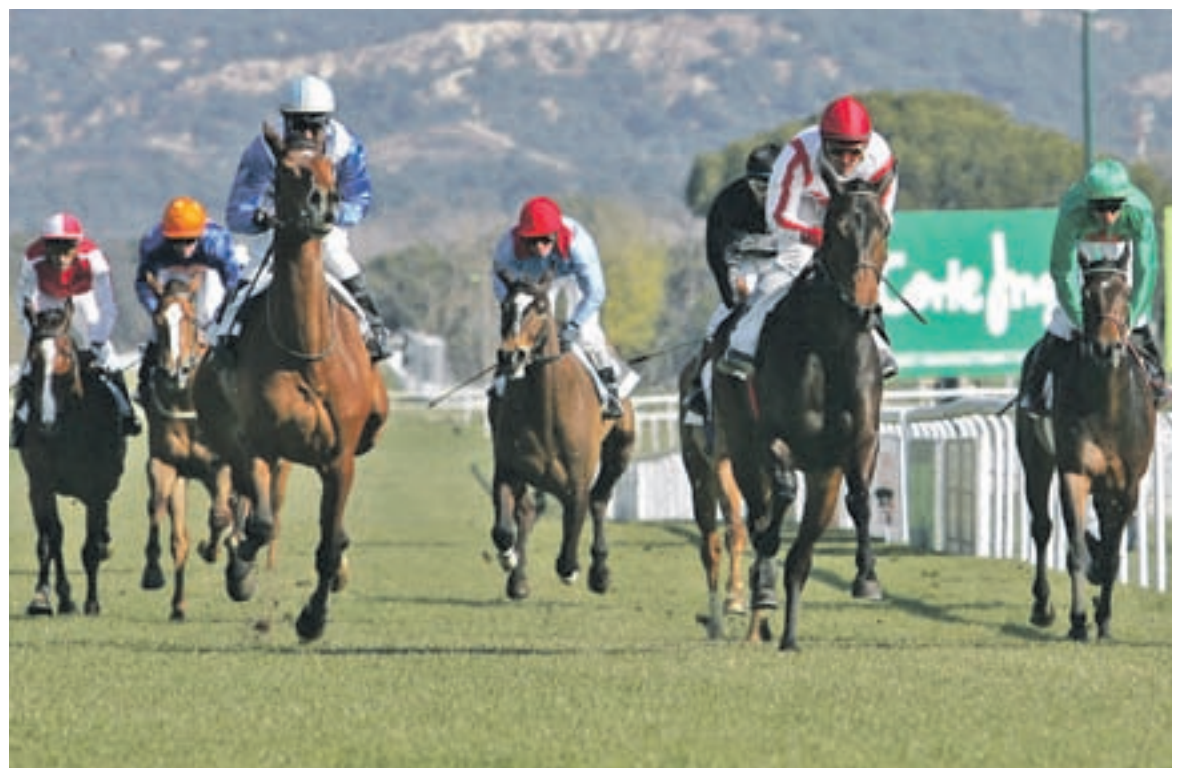
El público podrá ver a los mejores jinetes GENTE