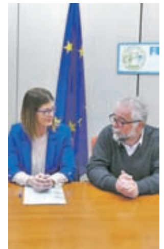
Momento de la selección

El municipio presentó un plan consistente en la construcción de una central térmica en el Distrito-Norte Universidad, que utilizará tecnología de combustión de biomasa y solar térmica para producir agua caliente sanitaria (ACS)