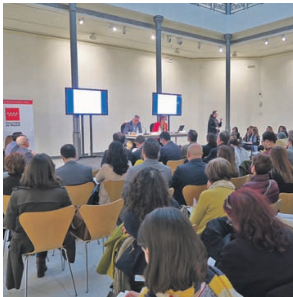
Presentación del 'Análisis de la Situación de las Familias'

"Las cifras que hemos analizado hoy señalan el inicio, en 2015, de una senda de recuperación que debemos ocuparnos en afianzar entre todos. Desde el Gobierno re-