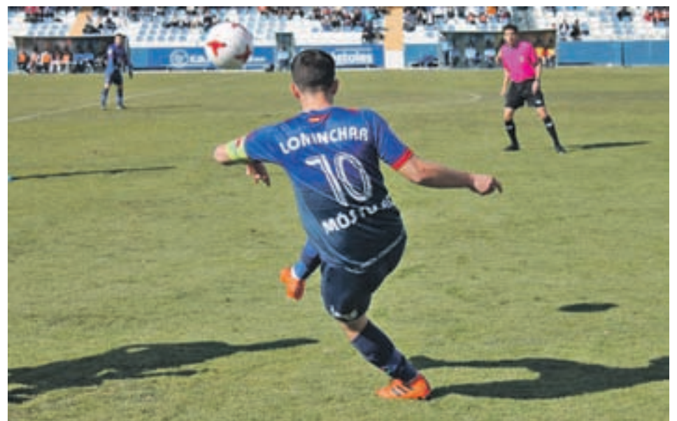
EL MÓSTOLES, EN UNO DE SUS ENCUENTROS MÓSTOLES URJC

Algo que los jugadores tienen presente, ya que los dos primeros clasificados de la liga jugarán la Copa de Europa de clubes en 2019.