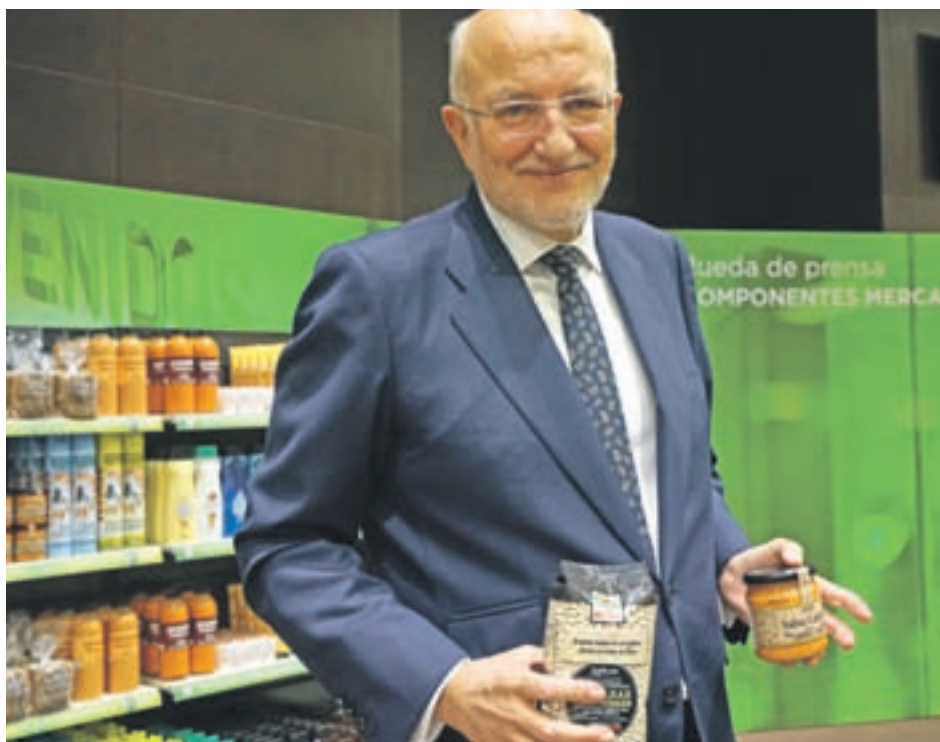
El presidente de Mercadona, Juan Roig, durante la presentación de los resultados de 2017

En innovación en tiendas, destaca el establecimiento en