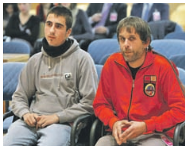
Los hechos ocurrieron en 2008

La condena se ha adoptado de forma unánime al entender el tribunal que la quema de las fotos no puede considerarse una manifestación