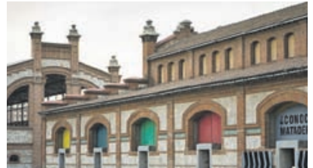
EXPERIENCIA ENTRE AROMAS: Si tu padre se considera amante del café, True Coffee Experience es una gran oportunidad para celebrar su día disfrutando de los mejores cafés del mundo. El lunes 19 en Matadero de Madrid habrá degustaciones y talleres.