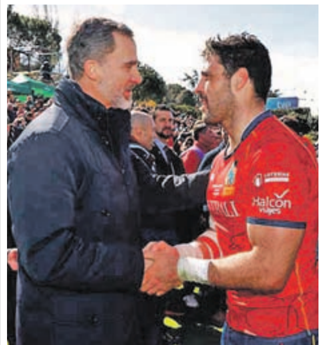
Felipe VI felicitó a la selección tras su última victoria

Uno de los últimos favoritos en entrar en liza será el Barça, que deberá sacar su billete para las semifinales ante el Ríos Renovables Zaragoza. Este será el último cuarto de final, que arrancará a las 21:15 horas de este viernes. Un poco antes, a las 19, saltarán al parque de la calle Goya el Plásticos Romero Cartagena y el Jaén Paraíso Interior. Las dos semifinales se jugarán el sábado, a las 18 y 20:15.