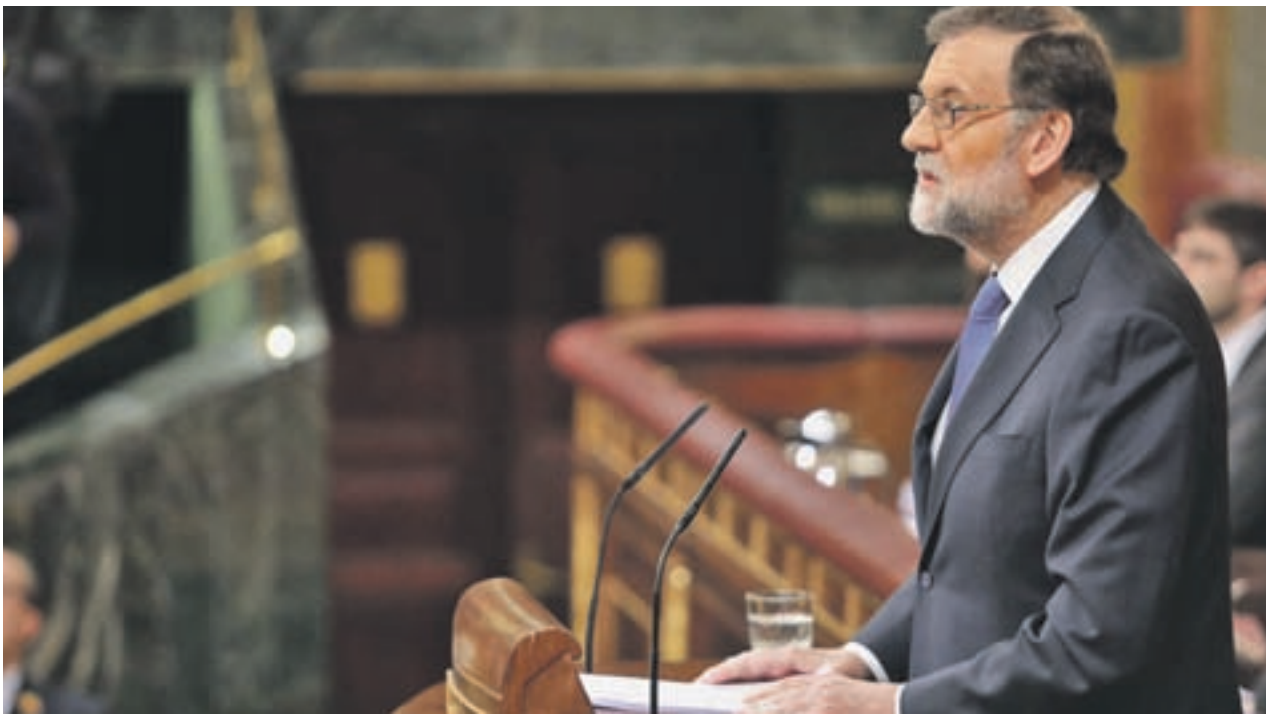
Mariano Rajoy, presidente del Gobierno, durante el Pleno monográfico