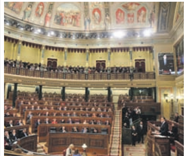
Mariano Rajoy, durante su intervención en el Pleno