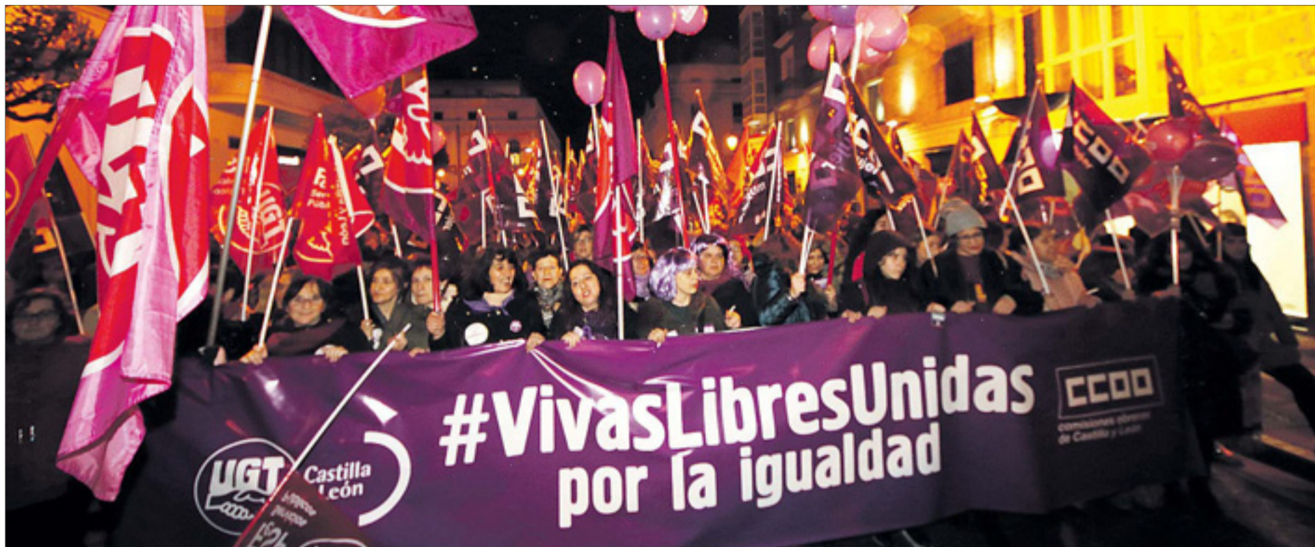
La cabeza de la manifestación salió a las 20.00 h. desde la Plaza del Cid hacia la C/Vitoria; casi una hora después partía la cola de la misma, lo que da idea de las miles de personas que participaron en la movilización.