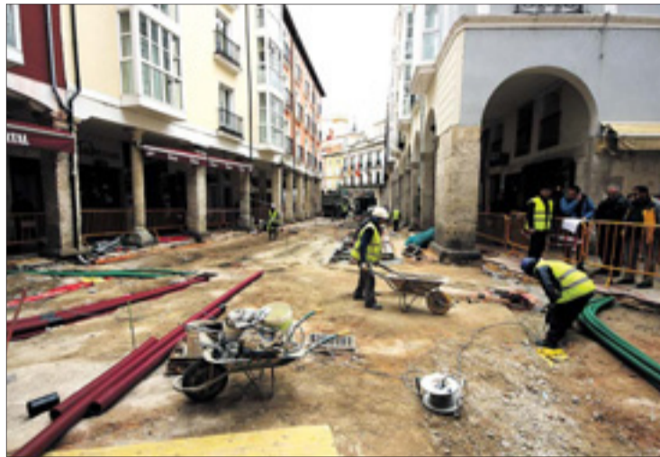
La de la Plaza Mayor es una de las principales obras licitadas por cuantía económica.

Lacalle consideró que son unos datos "extraordinarios" que "hablan de la capacidad de gestión" del Ayuntamiento de Burgos, "muy su-