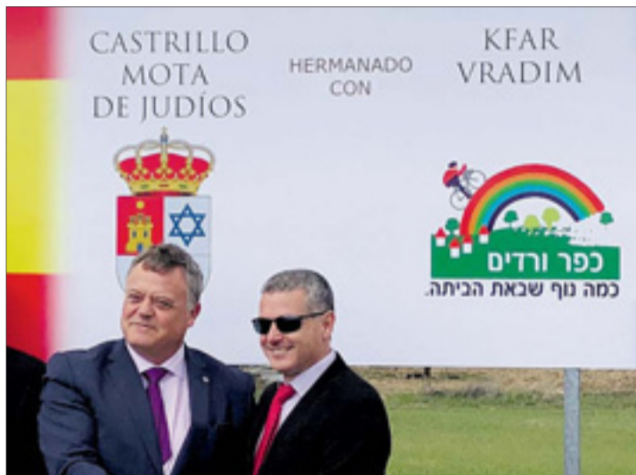
Unos carteles recuerdan el hermanamiento de los dos municipios.

La rúbrica del hermanamiento ha ido acompañada de una serie