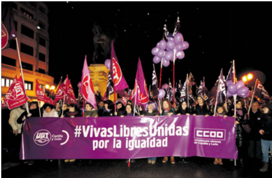
Una multitudinaria manifestación recorrió por la tarde noche las calles del centro de Burgos a favor de la igualdad de las mujeres.