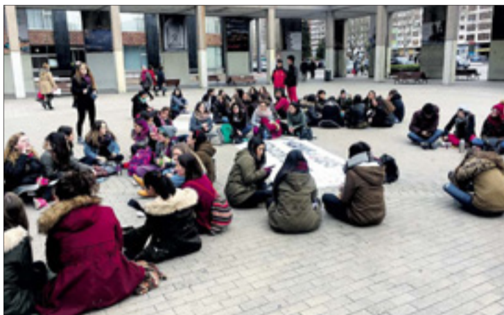
En la Plaza de España se produjo una sentada de estudiantes de Educación.