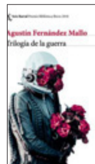
TRILOGÍA DE LA GUERRA