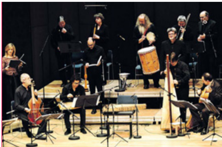
Sobre el escenario, cantos y bailes de los descendientes de los esclavos.