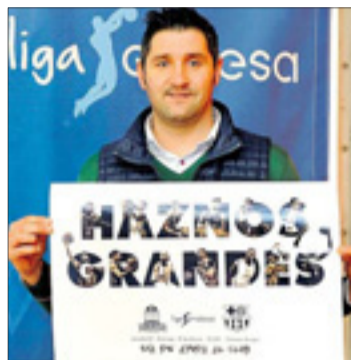
San Pablo-FC Barcelona Lassa, declarado Día de Ayuda al Club.

El San Pablo visita al conjunto murciano el domingo 11 a las