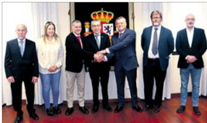
En la Subdelegación del Gobierno se produjo un encuentro con la Delegación Judía.

de recepciones a la delegación judía por parte de las instituciones. Horas antes del acto en la localidad burgalesa, el subdelegado del