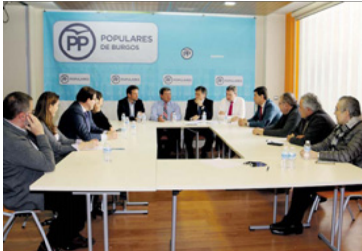
La reunión se celebró el miércoles 7 en la sede del PP burgalés.

De momento, los "ejes prioritarios" que marcarán la agenda de los próximos meses, según Vázquez, serán el empleo, la recuperación económica, la garantía de las pensiones y el mantenimiento de los servicios públicos de calidad. "Con estas premisas me he reuni-