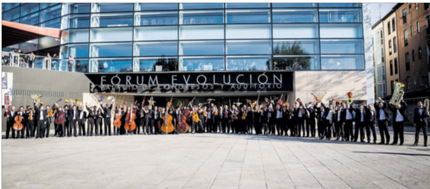
La OSBu se ha convertido en un referente cultural de la ciudad de Burgos. Desde 2012 tiene su sede en el Fórum, donde realiza sus ensayos y desarrolla su temporada regular de conciertos.

La OSBu representa en el Fórum la totalidad de la zarzuela 'El maestro Campanone', de Vicente Lleó, obra de enredos operísticos con música de factura rossiniana