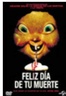
FELIZ DÍA DE TU MUERTE

Dir. Taika Waititi. Int. Chris Hemsworth, Tom Hiddleston. Aventuras / Fantástico.