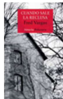
CUANDO SALE LA RECLUSA