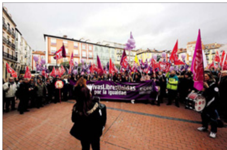
Por la mañana, la protesta se produjo en la Plaza Mayor.