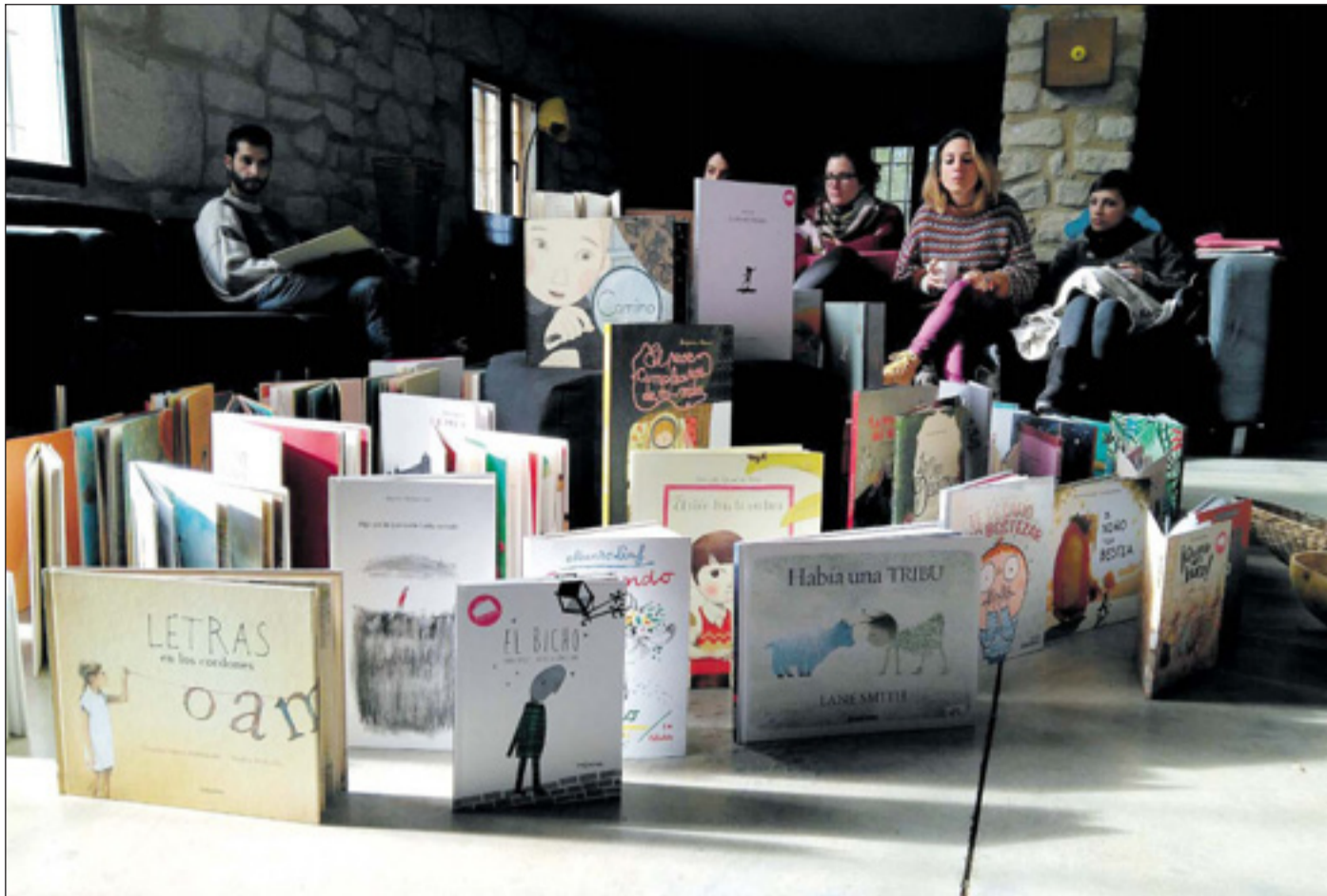
Imagen tomada en una de las actividades llevadas a cabo por la asociación 'Va de Cuentos', en la que emplean álbumes ilustrados como herramienta.