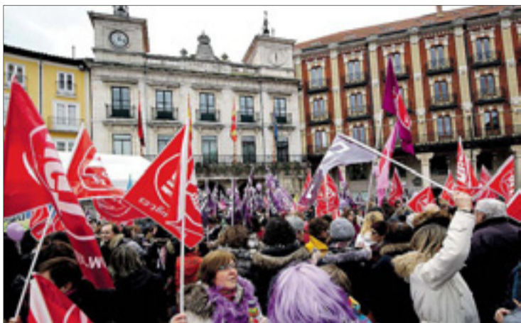
La Plaza Mayor acogió por la mañana una concentración de protesta.