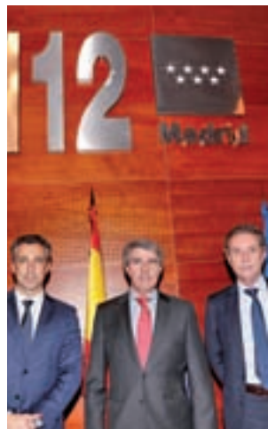
Presentación del plan

Las 15 presas afectadas por este plan son las de La Aceña, El Atazar, La Jarosa, Manzanares El Real, Navacerrada, Navalmedio, Las Nieves, Pedrezuela, Pinilla, Pontón de la Oliva, Puentes Viejas, Riosequillo, Valmayor, El Vado y El