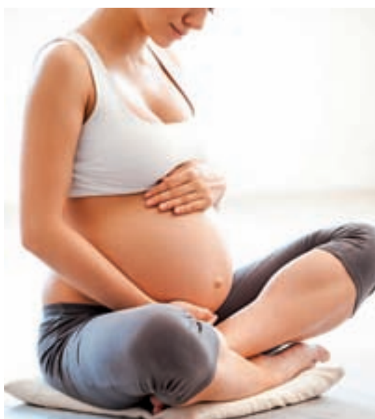
Los ejercicios de suelo pélvico son los que más benefician a las embarazadas

cuerpo. La estabilización de la columna es una de las ventajas de este deporte, y es que es conocido por la corrección postural.