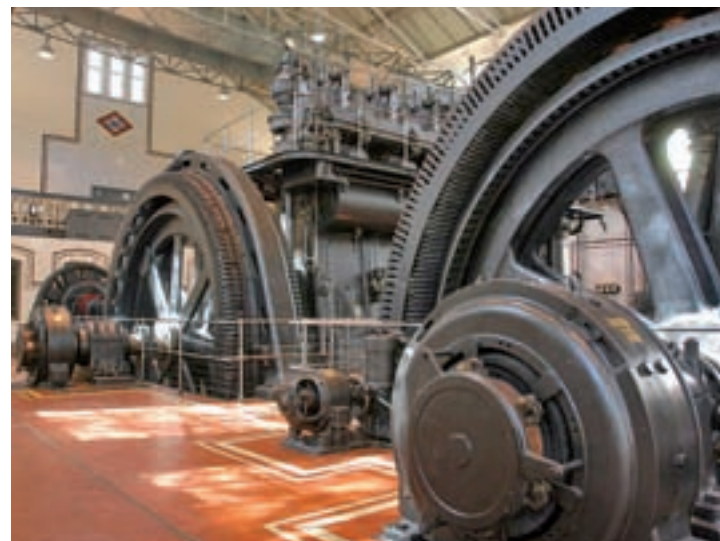
Nave de Motores de Madrid

titucionales de sensibilización de la causa.