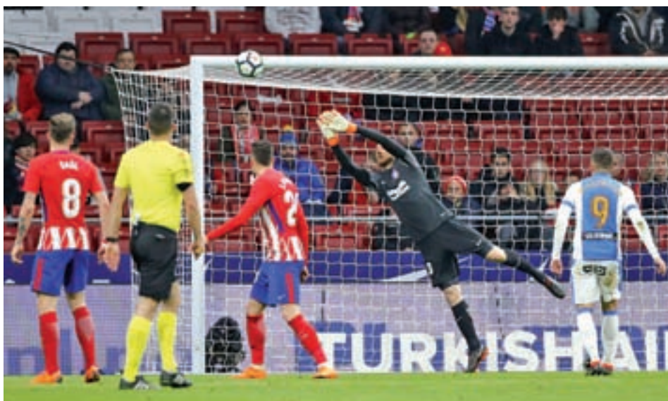
El CD Leganés, frente al tlético