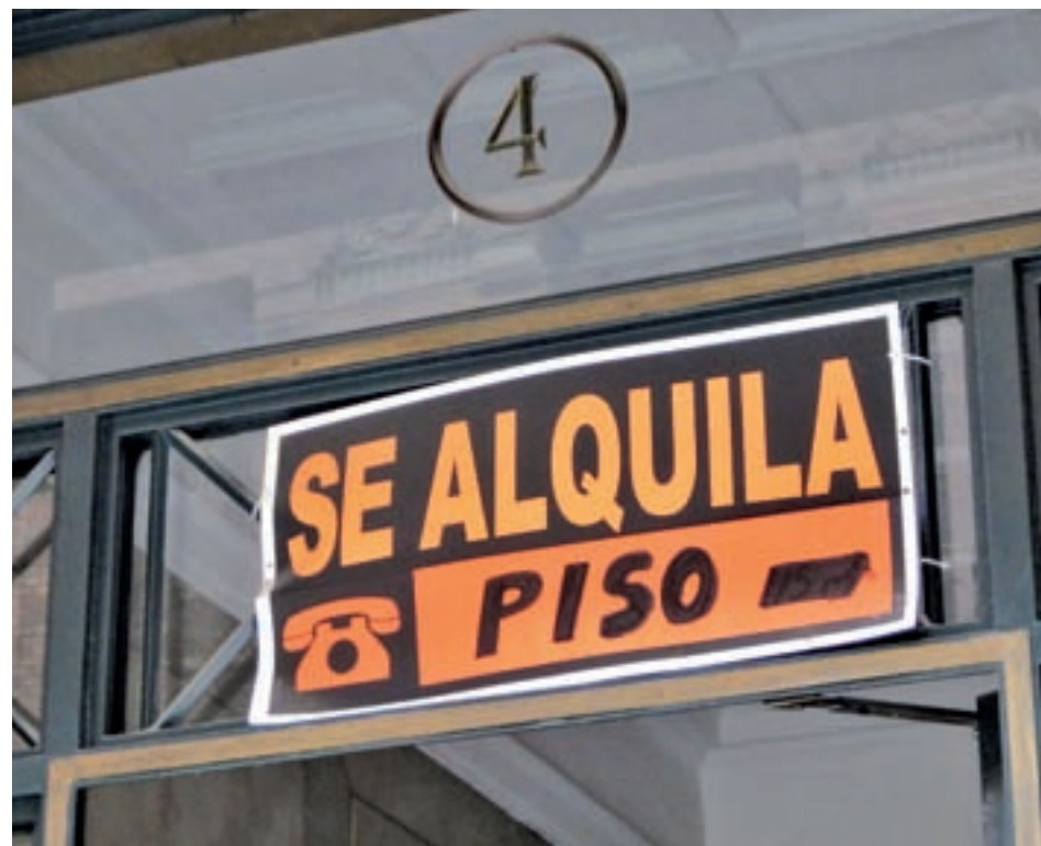
Piso de alquiler en Madrid

El coste mensual del metro cuadrado alcanza los 12 euros, la cifra más alta jamás registrada • Alcorcón es el municipio que más ha subido, mientras que Majadahonda es el que más baja