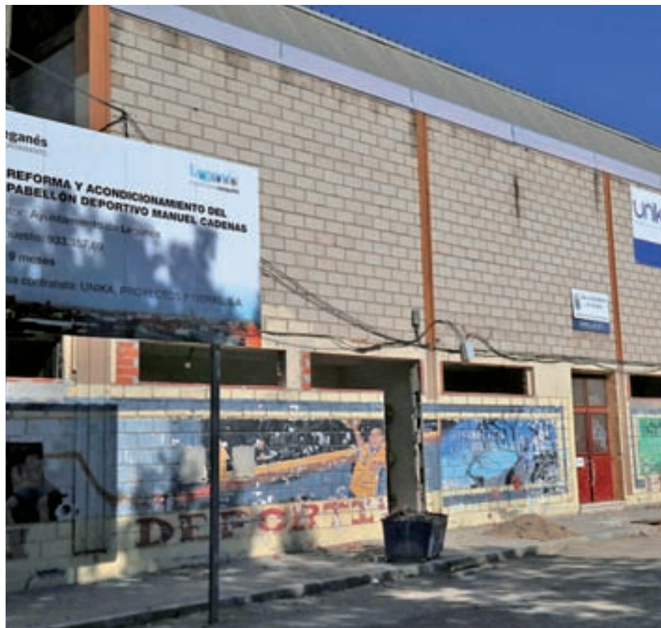
Actual estado del Polideportivo Manuel Cadenas GENTE

Tras el abandono de las obras fue necesario redactar