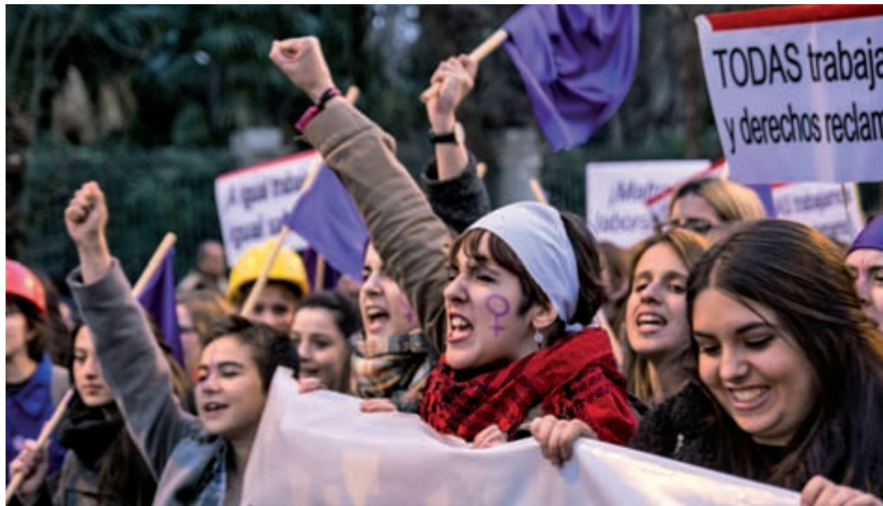
Manifestación del Día de la Mujer del pasado año