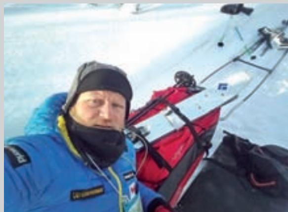
Un 'selfie' de De la Rosa en Laponia

FÚTBOL: El Wanda Metropolitano alberga la ida de los octavos de final entre el Atlético y el Lokomotiv. » beIN Sports