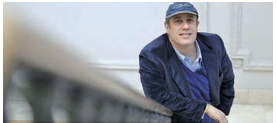
Federico Moccia estará en Barcelona

El sábado 10 de marzo, el Auditorio AXA de Barcelona acoge el primer congreso del género • Federico Moccia y Megan Maxwell son los platos fuertes de la cita • Cada año se venden en España más de 1,2 millones de estos libros