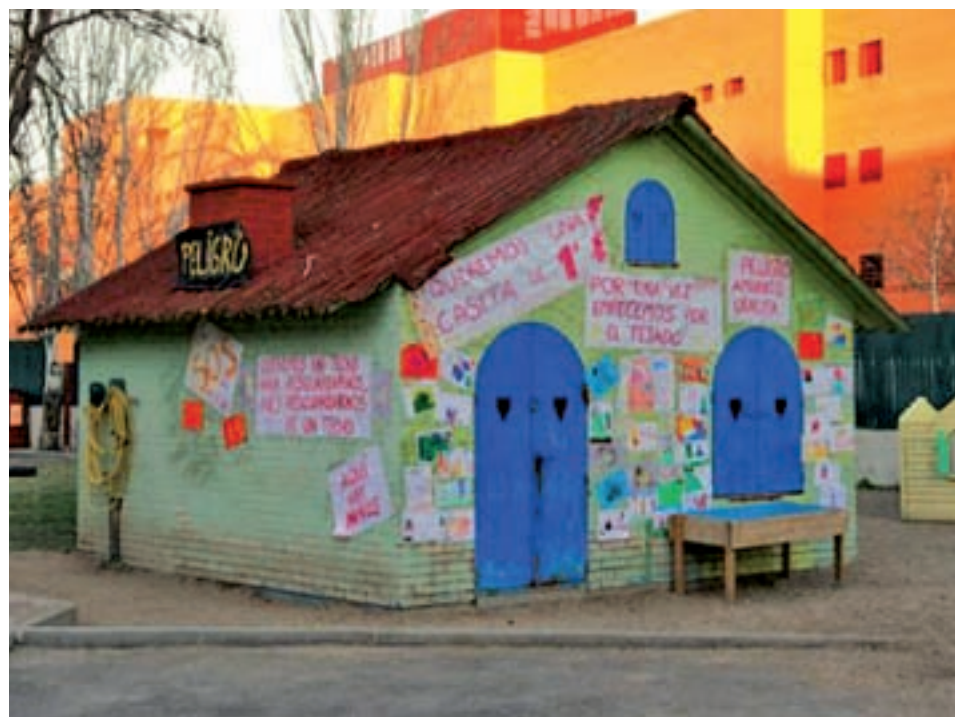
Escuela Infantil El Jeromín AMPA EL JEROMÍN

Por su parte, el alcalde de Leganés, Santiago Llorente, ha señalado que han pedido a los técnicos municipales la realización de un informe