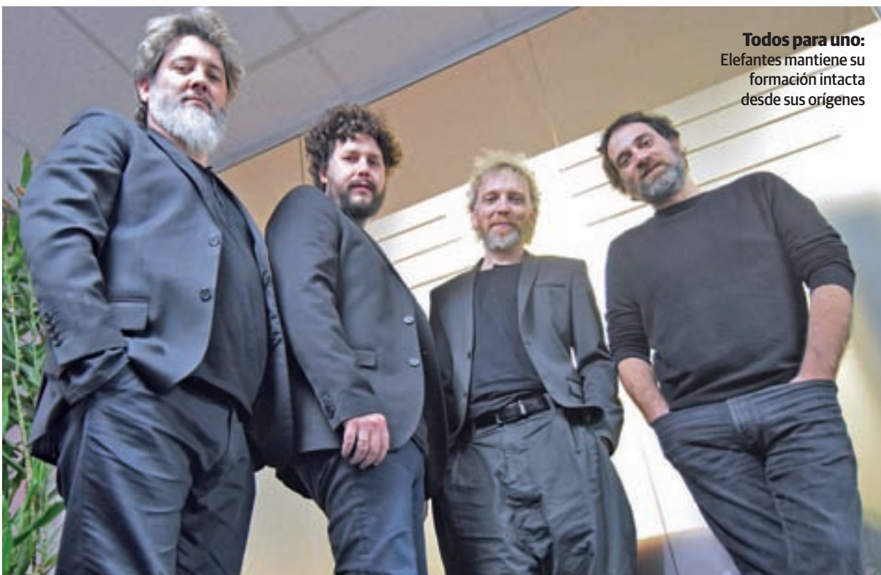
Todos para uno: Elefantes mantiene su formación intacta desde sus orígenes