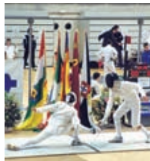
Campeonato de esgrima

El Pabellón Europa acogerá este sábado 3 de marzo desde las 9:30 horas la primera jornada de la competición infantil de gimnasia rítmica en la que participarán niños de nueve colegios de la ciudad.