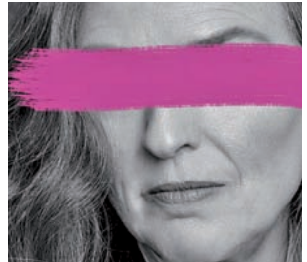
'Sin Piedad' es la canción que lucha contra esta causa

Y es que todos los beneficios irán destinados a la Fundación Luz Casanova, una organización que trabaja por el desarrollo personal y la inclusión social de personas que se encuentran en una situación de desprotección y exclusión, como aquellos sin hogar y mujeres y menores que son o han sido víctimas de violencia de género.