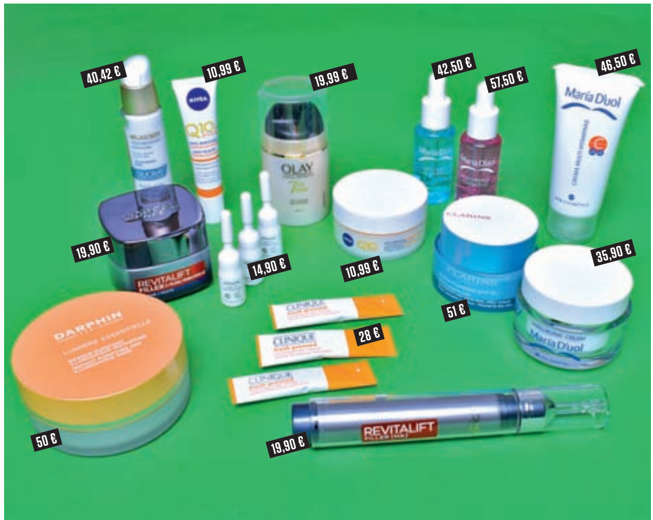
Selección de productos que contienen estos principios activos

TODO EN BELLEZA: C/ Nuñez de Balboa, 107, primera planta (Madrid). Tel. 91 883 44 55