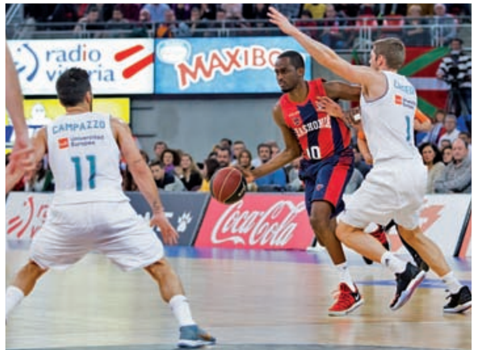
El Real Madrid lidera con comodidad la clasificación de la fase regular

El regreso de la liga regular devuelve el foco de atención a los tres frentes destacados. El Real Madrid, líder con una cómoda ventaja de cuatro victorias sobre el Valencia Basket, recibe este domingo (12:30 horas) al San Pablo Burgos, uno de los conjuntos que trata de alcanzar la