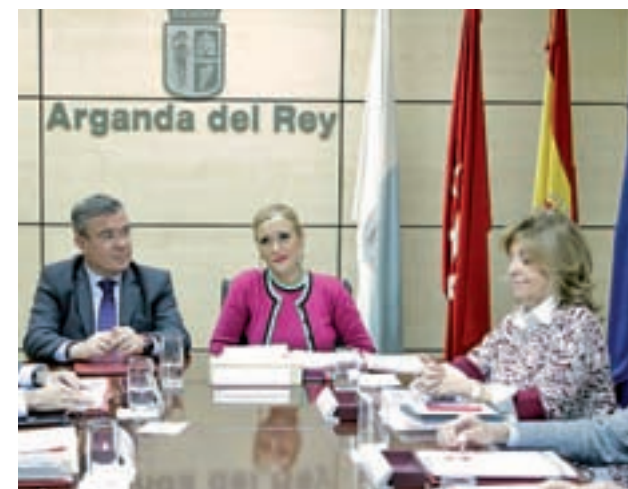
El Consejo de Gobierno aprobó la inversión

En cuanto a la baremación, se otorgarán 7 puntos a los padres que trabajen a jornada completa, mientras que los que lo hagan a tiempo parcial obtendrán 5. Las familias numerosas y las que tengan hijos discapacitados tendrán más puntuación.