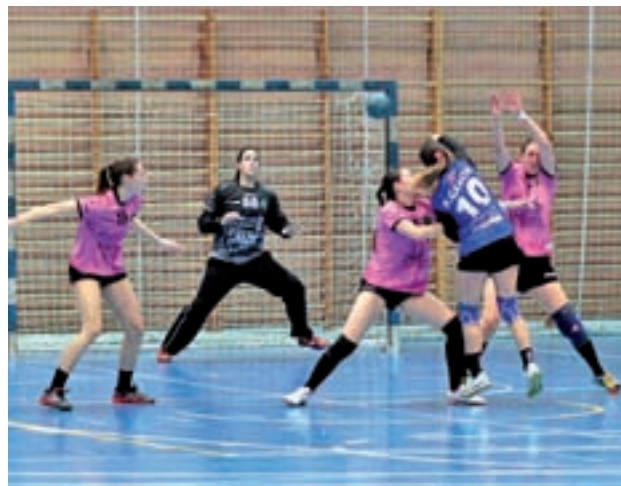
El BM Leganés, en un encuentro

Se trata de un mal rival para un cuadro pepinero que intenta salir de una racha complicada. La pasada jornada cayó en casa ante el BM Bolaños. Una derrota que le devolvió a la décima plaza. En las últimas semanas el BM Leganés ha firmado una victoria y cinco derrotas.