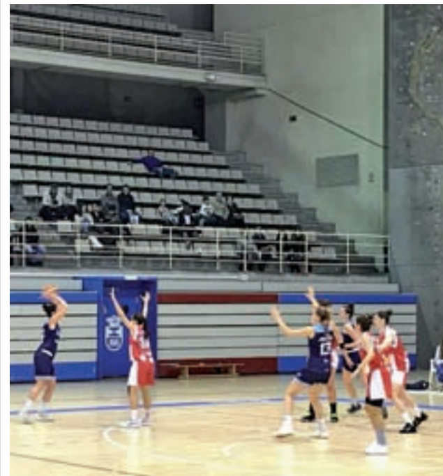
Baloncesto Leganés, en un partido CB LEGANÉS

Por su parte, el cuadro 'ché' aprovechó la derrota del 'Lega' para ascender en la tabla y colocarse tras el Spar Gran Canaria. Lo hizo al vencer al Real Canoe NC por 80-52. Una victoria que además la ratificó como el equipo que mejor racha de la Liga acumula. Actualmente suma 11 victorias consecutivas.