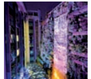
Santo Domingo Hotel