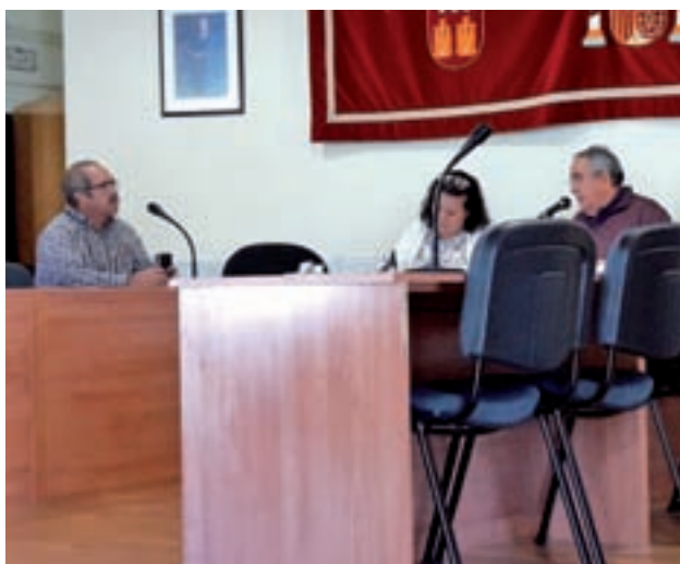
Último pleno en el que no hubo quorum