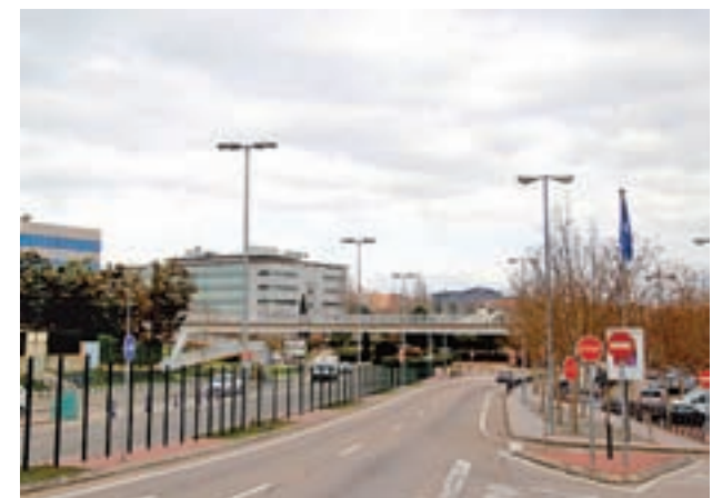
La pasarela peatonal desaparecerá

El Ayuntamiento tomó esta decisión debido a la buena regularización de semáforos con la que ya cuenta la rotonda de esta área. La conservación de dicha pasarela