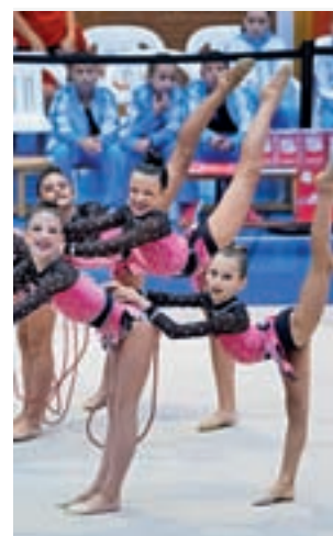
Club Alcobendas Chamartín

el 7 de octubre. El conjunto infantil finalizó en primer lugar, el alevín fue segundo y el cadete terminó quinto. En el control para la Copa de España de Conjuntos, las categorías de infantil, preferente y sénior se clasificaron y representarán a Madrid en Alicante el 25 y 26 de noviembre.