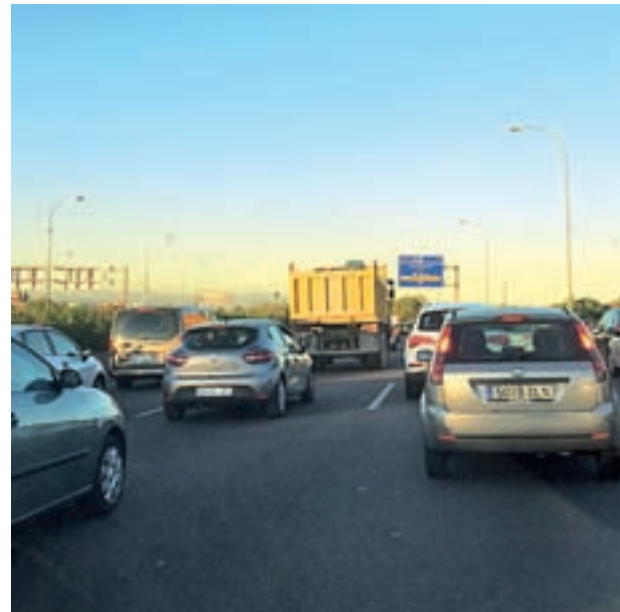
Atascos esta semana en la A-1 a su paso por Alcobendas GENTE

Hay que recordar que la alternativa de la A-1 tiene un presupuesto de 289 millones de euros y que contará con un trazado de 9,5 kilómetros. Partirá del eje M-12 y R-2 para llegar a la urbanización Club de Campo.