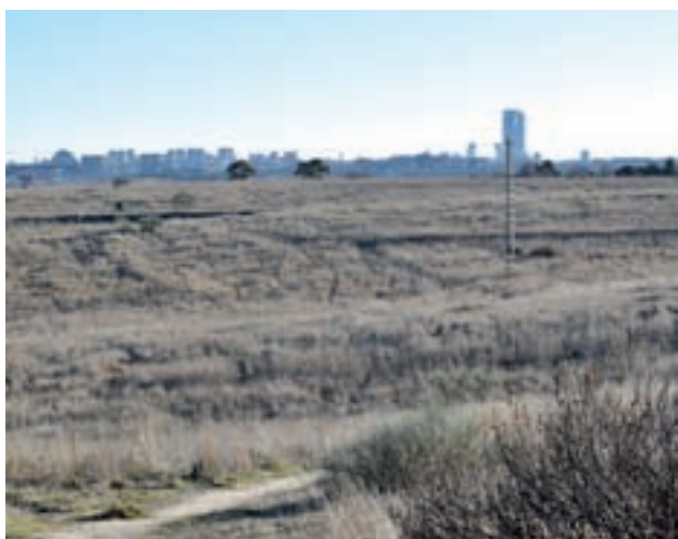
Los Carriles de Alcobendas

Los populares apoyaron a la formación naranja y dejaron sobre la mesa, en el pleno del martes, la aprobación de este desarrollo urbanístico ● Los grupos de izquierdas lo criticaron duramente