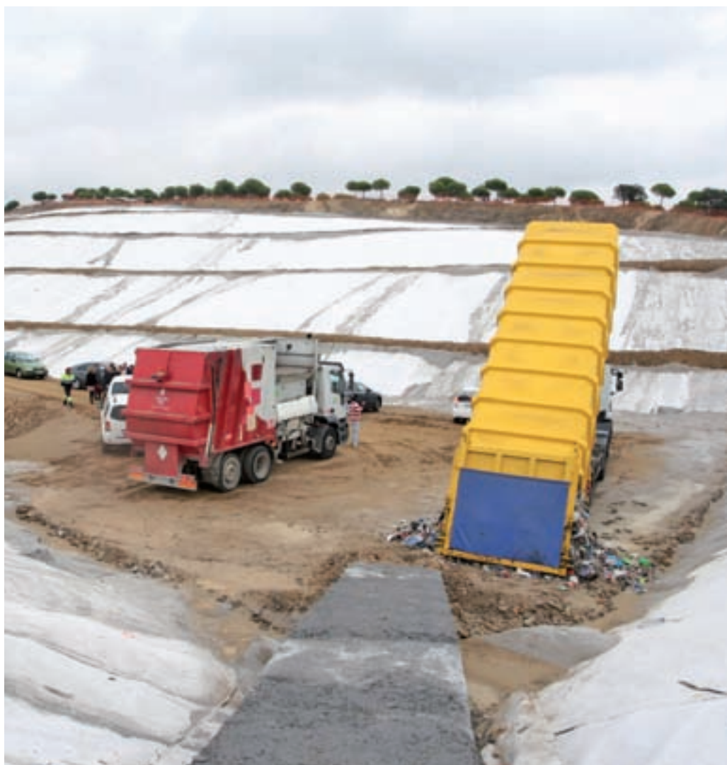
Vertedero de Colmenar Viejo

A pesar de que la gestión de los residuos es una competencia municipal, la Comunidad de Madrid se ha visto casi obligada a ayudar económicamente a los ayuntamientos en este asunto, debido a las fuertes inversiones que requiere la modernización y construcción de las plantas. El reparto de los 300 millones de subvención se hará en función de la población, con un máximo de 76 euros por habitante. Con este dinero se pretende pasar del actual 16% de reutilización de los residuos al 50% en los próximos siete años, periodo de duración de la estrategia presentada por Rollán. Con este aumento se avanzaría en el cumplimiento de la actual legislación nacional y europea.