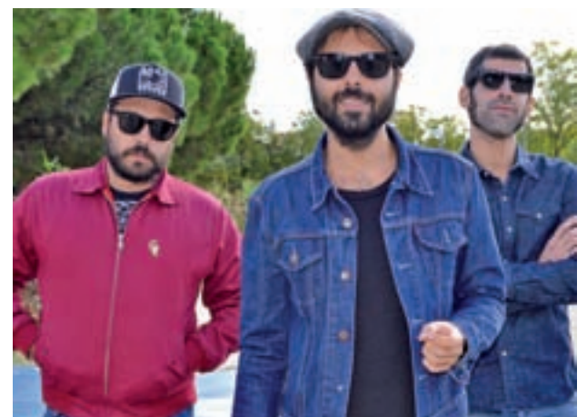
ALBA RODRÍGUEZ / GENTE

La banda madrileña de rock, en el mejor momento de su carrera, ha estrenado ‘Cuestión de gravedad’, su nuevo trabajo • Gracias a que no han tenido “grandes golpes de suerte”, ahora aprecian y valoran mucho más su situación