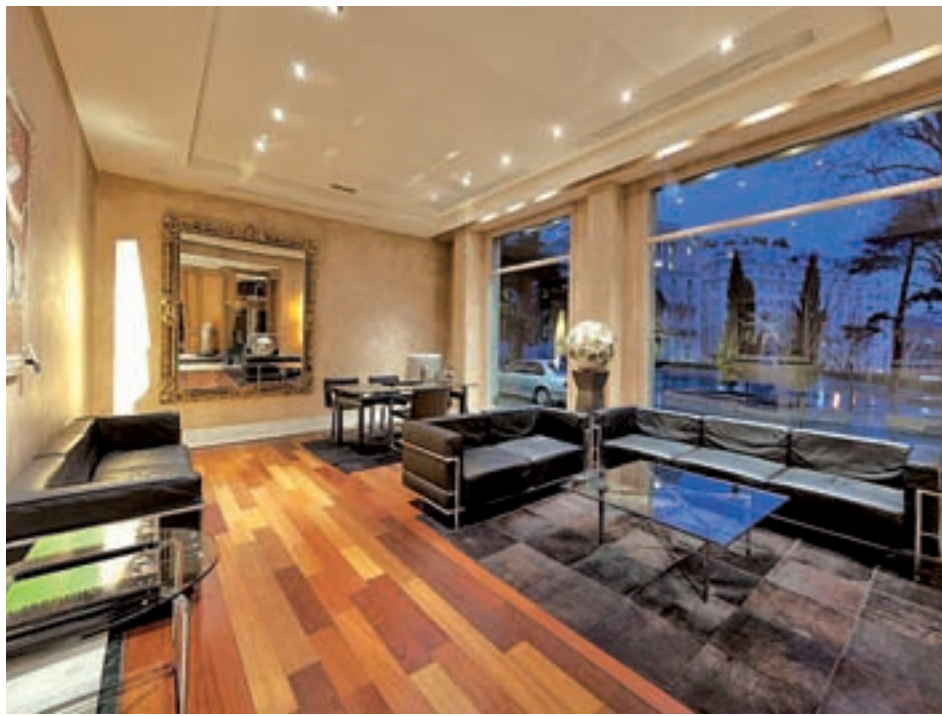
El Hotel Villa Real abre sus puertas para que se conozca su colección de arte

Las propuestas de la Madrid Hotel Week se desarrollarán en torno a la arquitectura, la gastronomía, la salud, la tecnología, la música y el arte, entre otros, y habrá muchas de ellas sin coste alguno para el público. Madrileños y visitantes podrán elegir, por