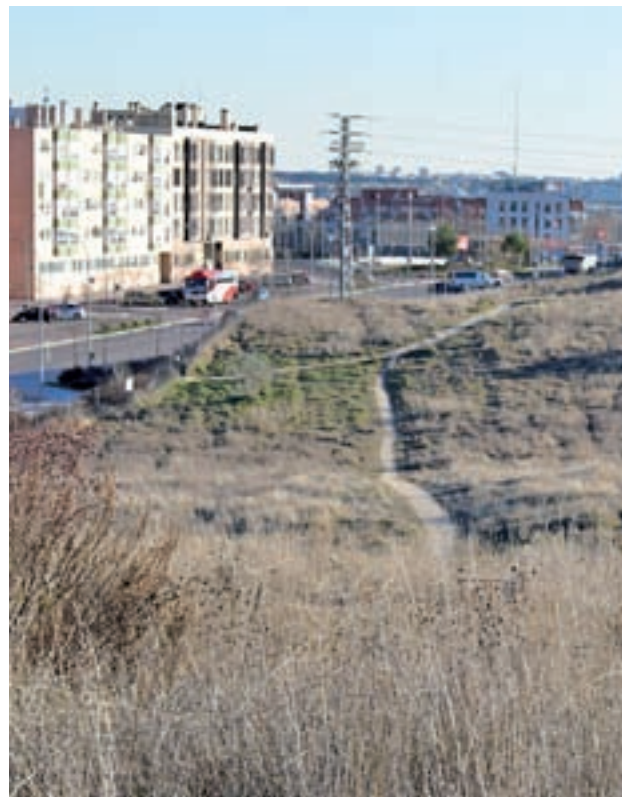
Los Carriles comienzan frente a Fuentelucha