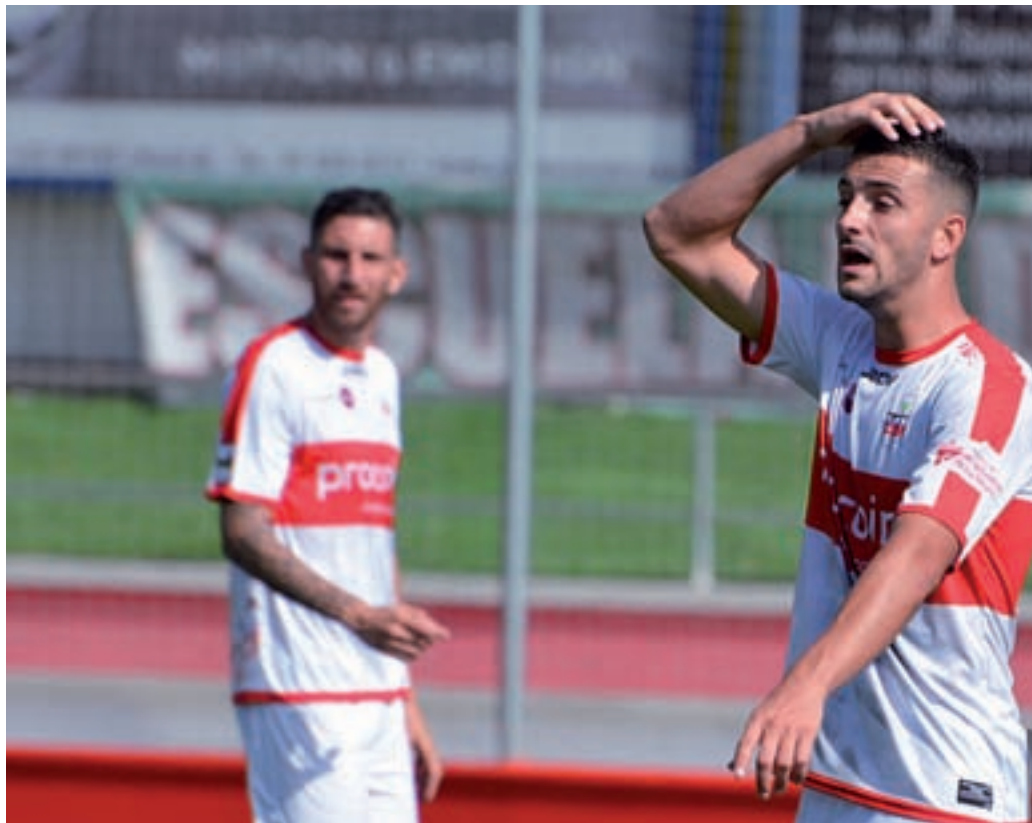
La UD Sanse perdió el pasado fin de semana contra el Bouzas

En la jornada pasada, los tricantinos abrieron el marcador cuando prácticamente