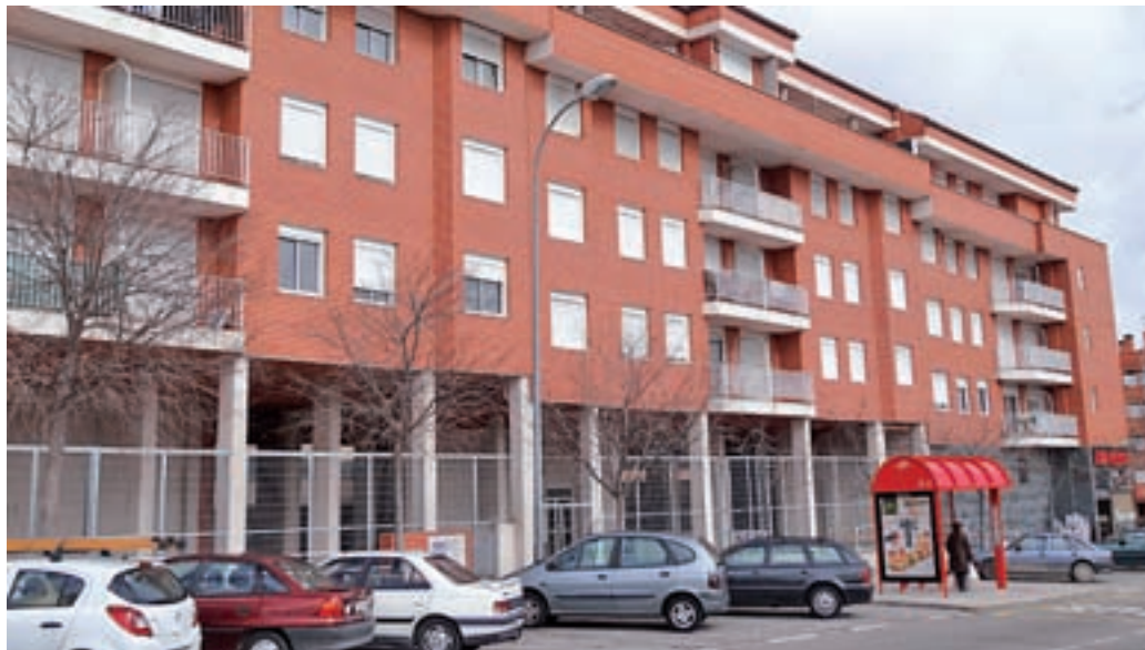
Edificio okupado en la calle Francisco Largo Caballero de Alcobendas

Sin embargo, la realidad podría superar con creces estos datos oficiales ya que, sólo en la zona de Valde las Fuentes, al norte de Alcobendas, se encuentra un edificio con unas sesenta viviendas oku-