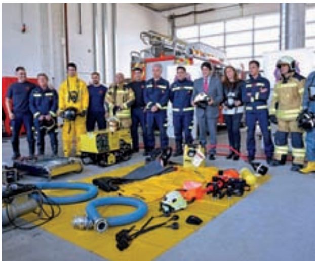
El equipo preparado para colaborar en tierras gallegas