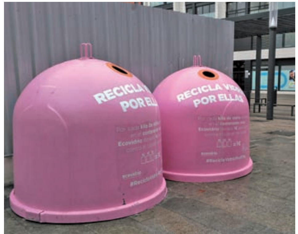
Los nuevos iglús

Alcorcón se vestirá de rosa durante las próximas dos semanas para contribuir en la lucha frente el cáncer de mama. Coincidiendo con la celebración del Día Mundial contra esta enfermedad, el Ayuntamiento ha instalado dos parejas de contenedores de vidrio tipo iglú de color rosa, en la calle Mayor frente calle Independencia y en la avenida de Leganés frente a la Casa de la Mujer, dentro de la campaña 'Recicla vidrio por ellas'. Esta iniciativa pretende movilizar a los vecinos y animarles a reciclar "para ayudar a cuidar el medio ambiente, y también para contribuir con una causa solidaria", ha explicado el representante de Ecovidrio, José Luis Magro, empresa encargada de recoger este material en la localidad. Para ello, de cada kilo de este material que se deposite en los contenedores instalados para la ocasión se donará un euro a la Fundación Sandra Ibarra. La entidad lleva casi diez años buscando fondos para abrir nuevas vías de investigación frente al cáncer. Además, como símbolo de la concienciación y soli-