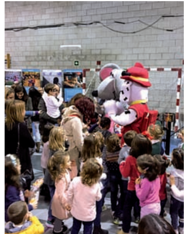
Um momento de la fiesta de 2016

Durante el evento se desarrollarán diversos talleres en los que los menores podrán crear pulpos de tela reciclada, matasuegras de animales, marcadores de páginas, o asistir al curso de coloreado de felicitaciones. Además, se propondrán actividades en familia dentro de la ludoteca, para fomentar el juego activo como medida contra el sedentarismo y el uso abusivo de aquellas actividades más individuales como los videojuegos, han explicado fuentes municipales. Dos animadores de la Concejalía de Infancia se encargarán de pintar las caras de todos los asistentes que lo