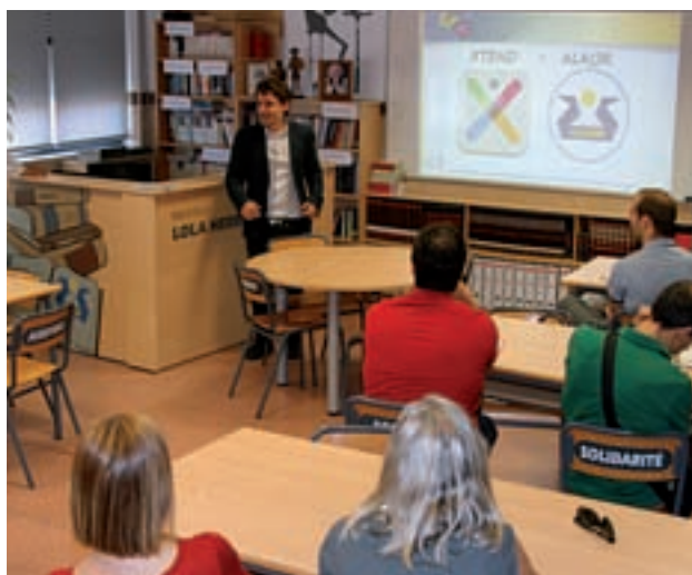
Representantes de los centros, durante la explicación ALKOR

Los interesados en asistir pueden obtener más información en 'Centrojuvenalcorcon.wordpress.com/', en el Facebook de 'Juventud.alcorcon' o también desde el perfil de Twitter de la Concejalía de este área: @juventudalcorcon.