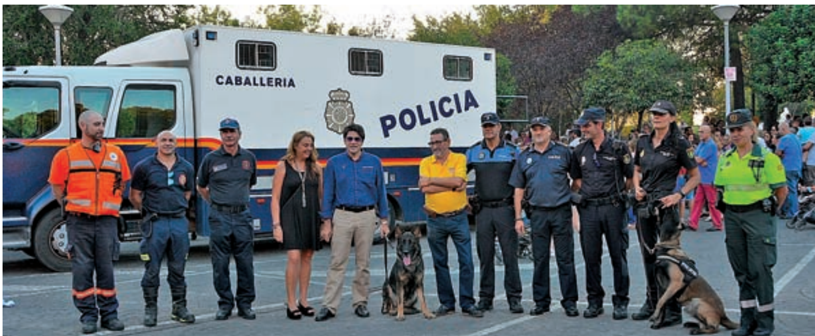
Se sumará una unidad canina