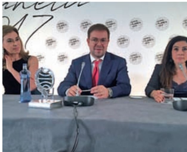
Los ganadores y Posadas en rueda de prensa tras el fallo GENTE

La herramienta distingue tres tipos de víctimas: pasiva, provocativa y atípica. La primera de ellas supone el 85% del total y se caracteriza por el retraimiento y la timidez. La segunda son muy impulsivas y devuelven las agresiones que reciben, mientras que las terceras son elegidas por falta de otros objetivos.