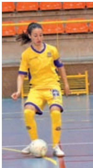
Una de las jugadoras del FSF

El Alcorcón jugará este domingo 22 de octubre a las 18 horas frente al Gimnàstic de Tarragona en el Nou Estadi, después de la derrota frente al CD Lugo que les dejó en la zona de descenso. No es el único que no están teniendo suerte. El URO Rugby Alcor-