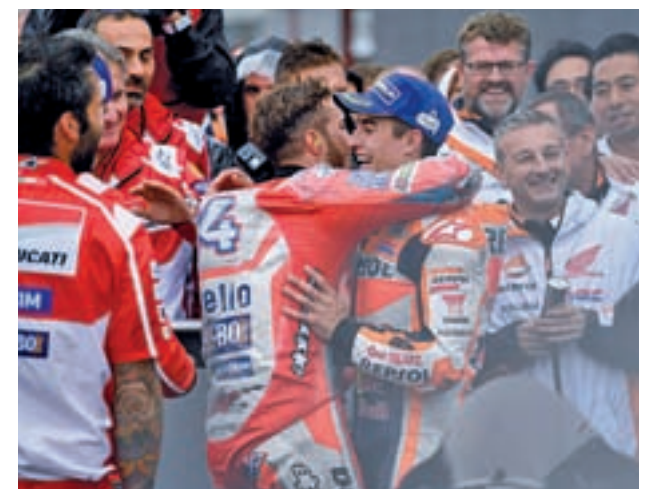
Márquez felicitó a Dovizioso por su triunfo en Japón

to3, una circunstancia que se antoja bastante factible, toda vez que aventaja en nada menos que 55 puntos a su inmediato perseguidor, el italiano Romano Fenati. Sin embargo, Mir ya recibió un serio aviso en Japón, donde no pudo acabar la carrera en la que, presumiblemente, habría dejado el título visto para sentencia.