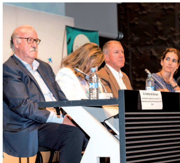
Un momento del congreso celebrado en CaixaForum

Uno de estos ilustres invitados, Vicente del Bosque, hizo el siguiente análisis sobre este asunto: "Hay dos figuras clave en estos casos ya desde el fútbol base: los entrenadores,