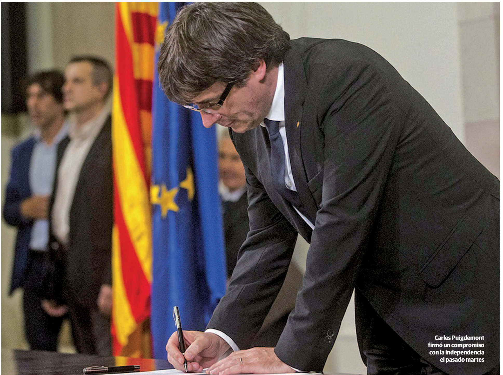
Carles Puigdemont firmó un compromiso con la independencia el pasado martes

El presidente Mariano Rajoy reclama a Carles Puigdemont que aclare si ha declarado la independencia de Cataluña • Esta demanda supone el requerimiento previo que pone en marcha la vía constitucional para la intervención de la autonomía • El Ejecutivo ha contado con el apoyo del Partido Socialista y Ciudadanos, tras negociar el inicio del debate sobre una reforma de la Carta Magna a partir de 2018 en el Congreso de los Diputados