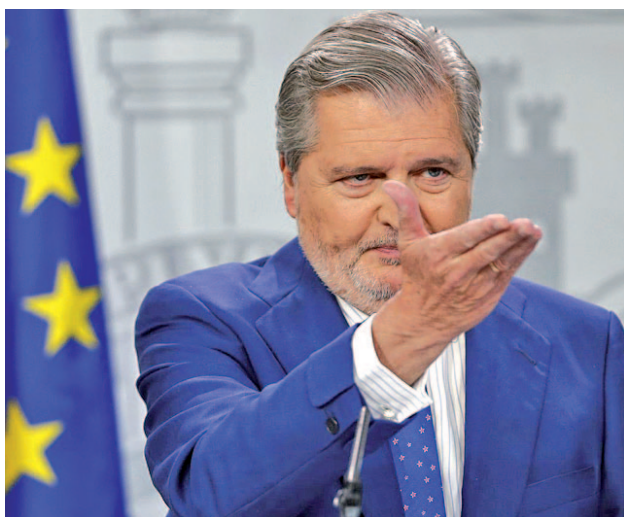
Íñigo Méndez de Vigo