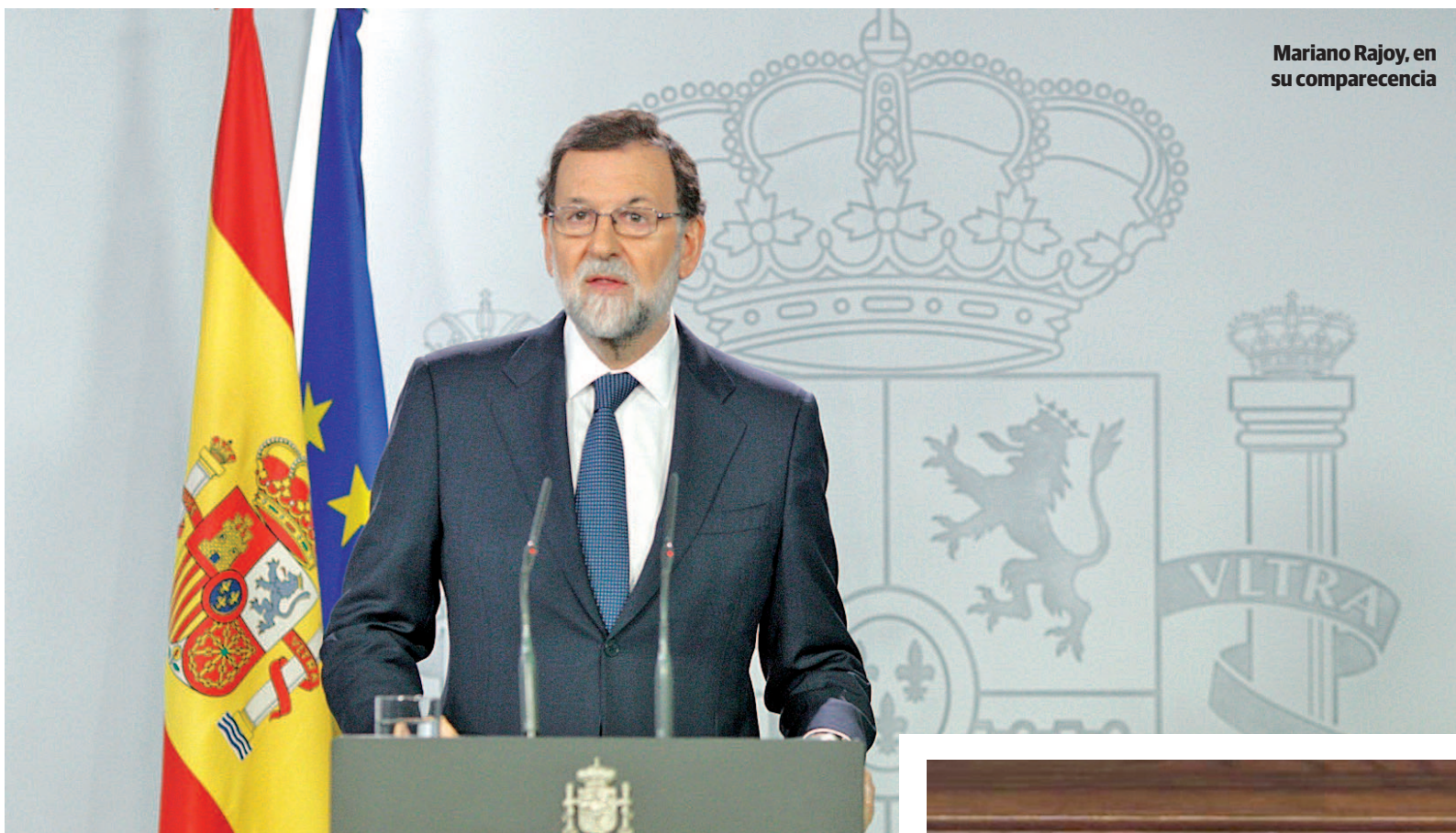
Mariano Rajoy, en su comparecencia