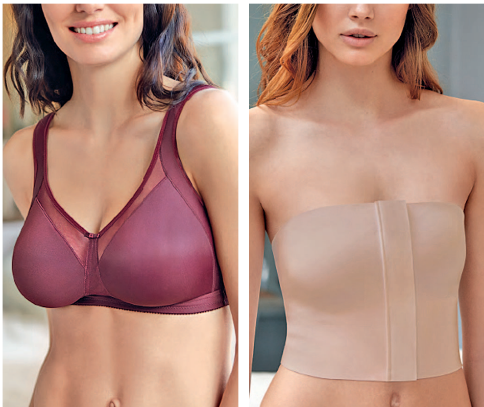
Dos modelos de sujetadores de Selmark diseñados para pacientes de cáncer de mama