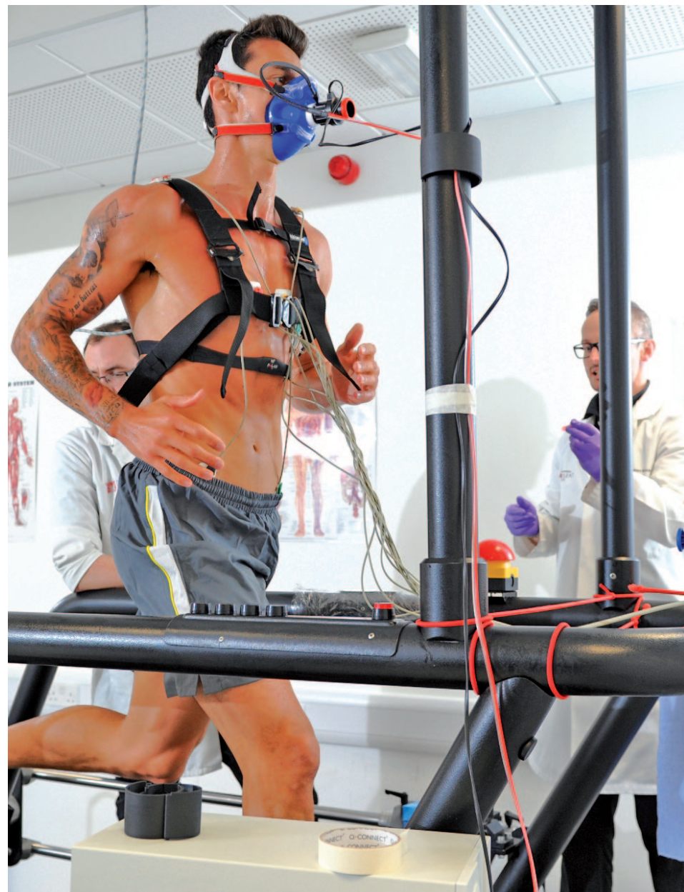
La prueba de esfuerzo, un método fiable en la prevención