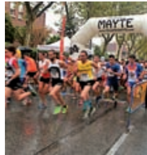
Carrera de San Nicasio

La Instalación Deportiva Butarque acoge durante los días 6 y 7 de octubre el XXIII Trofeo Villa de Leganés de tiro con arco. La competición arrancará ambos días a partir de las 9:30 horas