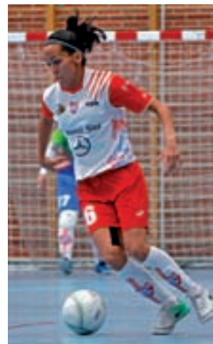
El CD Leganés, en un partido

Las pepineras visitarán a un conjunto de mitad de la tabla con la obligación de ganar para comenzar a sumar puntos en la Liga. Tras tres parti-