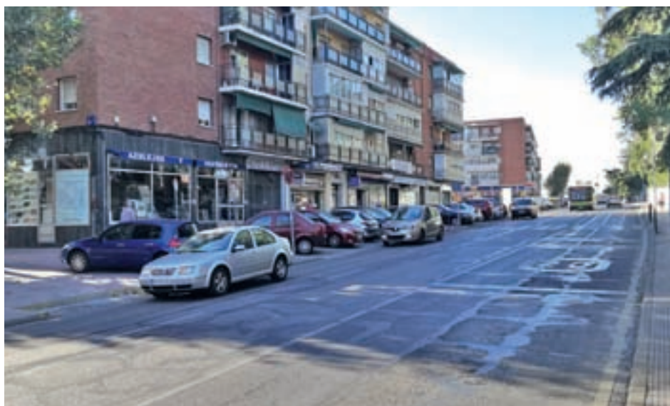
Coches en doble fila en la avenida d Fuenlabrada

sindicato en la empresa, es una situación que "va en aumento" y que se repite en la avenida de Fuenlabrada y las calles Monegros y La Rioja. En el primer caso, ha destacado que se trata de una "vía principal que, por la cantidad de coches aparcados en doble fila, se queda en un solo carril". La calle más afectada es La Rioja, donde Renero ha precisado que "se suma el estacionamiento de vehículos de grandes dimensiones, lo que nos obliga a los autobuses a invadir el carril contrario en curvas sin visibilidad y con línea continua".