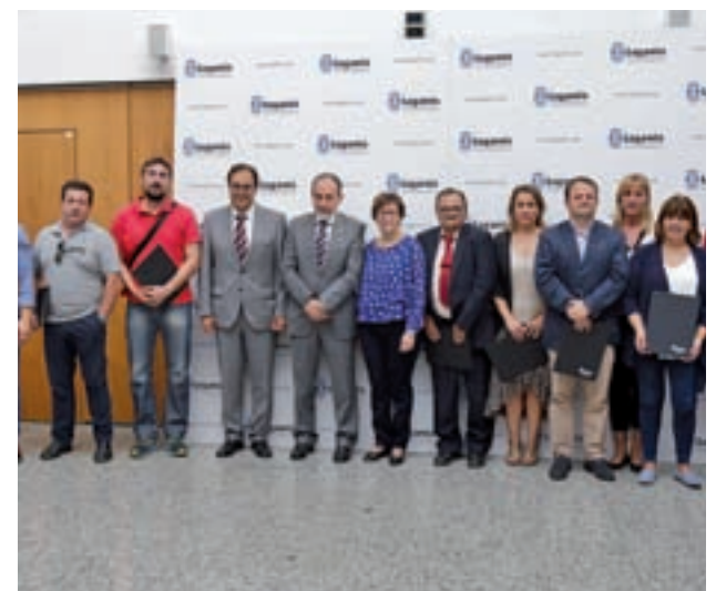
Miembros de los clubes que firmaron el acuerdo GENTE

Los convenios suscritos servirán de esta forma para apoyar el trabajo de entidades de voleibol (Club Voleibol Leganés), fútbol sala (Federación Madrileña de Fútbol Sala y Club Deportivo Leganés Fútbol Sala), balonmano (Club Deportivo Balonmano