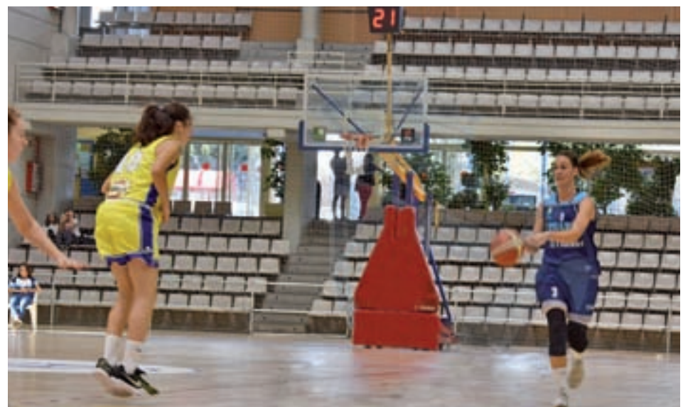
El CB Leganés, la primera jornada CB LEGANÉS

El encuentro del pasado fin de semana dejó claras las carencias del club pepinero sobre el parque. El CD Leganés recibió una goleada (0-6) por parte del Futsi Navalcarnero, vigente campeón de Liga, en un partido nada memorable.