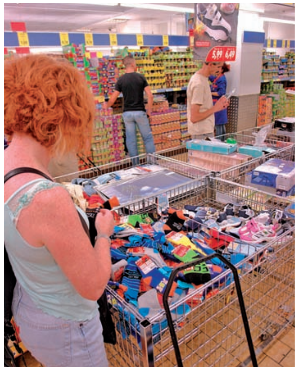
Hay grandes diferencias entre los supermercados españoles GENTE

En cuanto a las grandes cadenas que tienen presencia en todo el territorio nacional, la OCU concluye que la más barata es Alcampo, seguida muy de cerca por Mercadona, aunque esta última tiene una