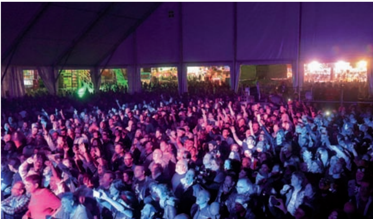
Fiestas de San Nicasio, el pasado año