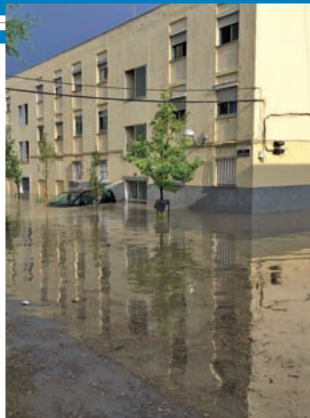
Una imagen esclarecedora de la calle de Garganchón

Pese a ser una zona de reciente construcción, Las Tablas vio como algunas de sus calles, como Puerto de Somport, sufrieron importantes embolsamientos de agua que