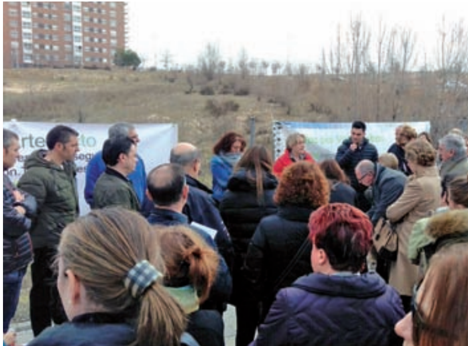
Una de las últimas protestas vecinales contra el proyecto de ARTEfacto en su barrio

Ávalos desgrana las principales razones que les hacen salir a la calle. En primer lugar, asegura que no se conce-