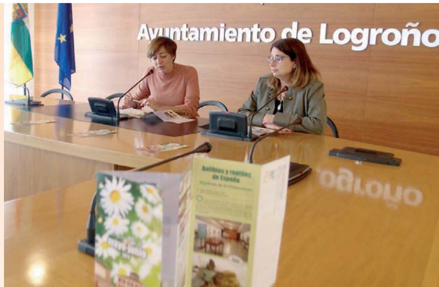
La concejal de Cultura y la directora de la Casa de las Ciencias en la presentación

Otra de las novedades de la Casa de las Ciencias es la proyección de 'Una estrella para Cervantes' , que narra durante veinte minutos el nombramiento de una estrella con el nombre del escritor español más universal. El trabajo, gana-