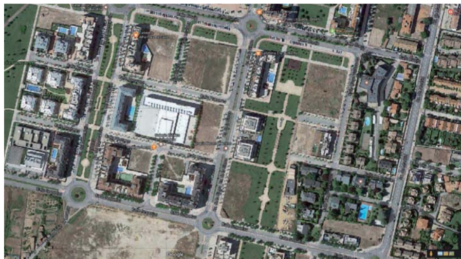
Imagen satélite de la zona de La Guindalera donde se sitúan las parcelas en venta.

Se trata de unas parcelas de uso residencial; no para viviendas de protección oficial sino para inmuebles según el precio del mercado. La venta de los solares se realizará mediante "procedimiento abierto y