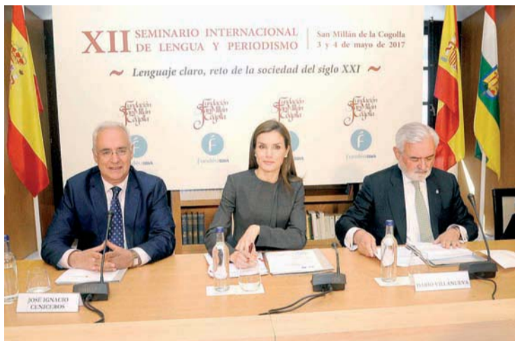
Doña Letizia, flanqueada por José Ignacio Cenicerós y Darío Villanueva.

Durante su discurso en el acto, el responsable del Ejecutivo regional señaló como de todos los hablantes "la claridad" ya que, a su juicio, "la información que no se comprende no genera conocimiento sino ruido".