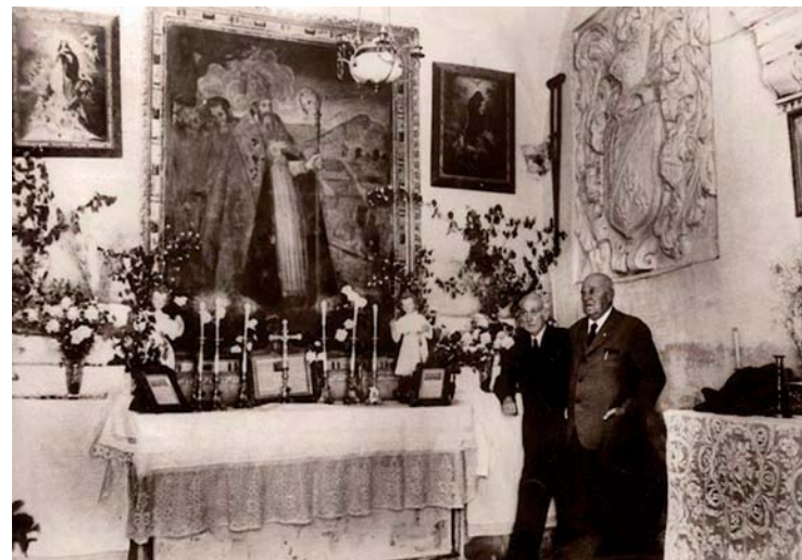
Antigua ermita, hacia 1960.