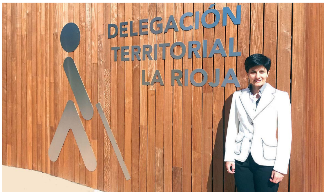
La delegada territorial de la ONCE, en el nuevo centro de la calle Chile.

Tenemos que distinguir entre Logroño y el resto de municipios. Logroño tiene una accesibilidad buena si hablamos de accesibilidad al medio físico, pero hoy en día hablamos de accesibilidad universal, es decir que el conjunto de productos, bienes y servicios sean ac-