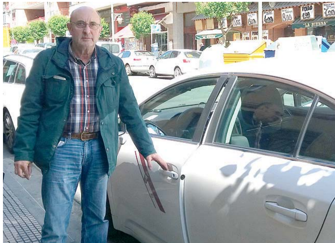
En La Rioja hay actualmente 175 licencias de taxi, en su mayoría en Logroño

Para más información: www.genteenlogrono.com - www.gentedigital.es