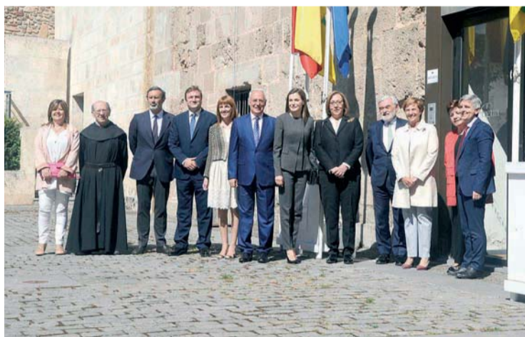
La reina posa con las autoridades antes de la inauguración del seminario.