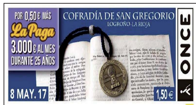
Cupón de la ONCE, 2017.