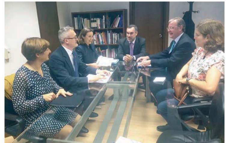
Reunión de la Asociación de Municipios del Camino de Santiago.