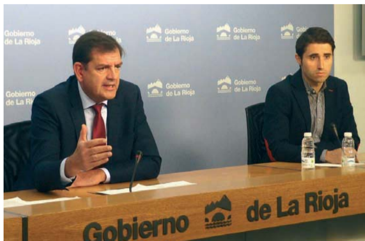
Los responsables de Agricultura han defendido el reparto

do el trabajo que la administración esta realizando en controles a posteriori y el envío del expediente a la Fiscalía "son una prueba de la contundencia del Gobierno de La Rioja ante los posibles intentos de fraude por parte de algunos solicitantes".