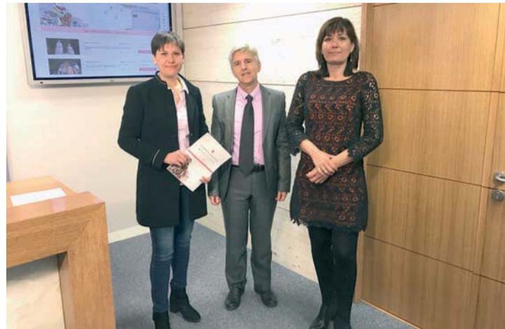
Presentación de la nueva ruta turística