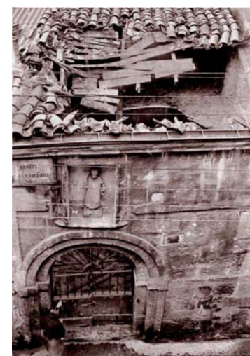
Ermita derruida, 1971.