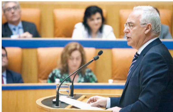
Ceniceros en un momento de su intervención en el pleno de la Cámara.

La Cámara dio luz verde por unanimidad a una proposición no de ley de Ciudadanos instando al Gobierno regional a dotar de personal a la Dirección General de Ser-