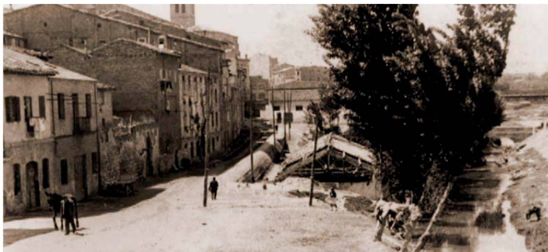
Calle y río, hacia 1940.