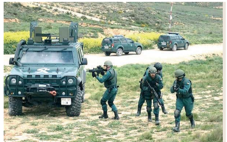
El grupo especialista de la Guardia Civil durante una de sus maniobras