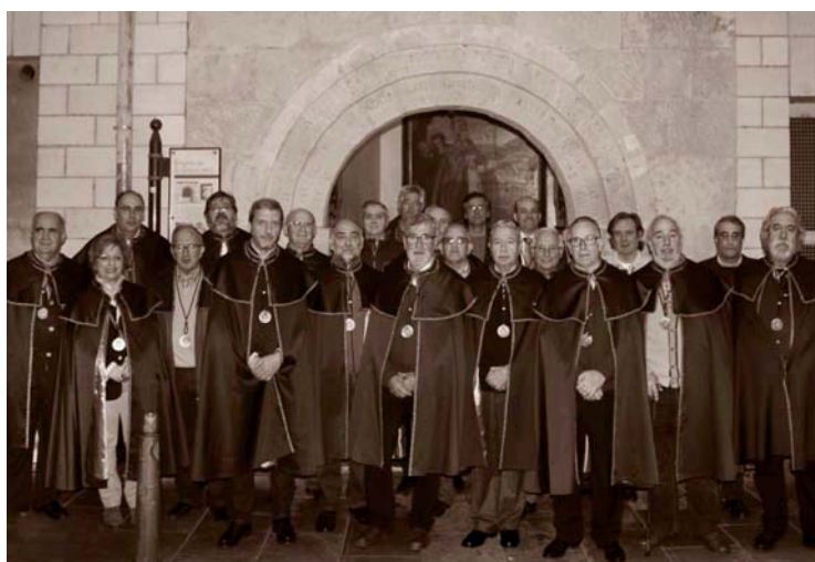
Cofradía de San Gregorio en la ermita del santo, 2016.