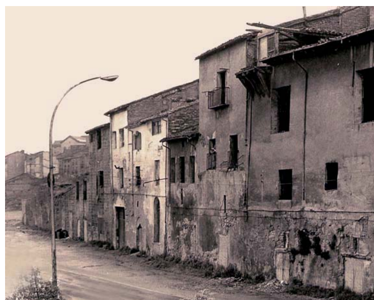
Camino de San Gregorio, hacia 1965.