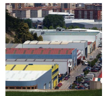
Polígono Industrial de Igollo.

Cantabria registró un saldo positivo de nueve empresas en el balance entre las llegadas y las salidas de la comunidad debido a cambios de domicilio en 2016, según el estudio que publica D&B. Madrid es la región que más empresas ha logrado atraer en los últimos tres años, con un total de 407, mientras que Cataluña es la que más ha perdido, con 279, según 'Cambios de domicilio 2016' publicado por D&B, compañía de CESCE. De las 44.726 sociedades que se mudaron, tan solo un 9%, 4.142, lo hicieron fuera.