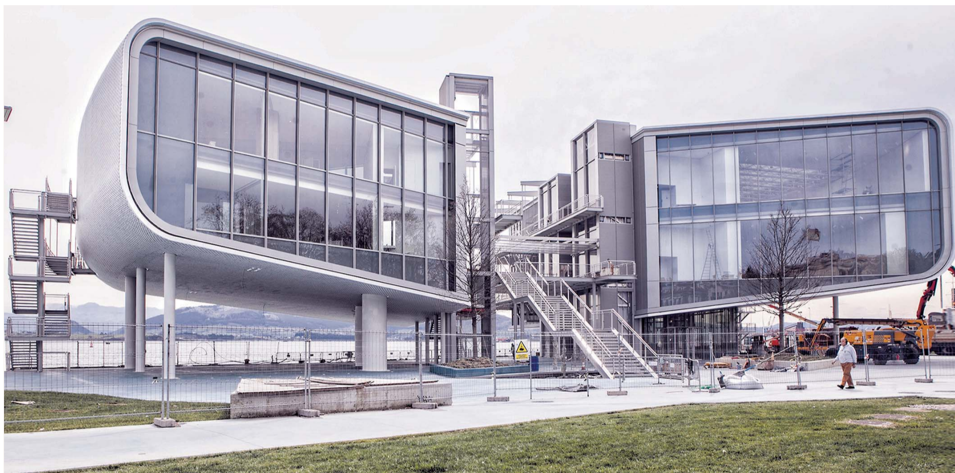
Las obras del Centro de Arte Botín, situado en los Jardines de Pereda de Santander, se iniciaron el 12 de junio de 2012.

Abrirá sus puertas el viernes 23 de junio y tanto la Casa Real como la Presidencia del Gobierno de España están invitadas a la apertura de un edificio artístico que ya forma parte de Santander y de Cantabria