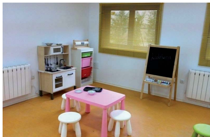
Imagen de una escuela infantil de Torrelavega.