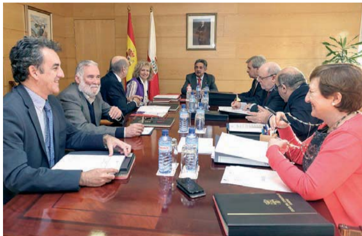
Imagen del último Consejo de Gobierno.

En Obras Públicas y Vivienda se autorizó un gasto de 100.000 euros a favor de la Fundación Instituto de Hidráulica Ambiental para financiar actividades relacionadas