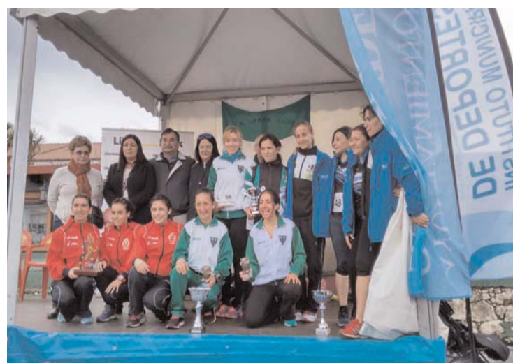
Club Atlético España de Cueto.

cuartetos masculinos, 8 mixtos y 5 femeninos, se mantiene la gratuidad de la prueba y la apertura a atletas federados y populares, a lo que se une que, a parte de las categorías masculina y femenina, hay la categoría mixta, la cual debe tener un mínimo de 2 mujeres.