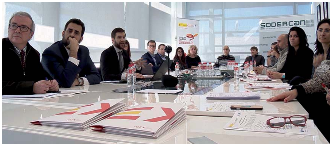
Momento de la sesión de trabajo en las oficinas de Sodercan.

son las empresas cántabras que figuran entre las más de 300 españolas que exportan a más de 60 países musulmanes.