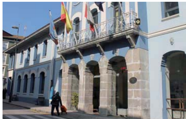
El Ayuntamiento de El Astillero.