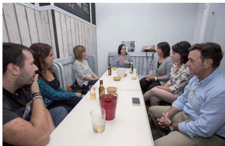
Momento de una charla en inglés durante un taller.

Habrán sesiones semanales a partir del 11 de abril cada martes en el Café-Pub Medina y cada jueves a partir del 20 de abril en la Taberna Duke's -excepcionalmente, la primera sesión se celebrará aquí el miércoles 12, al ser el jueves festivo-, con horario en ambos casos entre las 18:00 y las 20:00 horas. En estas sesiones los chavales se podrán reunir en torno a una me-