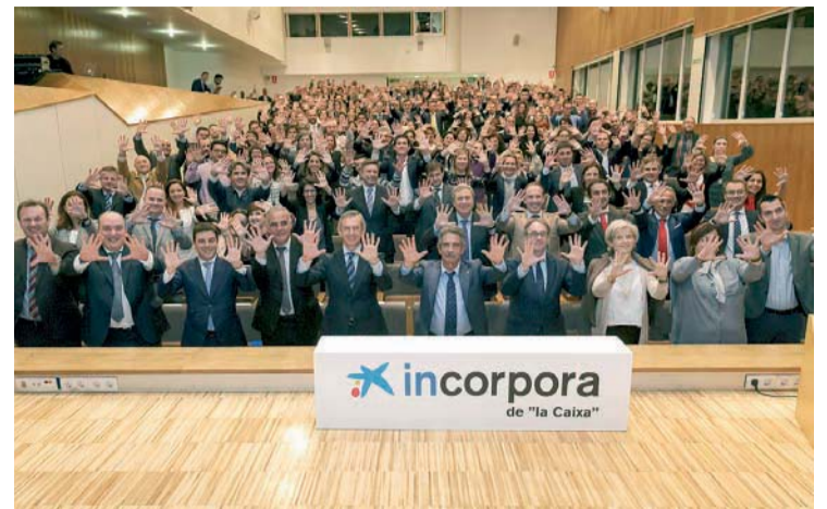
Autoridades, premiados e invitados, al término de la gala.