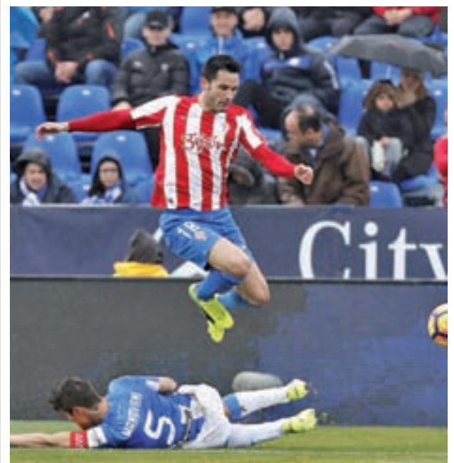
El Sporting se llevó los tres puntos de Butarque LFPES

El próximo 5 de marzo el pabellón Europa acogerá el Campeonato de Madrid de kempo, un torneo organizado por la Federación Madrileña de Karate. Comenzará a partir de las 9 horas.