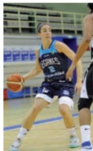
El CB Leganés sigue arriba

Las de Nacho García continúan en su lucha por alcanzar la primera plaza de la categoría. Actualmente se encuentran empatadas a 14 triunfos con el Pacisa Alcobendas y el tercer clasifica-