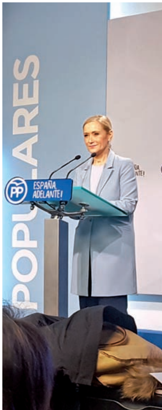
Cristina Cifuentes el martes en rueda de prensa

Cifuentes ya avanzó el martes que realizará una campaña en positivo, con el fin de ilusionar a sus afiliados. “Voy a hacer una campaña que se base en confrontar modelos para lo que queremos en el