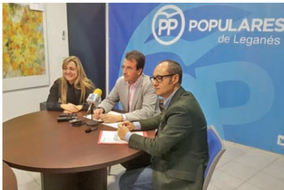
Rueda de prensa del PP de Leganés

El portavoz ha añadido que se han levantado de la mesa de forma "provisional" porque "partimos de una promesa ficticia". "Tiene que ha-