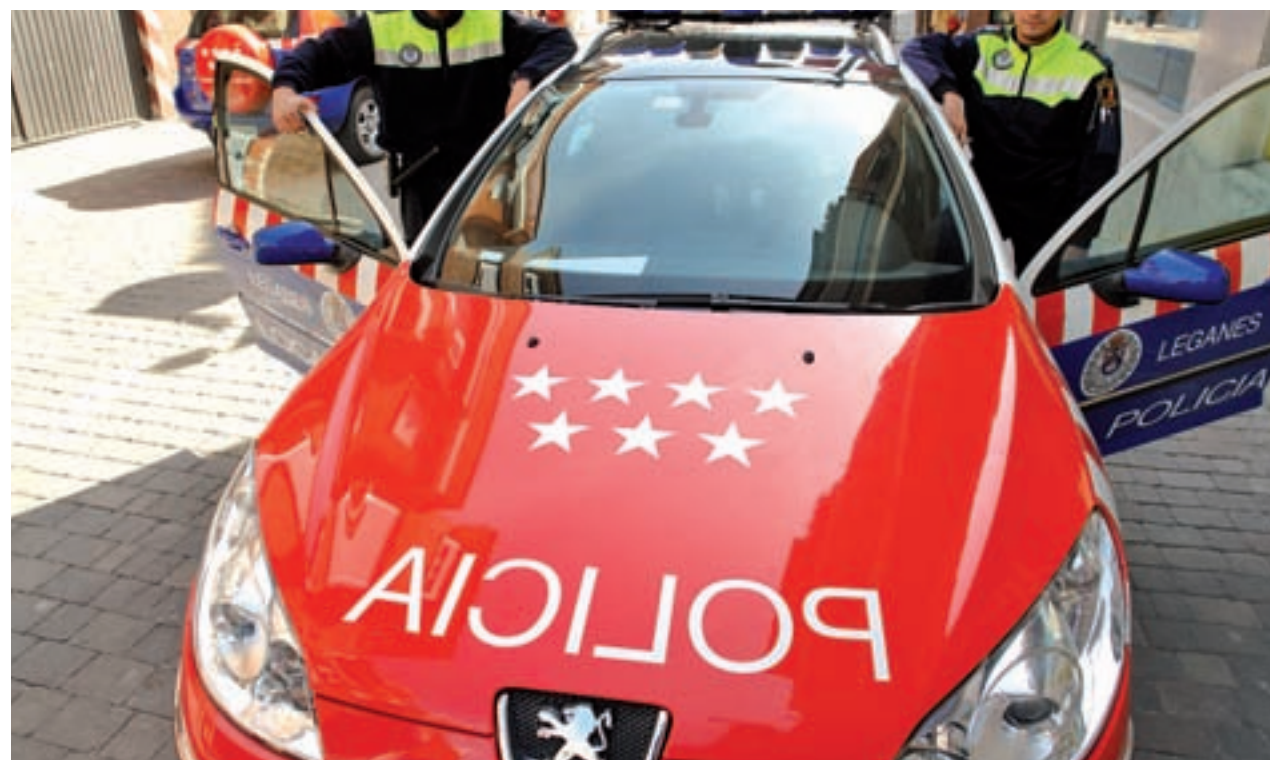
Policía Local de Leganés GENTE

Por otra parte, aunque la cifra de hurtos sigue siendo alta (4.264 en 2016, frente a los 4.294 de 2015) se ha visto reducida en un 0,7%. Al igual ha ocurrido con los delitos y faltas, que pasaron de 9.407 en 2015 a 9.361 el pasado año, lo que supone un descenso del 0,5% entre ambos años.