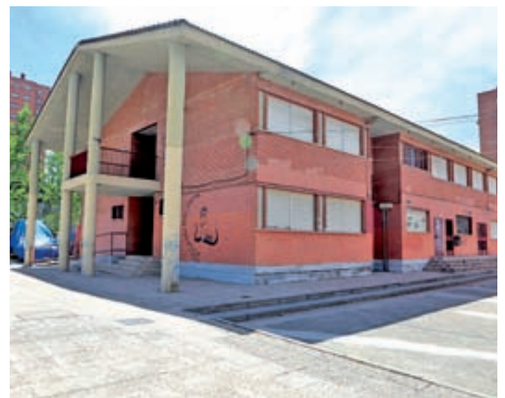
Nuevo centro en El Carrascal: Además de las remodelaciones en el interior, el proyecto incluirá condiciones especiales de accesibilidad para facilitar la participación en las actividades de las personas mayores con movilidad reducida.