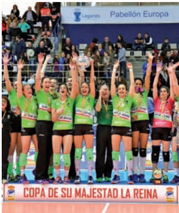
El Ciudad de Logroño defiende el título del año pasado

Los horarios de los partidos serán viernes a las 18 y 20 horas los cuartos de final; las semifinales, el sábado a las