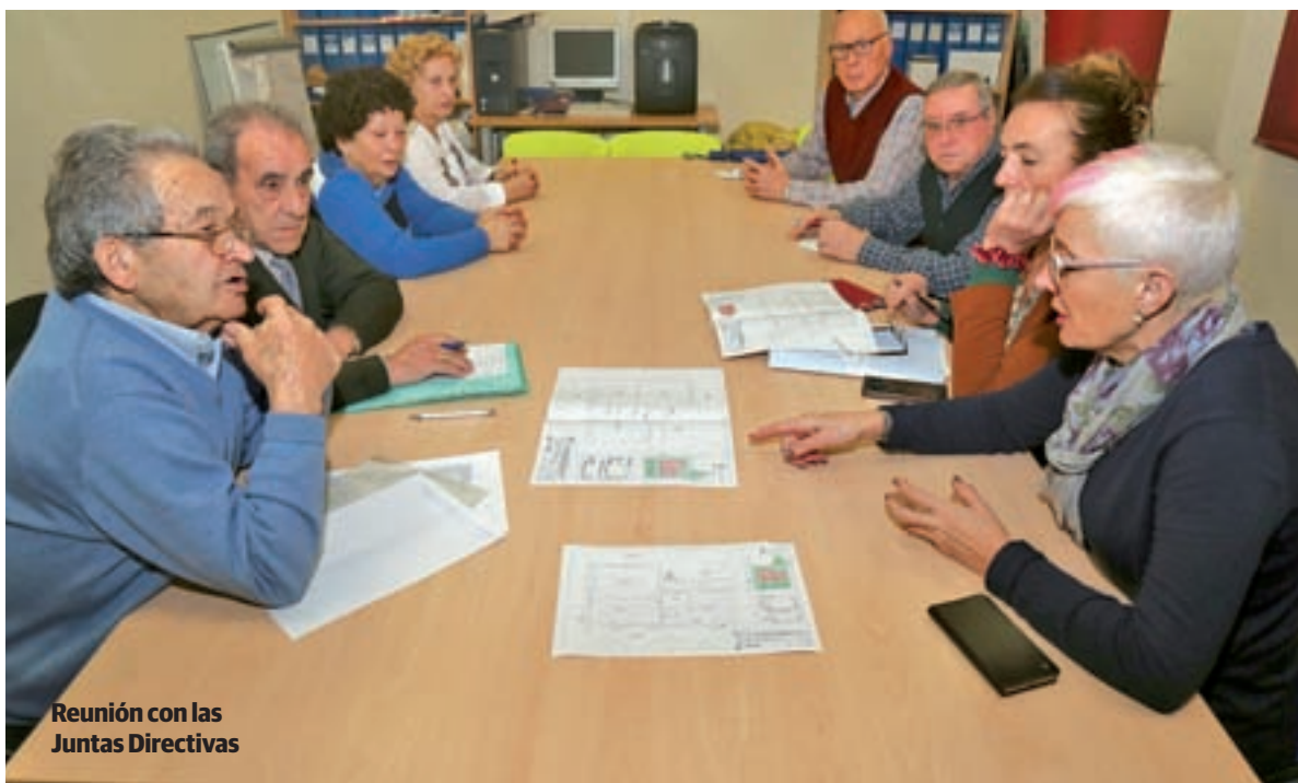
Reunión con las Juntas Directivas