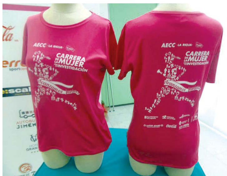
Los fondos se destinan al tercer plazo de una investigación contra el cáncer.

Las inscripciones para realizar esta carrera se pueden realizar desde el lunes 16 a través de la página web oficial de la carrera: http://carreramujer.aeccrioja.es . Los corredores también podrán inscribirse en la sede de la AECC Rioja (García Morato 17, 1º), en horario de mañana de lunes a viernes de 9,30 a 13,30, y en horario de tarde de lunes a jueves de 17,00 a 19,00 horas. Otra vía de inscrip-