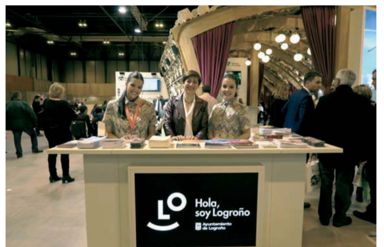
Enoturismo, gastronomía y golf, puntos fuertes de las oficinas de turismo.

Exhibición y cata de productos típicos, así como encuentros profesionales del sector turístico completan la agenda del día.