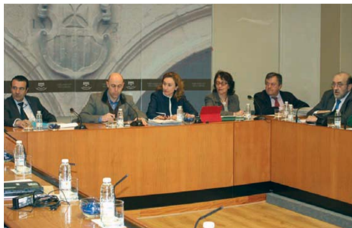
Martín destacó el inicio de las obras de la Escuela de Enfermería en 2017.

En su comparecencia, Martín destacó que “uno de cada tres euros de las cuentas regionales para este ejercicio irán destinados a nuestro sistema sanitario, y, por tanto, a potenciar nuestra Atención Primaria; a mejorar nuestras infraestructuras; a apostar por la prevención y la promoción de la salud; a que en La Rioja se disponga de las últimas y más innovadoras técnicas de asistencia sanitaria; a seguir invirtiendo en investiga-