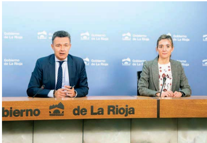
La relación entre víctima y denunciado, de pareja (437 casos) e intrafamiliar (129).

Estos datos fueron dados a conocer el lunes 16 por el consejero de Políticas Sociales, Familia, Igualdad y Justicia, Conrado Escobar, y por la directora general de Justicia e Interior, Cristina Maiso. Escobar mostró la preocupación del Ejecutivo por la existencia de supuestos