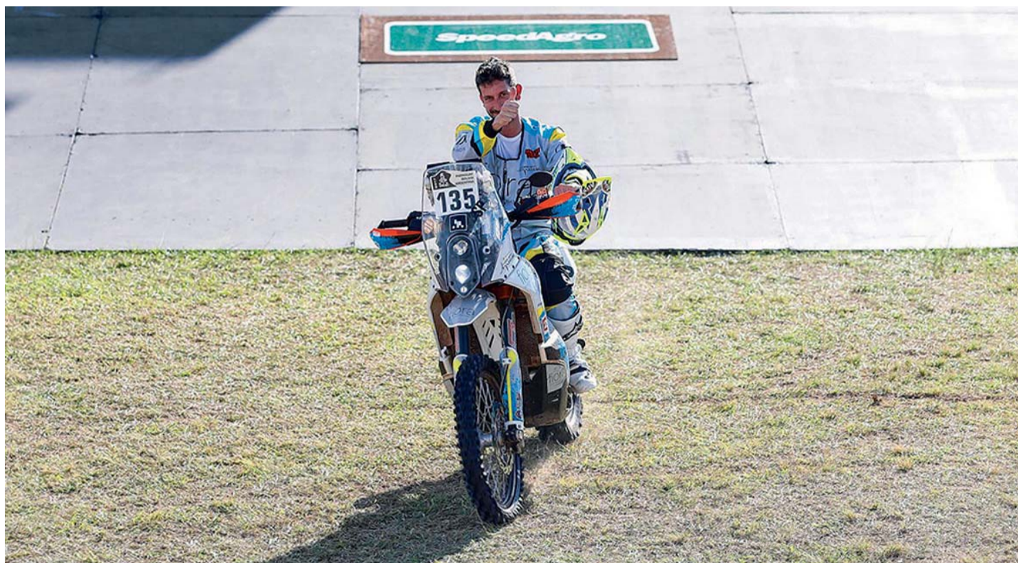
Explica que lo más bonito ha sido el compañerismo que se respira en la prueba y el asombroso paisaje de Sudamérica.

NÁJERA, 1977. ESTE JOVEN HA CONCLUIDO UNA DE LAS PRUEBAS MÁS EXIGENTES DEL MUNDO A LOMOS DE SU KTM 450, CON AYUDA DE MOTOS JOSE, EL CLUB AVENTURA TOUAREG Y FIORA BAÑOS