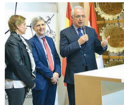
Visita instucional a Fitur.

El presidente del Gobierno de La Rioja, José Ignacio Ceniceros, anunció durante su visita al stand riojano en Fitur que se solicitará al Ministerio de Hacienda la consideración de "acontecimiento de excepcional interés público" para los actos del 20º aniversario de la declaración de los monasterios de San Millán de la Cogolla como patrimonio de la Humanidad. Si se ma-