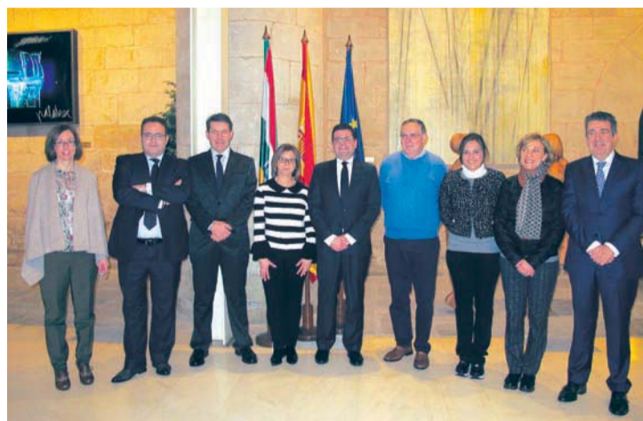
Se quiere mantener la tasa de reposición en Educación y Sanidad en el 100%.

El consejero explicó en la Cámara riojana que este año su departamento gestionará un total de 57,9 millones de euros, de los que destinará casi la mitad, 27,02, a dar un impulso a la economía de la digitalización. En esta línea, subrayó las actuaciones dirigidas a potenciar la sociedad digital en la e-administración, e-salud y e-educación. Una de las medidas avanzadas por Domínguez fue la