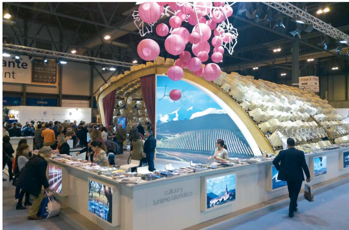
En el stand riojano se hace referencia a los 174 municipios de La Rioja

Así, desde el stand de La Rioja en Fitur se promociona la celebración de 'La Rioja Tierra Abierta 2017' en Arnedo, la Catedral de Santo Domingo de la Calzada como hito del Camino de Santiago o el Monasterio de San Millán de la Cogolla, que este año conmemora el XX Aniversario de su declaración como Patrimonio de la Humanidad por la