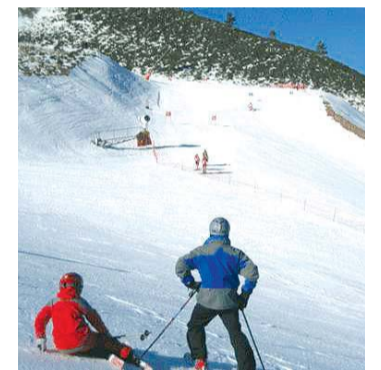
Más información en la web.

La estación invernal de Valdezcaray abre este viernes día 20 para la práctica del esquí. Según explicaron el lunes 16, había espesores de nieve de hasta 50 centímetros y se habían producido unos 50.000 metros cúbicos de polvo blanco artificial. La estación contará con una persona que ofrecerá información personalizada sobre la accesibilidad de la estación y dispondrá, por primera vez, de profesores titulados para impartir clases de esquí adaptado. Además, se ha modernizado el material que se alquila.