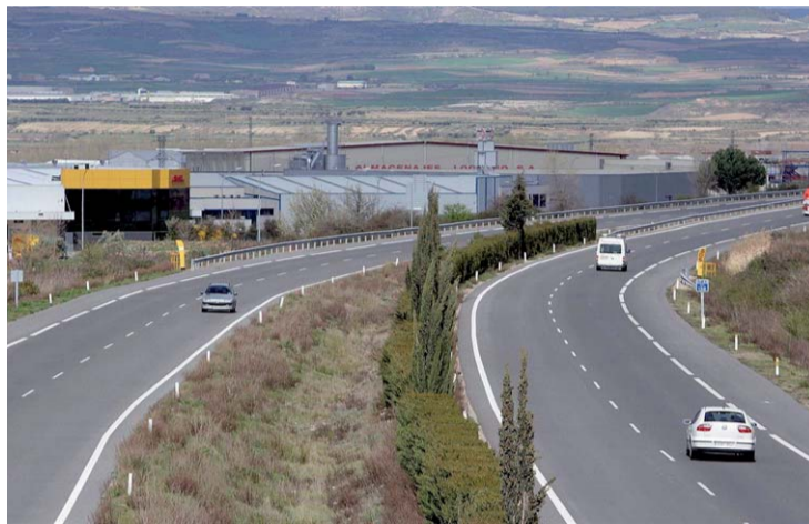
Para llevar a cabo el proyecto habrá que ocupar terrenos en ocho municipios.

Cuca Gamarra considera que es "una noticia muy importante porque demuestra el firme compromiso del Gobierno de España con el desarrollo de nuestras infraes-