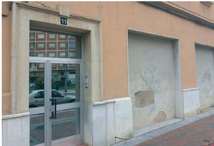
El local está ubicado en el número 11 de la Avenida de España.

El espacio contará con un acceso adaptado alternativo, un gran salón de ocio de 110 metros cua-