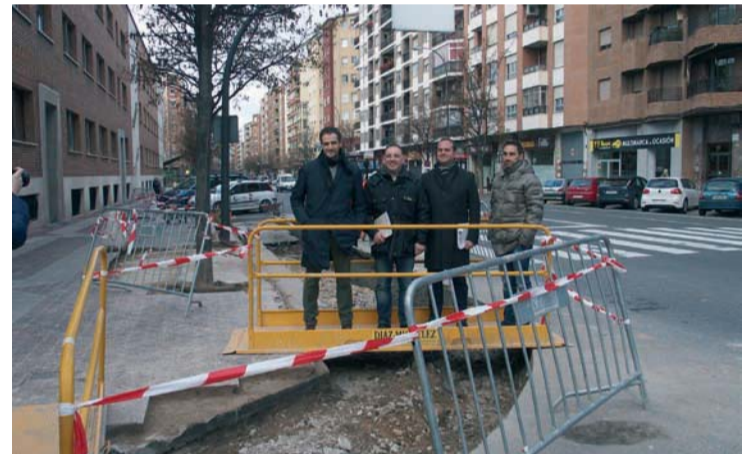
Responsables municipales han visitado las obras en Avenida de la Paz

Iglesias destacó que la seguridad del peatón "debe ser prioritaria". A las obras de adecuación de las vías hay que añadir programas de sensibilización ciudadana en las redes sociales o el "primer itinerario escolar seguro" del colegio Caballero de la Rosa.