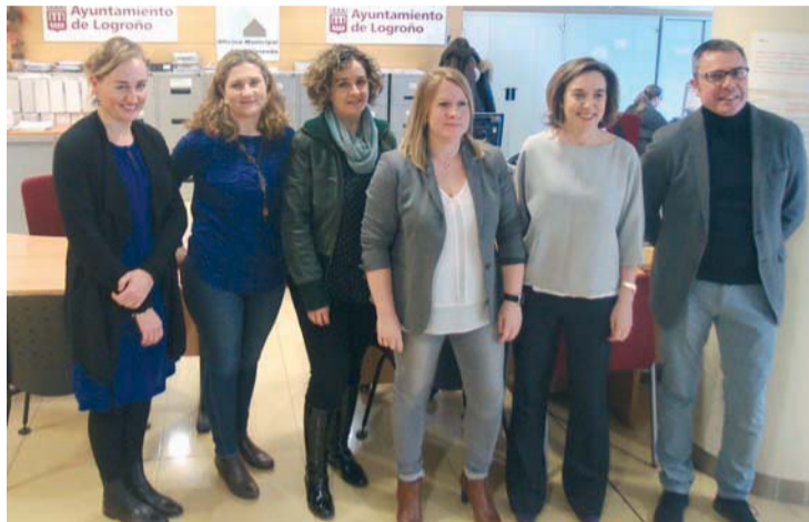
Responsables municipales se reunieron con los técnicos de la oficina de Vivienda.