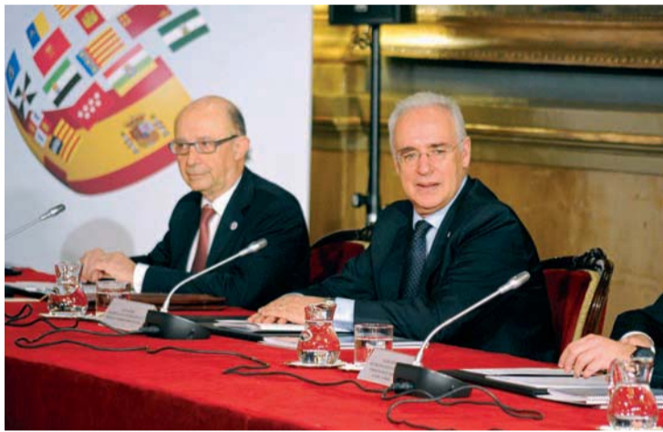
El Presidente destaca que se empiece a trabajar en un pacto por la educación.

No obstante, destacó la existencia de un consenso por “huir de planteamientos bilaterales y centrarse en definir un modelo que mejore el sistema actual, que no empeore la financiación que percibe actualmente cada comunidad y que tampoco pretenda so-