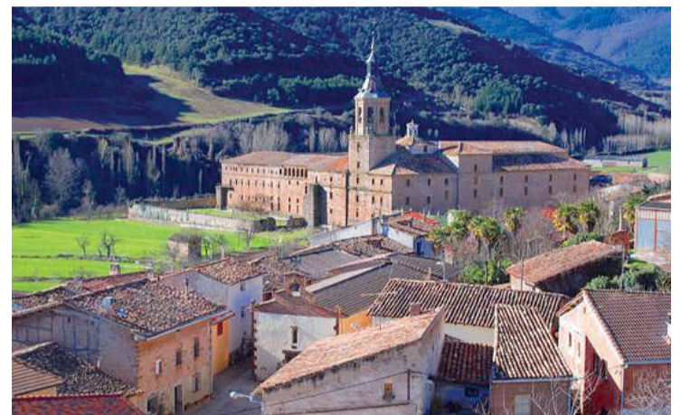
Los usuarios puntuaron a La Rioja con 4,48 por sus lugares de interés.

En el mismo estudio, La Rioja también destaca por disponer de la valoración más alta de toda España en cuanto a lugares de interés, con una media de 4,48. También los alojamientos riojanos ofrecen un servicio de excelencia a los viajeros, puntuados con un 4,08, mientras que los restaurantes obtuvieron una valoración de 4,05 puntos.