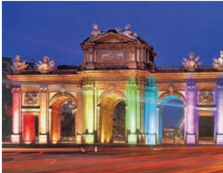
Madrid acogerá en verano la fiesta mundial del Orgullo Gay

En su séptima edición, que se celebra hasta el domingo, Fitur Gay contará con el apo-