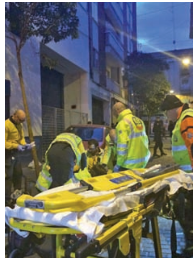
El Samur intentó reanimar sin suerte al fallecido

Pese a lo mucho que se ha comentado en diferentes foros, este vecino asegura que no existe una alarma social por estos dos sucesos. "La gente es muy exagerada, es más la sensación de inseguridad que la realidad según los últimos datos facilitados por la Policía Nacional y por la Policía Municipal en los Consejos de Seguridad. Se tratan de hechos puntuales que podrían haber pasado en otros