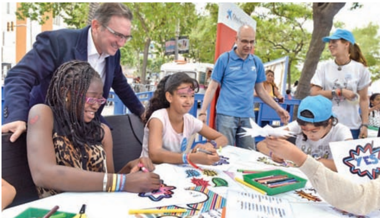
Jaume Giró, director general de la Fundación Bancaria 'la Caixa', en una de las actividades con voluntarios

La iniciativa está dentro de la Estrategia de Inclusión Social 2016-2021 del Gobierno regional, cuyo objetivo es dar una respuesta eficaz ante situaciones de exclusión social y caminar hacia una sociedad madrileña más inclusiva, a través de políticas y medidas sociales más activas e integrales. Para ello se va a realizar un diagnóstico profundo de las actuales necesidades sociales de los colectivos más vulnerables.