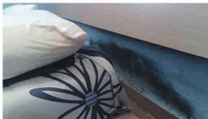
Problemas de humedad por capilaridad

Se han realizado estudios científicos sobre adolescentes que sufren afecciones respiratorias, dando como resultado un 83% de asma, bronquitis asmáticas y bronquitis crónicas y un 87% de rinitis crónicas, que alcanzan a jóvenes que viven en habitaciones demasiado húmedas. De un 20 a un 30% de nosotros sufrimos alergias respiratorias, ¡dos veces más que hace 20 años!. Edouard Drouhet,