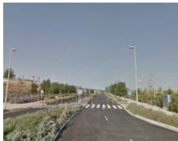
La Avenida de Francisco Javier Sáenz de Oiza

Según la Asociación de Vecinos de Valdebebas, este acceso “alivia el tráfico en el barrio, sirve para acceder desde Sanchinarro a la M-40 y directamente a Hortaleza y a la M-11 ahorrando algún kilómetro en cada trayecto. Era un ser-