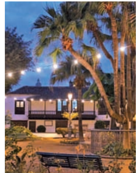
Paisajes urbanos y naturales que no puedes dejar de conocer: De arriba a abajo y de izquierda a derecha: Casco histórico de La Orotava, Icod de los Vinos, Puerto de Los Gigantes y Parque Nacional del Teide.