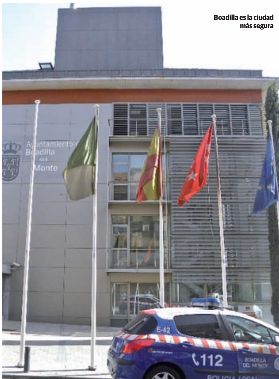
Boadilla es la ciudad más segura

las ciudades del Noroeste (a las que se añade Alcalá de Henares), que presentan unos índices muy bajos de incidentes, y las del Sur y la capital, que son las que muestran un mayor número de intentos de allanamiento de morada. La única excepción es Alcobendas, la cuarta por la cola