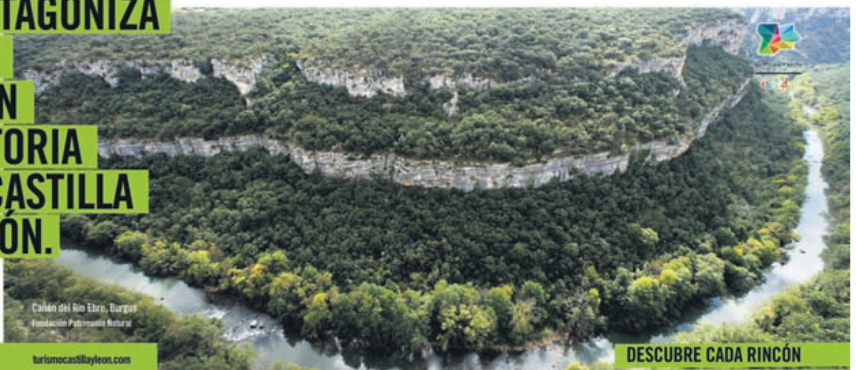
Cañón del Río Ebro, Burgos Fundación Patrimonio Natural

PROTAGONIZA UNA GRAN HISTORIA EN CASTILLA Y LEÓN.