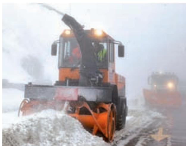
La nieve volverá a la sierra

La Comunidad de Madrid se ha mostrado contraria a esta medida anteriormente.