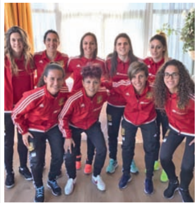
Las jugadoras del Atlético, durante la concentración