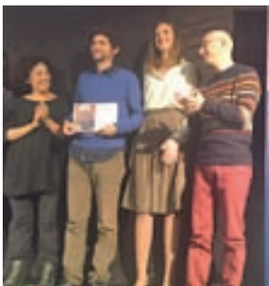
La edición anterior

La EMT, con la financiación del Consorcio, ha mejorado la accesibilidad de 32 paradas de autobuses en la capital. Los distritos de Barajas, Fuencarral-El Pardo y Hortaleza se han visto beneficiados.