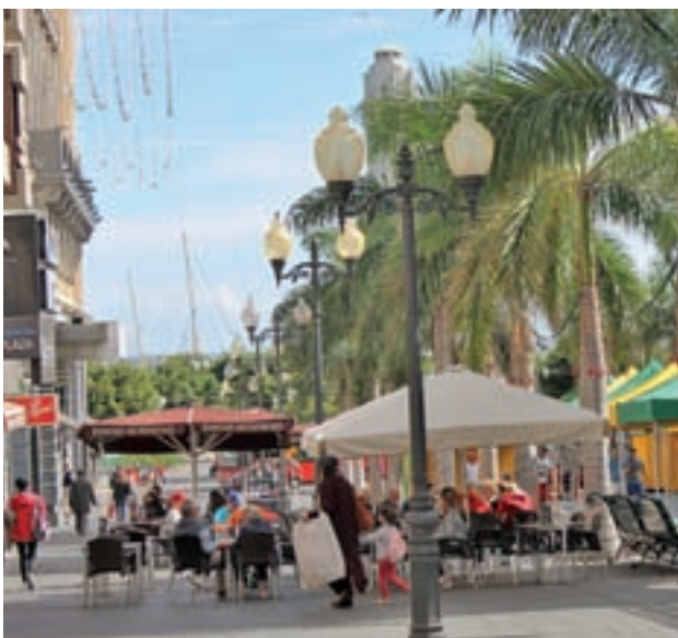
Santa Cruz de Tenerife: El Museo de la Naturaleza, el Museo Histórico Militar de Canarias o el Mercado Municipal Nuestra Señora de África son algunas de las cosas que visitar en una ciudad con una extraordinaria riqueza histórica, cultural y monumental.