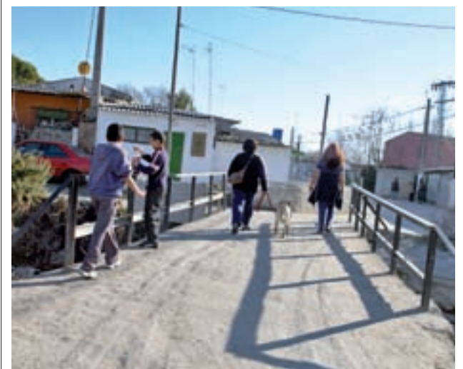
Poblado chabolista en Madrid GENTE

Entre las acciones impulsadas se encuentran la promoción del deporte y la cultura entre la infancia en riesgo de exclusión social o con discapacidad; el apoyo a menores hospitalizados y sus familias; medidas solidarias a favor de las personas en situación de pobreza, como por ejemplo recogidas de alimentos; el voluntariado internacional; la reinserción social de colectivos que se encuentran en circunstancias difíciles; y las acciones de protección y mantenimiento del medio ambiente.