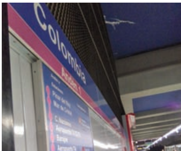
Uno de los andenes del suburbano

El Centro Cultural Carril del Conde acoge hasta el 19 de abril el XIII Certamen de Teatro Abierto de Hortaleza, organizado por la Junta de distrito. 14 representaciones optan al premio de este año.