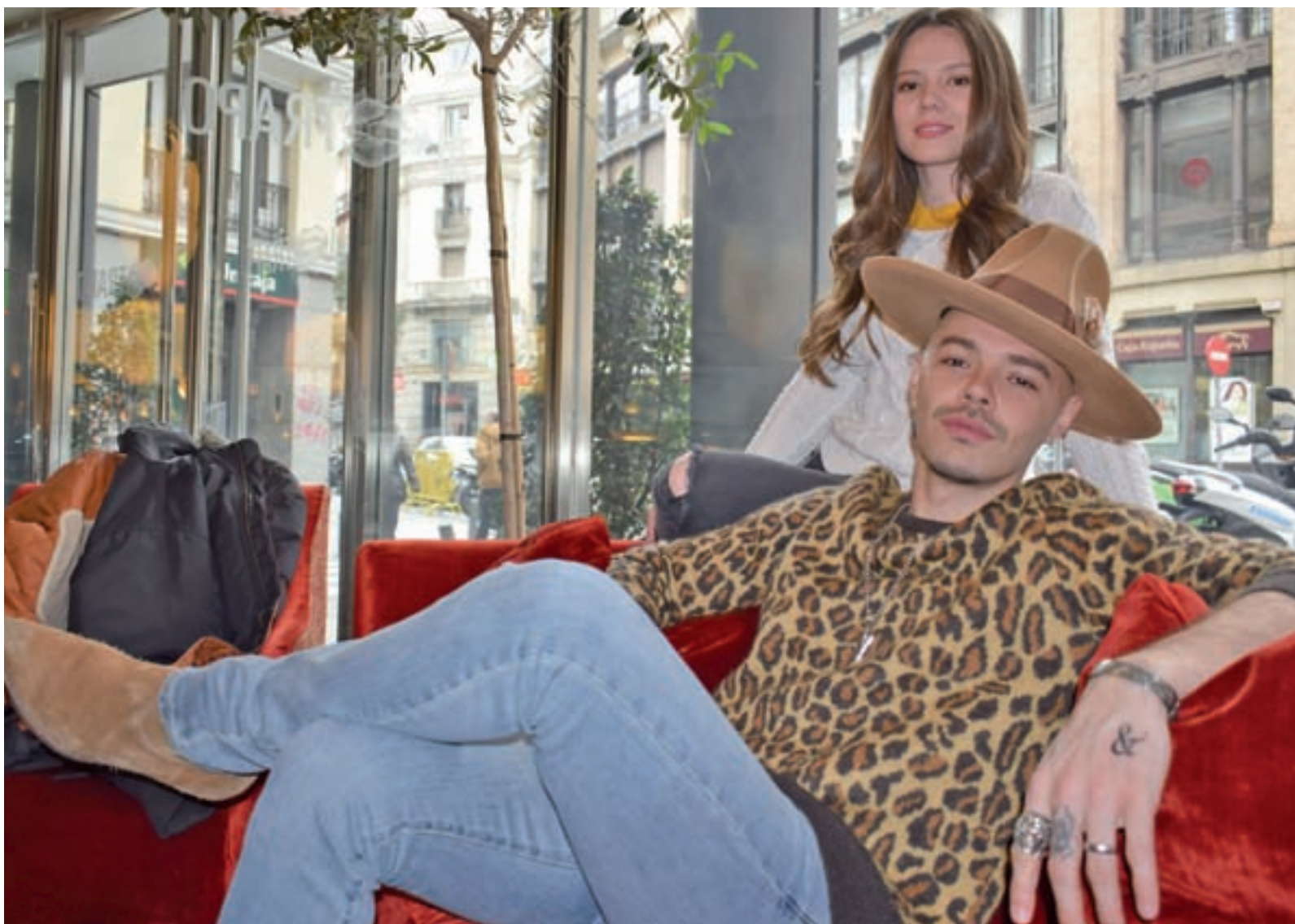
El dúo mexicano, en el Hotel Iberostar Las Letras de Madrid durante la entrevista con GENTE