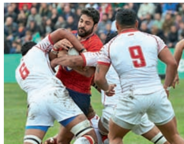
Imagen del partido frente a Tonga

Tras esa gran experiencia, no es de extrañar que la expectación se haya disparado en vistas al partido del 11 de febrero (16 horas) ante Rusia. Todo hace prever que las gradas del Estadio de la Universidad Complutense de Madrid presentarán un gran aspecto, ya que se ha agotado la primera remesa de entradas. Hasta el 3 de febrero se pondrán a la venta el segundo cupo en Marcaentradas.com.