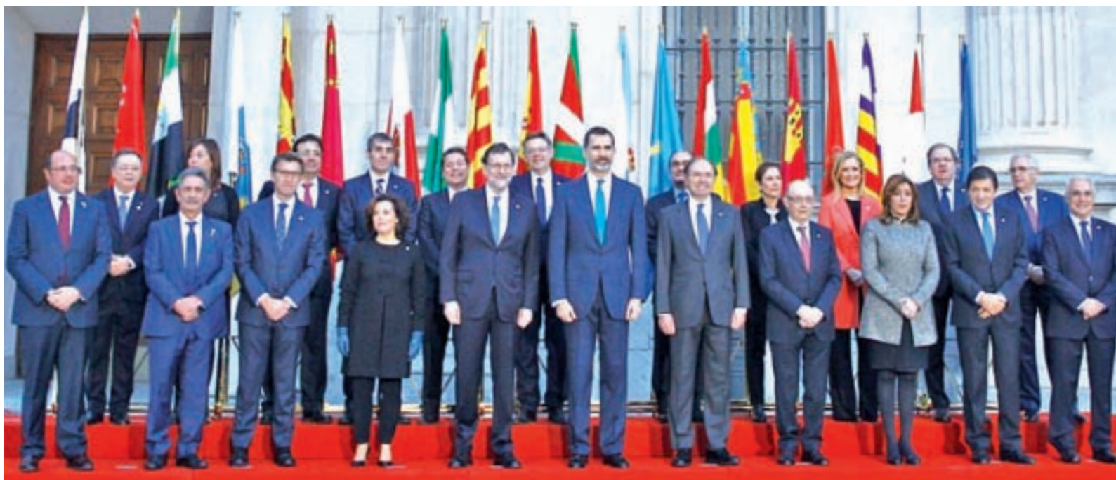
Foto de familia antes de la celebración de la Conferencia de Presidentes