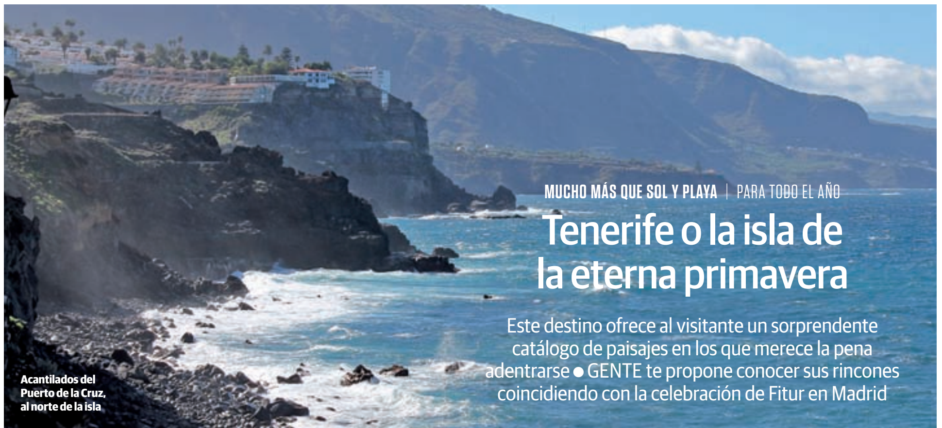
Acantilados del Puerto de la Cruz, al norte de la isla

MUCHO MÁS QUE SOL Y PLAYA | PARA TODO EL AÑO