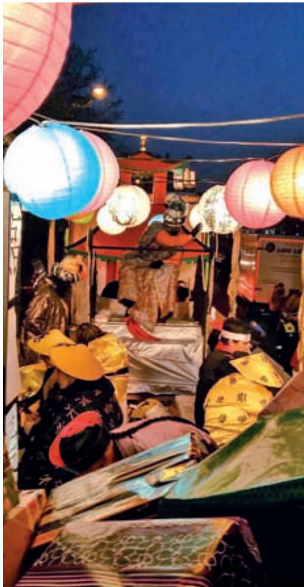
Administración y vecinos colaboran ya en las cabalgatas

“Estamos cerrando diferentes detalles de la ordenanza de cooperación público-social que estamos empezando a redactar. Se trata de nivelar la relación con las entidades sin ánimo de lucro, que tengan la posibilidad de intervenir en su distrito y de-