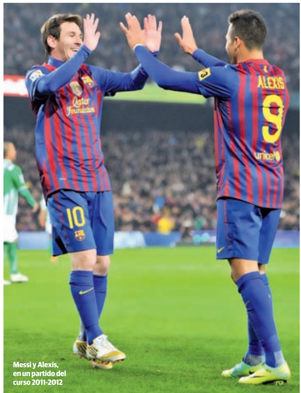
Messi y Alexis, en un partido del curso 2011-2012

Sea por una cuestión de mayor celo por parte del fisco u otras cuestiones, lo cierto es que llama la atención la gran cantidad de casos de futbolistas y deportistas que no están al día con Hacienda. El actual presidente del Barcelona, Josep María Bartomeu, se pronunció recientemente so-