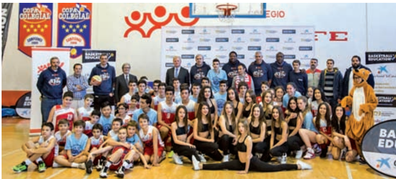
Varias leyendas de la ACB con alumnos del Colegio JOYFE

BALONCESTO | PROYECTO 'BASKETBALL IS EDUCATION'