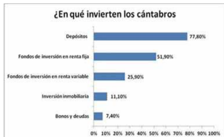
Gráfico que lo muestra (EFPA).

De los préstamos de la Iniciativa PYME, de los fondos FEDER han sido a empresas de Cantabria