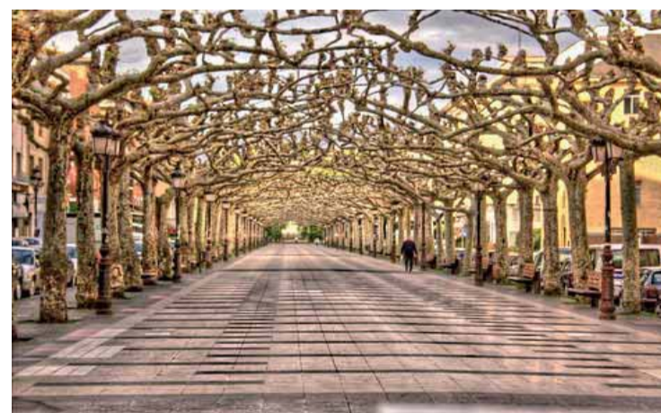
Paseo de la ciudad de Torrelavega.

son: 100.000 euros para el proyecto de aceras en Nueva Ciudad; 150.000 euros para el Plan de Asfaltado 2016/2017; 100.000 euros para la peatonalización de la calle Consolación; 85.000 euros para adquirir locales en la Plaza Chanete en La Inmobiliaria; 80.000 euros para un parque y jardines en Lasaga Larreta; 50.000 euros para la mejora de calle Raimundo Cicero Artech; 30.000 euros para las calles Pando, Augusto G. Linares y Fernández Vallejo; o 20.000 euros para ampliar la Escuela Anjana.