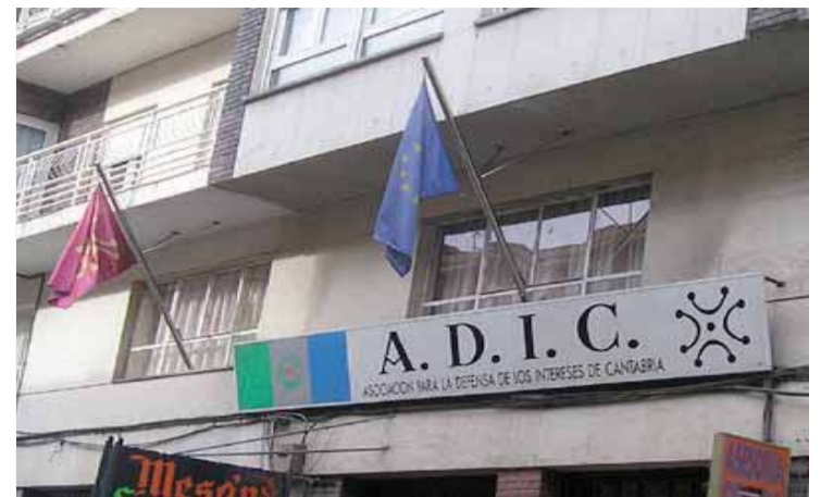
Sede de ADIC, en la calle Santa Lucía de Santander.

como de la certificación de los mismos para que se puedan beneficiar de los incentivos fiscales que ha dispuesto el Gobierno estatal al considerarla acontecimiento de excepcional interés público. La consideración de 'Cantabria 2017, Liébana Año Jubilar' quedó recogida en la Ley de Presupuestos Generales del Estado de 2015.