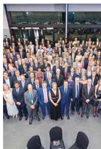
Reunión de la Sociedad Nuclear.

Con el objetivo de hacer de su Reunión Anual un punto de encuentro más sostenible, la Junta Directiva de la Sociedad Nuclear Española ha decidido poner en marcha, este año, la propuesta presentada por las empresas Medidas Ambientales y Grupo Eulen, participantes y expositores de la reunión, para realizar el Cálculo, Verificación y Compensación en la Huella CO2. Más de 600 congresistas participarán en