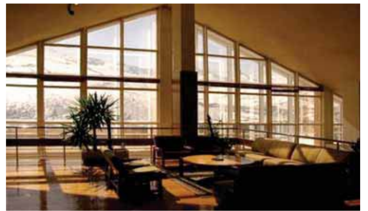
Imagen del Hotel La Corza Blanca en Alto Campoo.

Ahora espera que "vaya llegando obra", entre ella la pública, que actualmente está "bajo mínimos". En ese sentido, reconoció que el hecho de que España siga sin un Gobierno "influye", por lo que espera que se conforme uno y que se diseñen unos Presupuestos.