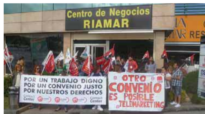
Los sindicatos prevén un "largo conflicto laboral". Una veintena de delegados sindicales del sector de Contact Center (antiguo telemarketing) en Cantabria exigieron ante la sede de Unitono en Maliaño, que se desbloquee la negociación.

En el conjunto del sector del turismo y la hostelería las tarifas han repuntado un 4,3% en Cantabria y un 3,6% en el año en España, tras un leve incremento del 0,7% en agosto, según los datos disgregados.