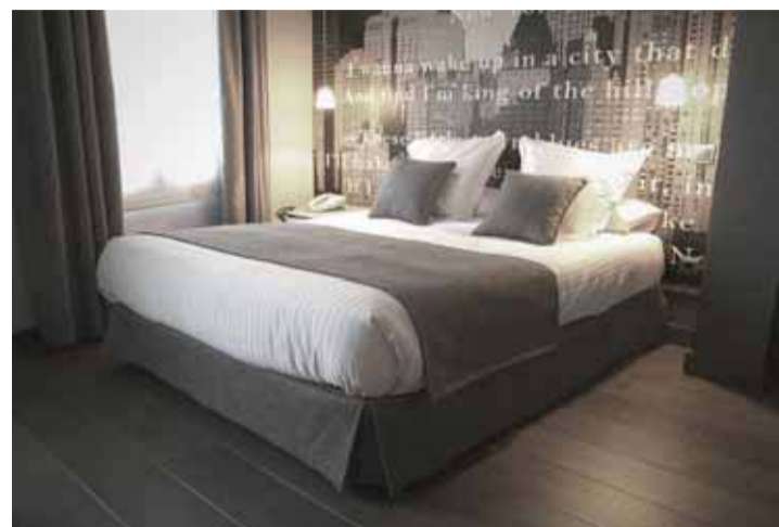
Las tarifas han repuntado un 4,3% en Cantabria.

La encuesta señala que más de la mitad de los clientes cántabros (52%) se muestra más conservador a la hora de gestionar sus finanzas personales, mientras que tan solo un 7,4% es más agresivo con su cartera de inversión. El 11,1% apuesta por inversión inmobiliaria. Lo que más priman los cántabros a la hora de elegir un producto financiero es el riesgo, que se sitúa por delante de la rentabilidad y la comprensión del propio producto, mientras que las cuestiones fiscales son las que menos peso tienen a la hora de tomar una decisión de inversión. El 63% de los clientes cántabros confiesa que puede ahorrar al menos una décima parte de sus ingresos a final de mes, cifra por encima de la media nacional.