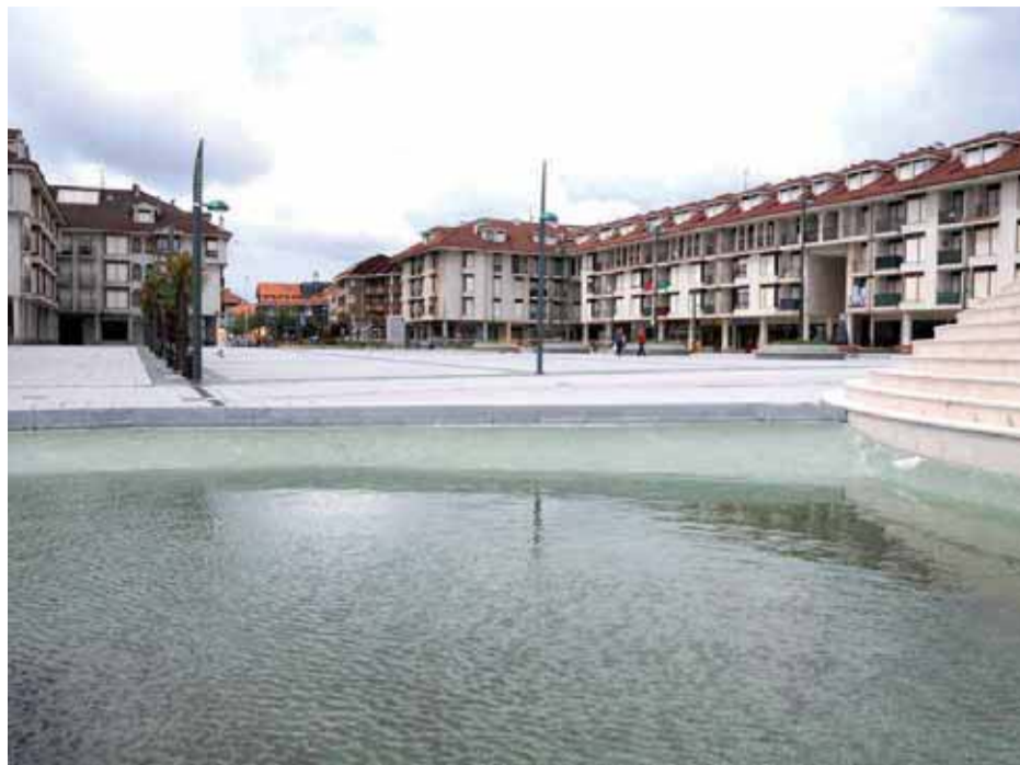
Centro de Noja.