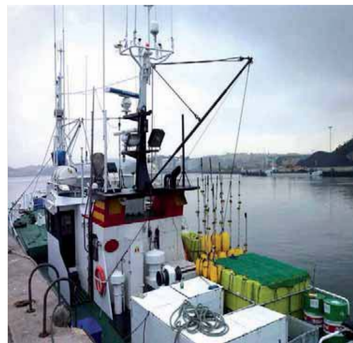
Barco pesquero en aguas del Cantábrico.