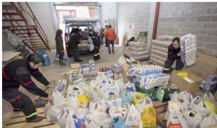
Plataforma de Alimentos de Camargo.

Para ello la Consejería de Universidades, Investigación, Medio Ambiente y Política Social ha remitido a la FMC una propuesta de ordenanza reguladora de las prestaciones económicas de emergencia social, con la finalidad de difundir y analizar el contenido entre todos