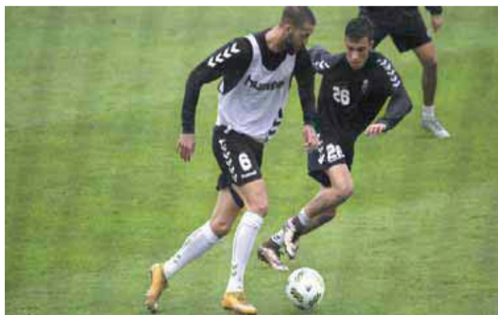
El Racing ha comenzado la liga de una forma espléndida.

El Racing continúa preparando la visita que el Burgos CF realizará a Los Campos de Sport (domingo 18- 18:00 horas) y ha realizado unos intensos entrenamientos, y alguno bajo la lluvia, en las Instalaciones Nando Yosú. Los veridiblanco, que suman 10 puntos tras las cuatro primeras jornadas del campeonato 2016/17, se emplearon a fondo en las diversas se-