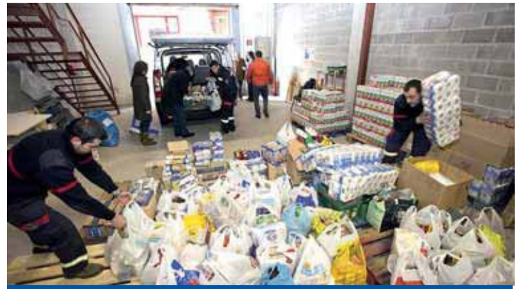
Ayudas en emergencia social a los ayuntamientos Pág. 4