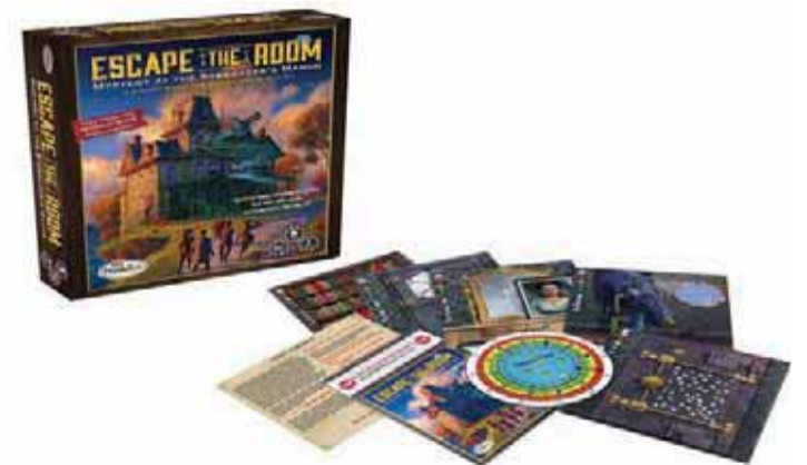
Imagen juego 'Escape room' que tendrá lugar este sábado.

na. La actividad es gratuita pero es necesario apuntarse antes del 16 de septiembre en escapadelpalacio@mercurio.com.es . Los pases son limitados y no se atenderán solicitudes una vez cubiertas las plazas. Su uso por empresas de coaching como herramienta para el trabajo en equipo, la proliferación de experiencias lúdicas para grupos o la adrenalina de tener que resolver enigmas a contrarreloj, como si de una película de suspense se tratase, son algunos de los factores que han hecho que se hayan extendido rápidamente en todo el mundo.