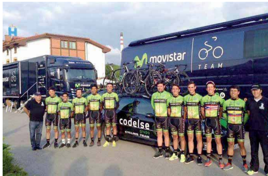
Equipo del Codelse Team antes de la prueba.