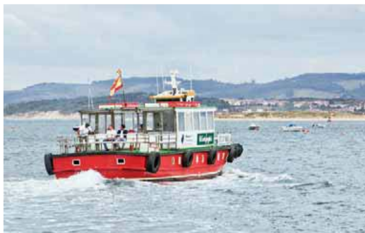
Embarcación de Las Reginas desde Santander.