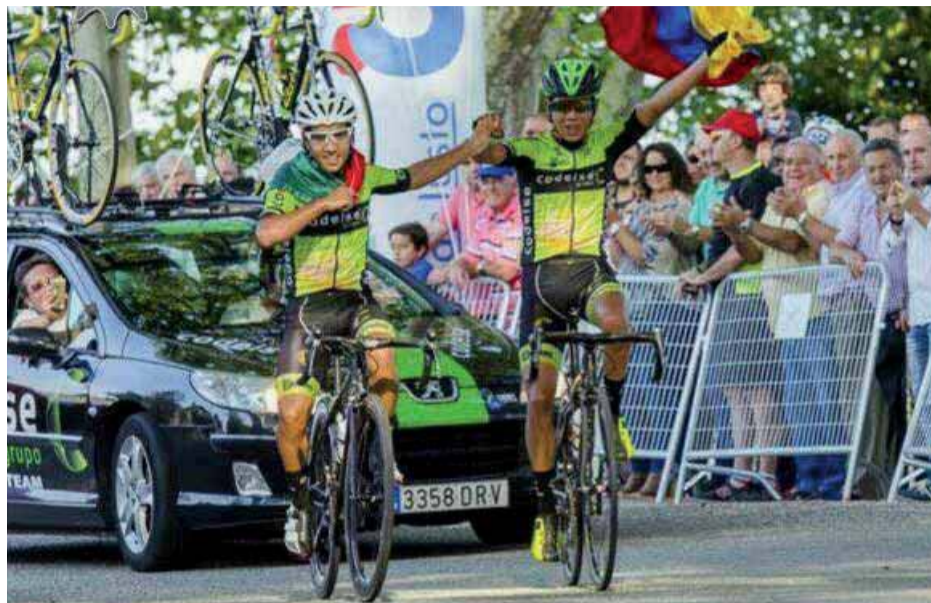
Llegada a meta de Udiarraga de dos ciclistas del equipo del Codelse.