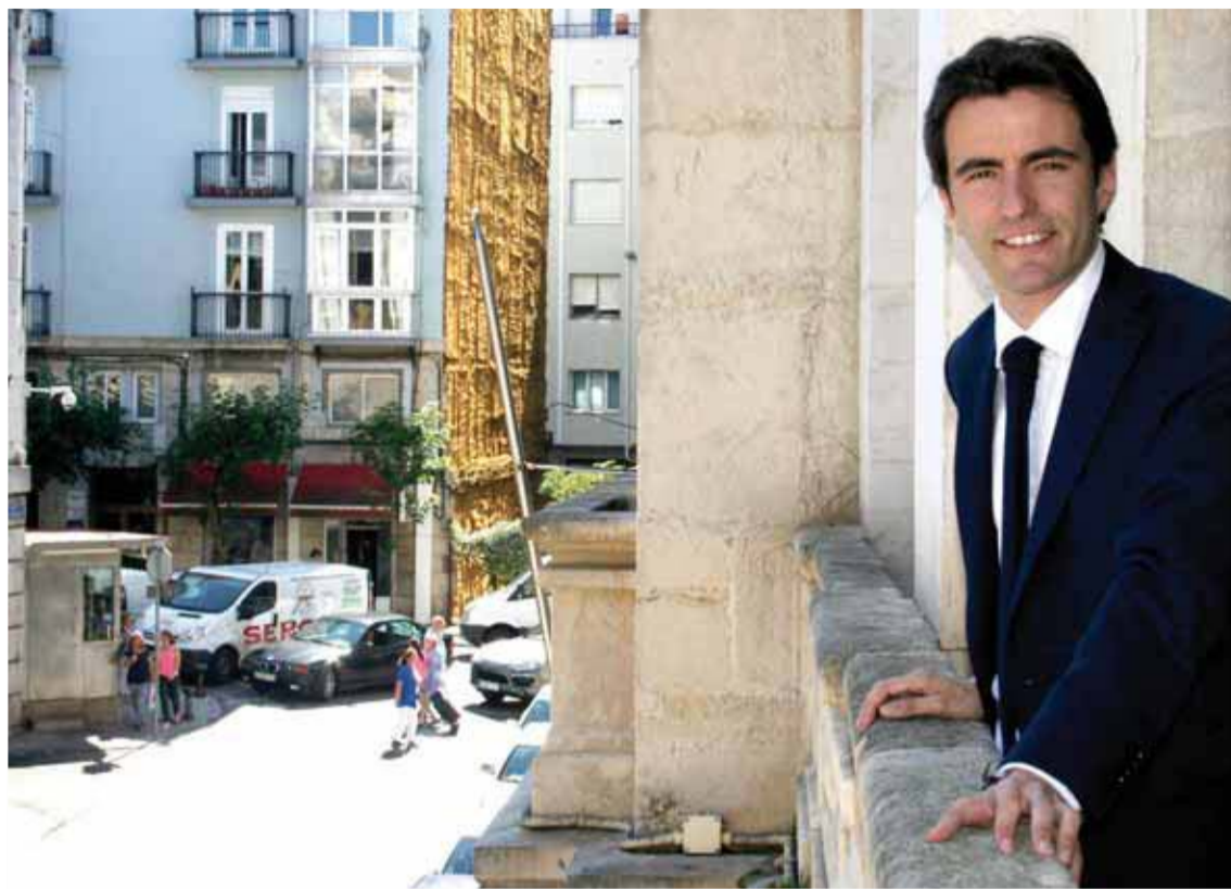
Pedro Casares es el portavoz del PSOE en el Ayuntamiento de Santander.

La empresa Aqualia, concesionaria del servicio de aguas en Santander, va a realizar obras en la red de abastecimiento del entorno de Pronillo, donde confluyen los "puntos neurálgicos", para "reconfigurar las conexiones, optimizar el funcionamiento de la conducción, mejorar tiempos de respuesta y calidad.