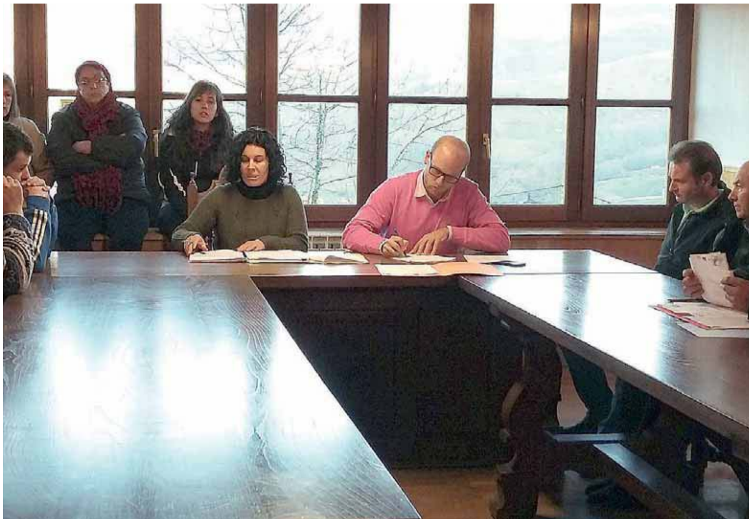
Pleno enero: a la izquierda, concejales del PP; en el centro, la alcaldesa con el secretario que estuvo hasta marzo; derecha, el PRC.