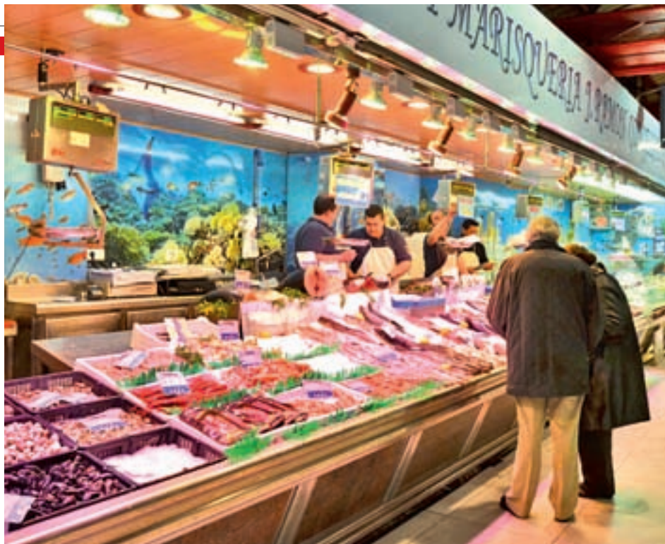
Galería de alimentación en Madrid

La conclusión del estudio es que son bastantes más los alimentos que se encarecen que los que pierden valor. Entre los que suben destaca la lubina, que se incrementa un 13,5%, seguida por las almejas, que llegan casi al 10%. Detrás están la piña (+9,2%),