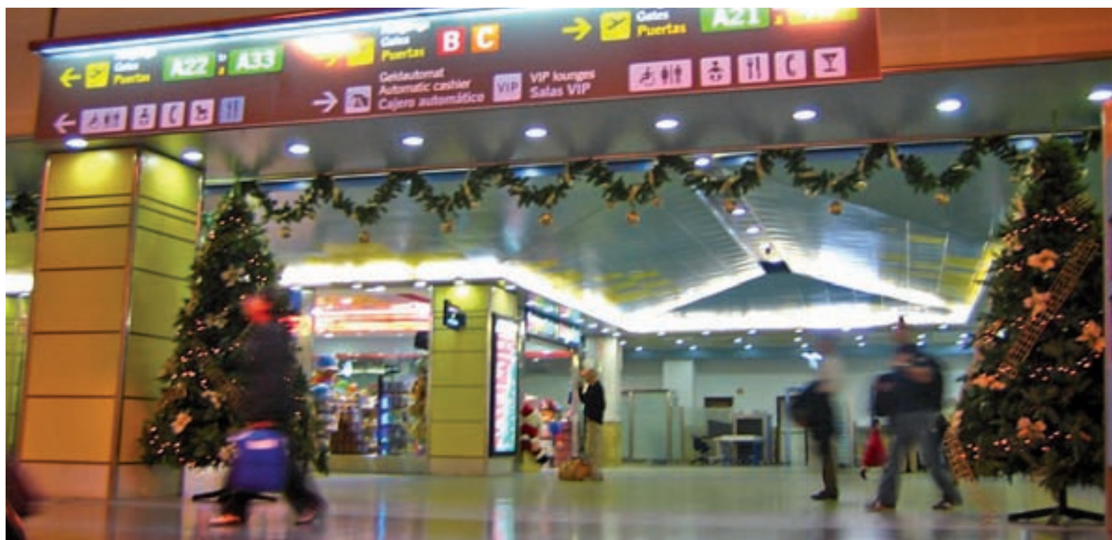
Muchos españoles deciden viajar durante las fiestas