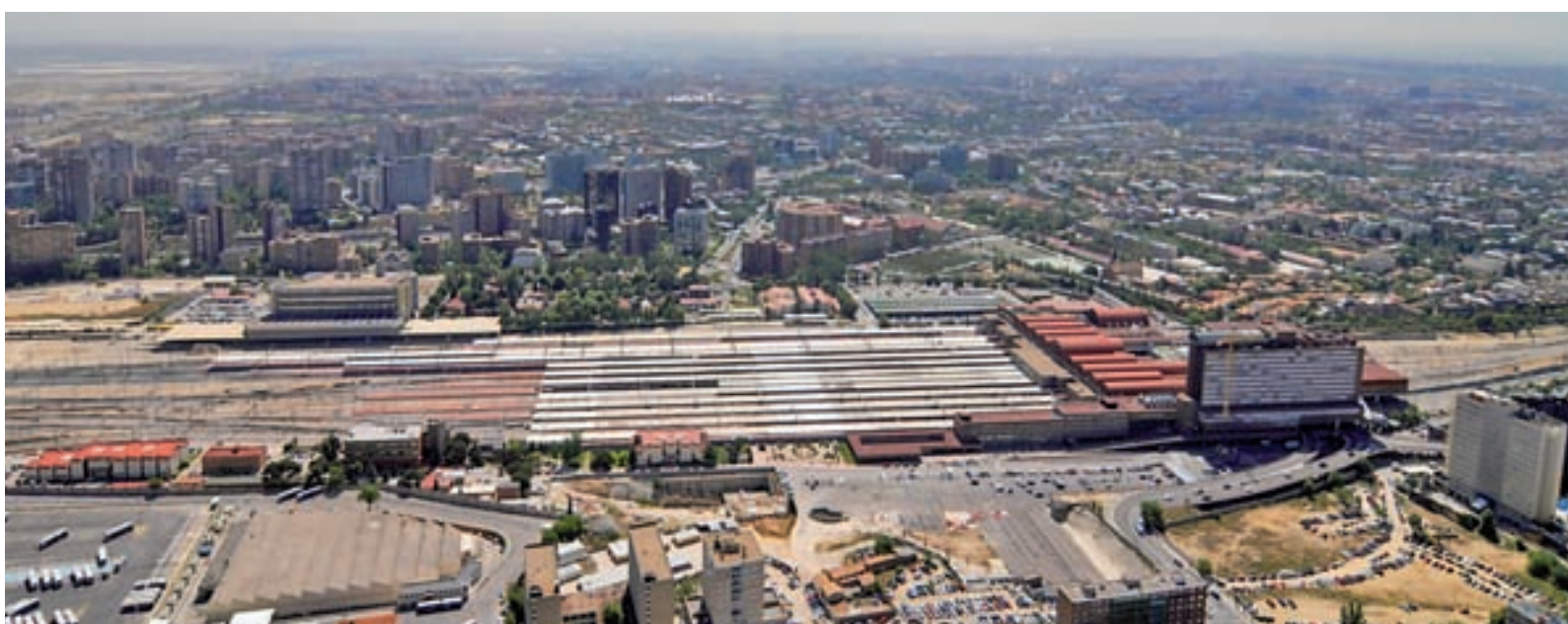
El entorno de las instalaciones ferroviarias de Chamartín

La Plataforma por la Educación Pública en Las Tablas asegura que la construcción del instituto es fruto del esfuerzo de todos y no mérito de Ciudadanos, como dice este partido.