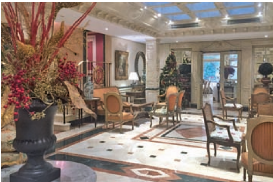
La entrada del Hotel Orfila GENTE