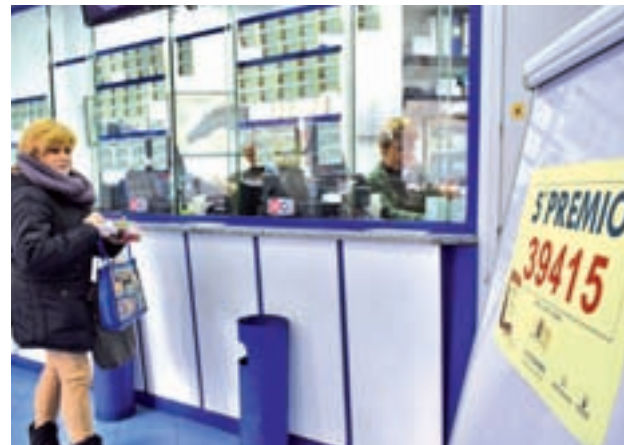
La administración afortunada con el premio

tar un regocijo que comparte con sus compañeros de establecimiento, al haber dispensado en ventanilla y en el citado bar 500 décimos del número que ha dejado tres millones de euros en el corazón del barrio de Chamberí.