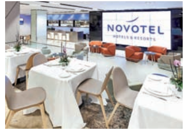
El hotel decorará su salón GENTE

El hotel ofrece una noche única en el que los juegos y la diversión amenizarán un menú exclusivo en el que se puede destacar los entrantes: sus crujientes falsos erizos y su tartar de salchichón sorprenderán al comensal con sus intensos sabores. Esta elaborada propuesta del chef Alejandro Fernández finalizará con un fantástico postre como antesala a las tradicionales uvas. Una noche perfecta para bailar, divertirse y vivir toda una aventura en el centro de la capital.