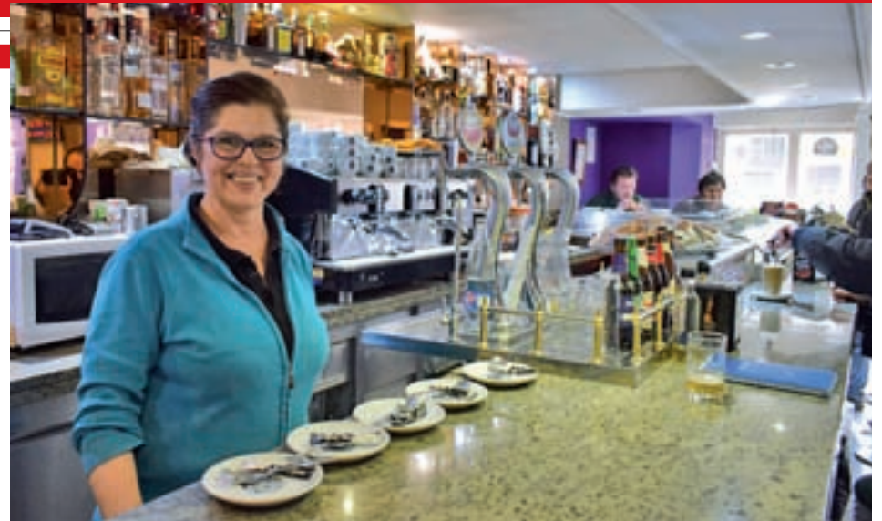
La propietaria del negocio que ha traído la suerte a sus clientes