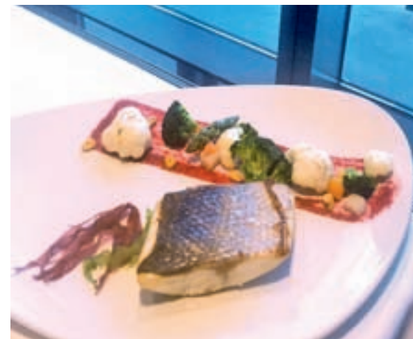
Lubina salvaje con colores de verduras GENTE

E n Nochevieja, aunque sea una noche especial y la última del año, tampoco es posible tocar las estrellas, pero sí estar más cerca de ellas si se apuesta por despedir al 2016 en el restaurante Volvoretta del hotel Eurostars Madrid Tower, situado en una de las torres del paseo de la Castellana. Vanguardia y tradición se unen en un menú del que nos han enamorado el bao de rape y salsa ahumada, que es uno de los entrantes; el canelón tibio de cigala con vinagreta de mostaza y brotes tiernos; y el solomillo, que va acompañado de unos originales macarrons de fresa rellenos de foie. Antes de las uvas, un capricho en forma de volcán de chocolate con cremoso de mango y helado de maracuyá. Las mejores vistas de Madrid hacen de este lugar el plan perfecto para decir adiós al año 2016.