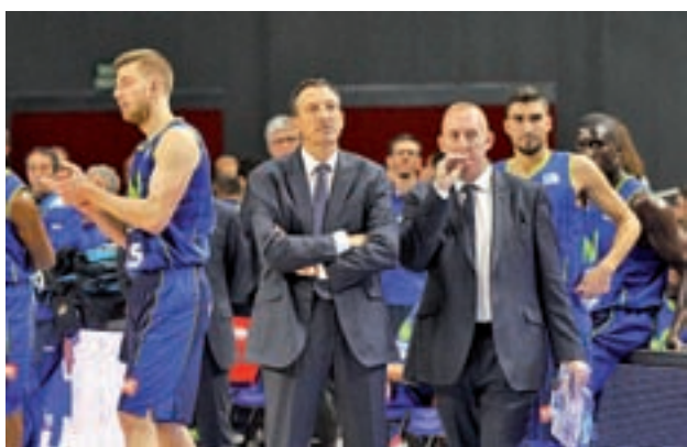
El Estudiantes, ante un calendario duro

Al cierre de esta edición se desconocía si la medida también se extrapolaba a la situación del Atlético de Madrid. A la espera de ello, otro club español, el FC Barcelona estudia la razón por la que el TAS ha fallado en favor del Real Madrid, en contraposición a la sentencia que impidió al club azulgrana realizar fichajes.