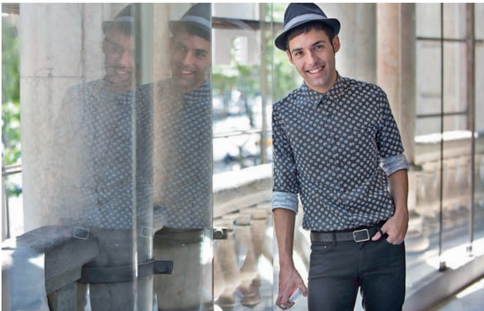
El Mago Pop triunfa en la televisión y encima de los escenarios de los teatros de todo el país