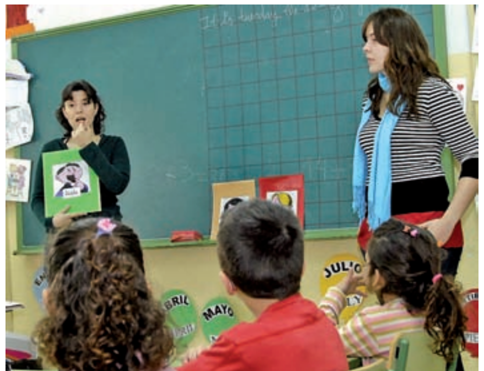
Alumnos de Primaria en un colegio público bilingüe GENTE

EL INFORME PISA TAMBIÉN OTORGA UN MAYOR RENDIMIENTO A ESTE MODELO