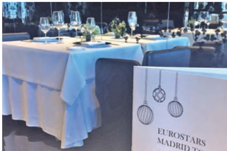
El restaurante está situado en la planta 30 del hotel GENTE