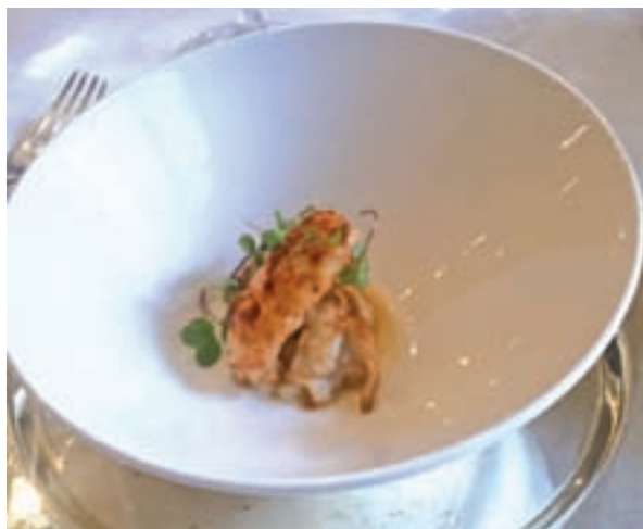
Tronco de cigala al Jerez GENTE

Tronco de cigala al Jerez, crema de marisco con bogavante, ensalada de vieira con gelée de tomate y algas, rodaballo salvaje con vinagreta de chili, tomate y aguacate y cúpula de chocolate con helado de turrón forman un menú en el que destaca, sin duda, la suprema de pichón con puré y setas.