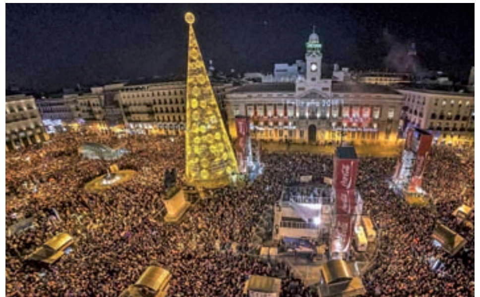
La Policía controlará el acceso a la Puerta del Sol en las preuvas y las uvas