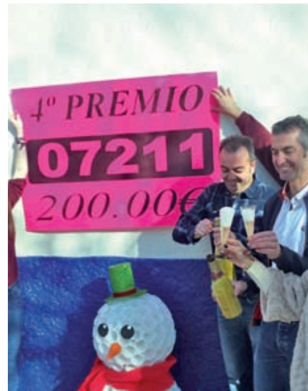
El champán no faltó en las celebraciones

Sin embargo, en los aledaños de la administración no se han vivido las típicas escenas de alegría colectiva y, los vecinos que se han pasado por allí, se mostraban reacios a confirmar si estaban entre los agraciados. "Pocos dicen que le ha tocado, muchos tie-