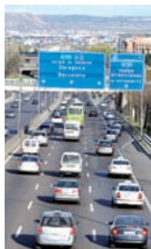
Tráfico en Madrid

La segunda será la de fin de año, del viernes 30 al domingo 2 de enero de 2017, al ser festivo en Andalucía, Aragón, Asturias, Castilla y León y Murcia; y la tercera, la de Reyes, del viernes 5 al domingo 8.