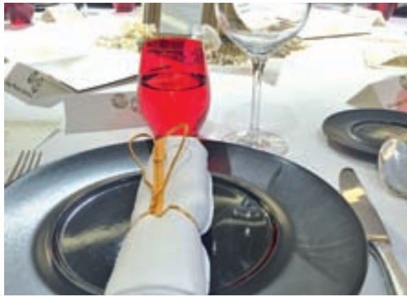
En Hesperia priman los detalles GENTE

Este hotel plantea el inicio de año aderezado con tartar de ventresca de atún rojo de almadraba con yema de huevo y caviar iraní; cigala asada con su consomé; lubina salvaje con guiso de plancton, cardo y moluscos; y cordero lechal con glaseado de calabaza y jugo de hierbas aromáticas. Del menú destaca el postre: Evolución de la uva, que ofrece la fruta estrella de Nochevieja en diferentes texturas y originales interpretaciones.