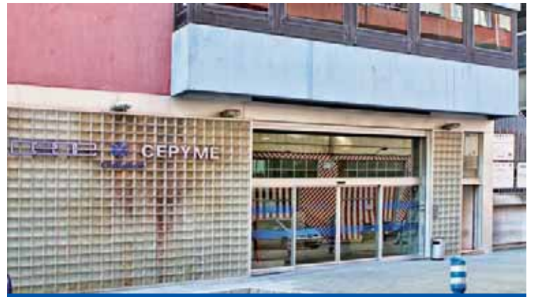
La CEOE, al borde de la quiebra.