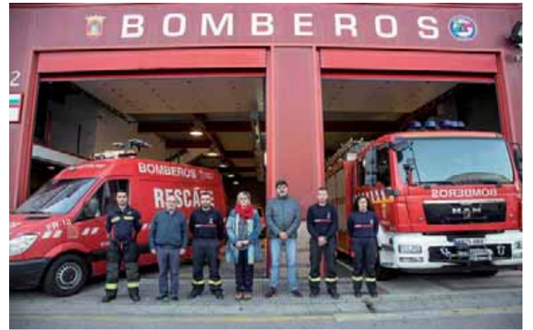
Puesta en marcha del servicio de Bomberos de Camargo.

do el resto del horario cubierto por el 112, y cuenta con 7 vehículos entre los que se incluyen dos bombas forestales pesadas, una bomba urbana pesada, además de dos remolques de achique y uno de carga. Bolado señaló que se trata de un día "importante".