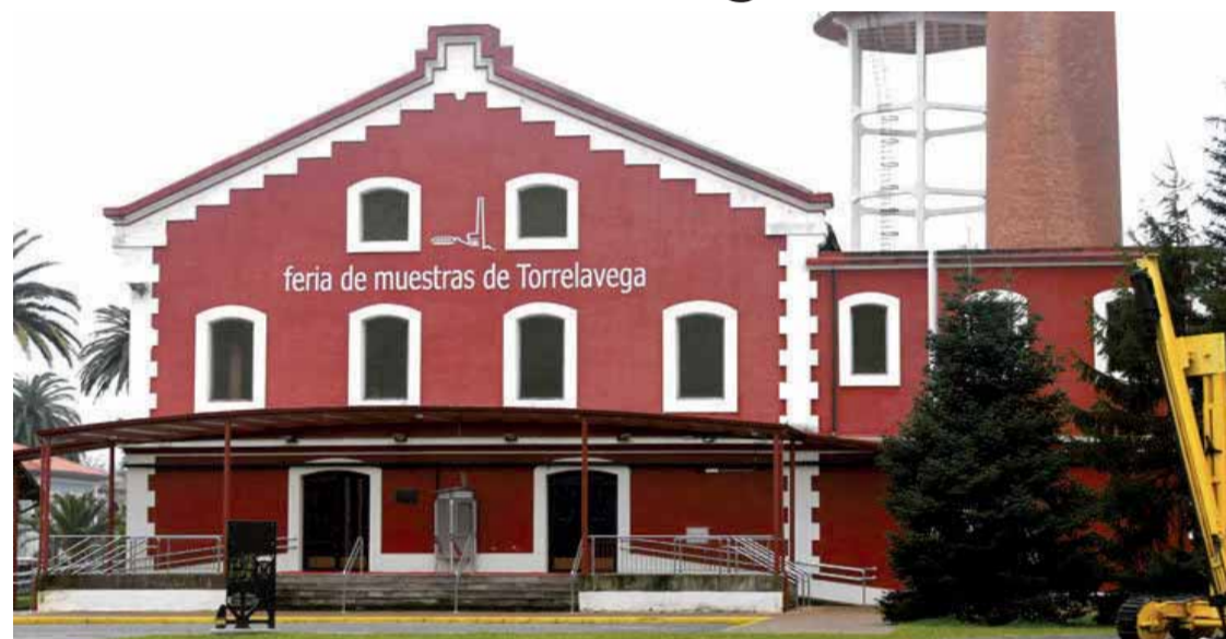
Imagen actual de la Feria de Muestras de La Lechera.