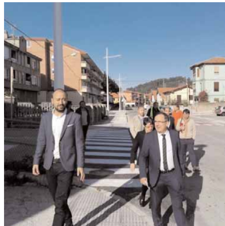
Momento de visitar las nuevas luminarias en Torres.