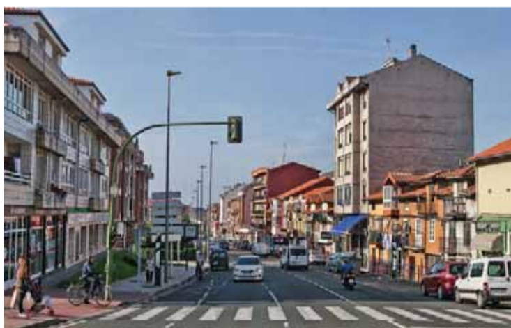
Barrio de La Albericia de Santander.