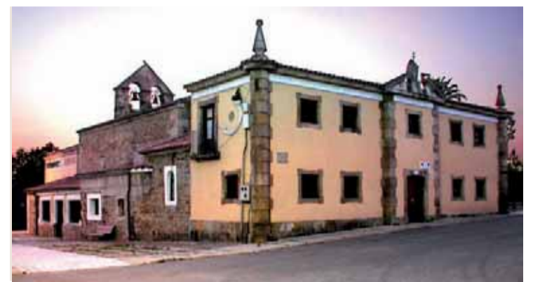
Albergue de peregrinos e Iglesia de Muslera (El Astillero).

Ris y Trengandín lucirán en 2017 la Bandera EcoPlayas que concede la Asociación Técnica para la Gestión de Residuos, Aseo Urbano y Medio Ambiente como reconocimiento a la gran calidad, la excelencia en el mantenimiento y la gestión ambiental y sostenible realizada en estos arenales.