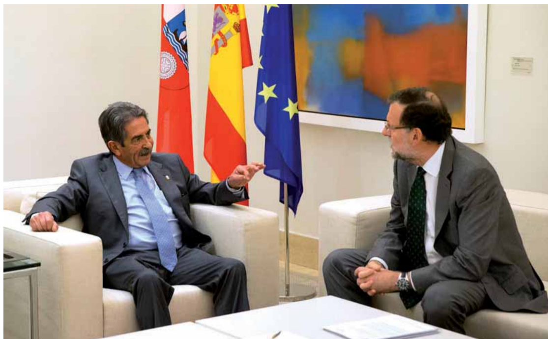
Miguel Ángel Revilla y Mariano Rajoy, en Moncloa en noviembre de 2015.

Moncloa, el presidente cántabro subraya que las prioridades de Cantabria "siguen siendo las mismas, después de años de incumplimientos reiterados" por parte del Estado y repasa uno por uno los