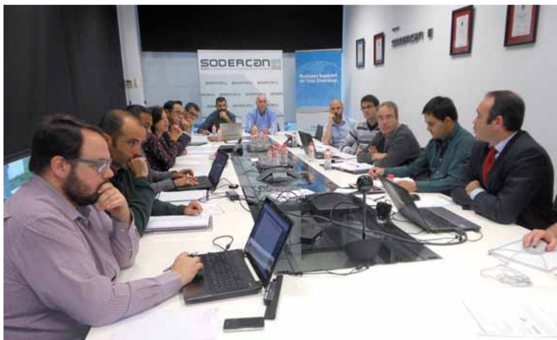
Jornada de trabajo en Sodercan del 26 de octubre.

Esta acción formativa está en la línea de actividad de Sodercan