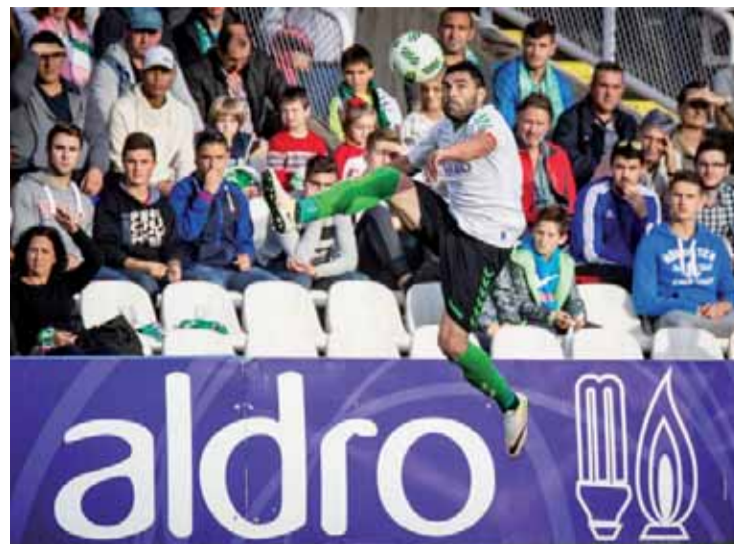
El Racing buscará el apoyo del público para ganar.