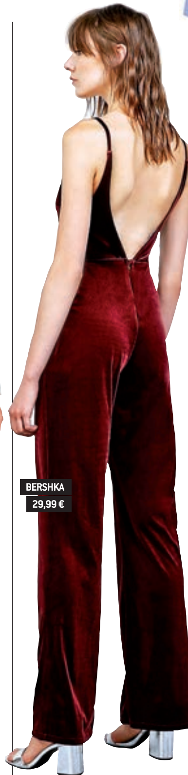
BERSHKA 29,99 €

Como si fuera el uniforme del colegio, se llevan los vestidos tipo pichi y los petos. Busca prendas más 'sport' para el día y opciones de vestir para la noche.