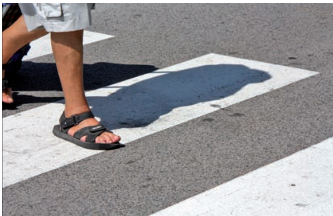
El 22 de setembre, la ciutat de Barcelona s'obrirà als vianants.

En aquest sentit, l'equip de govern municipal recorda que Barcelona supera en algunes oca-