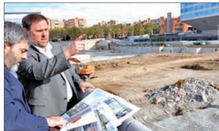
El vicepresident i conseller d'Economia, Oriol Junqueras.

Envoltats pels plànols i els dibuixos de les simulacions del futur edifici, tots dos s'han mostrat satisfets pel projecte i per poder