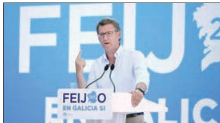
Alberto Núñez Feijóo, en un acto de campaña

El vencedor en el caso del País Vasco sería Íñigo Urkullu, ya que el PNV ganaría al lograr 27 ó 28 escaños, de forma que obtendría el mismo resultado o un escaño más que en los anteriores comicios. EH Bildu conseguiría 16 parlamentarios, cinco menos que en 2012, y sería la segunda fuerza en porcentaje de voto. Elkarrekin Podemos, que entraría en el Parla-