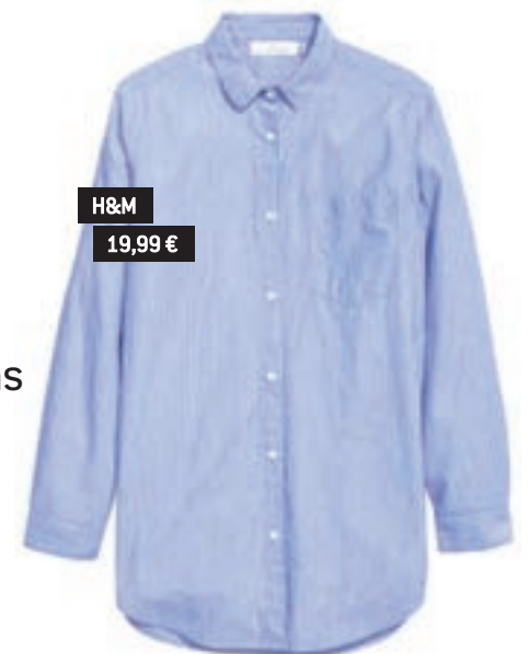
H&M 19,99 €

Es una de las tendencias estrella para este otoño/invierno. Verás esta tela en camisetas, vestidos, monos, bolsos, americanas e incluso en calzado.