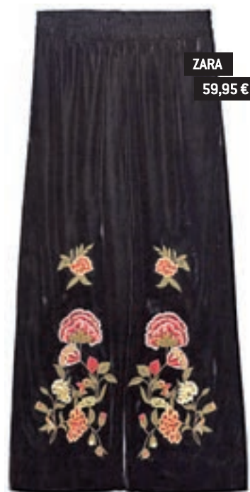
ZARA 59,95 €

Con encaje, cuello marcado y algún lazo, da un toque femenino y romántico al 'look'.