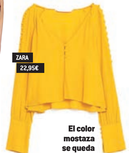
ZARA 22,95 €

Puedes cogérsela prestada a tu chico o a tu padre, pero también la encontrarás en la sección femenina.