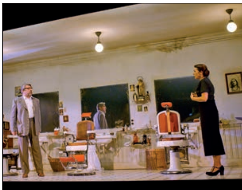
Una escena de 'Victòria', la passada temporada, a la Sala Gran del TNC.