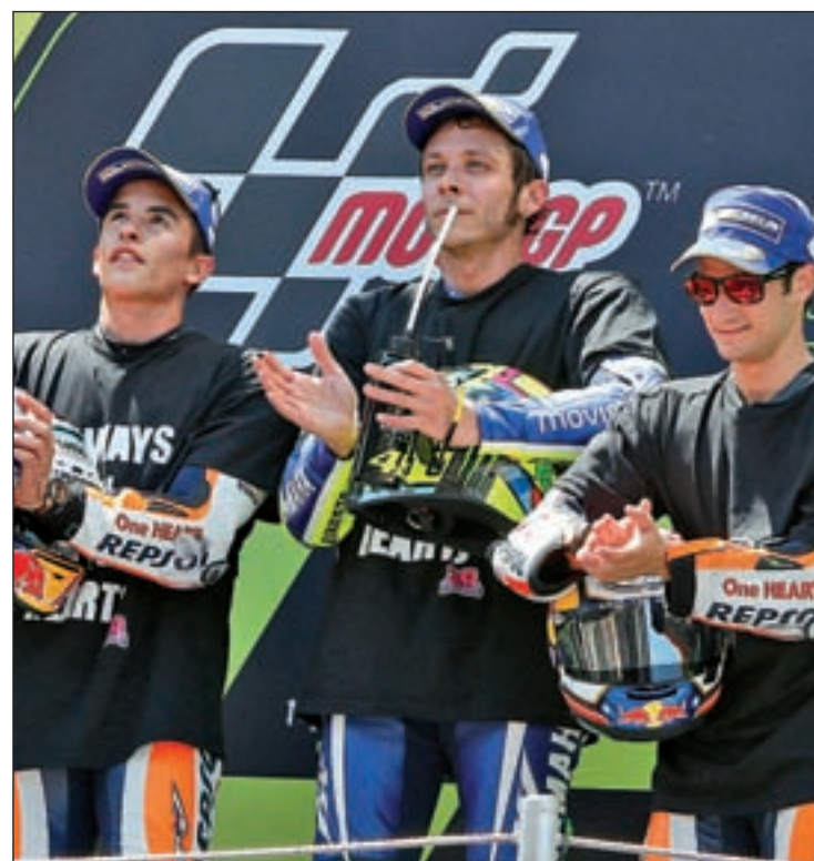
Márquez, Rossi y Pedrosa rindieron homenaje al fallecido Salom

Entrando en el plano estrictamente deportivo, Márquez aventaja en diez puntos a Lorenzo, aunque tampoco conviene perder de vista al italiano Valentino Rossi, tercero en la general, con 103 puntos, 22 menos que el líder. Teniendo en cuenta que los tres candidatos han obtenido el mis-