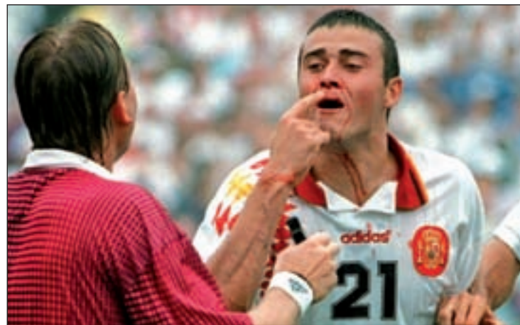
Luis Enrique señala su herida a Sandor Puhl

Los cuartos de final del Mundial de 1994 volvieron a emparejar a estos enemigos íntimos. En Boston, Dino Baggio y Caminero pusieron el 1-1. En la segunda parte, Julio Salinas se quedó solo delante de Pagliuca y falló el re-