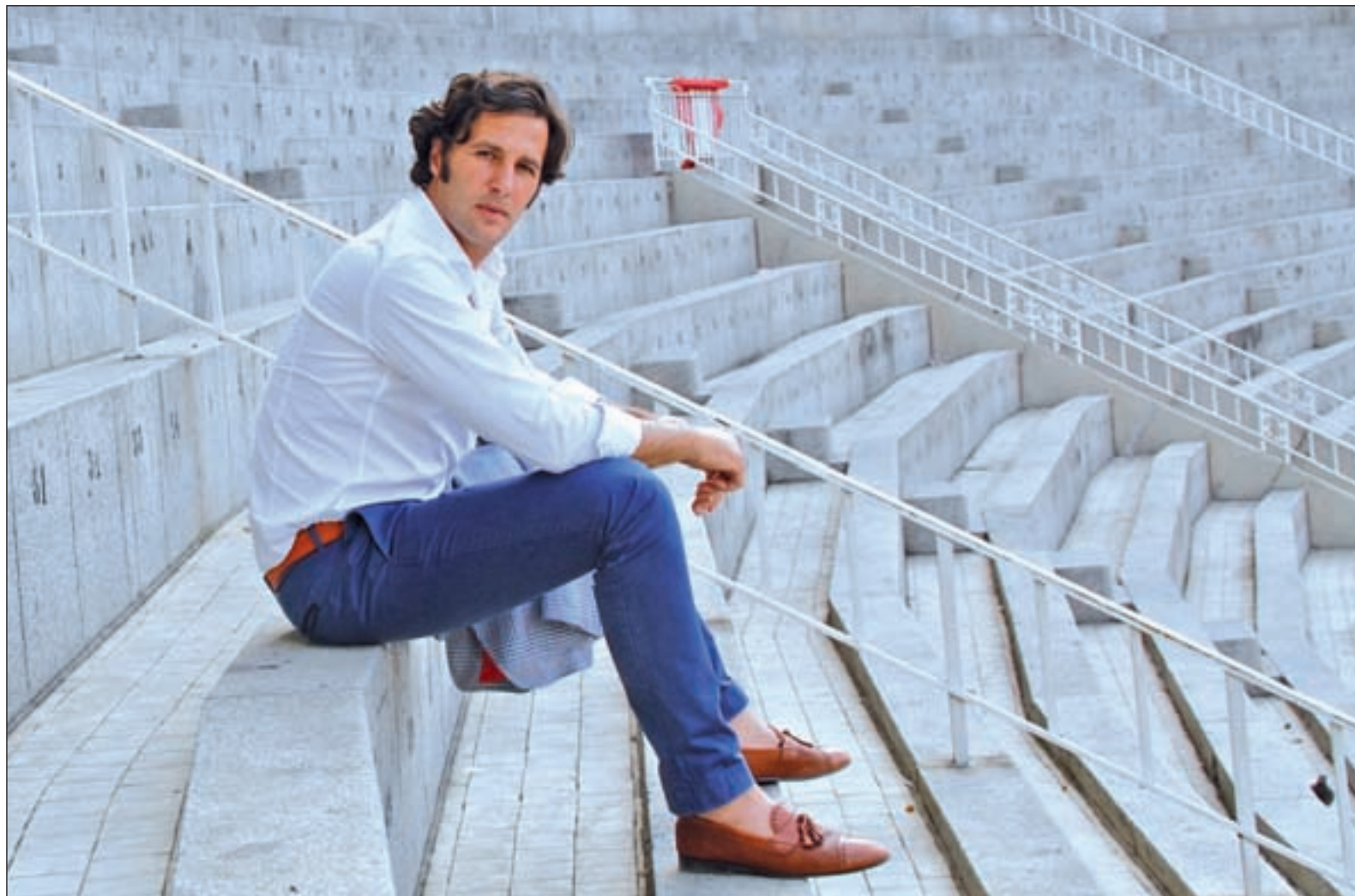
El torero atendió a GENTE en la Monumental de Las Ventas después de su triunfal reaparición