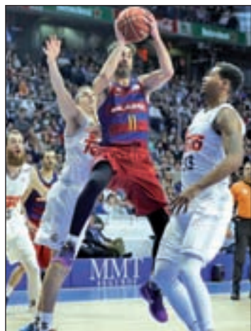
Juan Carlos Navarro