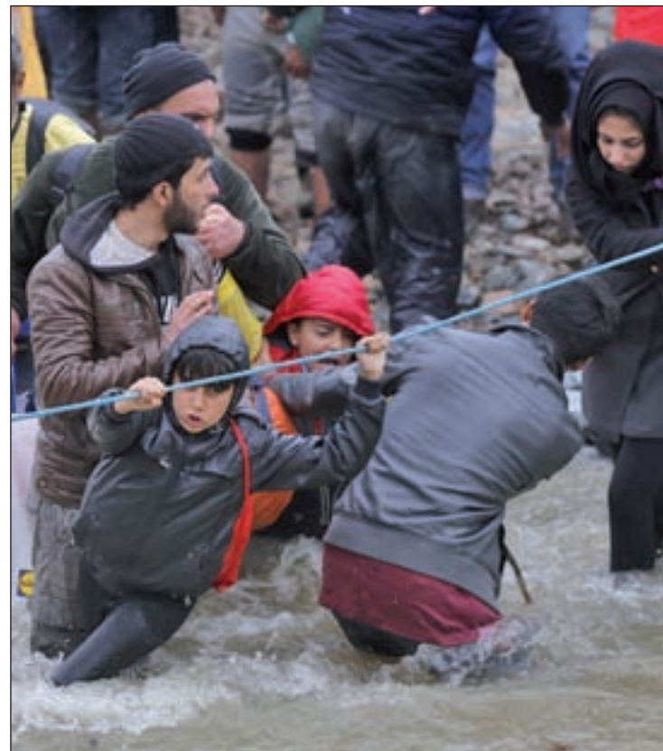
España recibirá dos contingentes más

“Al pisar suelo español, a todas ellas se les ha dado el correspondiente documento de autorización de entrada en territorio español y posteriormente han sido trasladadas a las localidades en las que serán acogidas”, explicó la nota oficial. Pero estos no serán los últimos demandantes de asilo que aterricen en nuestro país. Entre los días 30 de mayo y 1 de junio aterrizarán en España otros 84 refugiados. En concreto, el 30 de mayo se espera lleguen a España 45 personas, de las que 22 son hombres, 8 son mujeres y 15 son menores de edad. Veinticinco de