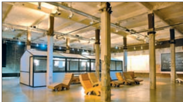
FESTIVAL POETAS es un evento interdisciplinar, una reunión de artistas para el gran público, que se celebrará en el Matadero de Madrid los días 28 y 29 de mayo como complemento a la 75 edición de la Feria del Libro.

Las 367 casetas abren al público este viernes en Madrid con una buena previsión de visitantes