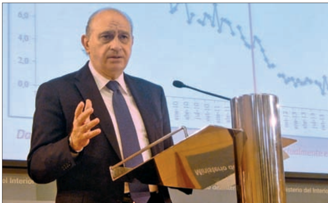
El ministro del Interior, Jorge Fernández Díaz

Asturias y Cantabria encabezan la lista en el aumento de los robos con violencia con un 78 y 65 por ciento de subida respectivamente. Este tipo de delitos ha subido en la mayoría de las comunidades autónomas, lo que ha puesto en alerta a la Unión de Cerrajeros Es-