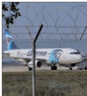
Un avión de EgyptAir

un llamamiento a no especular sobre lo sucedido, según informó la agencia de noticias MENA. En un comunicado, Hamid declaró que “todo lo que se ha publicado es completamente falso” y que se trata de “conclusiones” a las que no han llegado los investigadores forenses. Por ello, reclamó a los