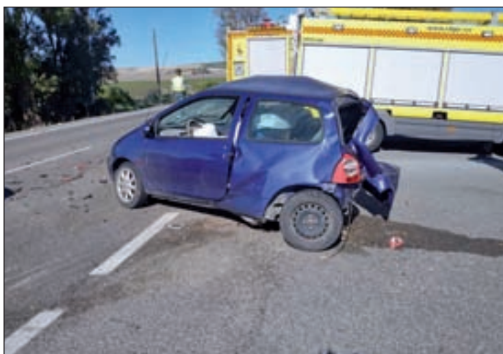
Imagen de un accidente de tráfico

ENTRE 2012 Y 2014 LA SINIESTRALIDAD CRECIÓ UN 7,3%