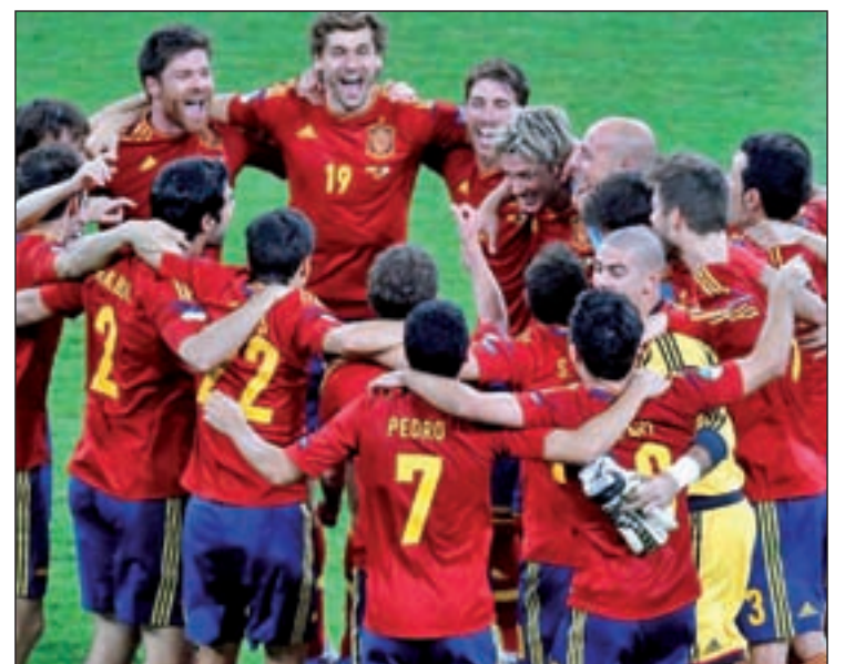
España busca la tercera corona consecutiva

La fase de preparación tocará a su fin el día 7 con un partido ante Georgia en Getafe (Madrid).