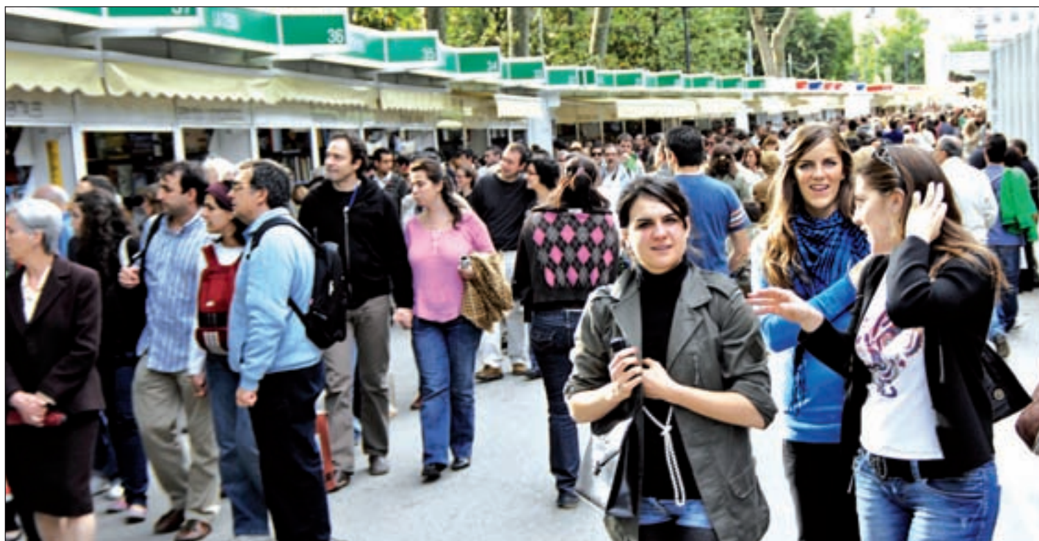
El Paseo de Coches de El Retiro volverá a reunir a miles de visitantes en busca de su libro preferido

Como no podía ser de otra manera, en el año en el que se conmemora el cuarto centenario de la muerte de Miguel de Cervantes, nuestro escritor más ilustre, la Feria del Libro de Madrid ha organizado actos, tanto fuera como