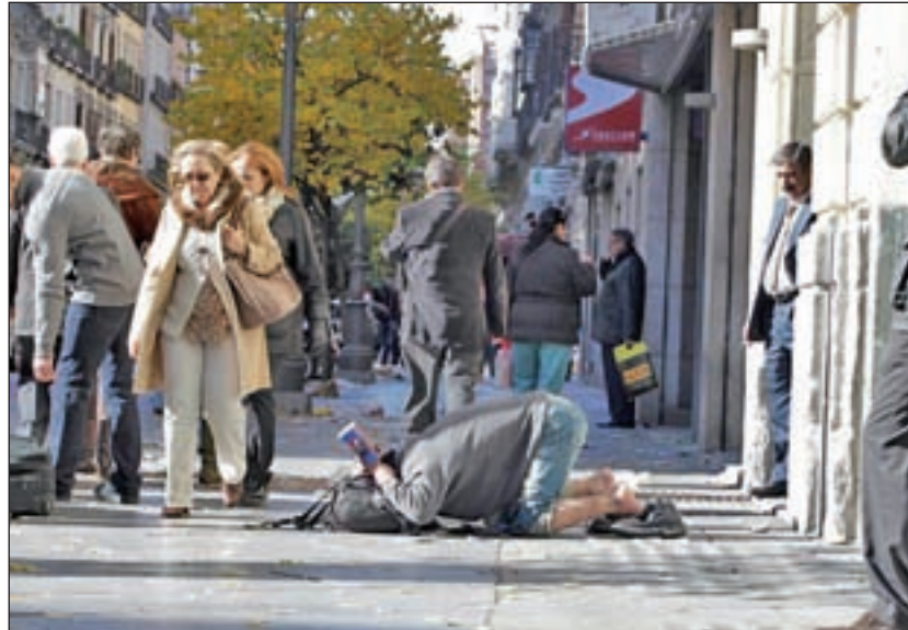
El riesgo de pobreza continúa superando el 20%

El riesgo de pobreza pasa del 22,2% al 22,1%; la carencia material severa del 7,1% al 6,4% y la baja intensidad en el empleo se reduce del 17,1% al 15,4%.