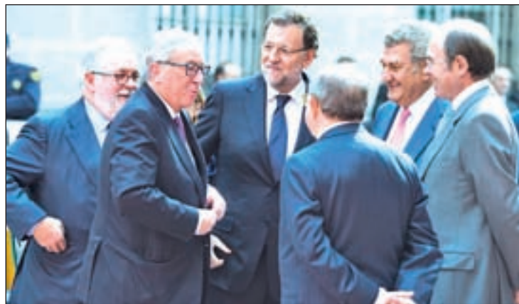
Mariano Rajoy junto a Jean Claude Juncker

Por su parte, el presidente de Ciudadanos, Albert Rivera, aseguró que Rajoy no puede comprometerse con Bruselas a hacer nuevos ajustes en la segunda mitad del año para poder rebajar el déficit, ya que ni siquiera sabe si seguirá