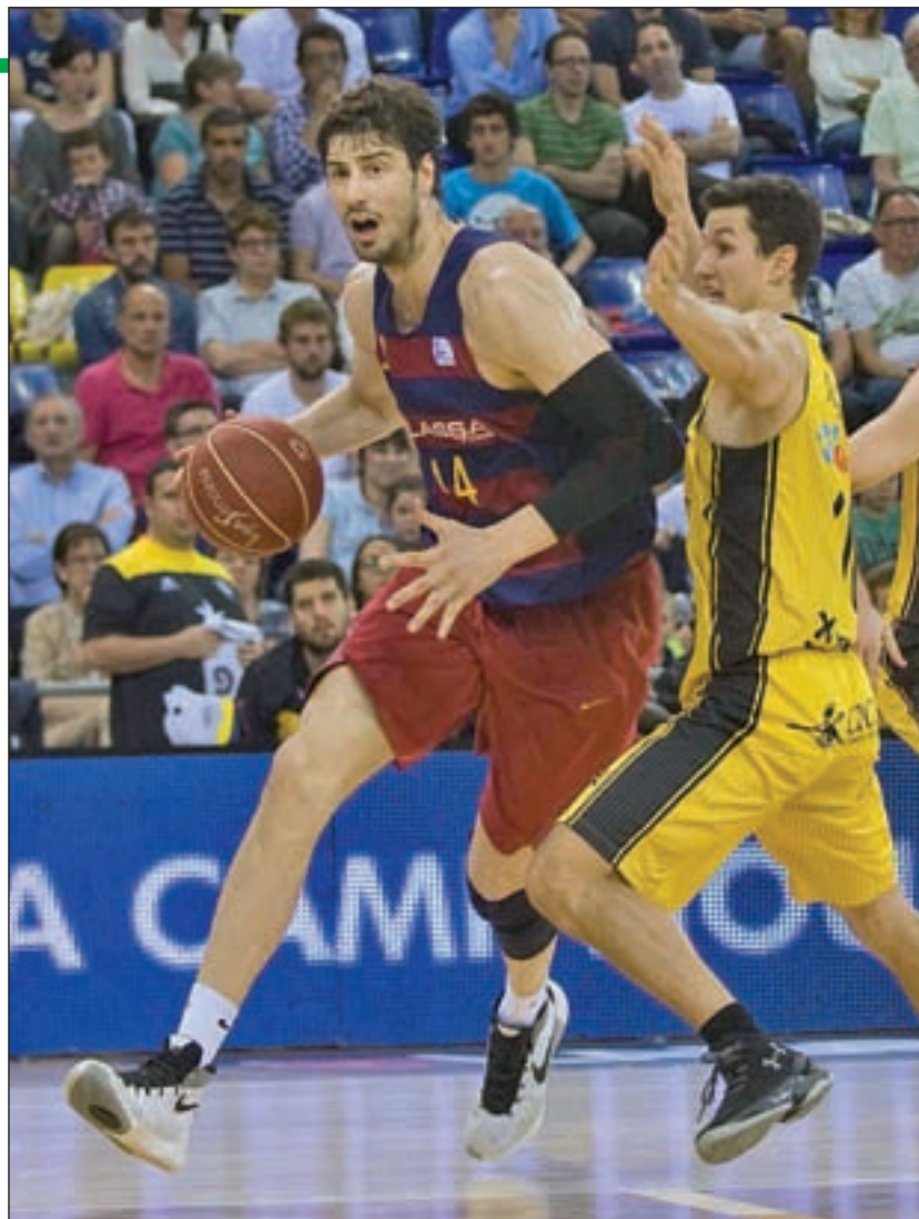
El Barcelona acabó la fase regular como líder

Precisamente el cuadro blanco jugará una de las series más parejas contra el UCAM Murcia. No en vano, pocos meses atrás ambos equipos tuvieron que disputar una prórroga en el Palacio de los Deportes de Murcia para decidir el ganador del encuentro.