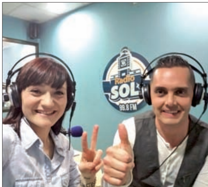
Un momento del programa 'Fiebre Amarilla'

De momento, el proyecto está sirviendo para dar a conocer otro punto de vista del Alcorcón como cuando explicaron cómo fue la charla de Anquela antes de salir para el Bernabéu la famosa noche en la que se consumó la proeza de eliminar al Real Madrid.