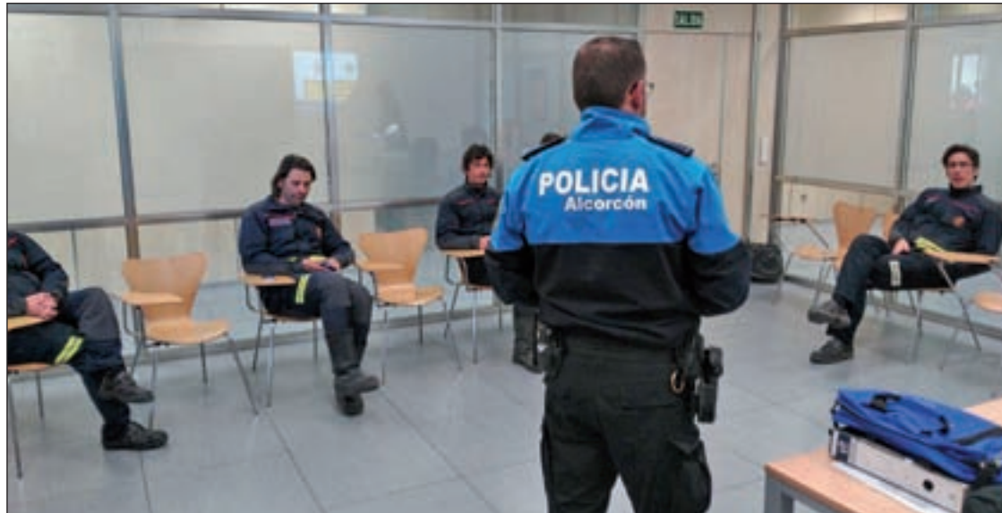
Bomberos de Alcorcón recibiendo la formación sobre el Pemualcor

También se integran en él los planes especiales de los que ya dispone el municipio, como son el de inclemencias invernales, incendios forestales o fiestas multitudinarias. Además, también se dará formación sobre los protocolos a empresas y vecinos, en especial a los niños. Hasta la fecha, 72 bomberos de la ciudad ya han sido instruidos.