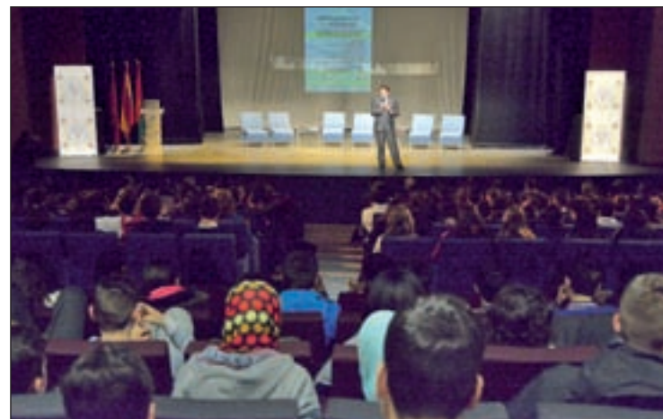
Un momento del evento

ENREDADOS POR LA SEGURIDAD BUSCA CONCIENCIAR