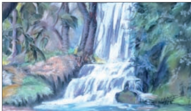
Una de las obras de 'Papelotes'

La elección del título de la exposición es "por la expresión de las estampas, en las que, con tema y técnicas diversas, destaca la sencillez y delicadeza en el tratamiento de las imágenes", según ha