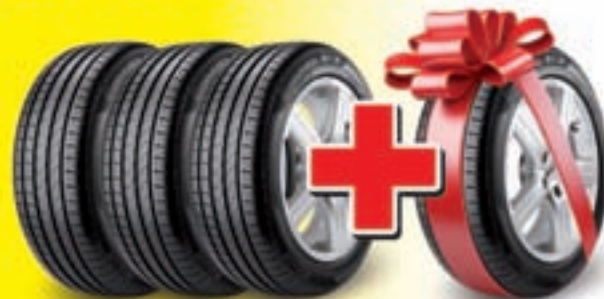
Imagen no vinculante. Promoción válida del 02/04/2016 al 31/05/2016. Consultar condiciones completas en www.euromaster-neumaticos.es