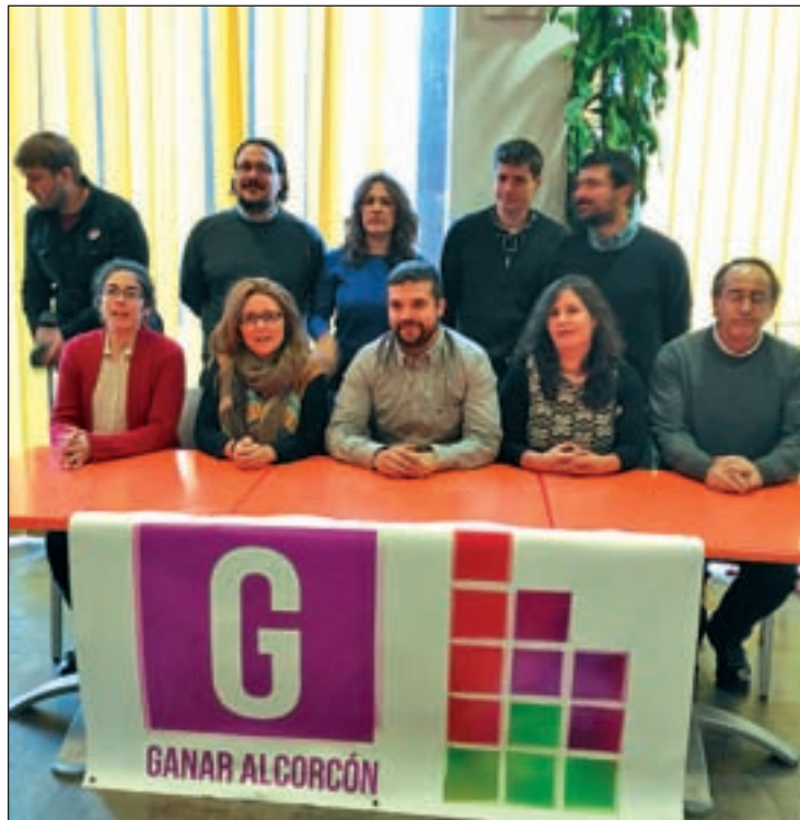
Ganar Alcorcón durante una rueda de prensa

El último ha sido entre la formación de unidad popular y Ciudadanos. Así, mientras que la primera no descarta la posibilidad de sacar adelante una moción de