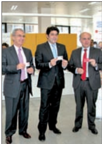
La oficina en su inauguración

El Gobierno municipal de Alcorcón apoyó esta iniciativa del Ejecutivo regional, realizándose las gestiones de documentación en las oficinas del propio Consistorio. Las cifras de implantación de esta tarifa plana supone un ahorro de en torno al 50% al mes a cada titular con respecto a los costes anteriores del Abono Joven, que crece hasta un ahorro de más de 40 euros mensuales en el tramo de los 23 a 26 años. Con la ventaja de que se amplía su radio de uso a todas las zonas del Consorcio de Transportes.