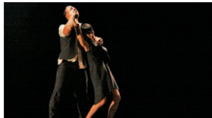
La peça es podrà veure fins el 9 de març.

Schubert, Chopin i Glazunov. ‘Anhelos y Tormentos’ arrenca musicalment de manera “dramàtica i culminant”, amb una selecció d’una de les peces de ‘Goyescas’ de Granados, concretament ‘El amor y la muerte’. A partir d’aquí, l’espectacle avança per una selecció valsos poètics.