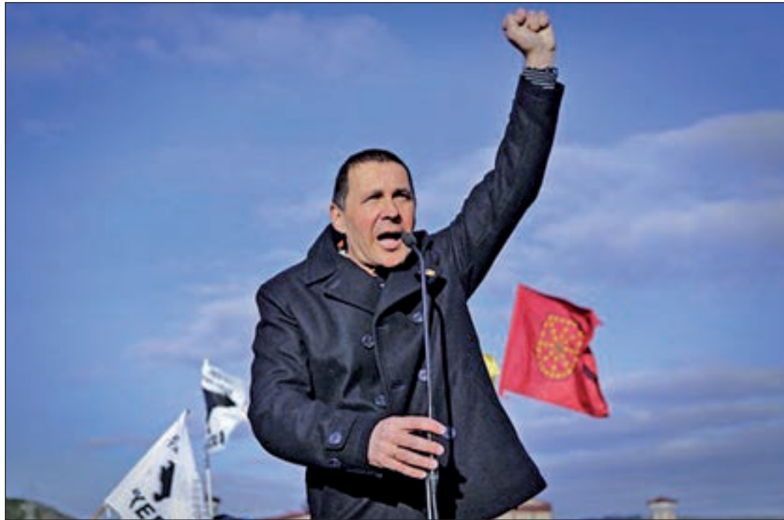
El antiguo portavoz de Batasuna, Arnaldo Otegi, a su salida de la prisión de Logroño

Arnaldo Otegi cumplía condena desde el año 2009 cuando fue detenido y enviado a prisión por orden del juez Baltasar Garzón por el caso 'Bateragune', acusado de intentar reconstruir Batasuna, el brazo político de ETA, que había sido ilegalizada por su colaboración con la banda terrorista. A su salida, Otegi quiso insistir en