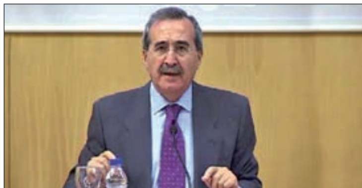
El ex ministro socialista, Virgilio Zapatero