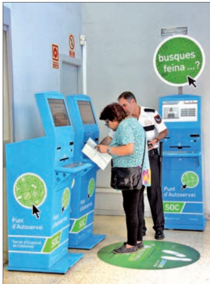
La principal preocupació dels barcelonins és l'atur.

Per al número dos del govern municipal, Gerardo Pisarello, amb les dades donades a conèixer aquest dijous s'ha fet palès que el turisme és "riquesa però també font de preocupació" per als ciutadans, especialment a les zones on