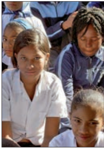
Niñas en la escuela