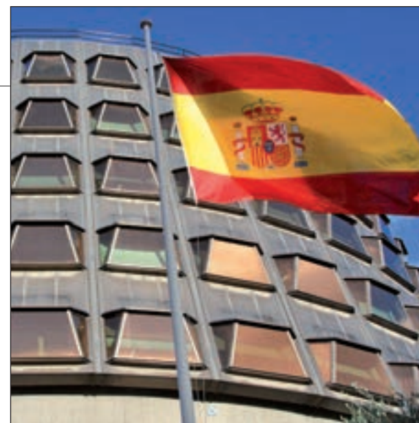
Ho fa gràcies a la reforma de la llei.

L'incident d'execució de sentència que l'Estat va presentar apel·lava precisament a l'article 92 de la Llei Orgànica del TC, precisament el que el govern espanyol va reformar. Al seu escrit, l'executiu espanyol argumentava que la decisió del Parlament de crear la comissió del Procés Constituent -que presideix Lluís Llach- va suposar ja un incompliment de la sentència del 2 de desembre del 2015 del mateix tribunal que va declarar nul·la la declaració del 9-N.