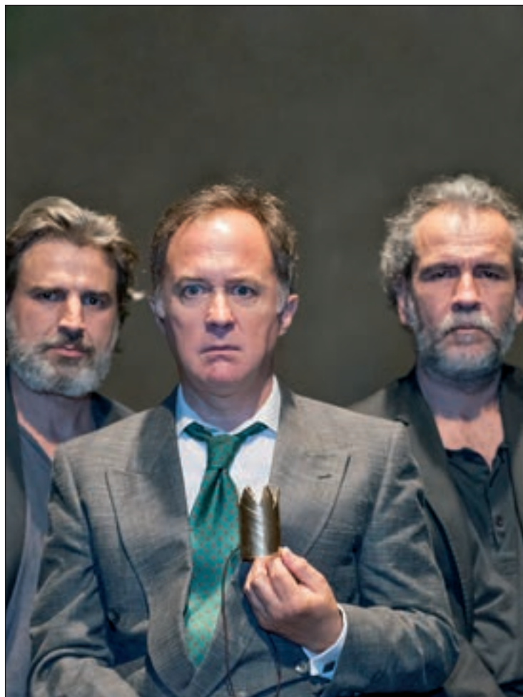
L’obra es representa fins al 20 de març. ACN

San Juan ha manifestat que van escollir la figura del Rei perquè els semblava “obligat tractar el tema de la monarquia per entendre la realitat política. És la màxima autoritat de l’Estat i màxima autoritat militar”. En aquest context, ha apuntat que quan va succeir el 15-M va sorgir