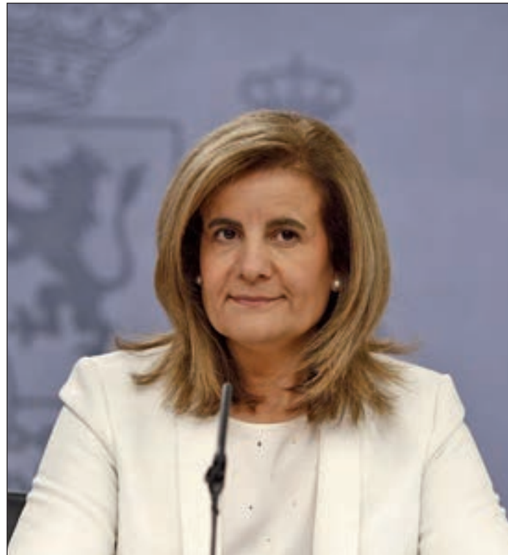
La ministra de Empleo, Fátima Báñez

Si lo dividimos por género, el desempleo entre los varones bajó en 200 personas frente a un aumento del paro femenino de 2.431 (+0,1%). Así, el total de mujeres en paro se situó al finalizar el mes pasado en 2.261.513 y el de varones, en 1.891.473.