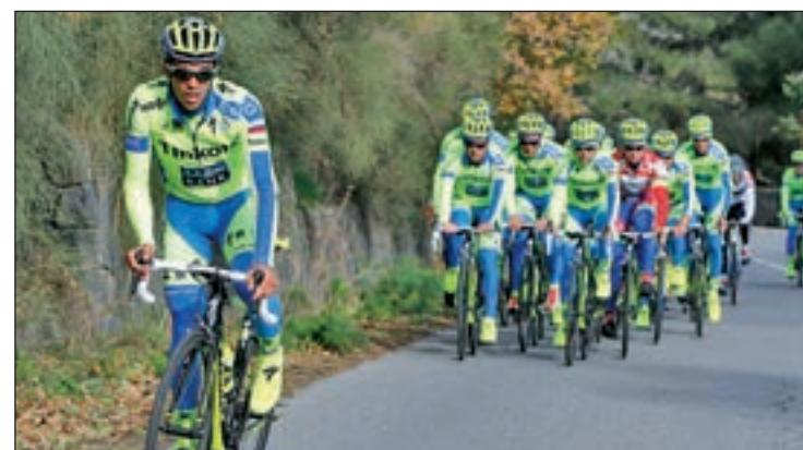
El madrileño llega a la París-Niza con ánimos renovados