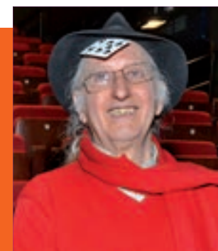
iGente TIEMPO LIBRE Pág. 12

El desempleo y el mercado laboral dificulta que los menores de 30 años se emancipen.