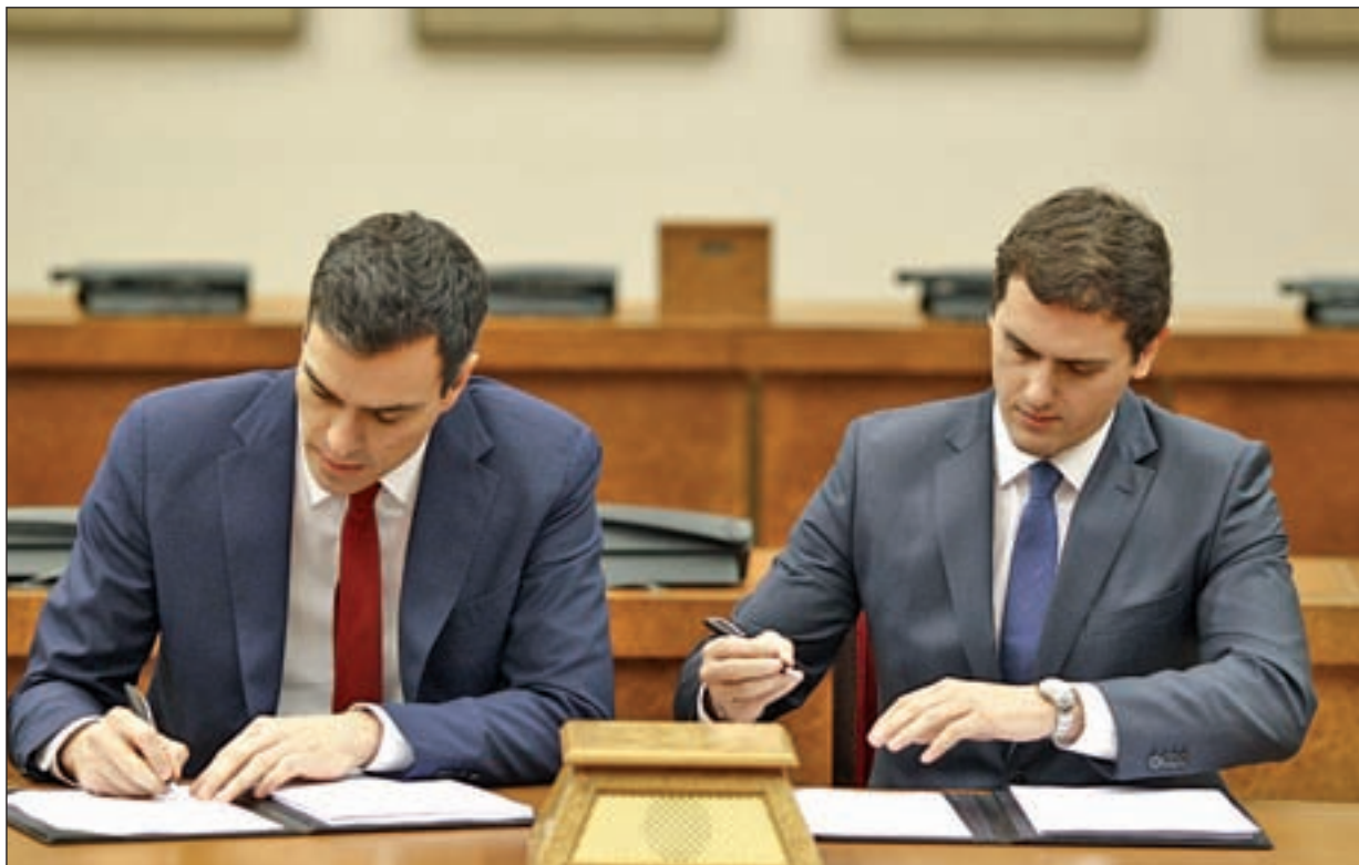
Pedro Sánchez y Albert Rivera firmaron el acuerdo el pasado miércoles