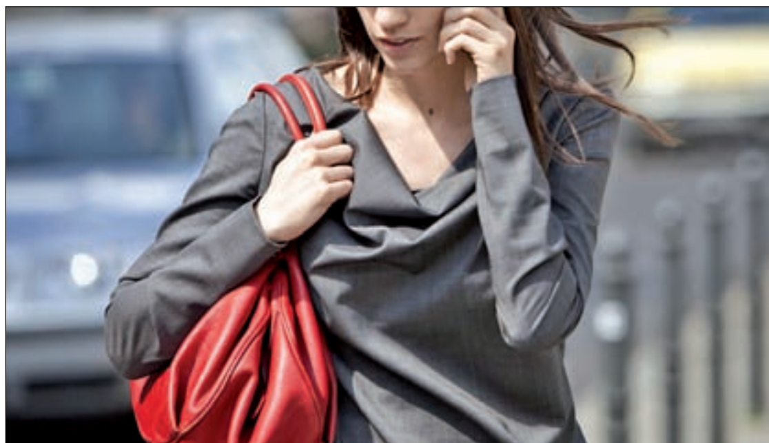
Las llamadas se hacen al azar y normalmente en horario de tarde

Según el Ministerio del Interior, "los detenidos tenían la decidida voluntad y la plena disposición de realizar acciones terroristas en territorio español" y para ello "habían gestionado una serie de contactos en su entorno que le hacían viable la adquisición de armas y sustancias susceptibles de ser empleadas para la fabricación de explosivos".