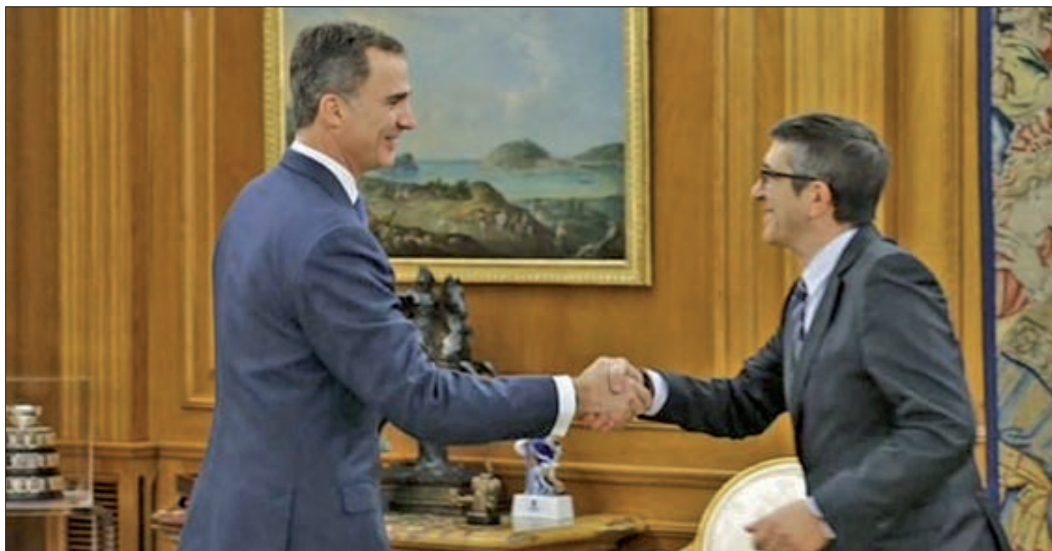
El Rey Felipe VI junto al presidente del Congreso de los Diputados, el socialista Patxi López