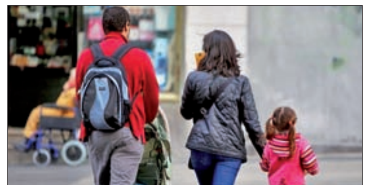
España es uno de los países donde es más difícil la conciliación

En el caso concreto de España, se sitúa en el puesto 22 de la UE y en el 126 de la clasificación mundial, por lo que el informe de la Fundación Heritage señala que “las leyes laborales siguen siendo inflexibles” en el país.