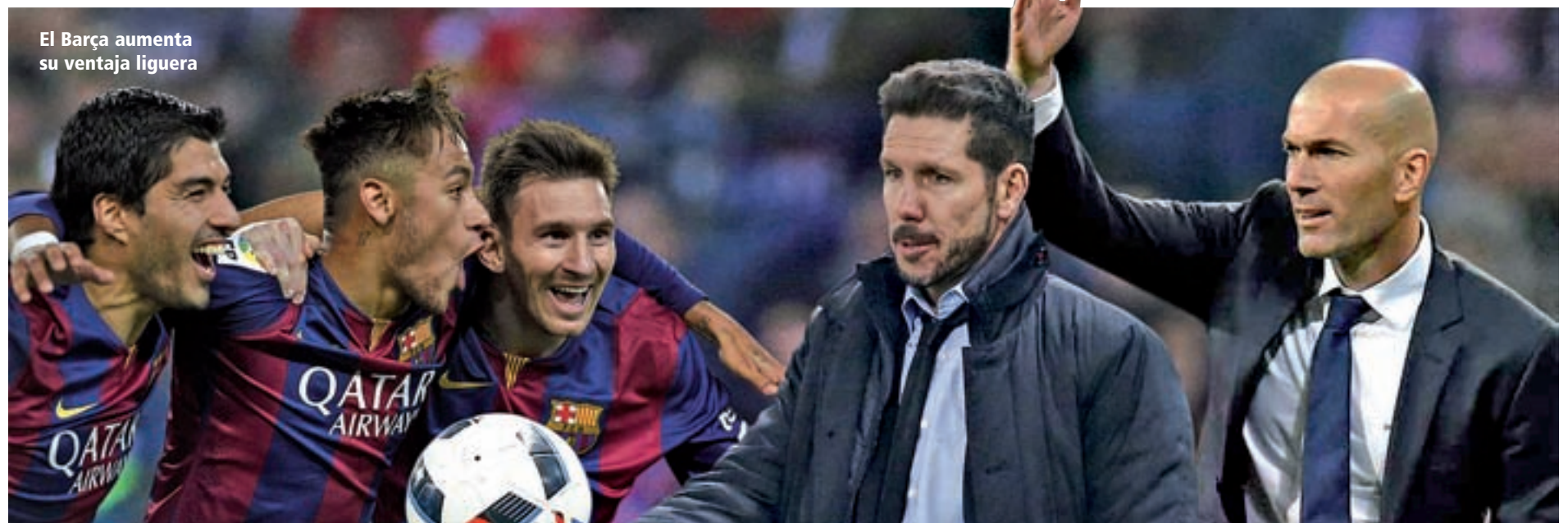
El Barça aumenta su ventaja liguera