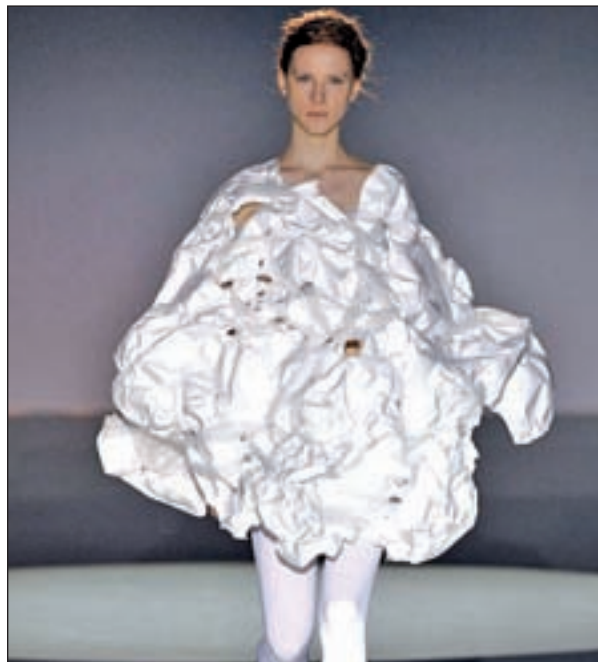
Diseño de Ela Fidalgo

Mikel Colás fue otro de los diseñadores que hizo lo propio mostrando unas prendas de cor-