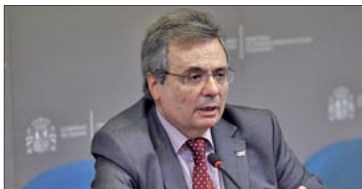
Rafael Matesanz, director de la OIT

mentos de angustia, 100.000 momentos de alegría y 100.000 nuevas oportunidades”. “No será necesario esperar otros 50 años”, señala Matesanz, en referencia al tiempo transcurrido desde el primer trasplante realizado con éxito y cuyo aniversario se celebraba el pasado año. “Al ritmo que vamos,