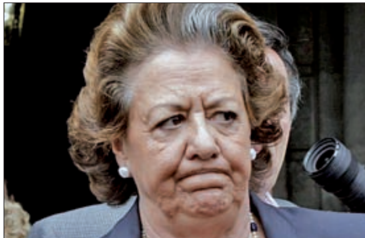
Rita Barberá atiende a los medios de comunicación

El presidente ha negado que su inclusión en la Diputación Permanente suponga un "trato de favor", ya que, según ha dicho, estaba aforada por ser senadora por designación autonómica, lo que supone que no perdería su escaño en caso de elecciones.